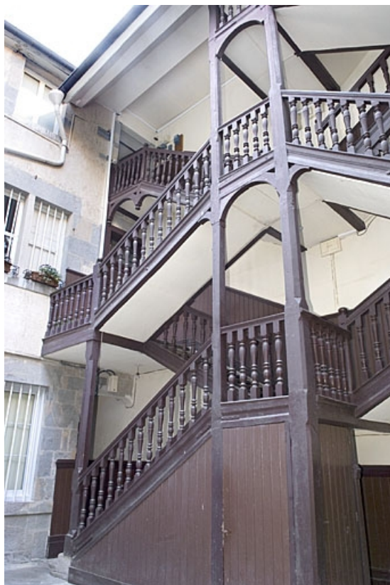
Vue d'ensemble de l'escalier à cage ouverte trois quarts droit.

25, Besançon, 16 rue Ronchaux, lieudit : îlot Granvelle