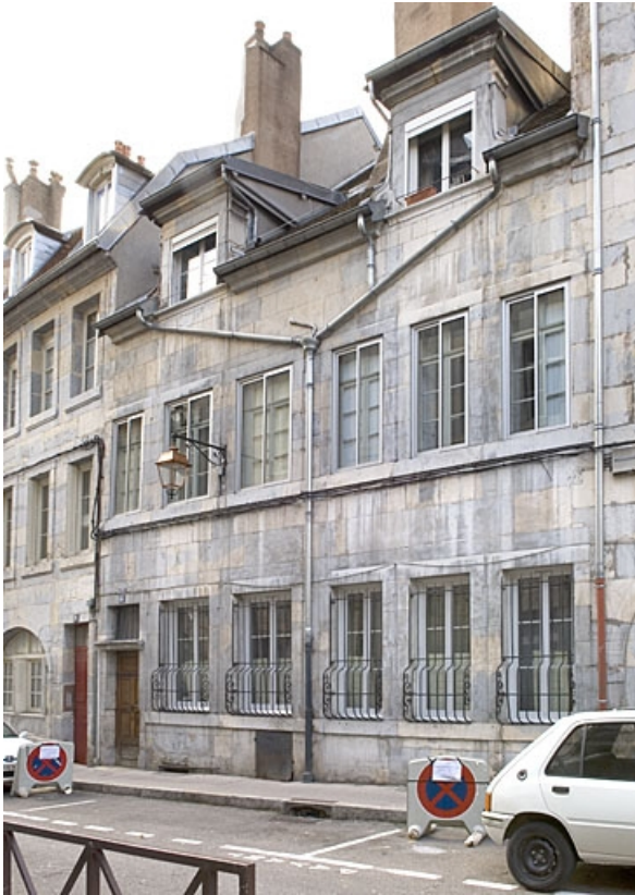
Vue d'ensemble de la façade sur rue.

25, Besançon, 16 rue Ronchaux, lieudit : îlot Granvelle