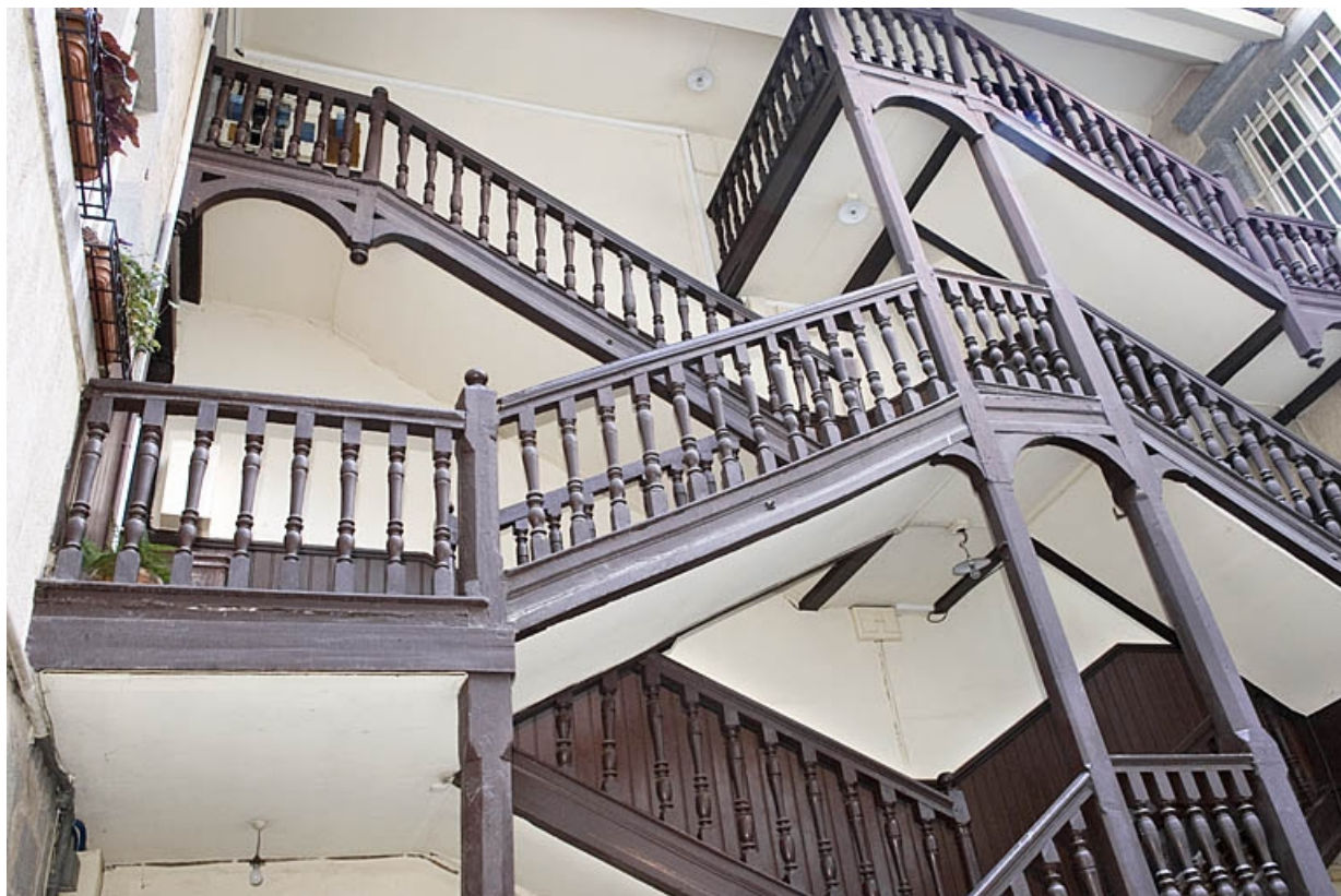
Vue de la partie supérieure de l'escalier à cage ouverte. 25, Besançon, 16 rue Ronchoux, lieudit : îlot Granvelle