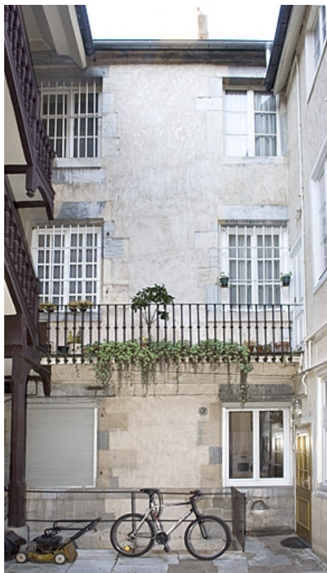
Vue d'ensemble de la façade antérieure du logis secondaire.

25, Besançon, 16 rue Ronchaux, lieudit : îlot Granvelle