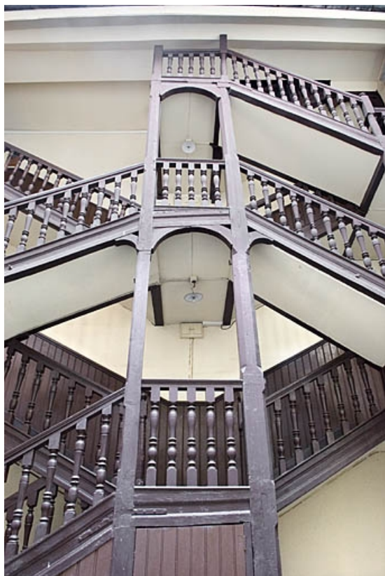
Vue d'ensemble de l'escalier à cage ouverte de face. 25, Besançon, 16 rue Ronchaux, lieudit : îlot Granvelle