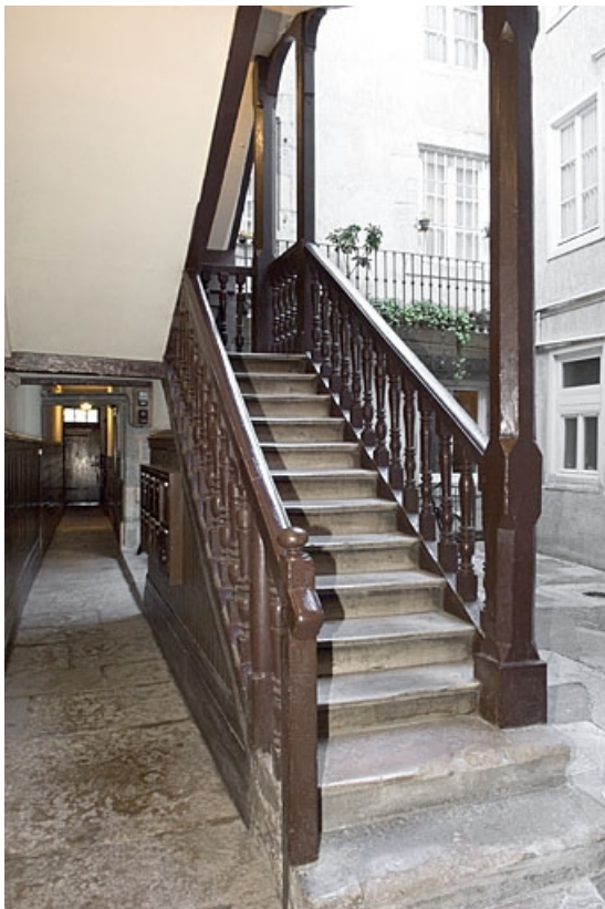
Vue du départ de l'escalier à cage ouverte depuis le couloir.

25, Besançon, 16 rue Ronchaux, lieudit : îlot Granvelle