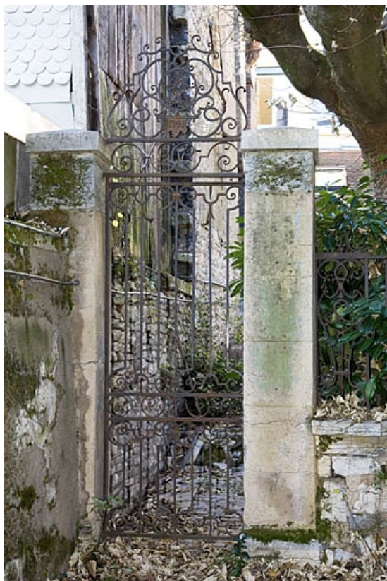
Vue d'ensemble de porte en fer forgé conduisant au jardin.

25, Besançon, 16 rue Ronchaux, lieudit : îlot Granvelle