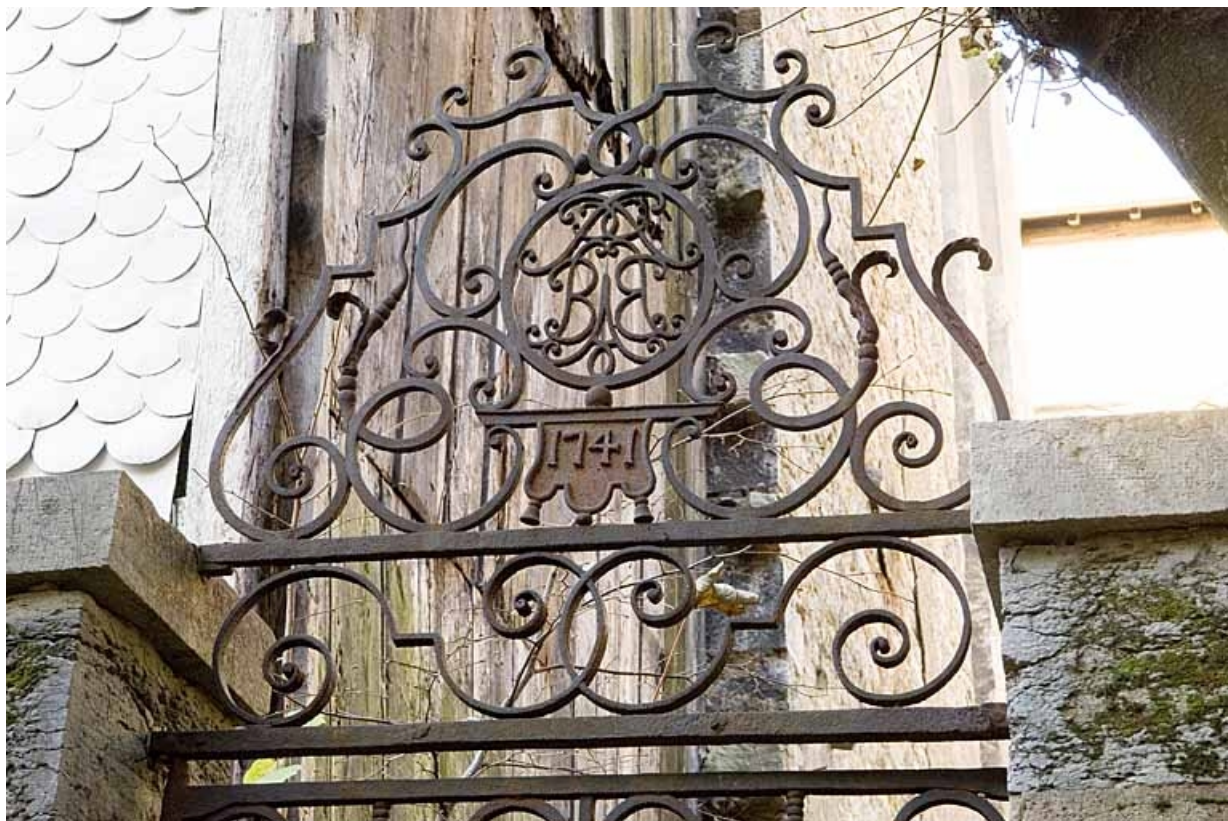
Détail de la partie supérieure de la porte en fer forgé conduisant au jardin. 25, Besançon, 16 rue Ronchaux, lieudit : ilot Granvelle