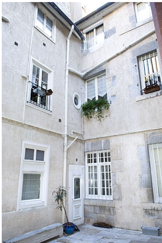
Vue d'ensemble de la façade postérieure du logis principal et de l'aile sur cour. 25, Besançon, 16 rue Ronchaux, lieudit : îlot Granvelle