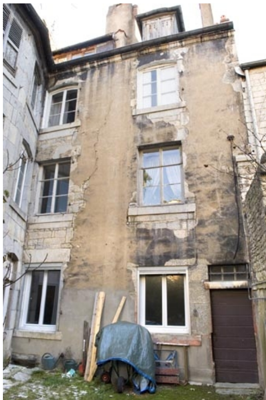
Vue d'ensemble de la façade postérieure du logis secondaire.

25, Besançon, 16 rue Ronchaux, lieudit : îlot Granvelle