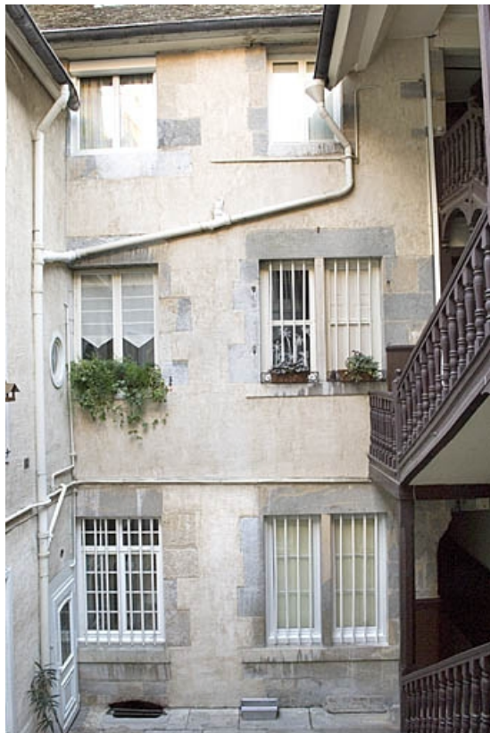
Vue d'ensemble de la façade sur cour du logis principal.

25, Besançon, 16 rue Ronchaux, lieudit : îlot Granvelle