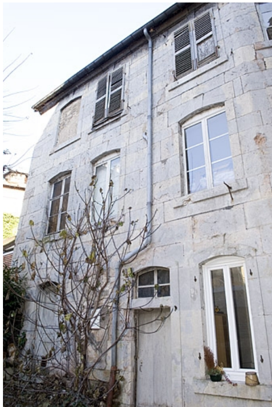
Vue d'ensemble de l'aile du logis secondaire dans la deuxième cour.

25, Besançon, 16 rue Ronchaux, lieudit : îlot Granvelle