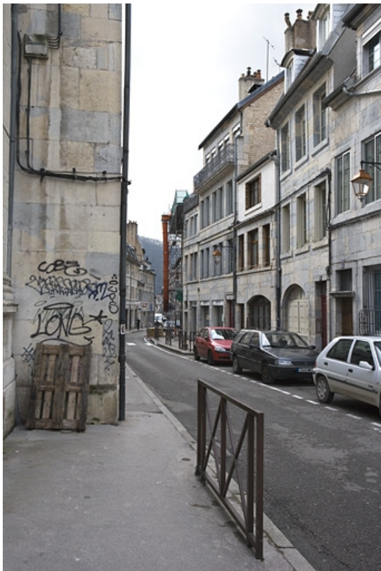
Vue d'ensemble de la façade principale dans l'alignement de la rue.

25, Besançon, 22 rue Ronchaux, lieudit : îlot Granvelle