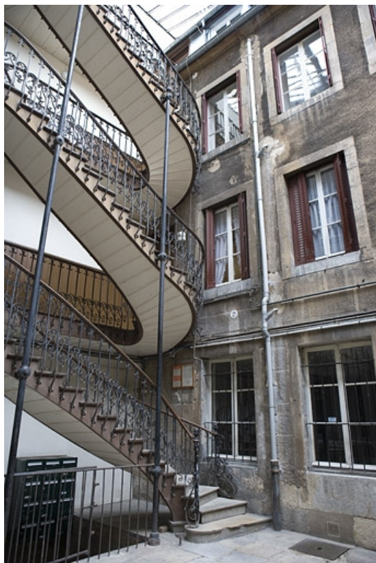
Détail de l'escalier à cage ouverte et de la façade antérieure du premier logis secondaire.

25, Besançon, 22 rue Ronchaux, lieudit : îlot Granvelle