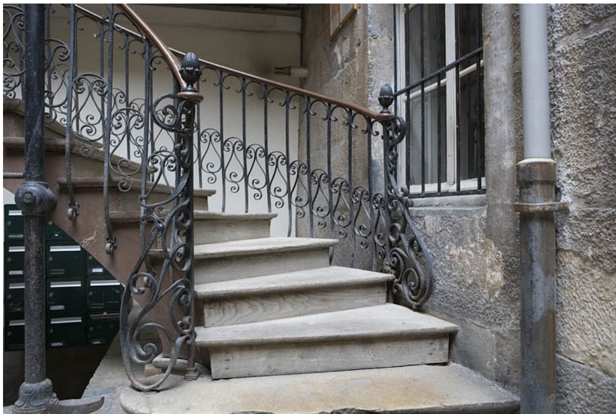
Détail du départ de l'escalier à cage ouverte, vue horizontale.

25, Besançon, 22 rue Ronchoux, lieudit : îlot Granvelle