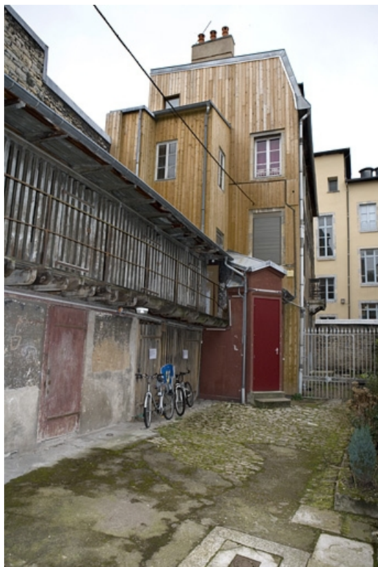
Vue d'ensemble des bûchers et du second logis secondaire situés dans la deuxième cour.

25, Besançon, 22 rue Ronchaux, lieudit : îlot Granvelle