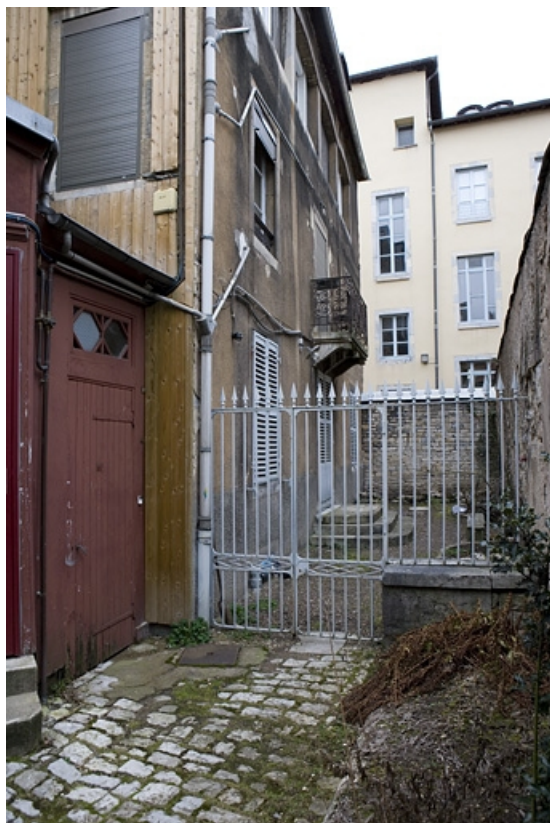
Vue d'ensemble de la façade antérieure du deuxième logis secondaire située dans la troisième cour. 25, Besançon, 22 rue Ronchaux, lieudit : îlot Granvelle