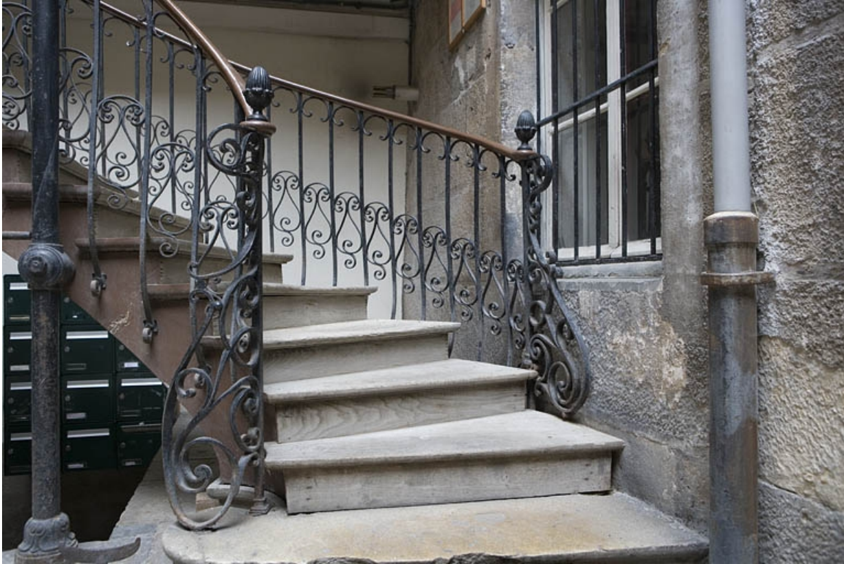
Détail du départ de l'escalier à cage ouverte, vue horizontale.

25, Besançon, 22 rue Ronchaux, lieudit : îlot Granvelle