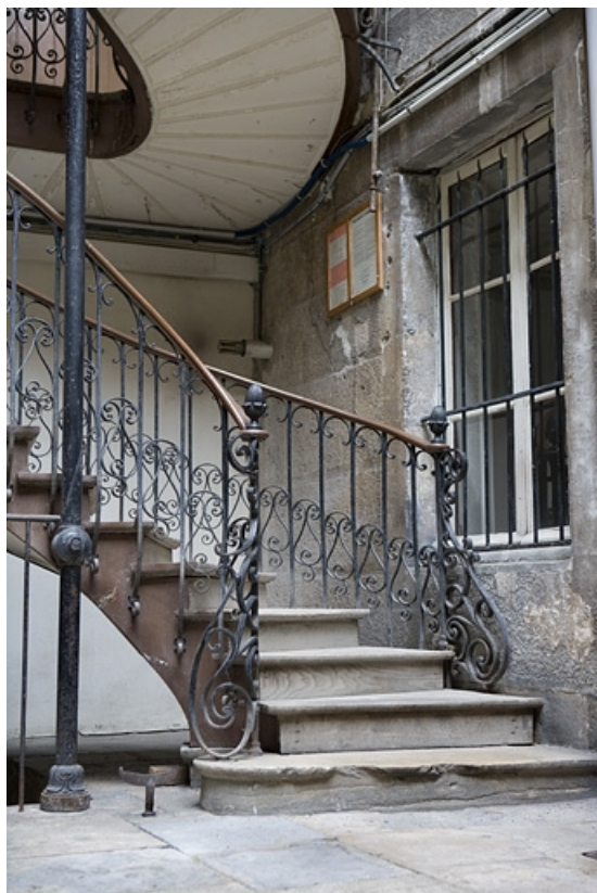
Détail du départ de l'escalier à cage ouverte, vue verticale.

25, Besançon, 22 rue Ronchaux, lieudit : îlot Granvelle