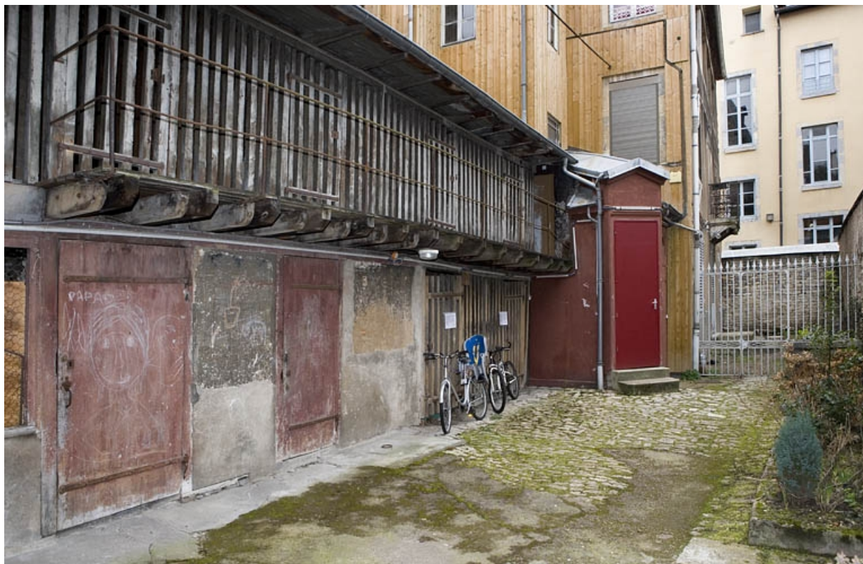
Vue d'ensemble des bûchers situés dans la deuxième cour.

25, Besançon, 22 rue Ronchoux, lieudit : îlot Granvelle