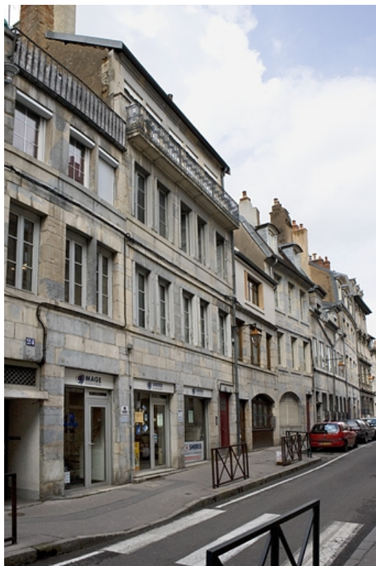
Vue d'ensemble rapprochée de la façade principale dans l'alignement de la rue.

25, Besançon, 22 rue Ronchoux, lieudit : îlot Granvelle