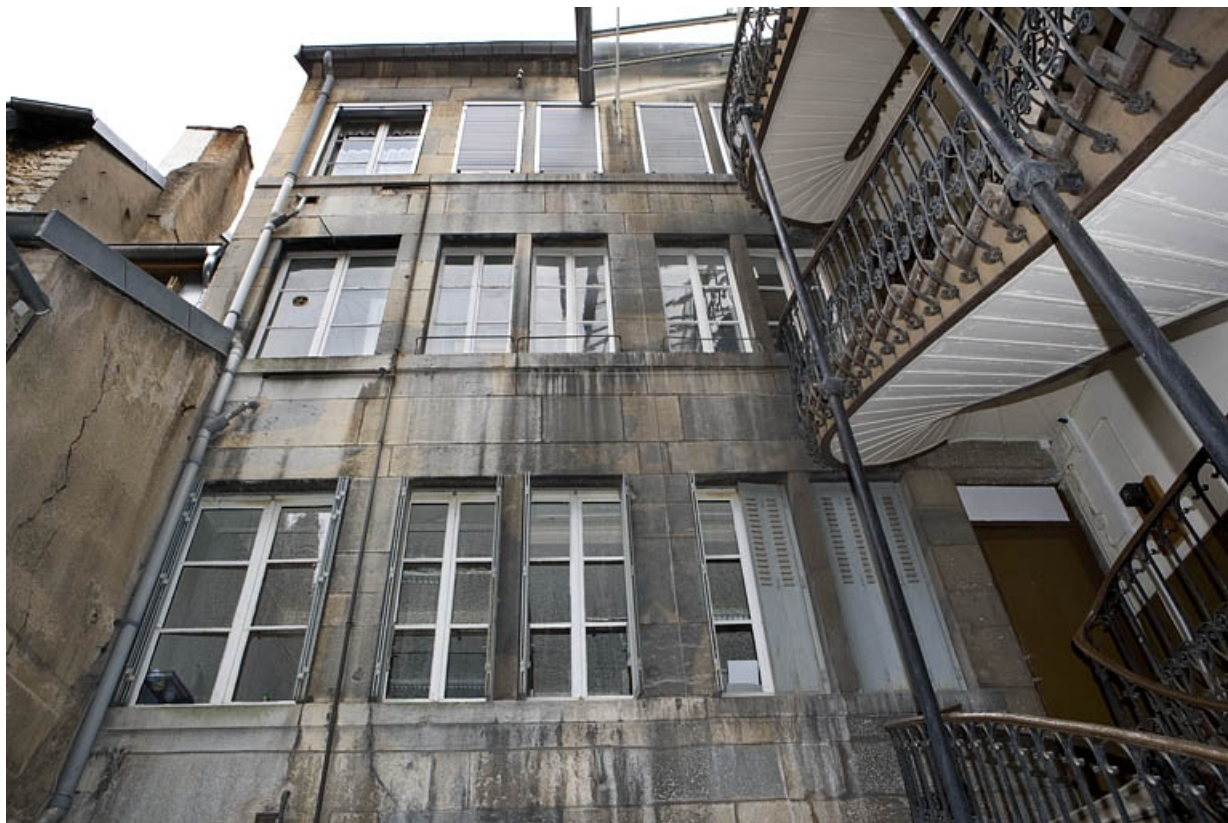
Détail de la façade postérieure du logis principal.

25, Besançon, 22 rue Ronchaux, lieudit : îlot Granvelle