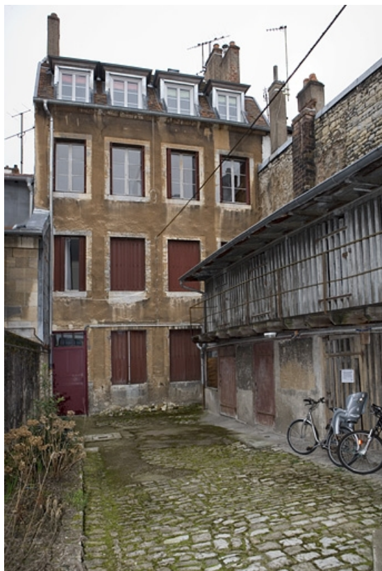
Vue d'ensemble de la façade postérieure du premier logis secondaire et des bûchers situés dans la deuxième cour. 25, Besançon, 22 rue Ronchaux, lieudit : îlot Granvelle