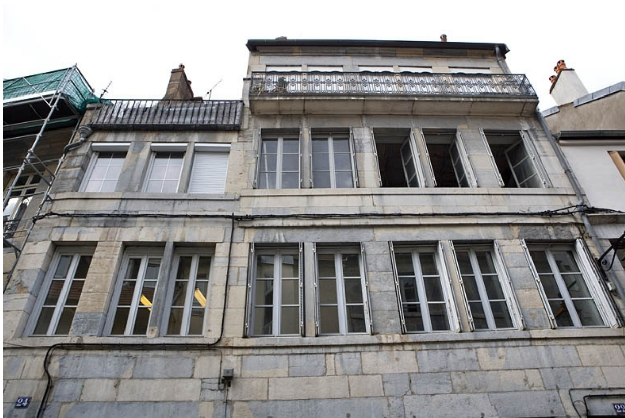
Détail des derniers étages de la façade principale, de face.

25, Besançon, 22 rue Ronchaux, lieudit : îlot Granvelle