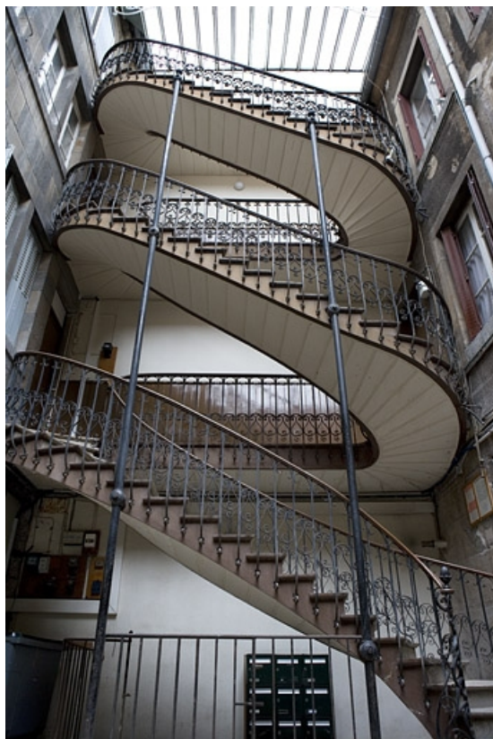
Vue d'ensemble de l'escalier à cage ouverte, de face.

25, Besançon, 22 rue Ronchaux, lieudit : îlot Granvelle