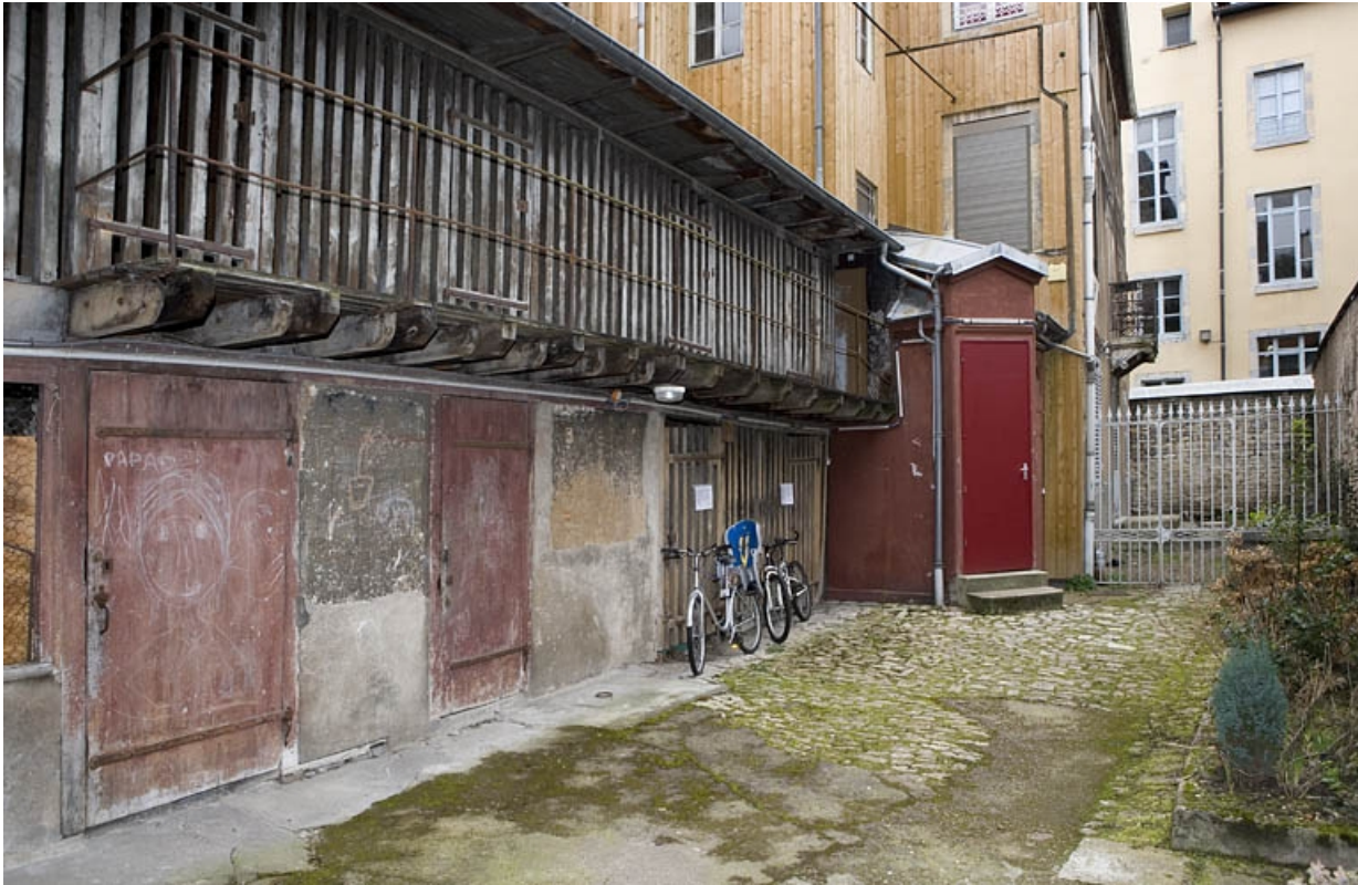
Vue d'ensemble des bûchers situés dans la deuxième cour. 25, Besançon, 22 rue Ronchaux, lieudit : îlot Granvelle