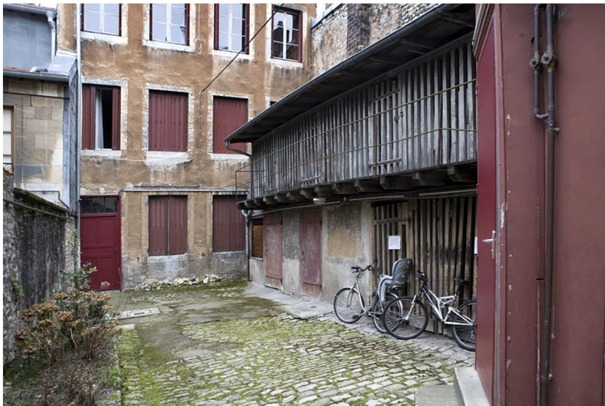
Détail du rez-de-chaussée de la façade postérieure du premier logis secondaire et des bûchers situés dans la deuxième cour. 25, Besançon, 22 rue Ronchoux, lieudit : îlot Granvelle