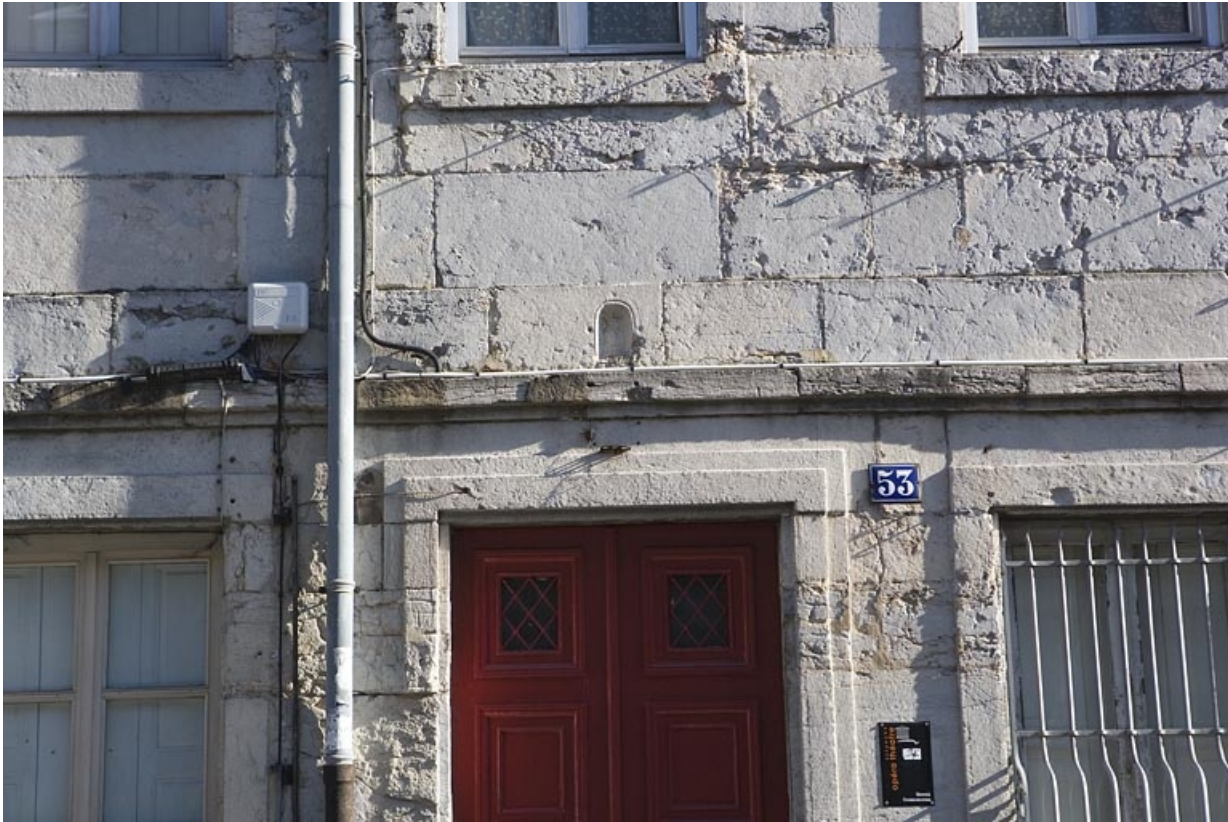
Détail de la niche au-dessus de la porte d'entrée.

25, Besançon, 53 rue Mégevand, lieudit : îlot Granvelle