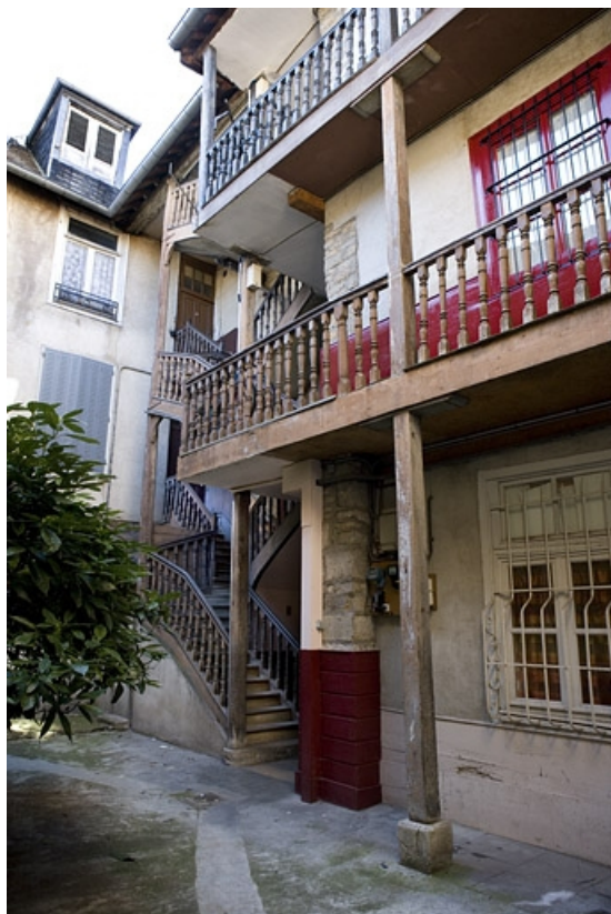
Vue d'ensemble de l'escalier à cage ouverte et des coursières depuis la cour. 25, Besançon, 53 rue Mégevand, lieudit : îlot Granvelle