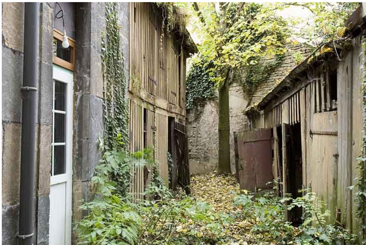
Vue d'ensemble de la deuxième cour depuis l'entrée.

25, Besançon, 14 rue Ronchaux, lieudit : îlot Granvelle