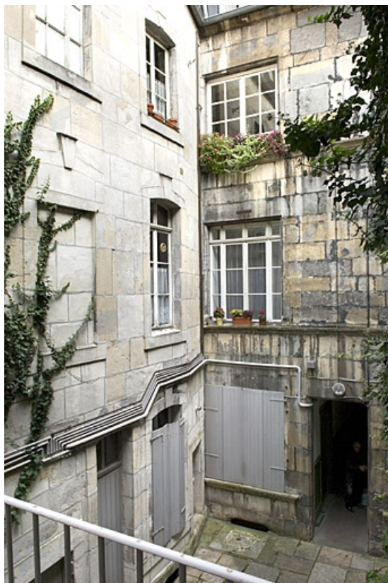
Façades sur cour depuis l'escalier à cage ouverte. 25, Besançon, 14 rue Ronchaux, lieudit : îlot Granvelle