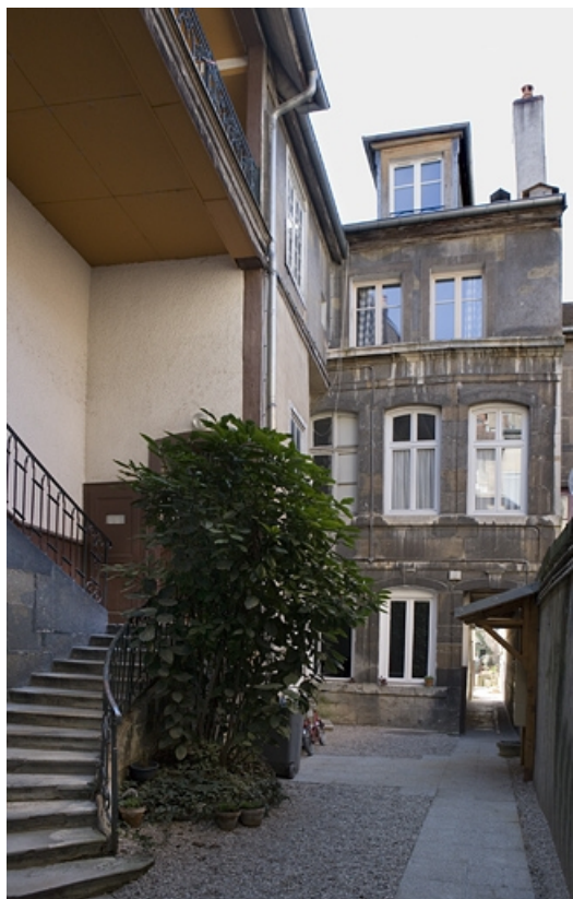
Vue d'ensemble de la façade antérieure du logis secondaire.

25, Besançon Grande Rue 114, lieudit : îlot Granvelle