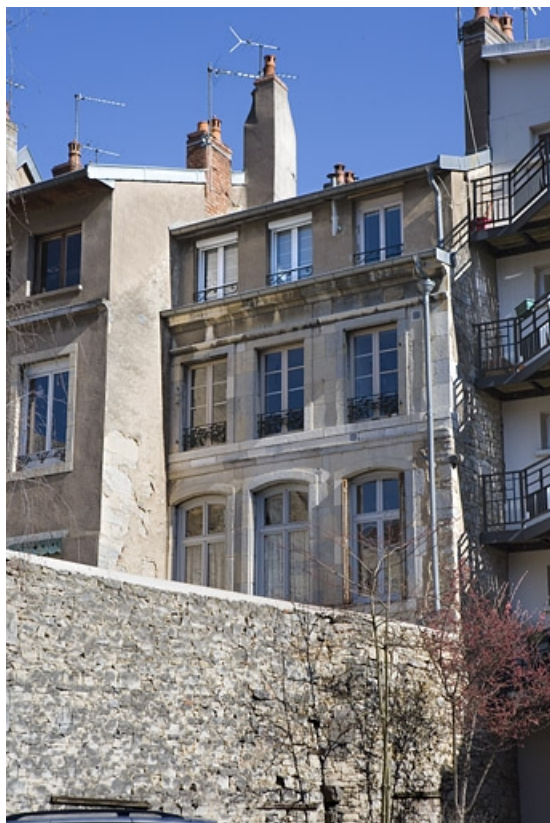
Vue de la façade postérieure du logis secondaire depuis la parcelle voisine. 25, Besançon Grande Rue 114, lieudit : îlot Granvelle