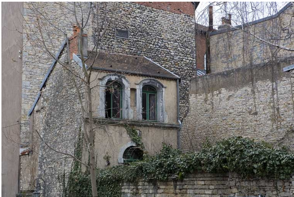
Fabrique de jardin : détail du premier étage depuis la parcelle voisine.

25, Besançon Grande Rue 114, lieudit : îlot Granvelle