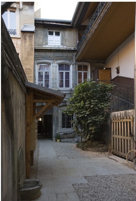
Vue d'ensemble de la façade postérieure du logis principal.

25, Besançon Grande Rue 114, lieudit : îlot Granvelle