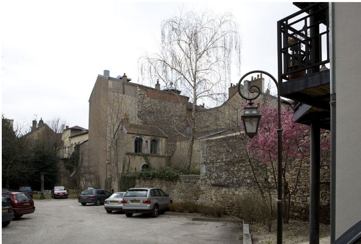
Vue d'ensemble de la fabrique de jardin depuis la parcelle voisine.

25, Besançon Grande Rue 114, lieudit : îlot Granvelle