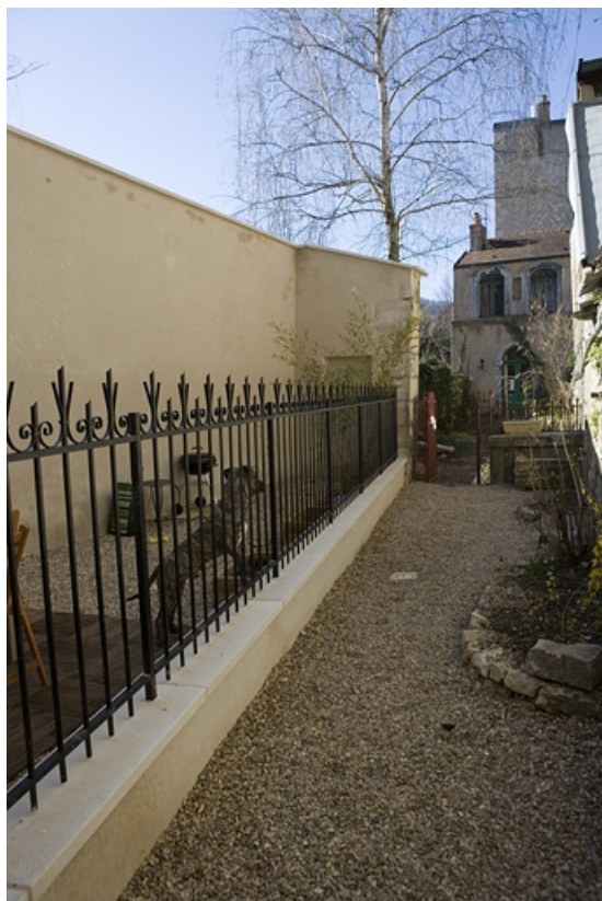
Vue de la fabrique de jardin au fond de la parcelle avec, à gauche, l'emplacement de l'ancien bûcher. 25, Besançon Grande Rue 114, lieudit : îlot Granvelle