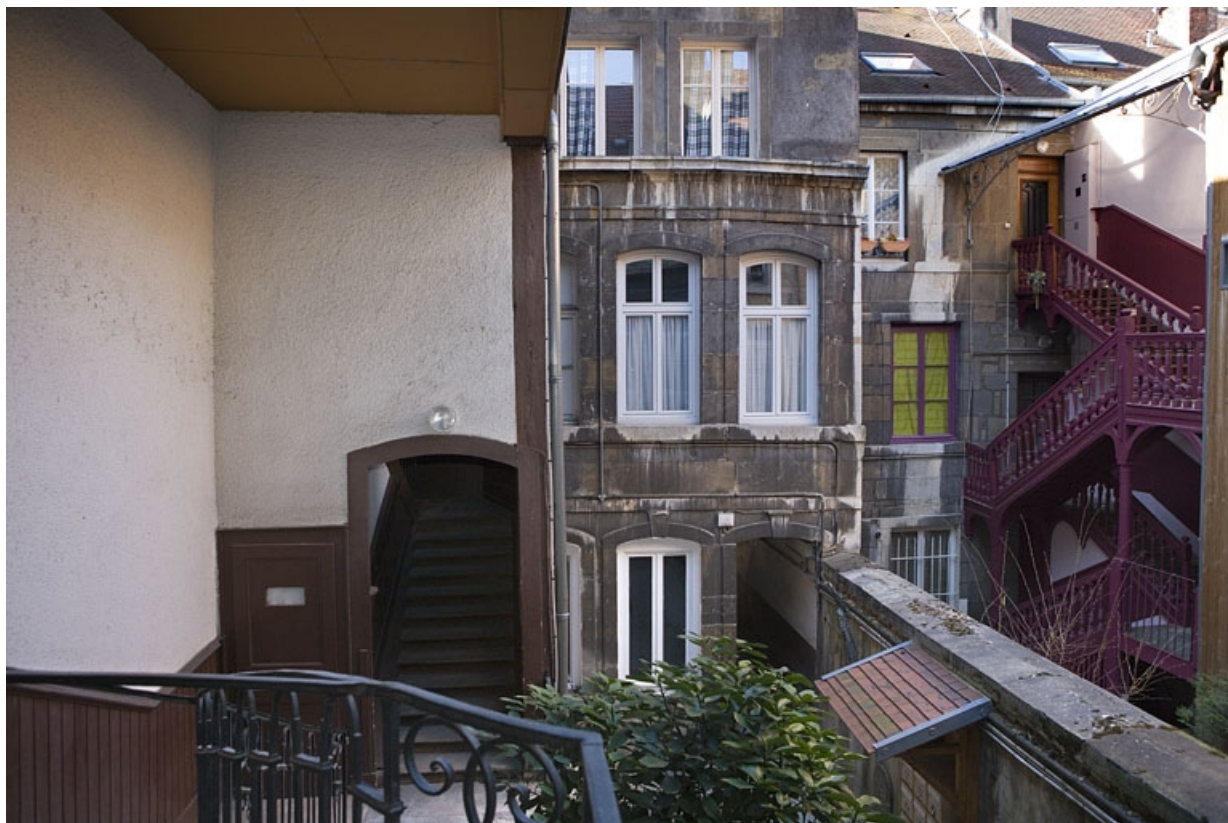
Vue de la façade antérieure du logis secondaire depuis l'escalier à cage ouverte.

25, Besançon Grande Rue 114, lieudit : îlot Granvelle