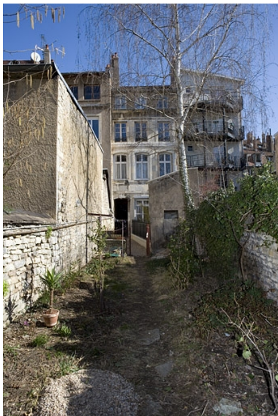
Vue de la façade postérieure du logis secondaire depuis le fond de la parcelle. 25, Besançon Grande Rue 114, lieudit : îlot Granvelle