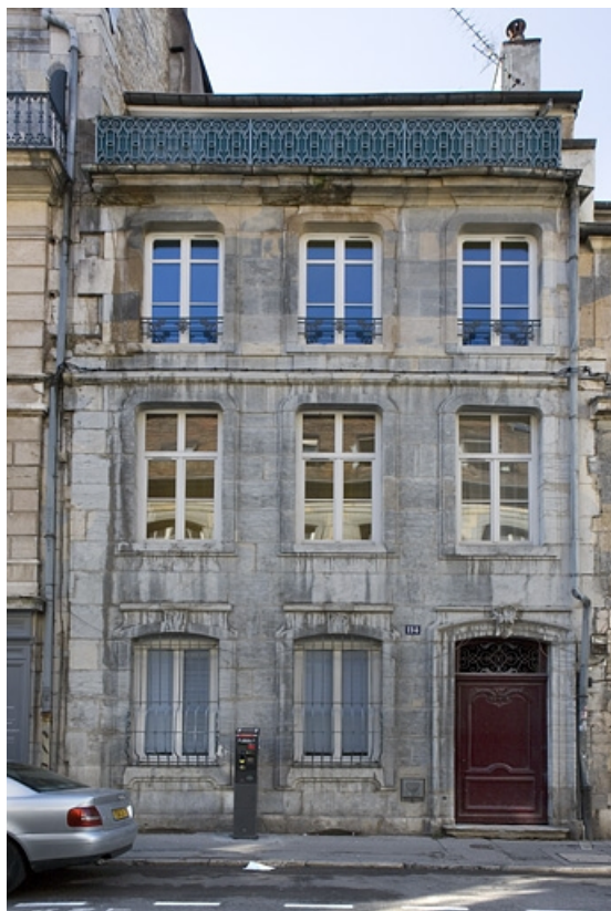
Vue d'ensemble de la façade antérieure du logis principal.

25, Besançon Grande Rue 114, lieudit : îlot Granvelle