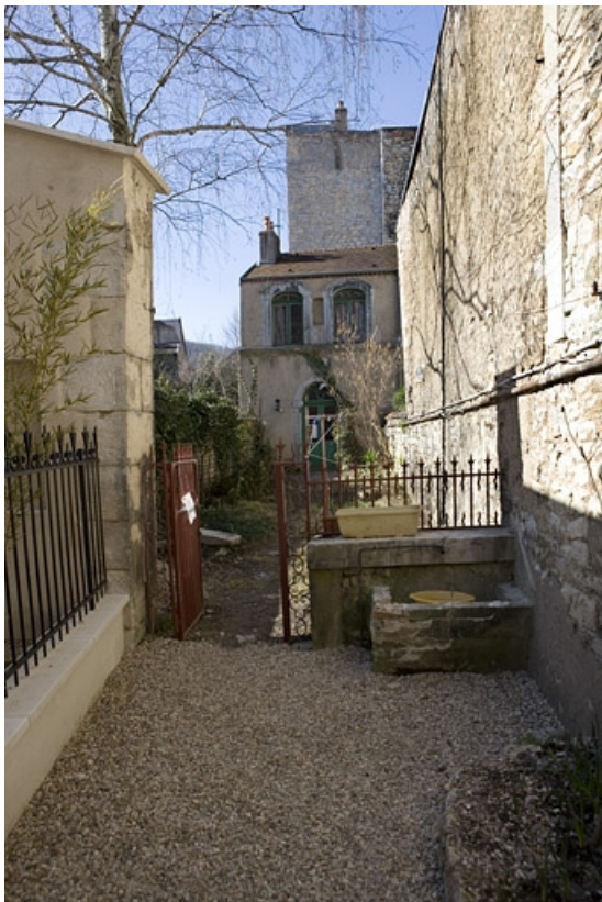
Vue de la fabrique de jardin au fond de la parcelle depuis la deuxième cour.

25, Besançon Grande Rue 114, lieudit : îlot Granvelle