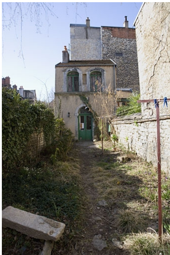
Vue d'ensemble de la fabrique de jardin au fond de la parcelle.

25, Besançon Grande Rue 114, lieudit : îlot Granvelle