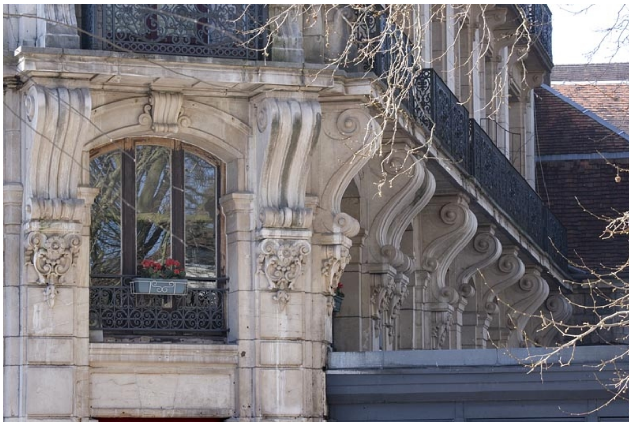
Détail des consoles soutenant le balcon filant. 25, Besançon, 2 rue Lacoré, lieudit : îlot Granvelle