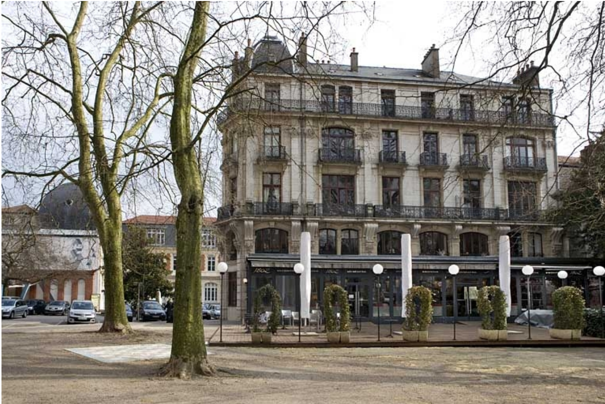
Vue d'ensemble de la façade sur la place Granvelle.

25, Besançon, 2 rue Lacoré, lieudit : îlot Granvelle