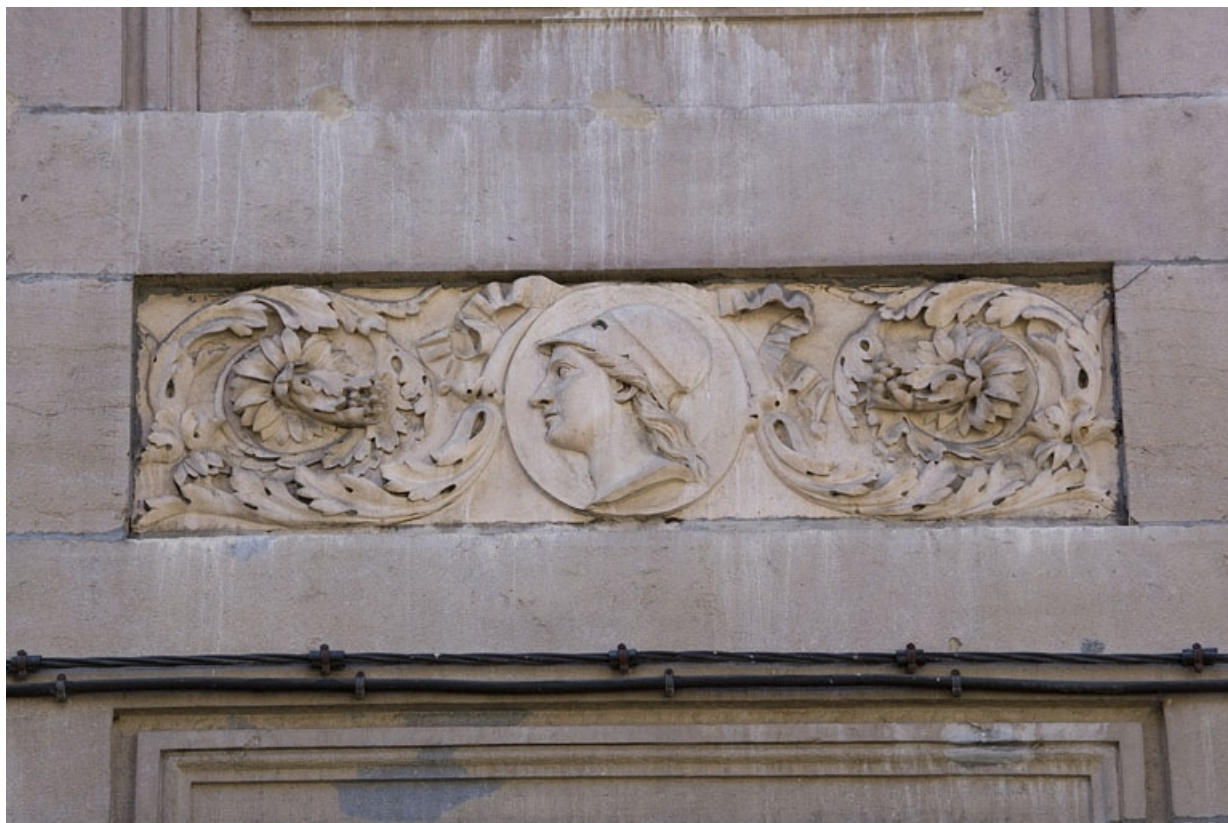
Détail du décor d'une table rentrante entre le premier et le deuxième étage : tête encadrée de feuillages.

25, Besançon Grande Rue 122, lieudit : îlot Granvelle