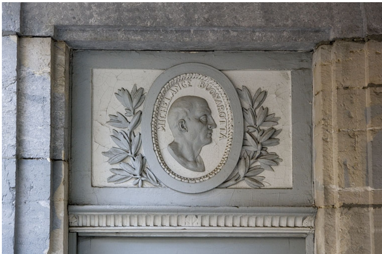
Détail d'un portrait en médaillon représentant Michel-Ange au-dessus d'une porte du premier étage.

25, Besançon Grande Rue 122, lieudit : îlot Granvelle