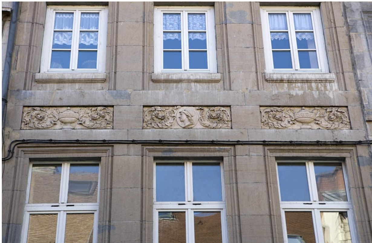
Détail du décor des tables rentrantes entre le premier et le deuxième étage.

25, Besançon Grande Rue 122, lieudit : îlot Granvelle