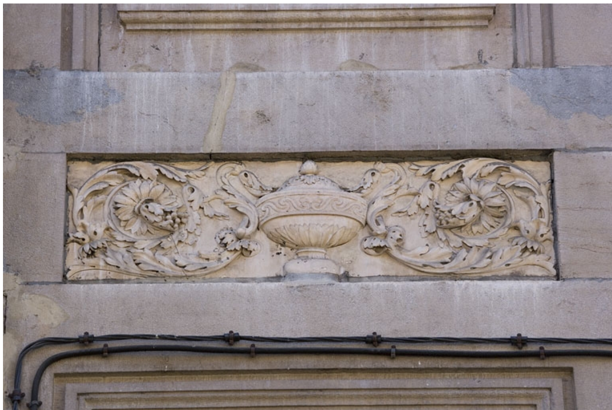
Détail du décor d'une table rentrante entre le premier et le deuxième étage : urne encadrée de feuillages.

25, Besançon Grande Rue 122, lieudit : îlot Granvelle