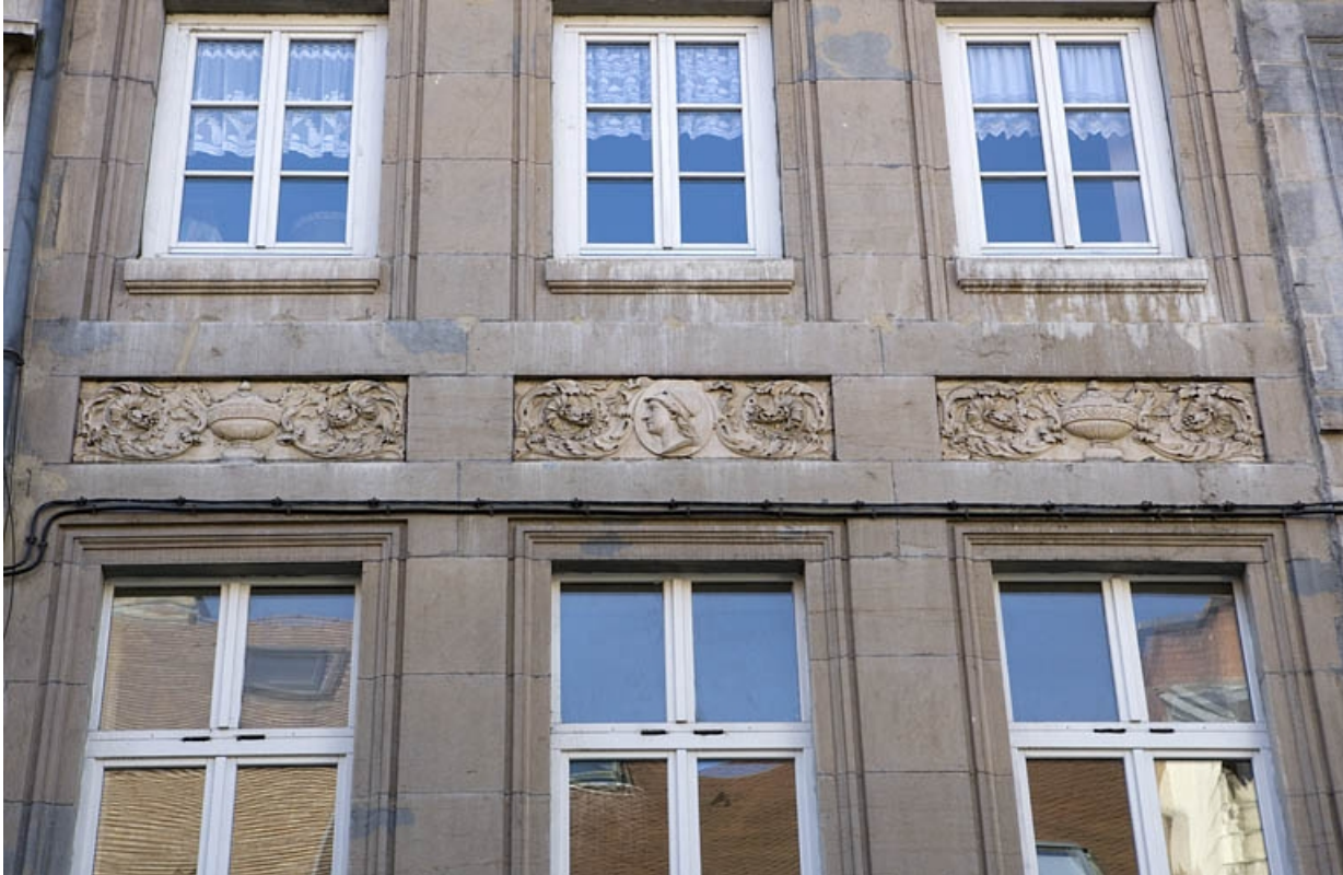
Détail du décor des tables rentrantes entre le premier et le deuxième étage.

25, Besançon Grande Rue 122, lieu-dit : îlot Granvelle