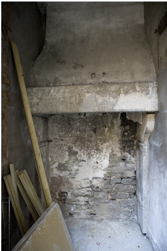
Détail de la cheminée d'une cuisine située dans l'aile droite de la deuxième cour.

25, Besançon Grande Rue 122, lieudit : îlot Granvelle