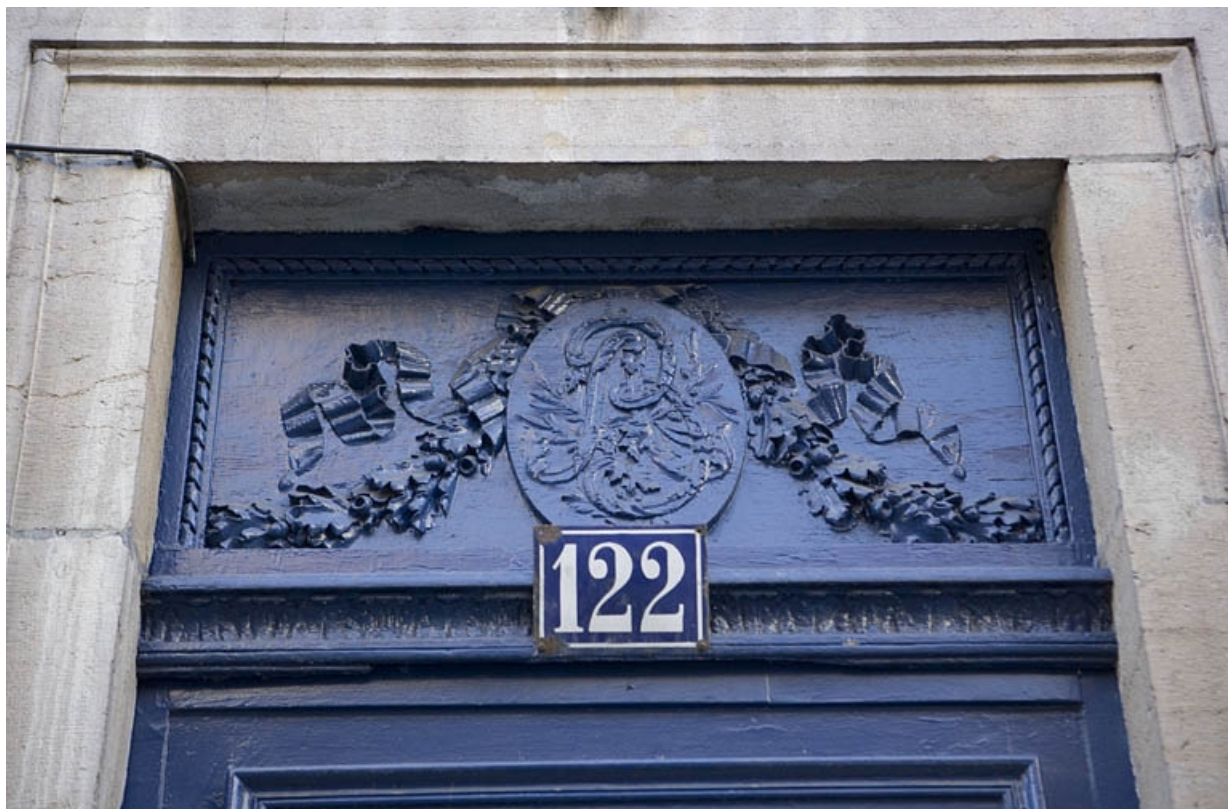
Couloir d'entrée : détail du décor au-dessus de la porte, avec le monogramme de Claude-Joseph-Alexandre Bertrand. 25, Besançon Grande Rue 122, lieudit : îlot Granvelle