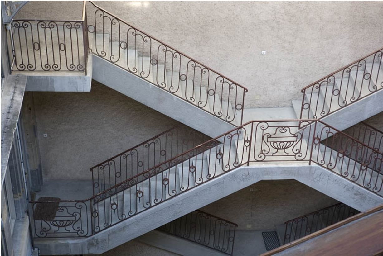
Détail de la rampe en fer forgé de l'escalier à cage ouverte, depuis la parcelle voisine. 25, Besançon Grande Rue 122, lieudit : îlot Granvelle