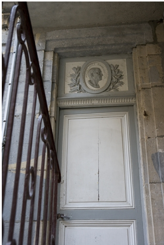
Vue d'ensemble de la porte du premier étage avec le portrait en médaillon de Michel-Ange.

25, Besançon Grande Rue 122, lieudit : îlot Granvelle