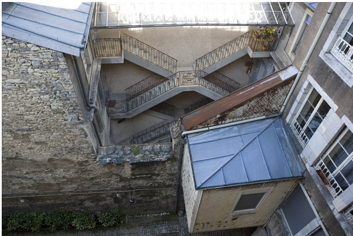
Vue d'ensemble de l'escalier à cage ouverte depuis la parcelle voisine.

25, Besançon Grande Rue 122, lieudit : îlot Granvelle