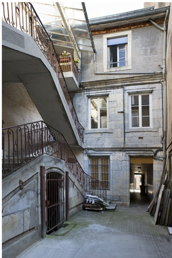
Vue d'ensemble de la façade postérieure du logis principal et de l'escalier à cage ouverte.

25, Besançon Grande Rue 122, lieudit : îlot Granvelle