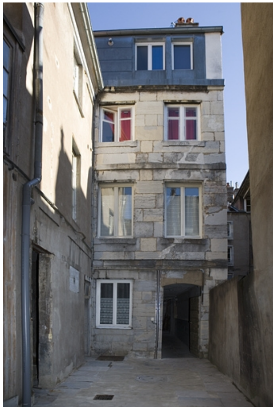
Vue d'ensemble de la façade postérieure du premier logis secondaire.

25, Besançon Grande Rue 122, lieudit : îlot Granvelle