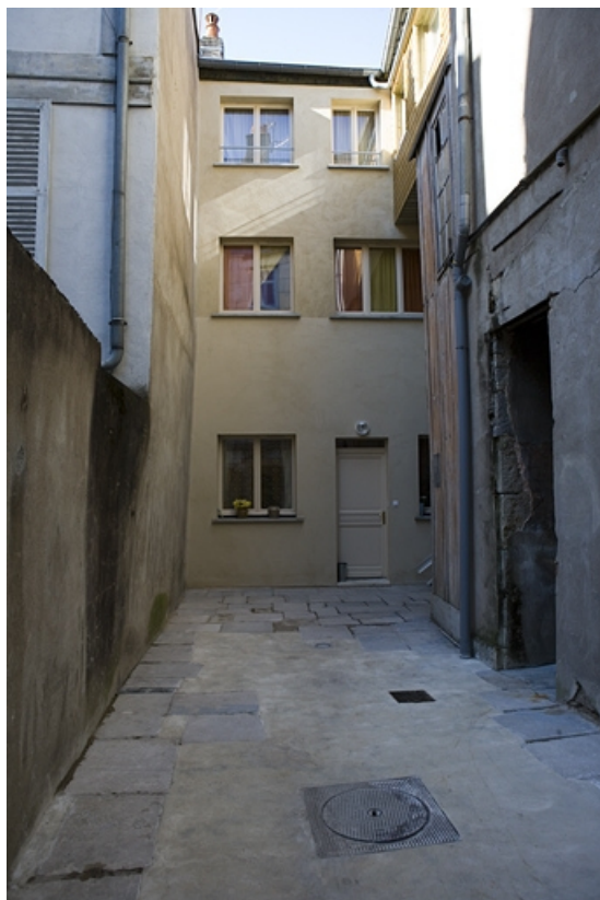
Vue d'ensemble de la façade antérieure du deuxième logis secondaire.

25, Besançon Grande Rue 122, lieudit : îlot Granvelle