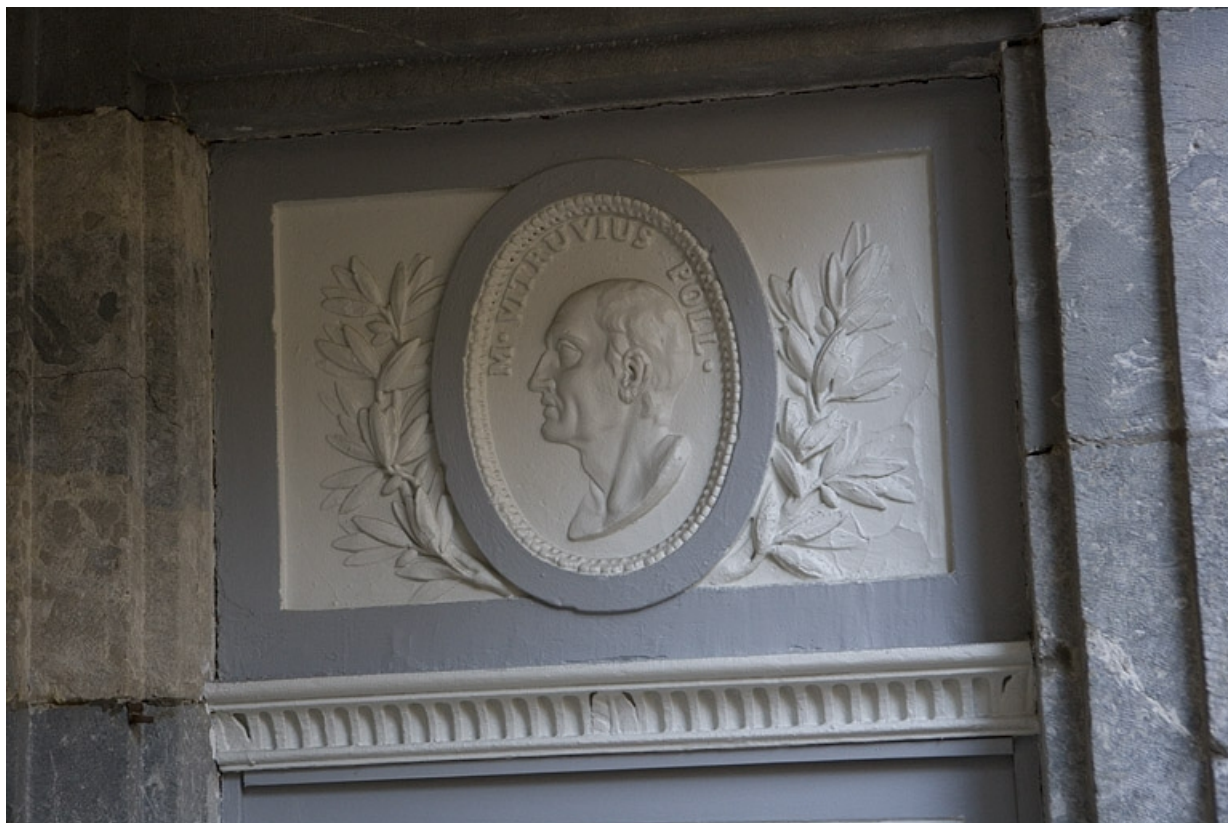
Détail d'un portrait en médaillon représentant Vitruve au-dessus d'une porte du premier étage.

25, Besançon Grande Rue 122, lieudit : îlot Granvelle