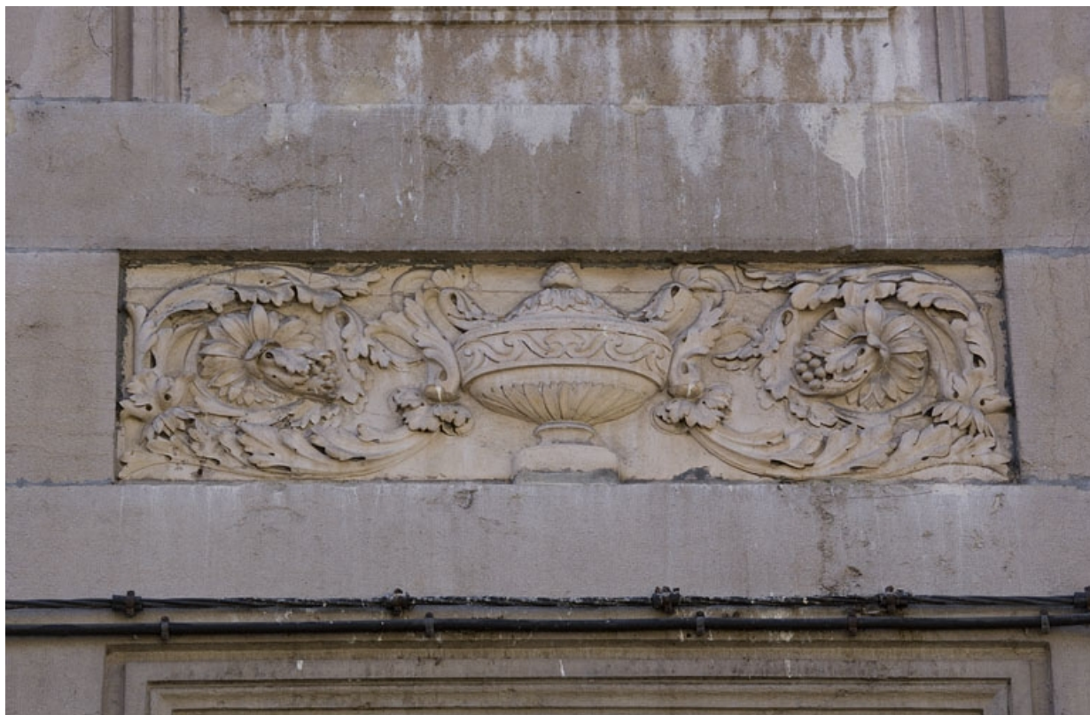
Détail du décor d'une table rentrante entre le premier et le deuxième étage : urne encadrée de feuillages : vue rapprochée. 25, Besançon Grande Rue 122, lieudit : îlot Granvelle