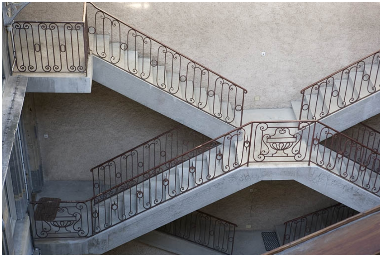
Détail de la rampe en fer forgé de l'escalier à cage ouverte, depuis la parcelle voisine.

25, Besançon Grande Rue 122, lieudit : îlot Granvelle