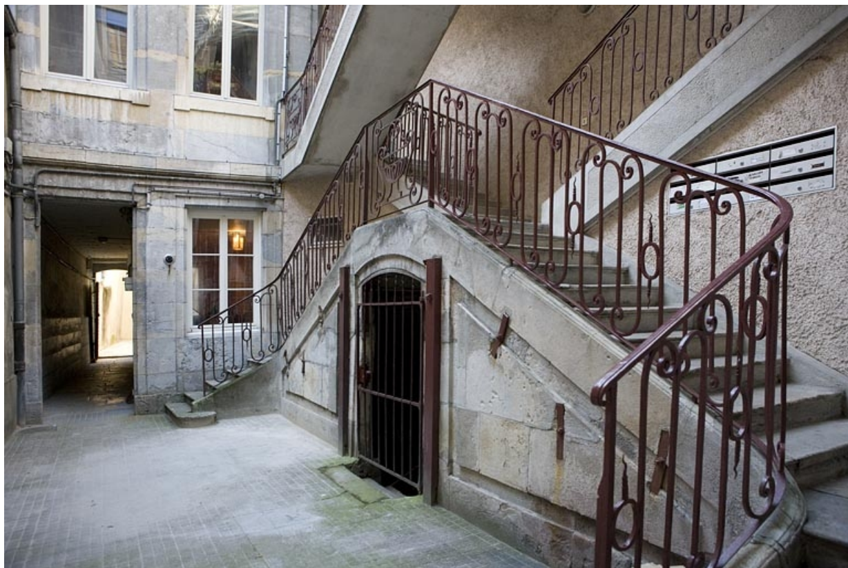
Vue d'ensemble du départ de l'escalier à cage ouverte sur cour.

25, Besançon Grande Rue 122, lieudit : îlot Granvelle