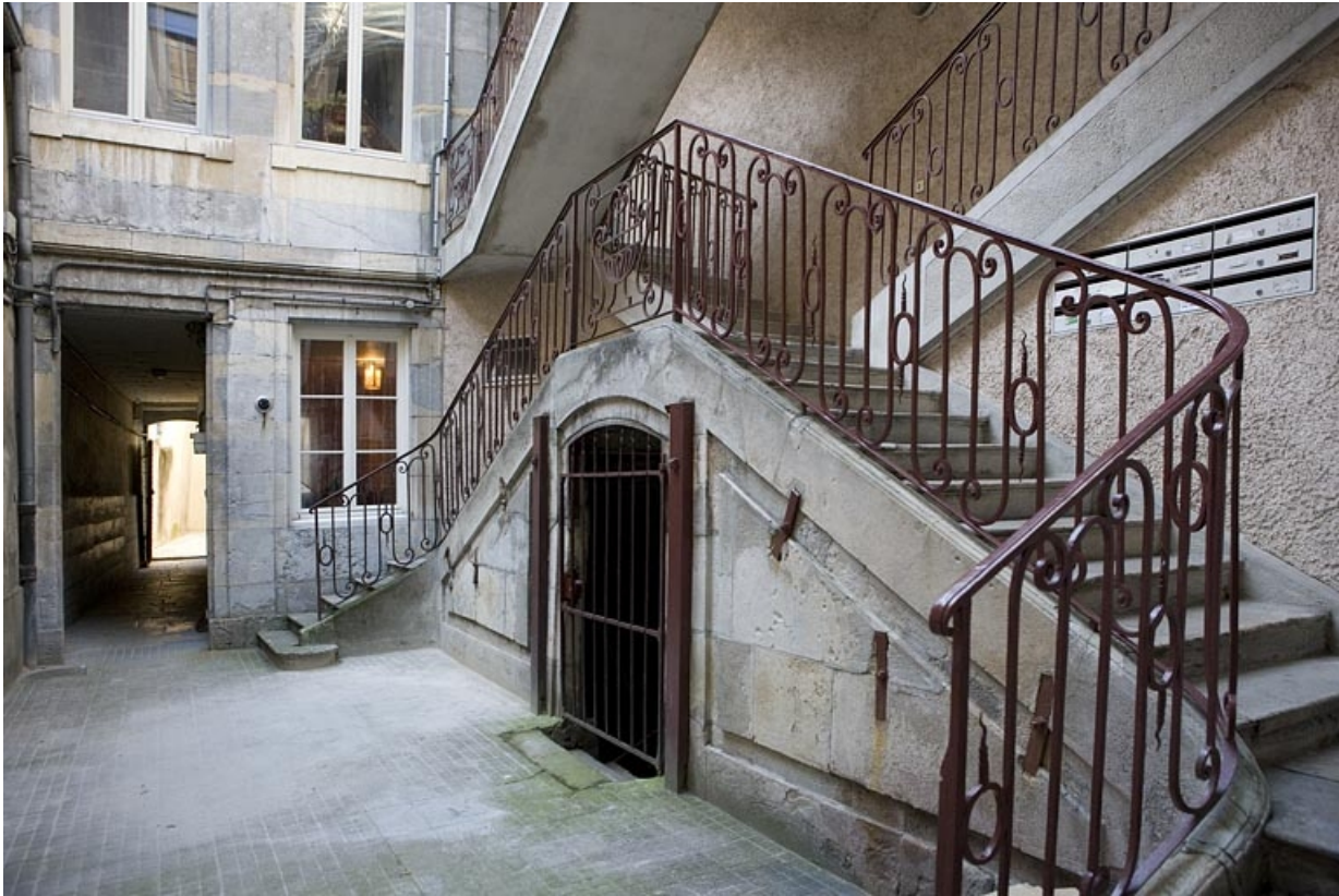
Vue d'ensemble du départ de l'escalier à cage ouverte sur cour.

25, Besançon Grande Rue 122, lieudit : îlot Granvelle