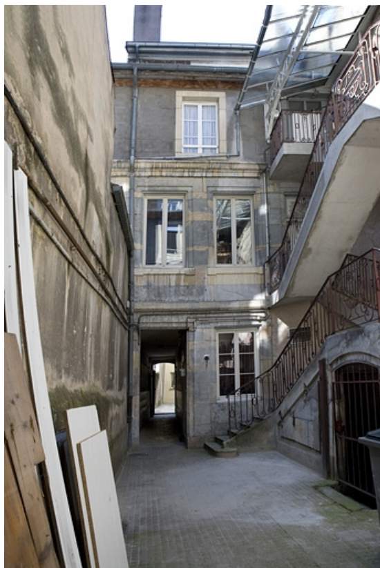
Vue d'ensemble de la façade antérieure du premier logis secondaire.

25, Besançon Grande Rue 122, lieudit : îlot Granvelle