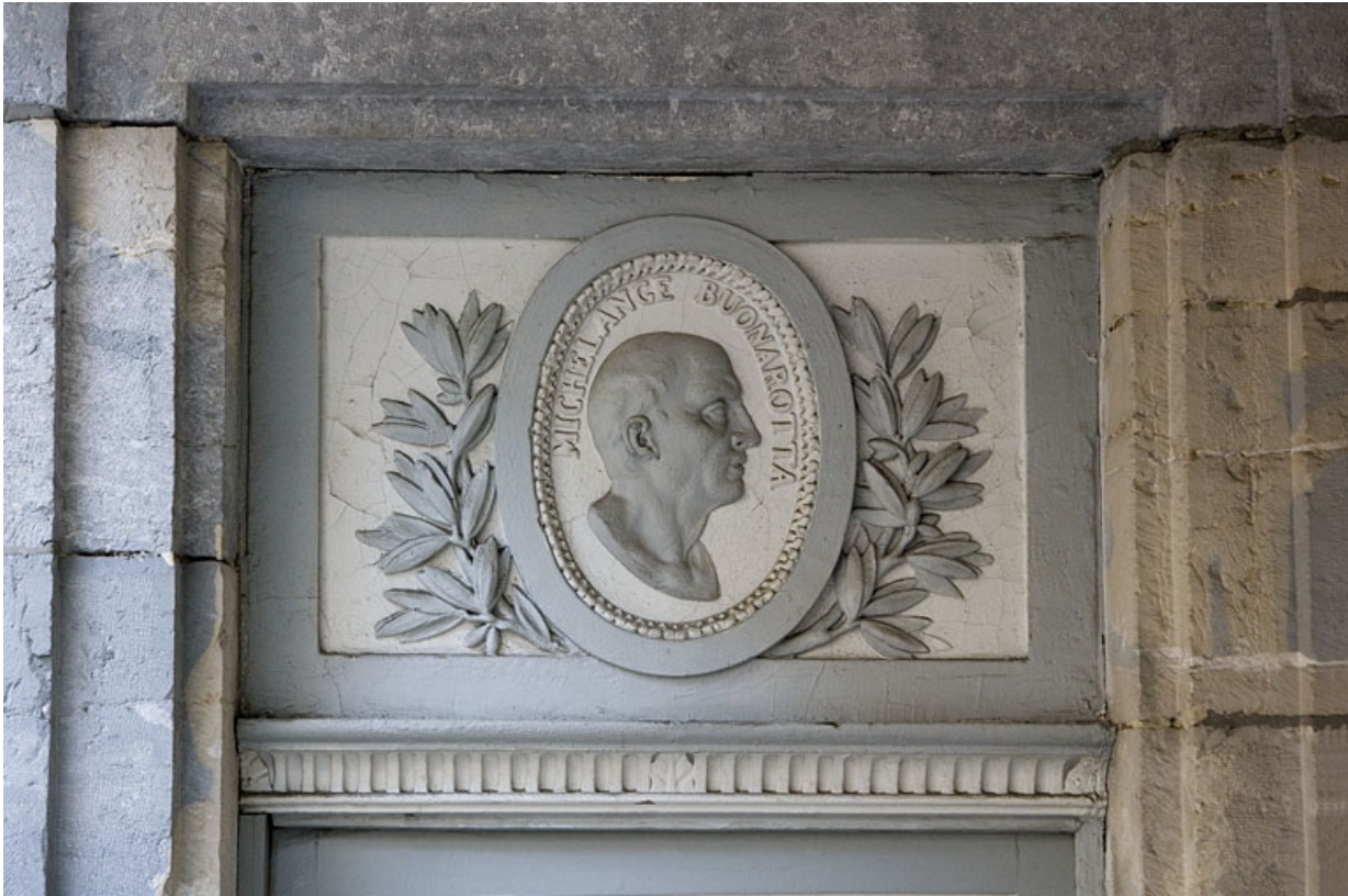
Détail d'un portrait en médaillon représentant Michel-Ange au-dessus d'une porte du premier étage. 25, Besançon Grande Rue 122, lieudit : îlot Granvelle