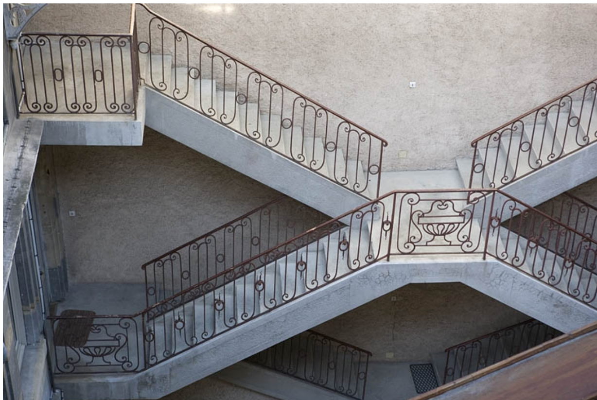
Détail de la rampe en fer forgé de l'escalier à cage ouverte, depuis la parcelle voisine.

25, Besançon Grande Rue 122, lieudit : îlot Granvelle