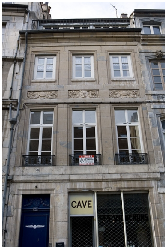
Vue d'ensemble de la façade antérieure : de face. 25, Besançon Grande Rue 122, lieudit : îlot Granvelle