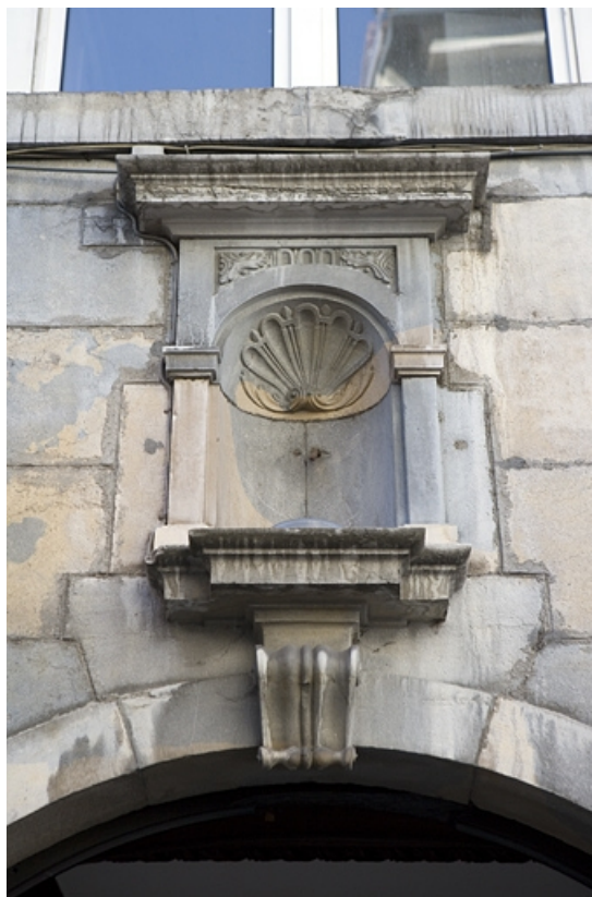
Détail de la niche au-dessus du portail d'entrée.

25, Besançon Grande Rue 110, lieudit : îlot Granvelle