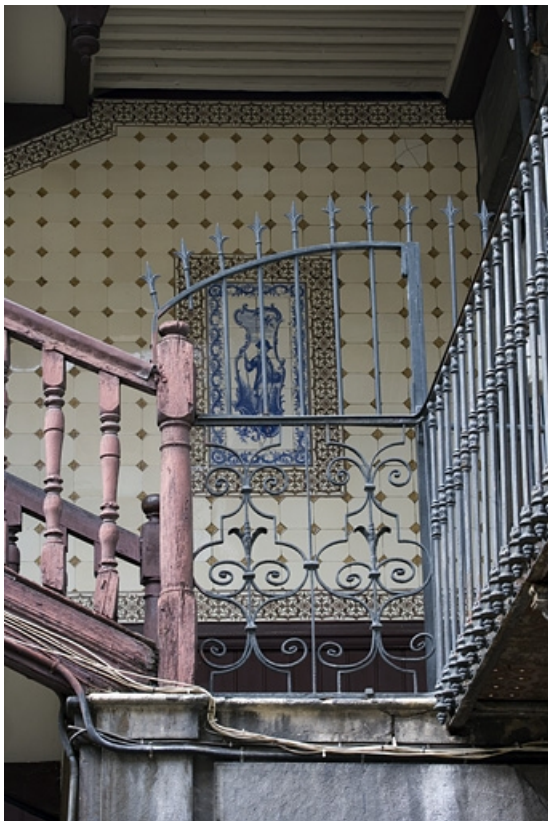
Escalier à cage ouverte : détail d'une partie en ferronnerie.

25, Besançon Grande Rue 110, lieudit : îlot Granvelle