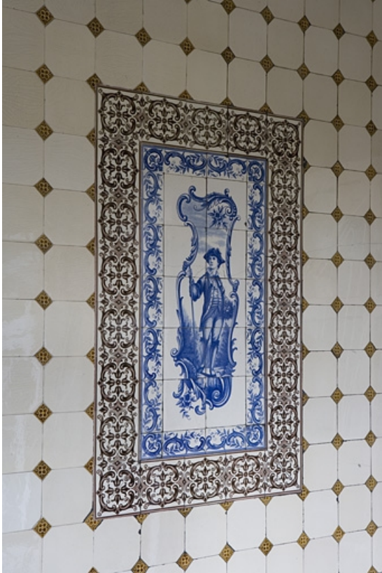
Détail d'un décor en faïence de la cage de l'escalier : personnage masculin.

25, Besançon Grande Rue 110, lieudit : îlot Granvelle