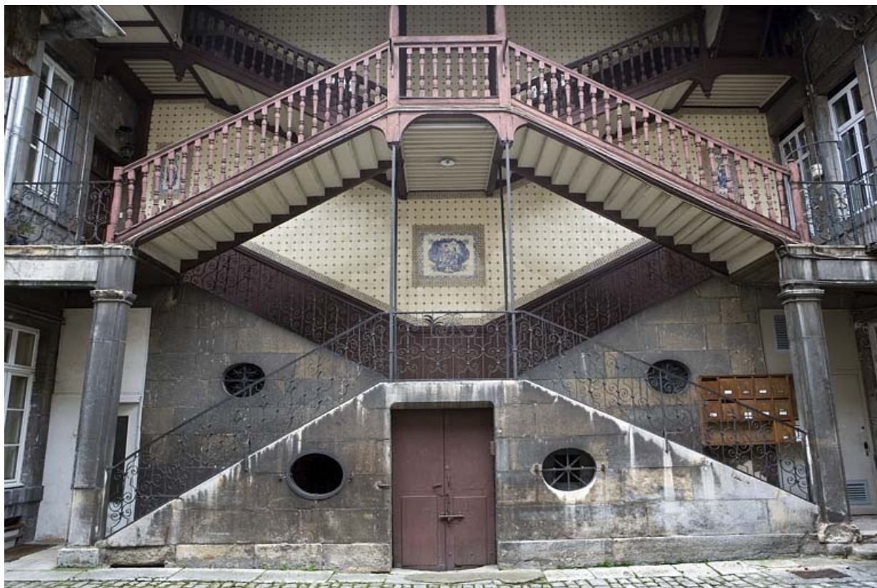
Vue d'ensemble de l'escalier à cage ouverte, de face.

25, Besançon Grande Rue 110, lieudit : îlot Granvelle