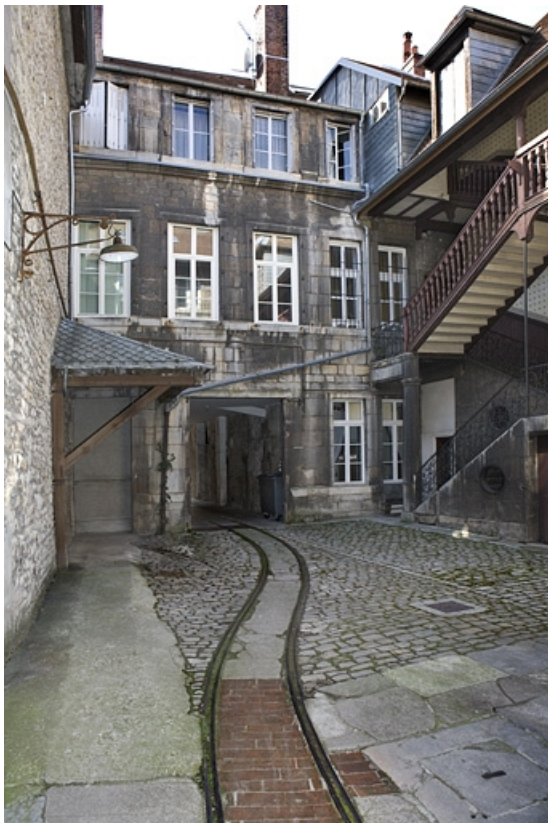
Vue de la cour avec la voie Decauville et de la façade antérieure du logis secondaire. 25, Besançon Grande Rue 110, lieudit : îlot Granvelle