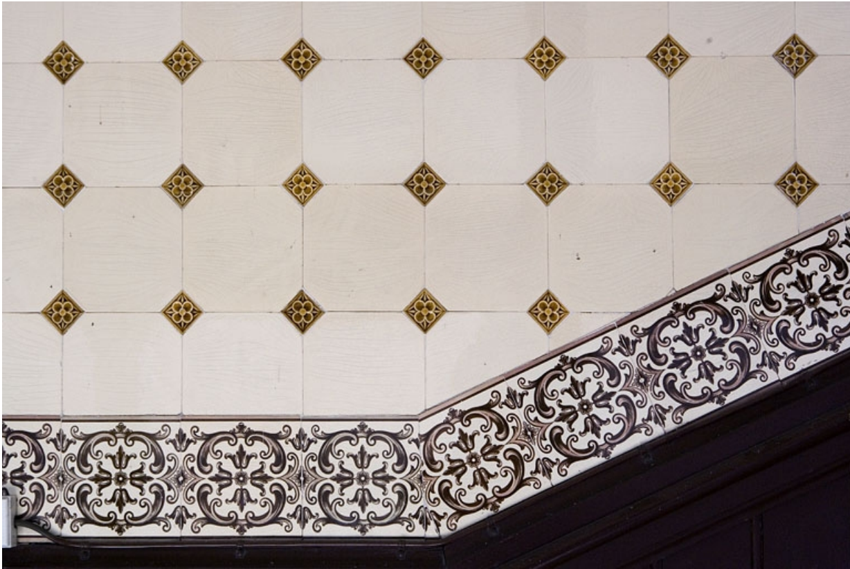
Détail d'un décor en faïence de la cage de l'escalier : bordure.

25, Besançon Grande Rue 110, lieudit : îlot Granvelle