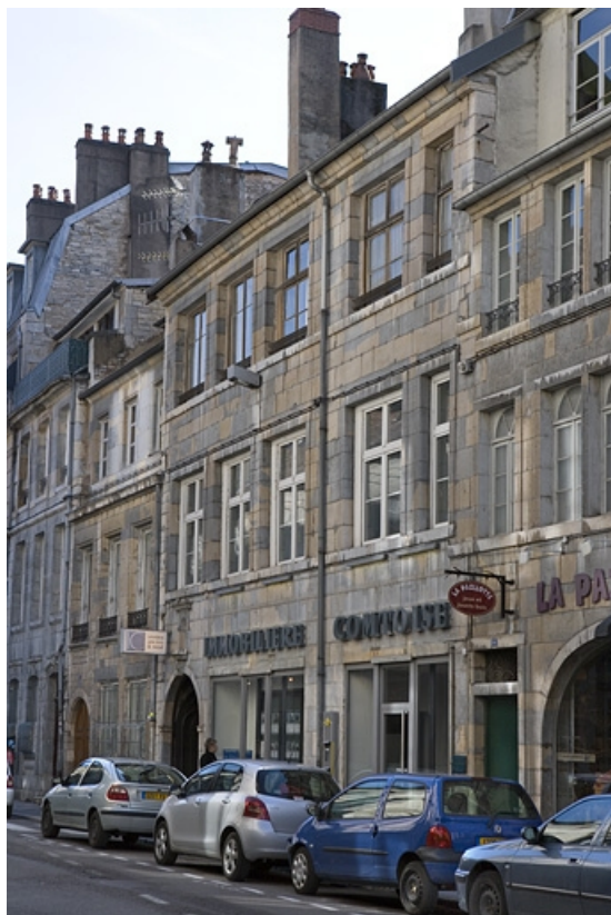
Vue d'ensemble de trois quarts droit.

25, Besançon Grande Rue 110, lieudit : îlot Granvelle