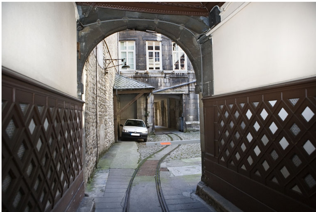
Vue de la cour depuis le passage cocher avec la voie Decauville.

25, Besançon Grande Rue 110, lieudit : îlot Granvelle