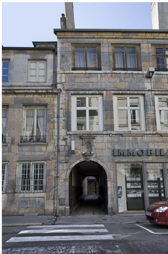
Détail du portail d'entrée.

25, Besançon Grande Rue 110, lieudit : îlot Granvelle