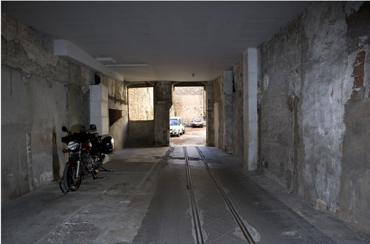
Vue de l'intérieur du rez-de-chaussée du logis secondaire : ancien atelier de l'entreprise Zani.

25, Besançon Grande Rue 110, lieudit : îlot Granvelle