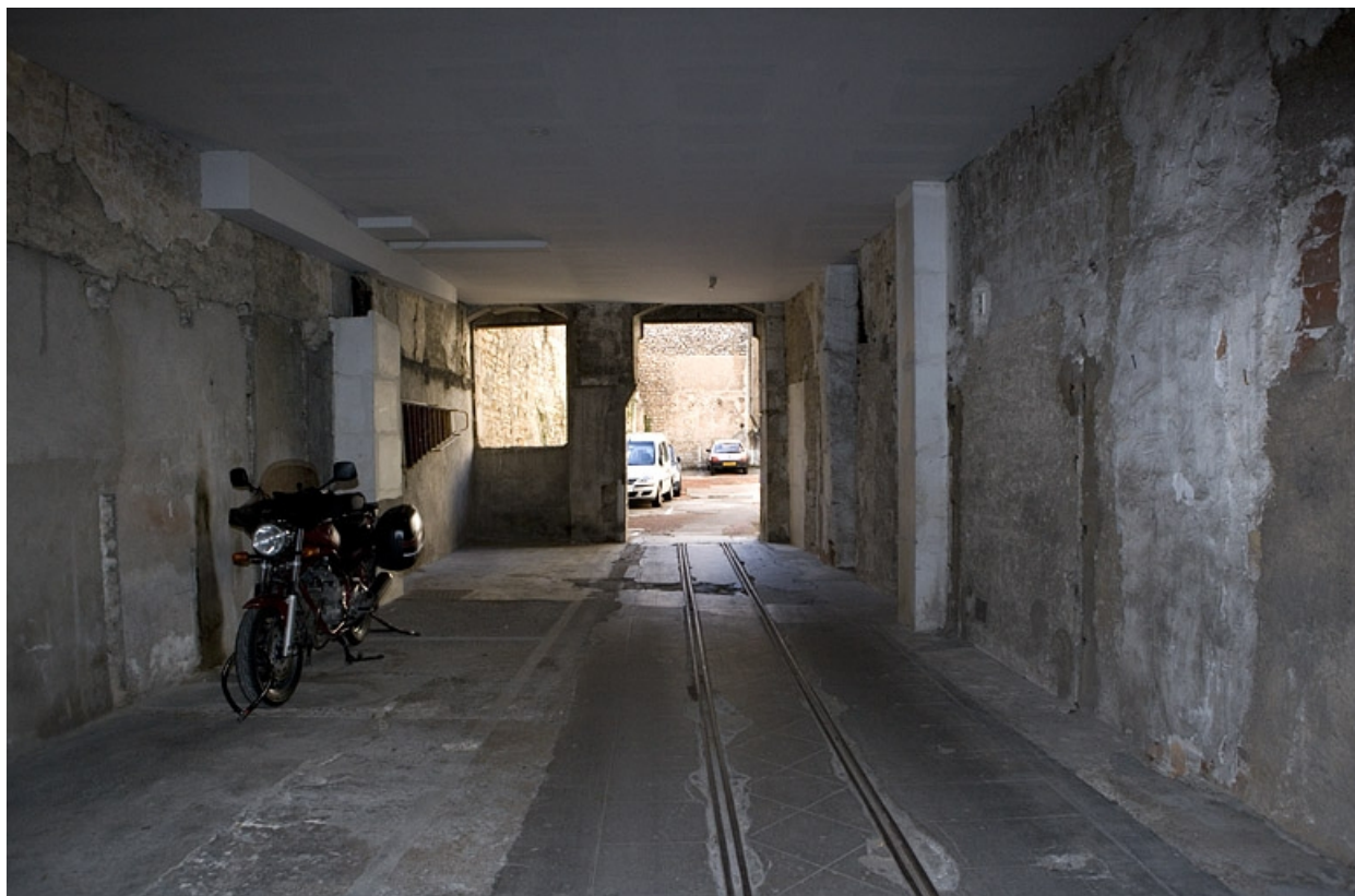
Vue de l'intérieur du rez-de-chaussée du logis secondaire : ancien atelier de l'entreprise Zani. 25, Besançon Grande Rue 110, lieudit : îlot Granvelle