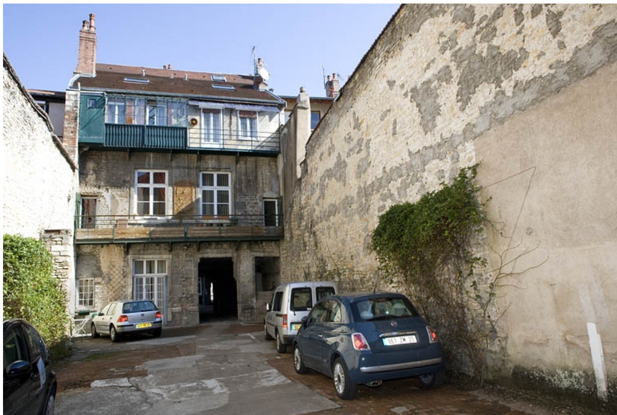
Vue de la façade postérieure du logis secondaire depuis la deuxième cour. 25, Besançon Grande Rue 110, lieudit : îlot Granvelle