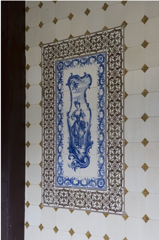
Détail d'un décor en faïence de la cage de l'escalier : personnage féminin.

25, Besançon Grande Rue 110, lieudit : îlot Granvelle