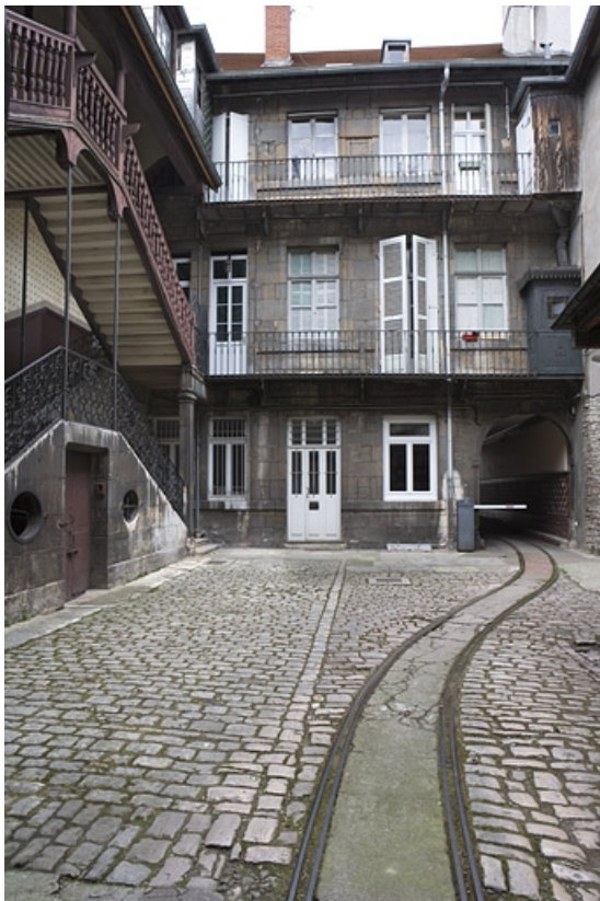
Vue d'ensemble de la façade postérieure du logis sur rue.

25, Besançon Grande Rue 110, lieudit : îlot Granvelle