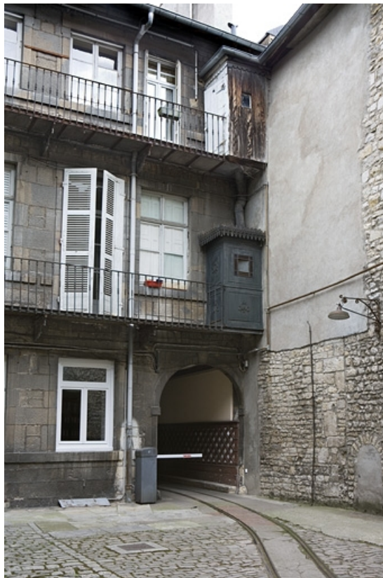
Façade postérieure du logis sur rue : détail des anciennes latrines au-dessus du portail d'entrée.

25, Besançon Grande Rue 110, lieudit : îlot Granvelle