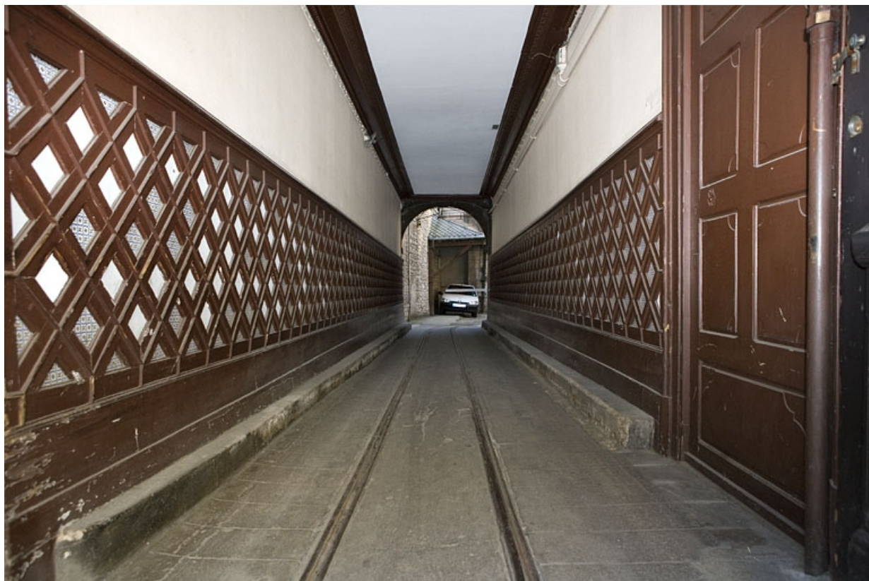
Vue d'ensemble du passage cocher depuis la rue avec la voie Decauville.

25, Besançon Grande Rue 110, lieudit : îlot Granvelle