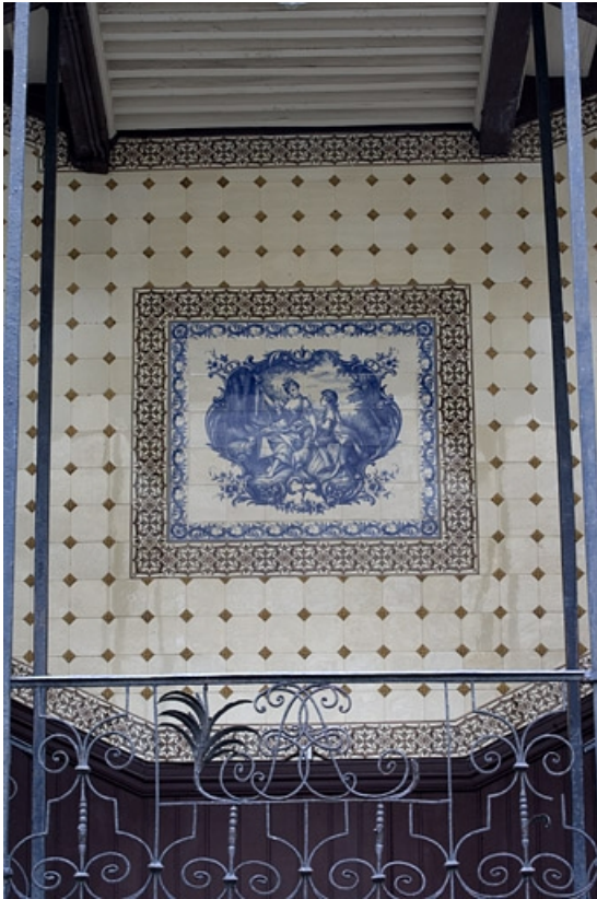
Détail d'un décor en faïence de la cage de l'escalier : deux personnages féminins.

25, Besançon Grande Rue 110, lieudit : îlot Granvelle