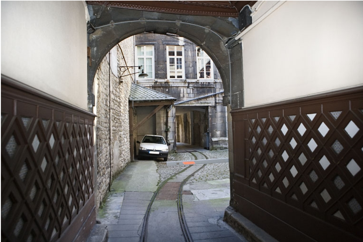
Vue de la cour depuis le passage cocher avec la voie Decauville.

25, Besançon Grande Rue 110, lieudit : îlot Granvelle