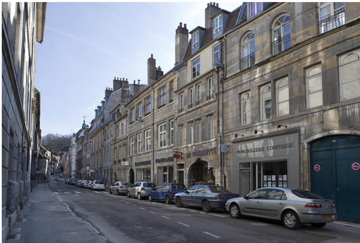
Vue d'ensemble éloignée de trois quarts droit.

25, Besançon Grande Rue 110, lieudit : îlot Granvelle