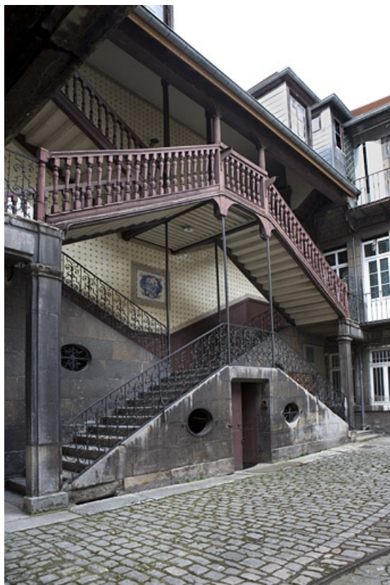
Vue d'ensemble de l'escalier à cage ouverte, de trois quarts gauche.

25, Besançon Grande Rue 110, lieudit : îlot Granvelle