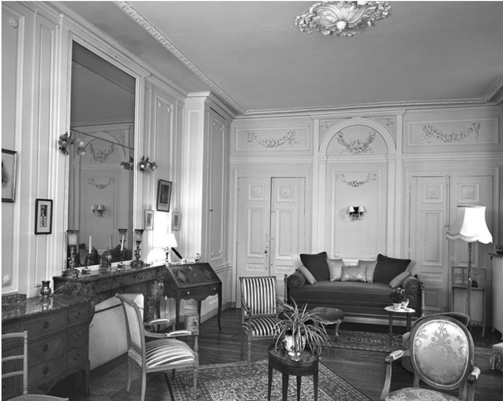
Vue d'ensemble du petit salon depuis la porte de communication avec l'antichambre.

25, Besançon Grande Rue 104, lieudit : îlot Granvelle