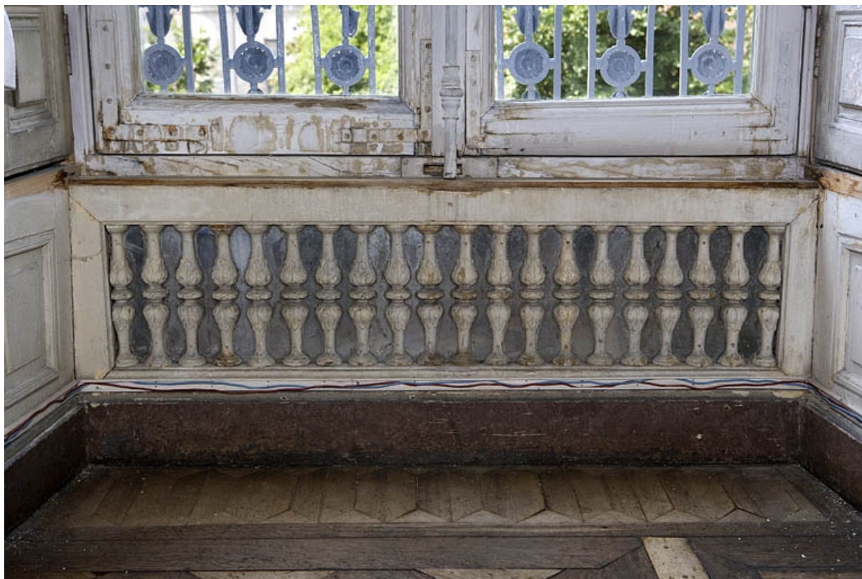
Hôtel en fond de cour, grand salon : décor de balustres sur fond de glace sous une fenêtre.

25, Besançon Grande Rue 104, lieudit : îlot Granvelle