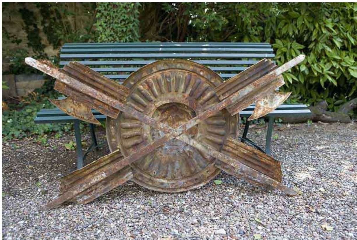
Hôtel en fond de cour : revers du décor en tôle repoussée déposé, ornant auparavant la façade postérieure. 25, Besançon Grande Rue 104, lieudit : îlot Granvelle