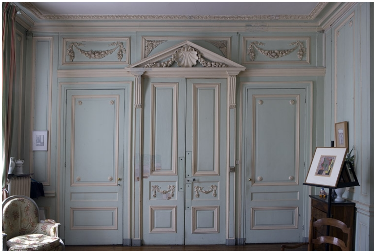
Hôtel en fond de cour, chambre à droite de l'antichambre (ancien petit salon) : lambris et porte donnant sur l'antichambre. 25, Besançon Grande Rue 104, lieudit : îlot Granvelle