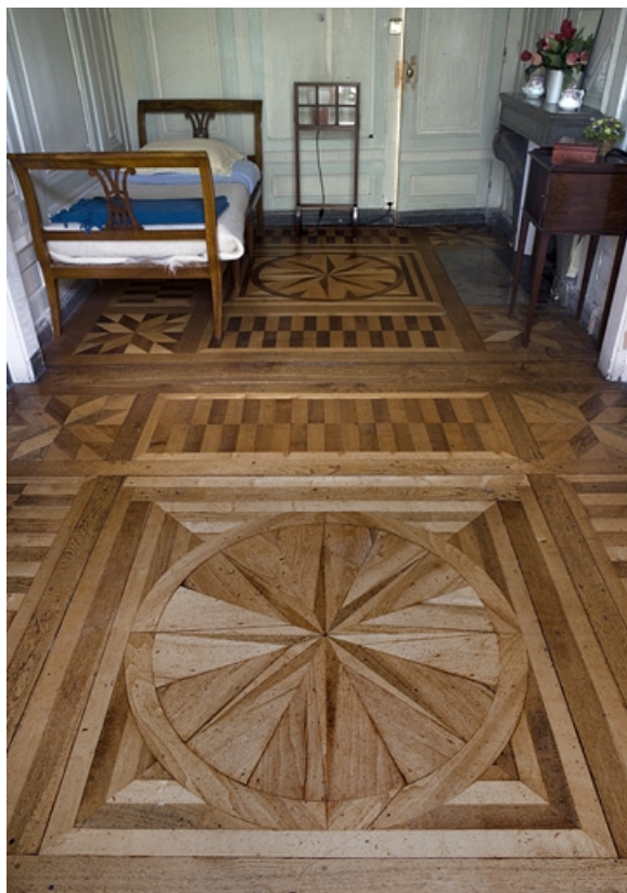
Hôtel en fond de cour : détail des planchers des anciens boudoir et cabinet de toilette. 25, Besançon Grande Rue 104, lieudit : îlot Granvelle