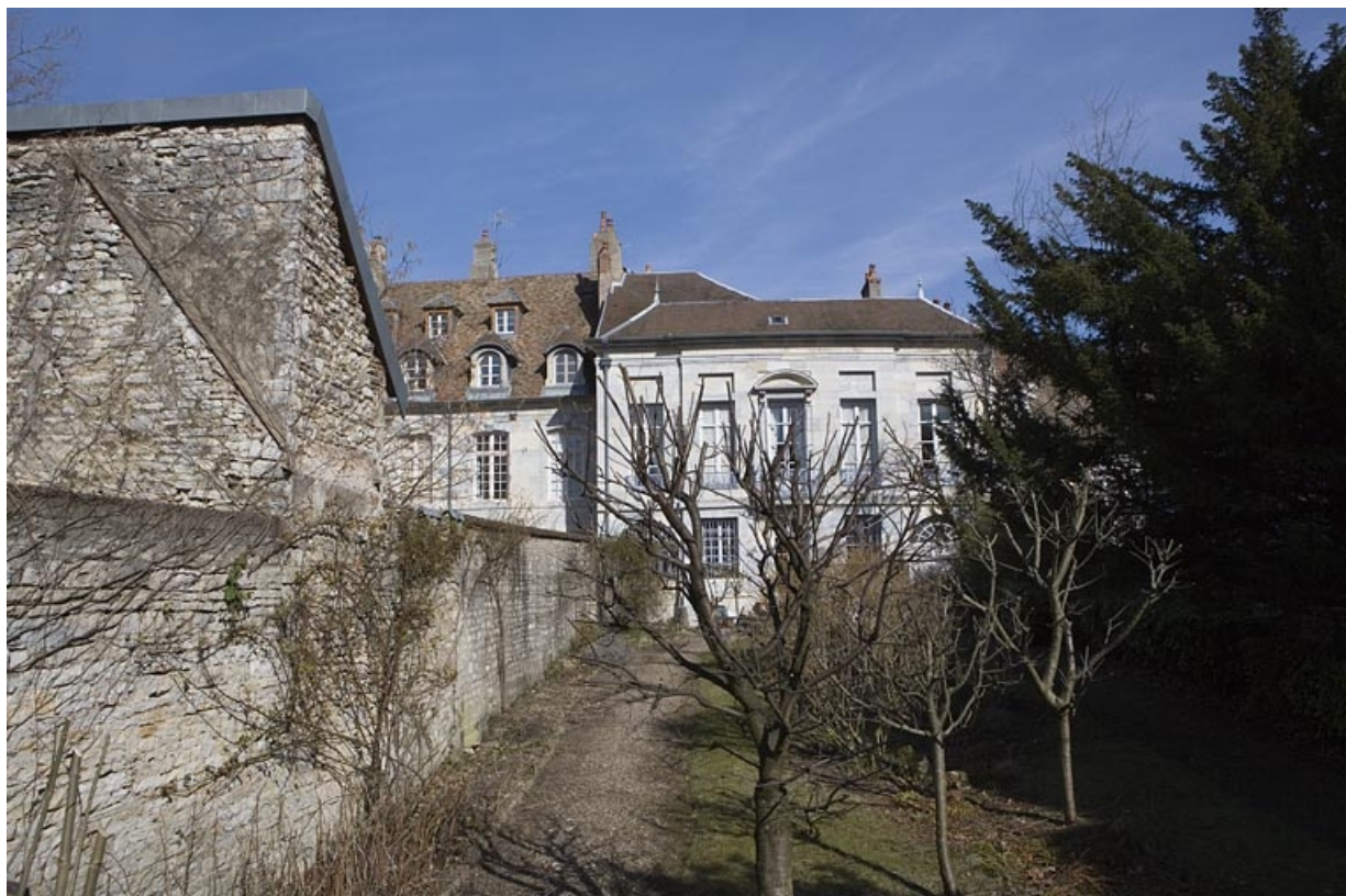
Hôtel en fond de cour : vue d'ensemble du jardin et de la façade postérieure depuis la place du théâtre. 25, Besançon Grande Rue 104, lieudit : îlot Granvelle