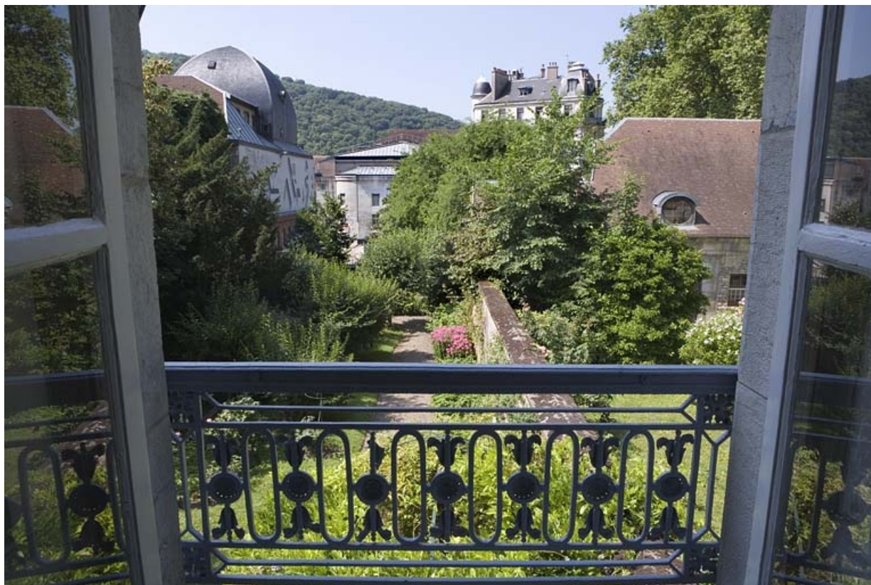
Hôtel en fond de cour : vue du jardin depuis le premier étage, avec le garde-corps de la fenêtre.

25, Besançon Grande Rue 104, lieudit : îlot Granvelle