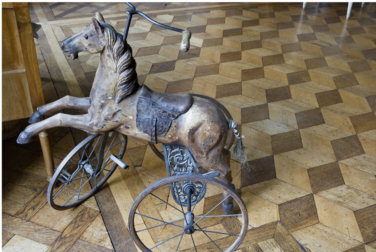
Hôtel en fond de cour : détail du plancher du grand salon.

25, Besançon Grande Rue 104, lieudit : îlot Granvelle