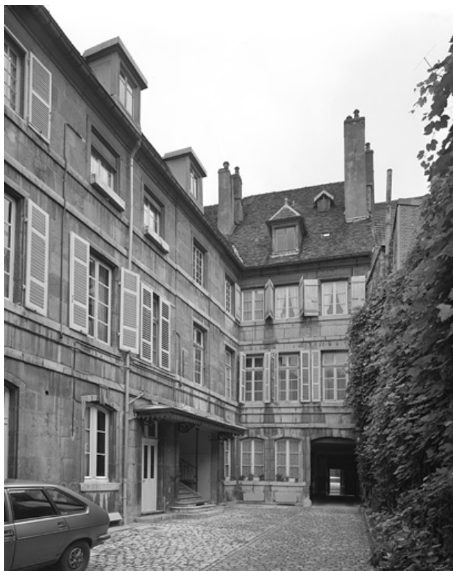
Vue d'ensemble des façades sur cour du logis sur rue.

25, Besançon Grande Rue 104, lieudit : îlot Granvelle