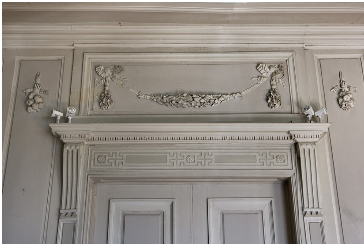
Hôtel en fond de cour, antichambre : décor du dessus d'une fausse-porte.

25, Besançon Grande Rue 104, lieudit : îlot Granvelle