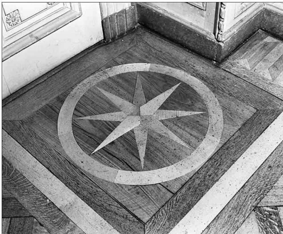
Détail d'un décor du parquet en marquetterie du grand salon.

25, Besançon Grande Rue 104, lieudit : îlot Granvelle