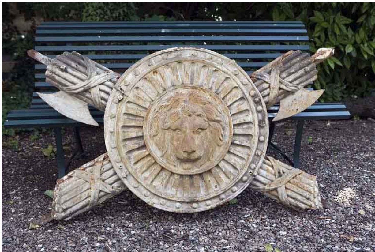
Hôtel en fond de cour : décor en tôle repoussée déposé, ornant auparavant la façade postérieure, vue de face. 25, Besançon Grande Rue 104, lieudit : îlot Granvelle