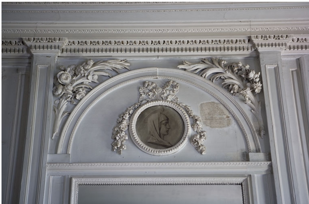
Hôtel en fond de cour, chambre : détail du médaillon peint en grisaille au-dessus de la glace.

25, Besançon Grande Rue 104, lieudit : îlot Granvelle