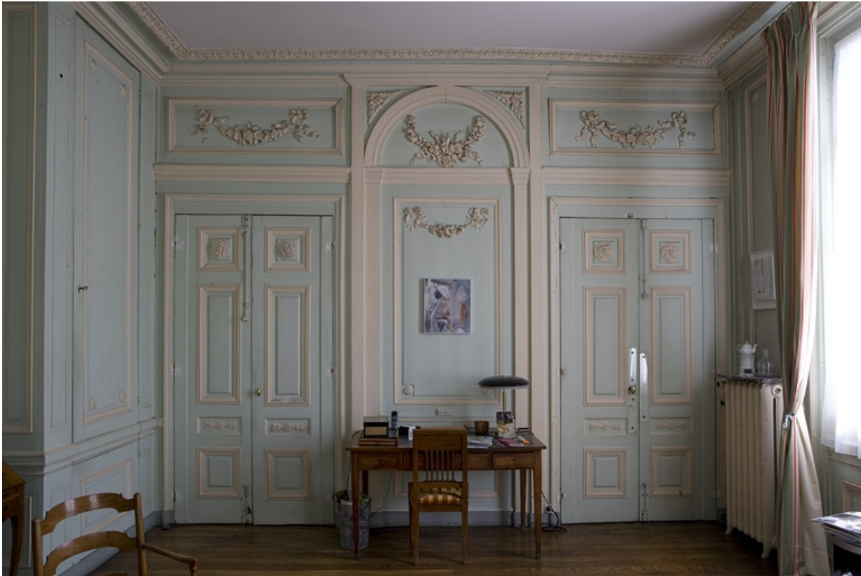
Hôtel en fond de cour, chambre à droite de l'antichambre (ancien petit salon) : détail des lambris au fond de la pièce. 25, Besançon Grande Rue 104, lieudit : îlot Granvelle