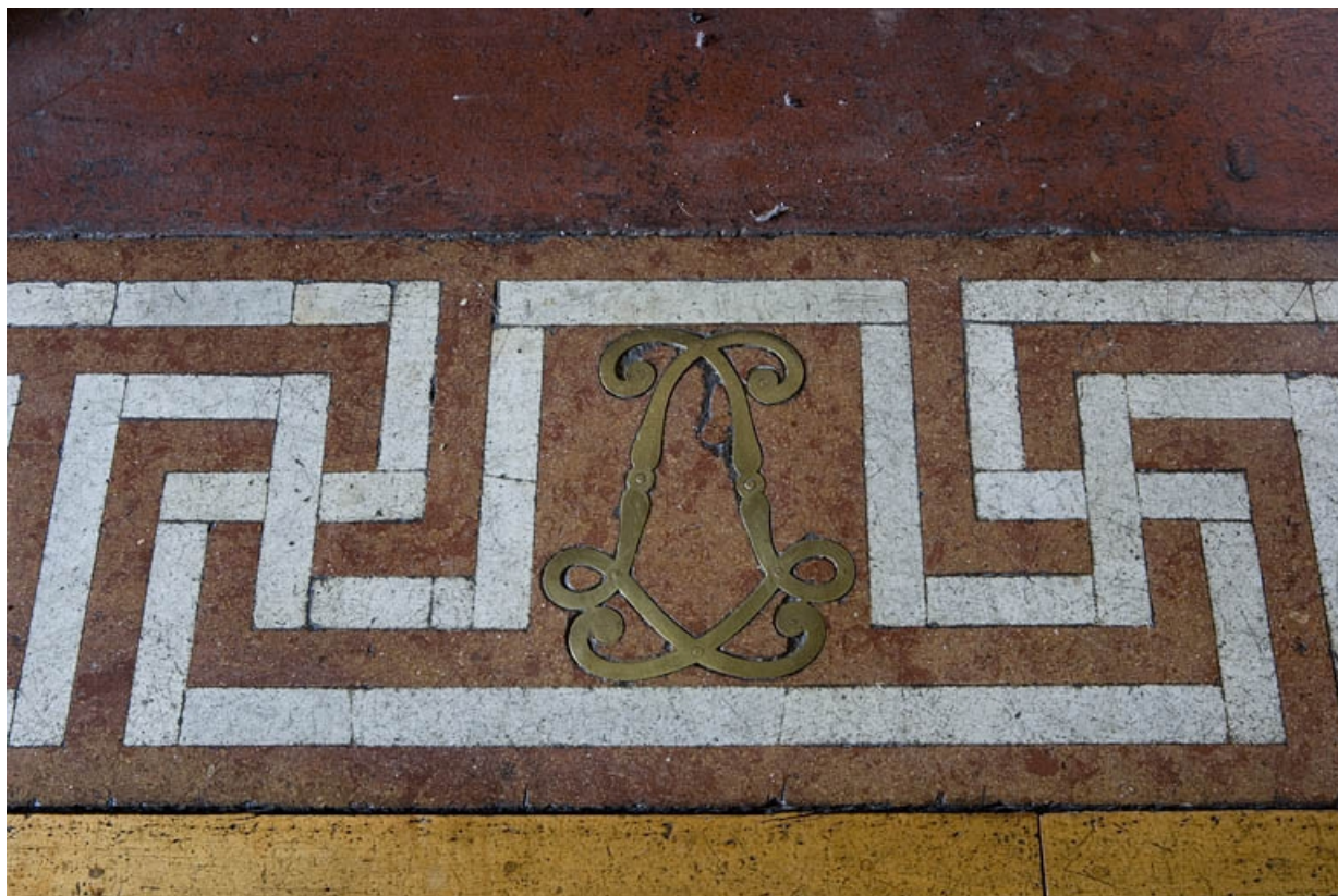
Hôtel en fond de cour : détail central de la dalle de foyer de la cheminée du grand salon.

25, Besançon Grande Rue 104, lieudit : îlot Granvelle