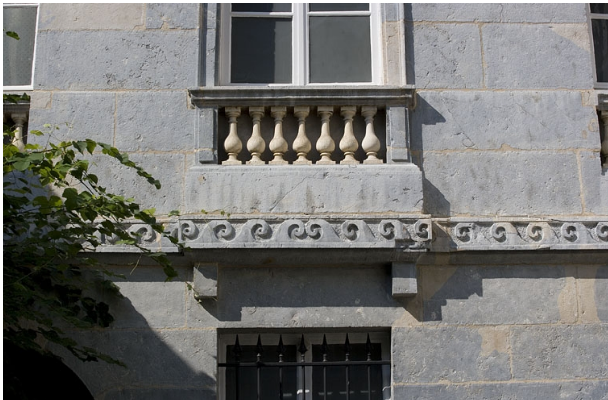
Hôtel en fond de cour : détail d'un balcon et de la frise au premier étage de la façade antérieure.

25, Besançon Grande Rue 104, lieudit : îlot Granvelle