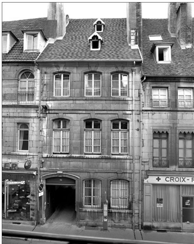
Vue d'ensemble de la façade antérieure du logis sur rue.

25, Besançon Grande Rue 104, lieudit : îlot Granvelle