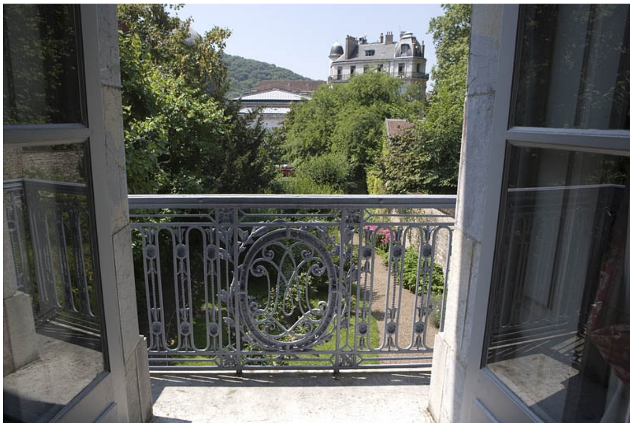
Hôtel en fond de cour : détail de la grille du balcon donnant sur le jardin, depuis l'intérieur.

25, Besançon Grande Rue 104, lieudit : îlot Granvelle