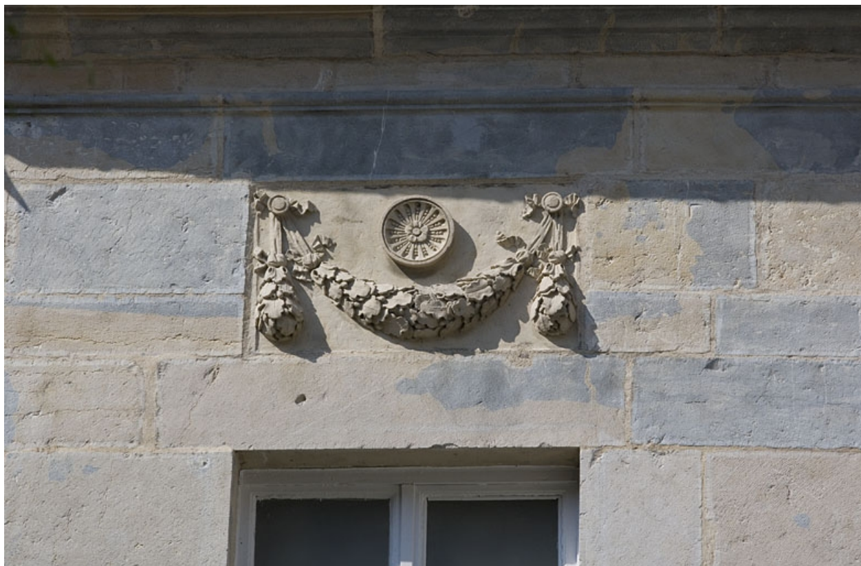
Hôtel en fond de cour : détail d'un décor sur la façade antérieure.

25, Besançon Grande Rue 104, lieudit : îlot Granvelle