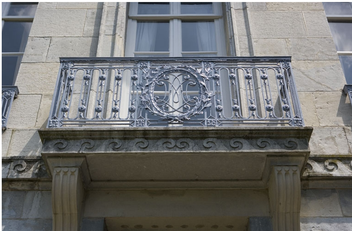
Hôtel en fond de cour : détail du balcon sur la façade postérieure.

25, Besançon Grande Rue 104, lieudit : îlot Granvelle