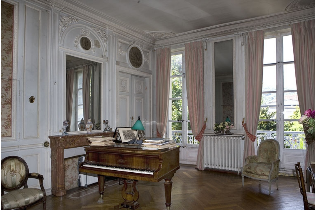
Hôtel en fond de cour : vue d'ensemble de la chambre depuis le fond de la pièce.

25, Besançon Grande Rue 104, lieudit : îlot Granvelle