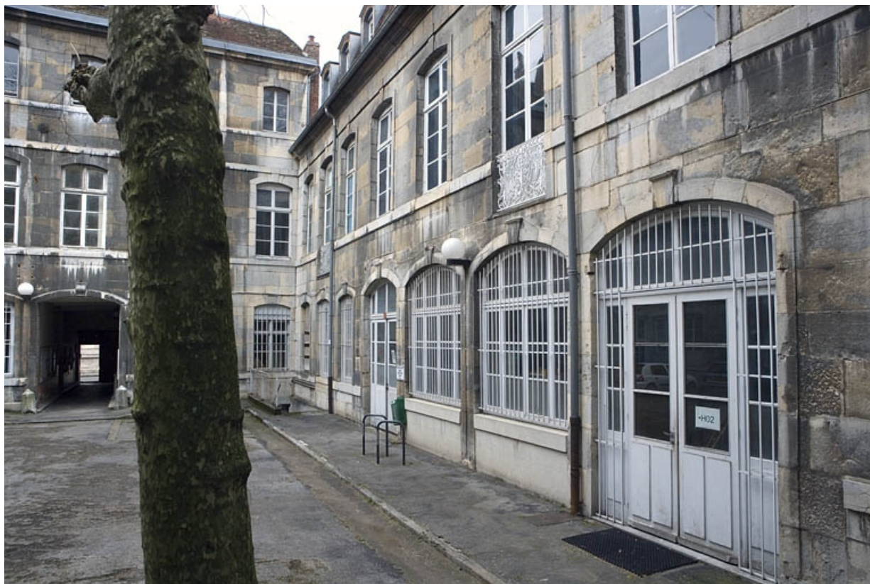
Vue d'ensemble de l'aile gauche depuis le fond de la cour. 25, Besançon, 47 rue Mégevand, lieudit : îlot Granvelle