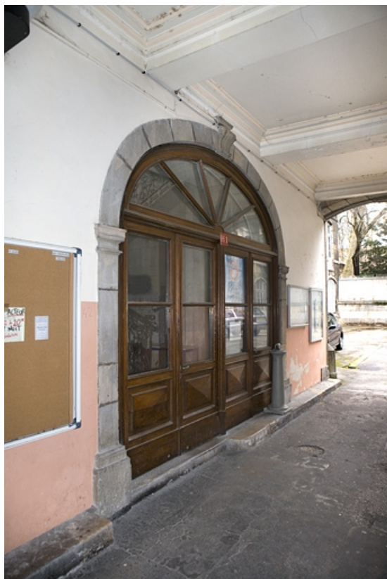
Détail de l'entrée de l'escalier à gauche du passage cochier. 25, Besançon, 47 rue Mégevand, lieudit : îlot Granvelle