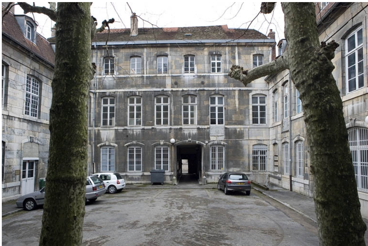
Vue d'ensemble de la façade postérieure du logis principal depuis le fond de la cour. 25, Besançon, 47 rue Mégevand, lieudit : îlot Granvelle