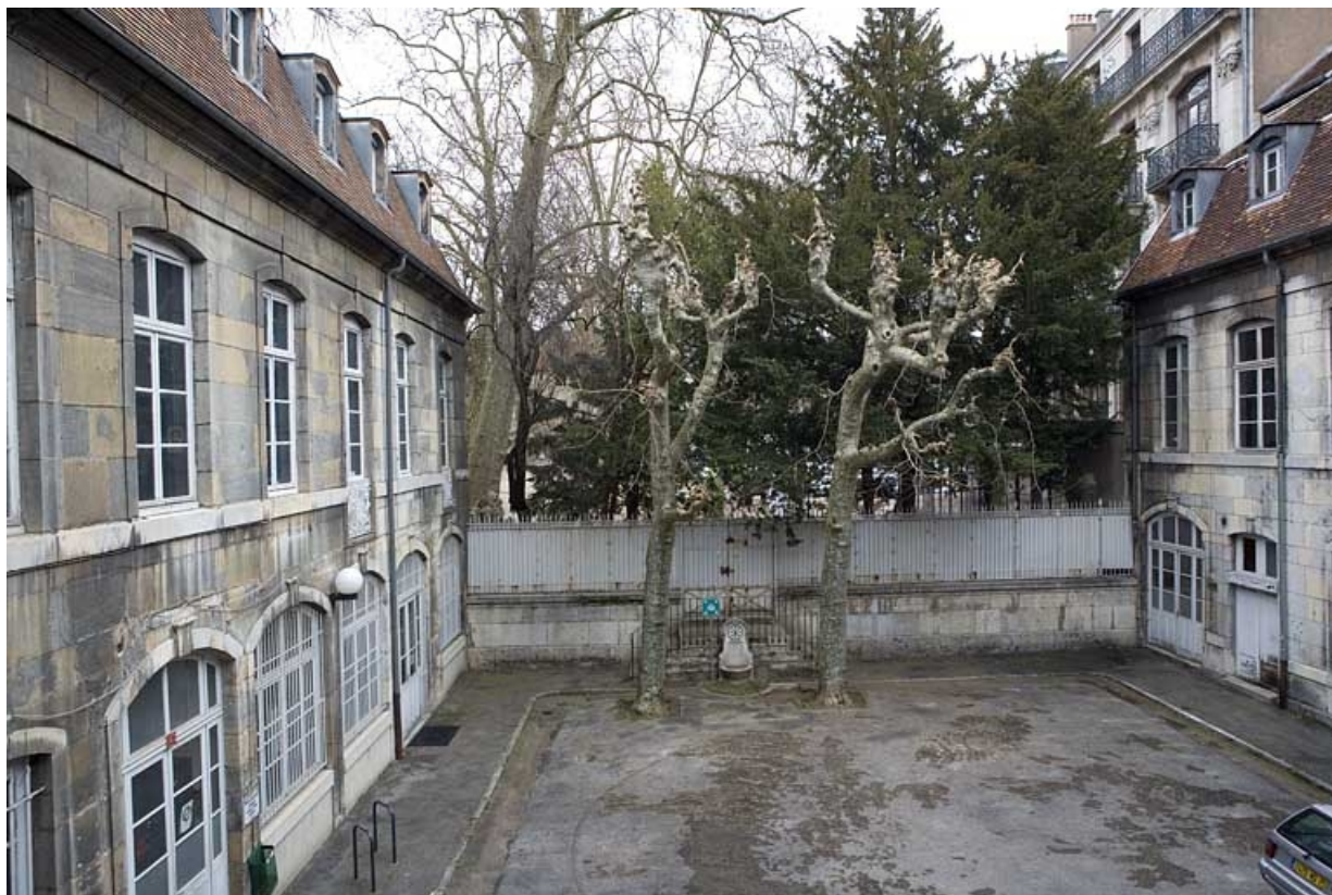
Vue d'ensemble de la cour depuis l'entrée.

25, Besançon, 47 rue Mégevand, lieudit : îlot Granvelle