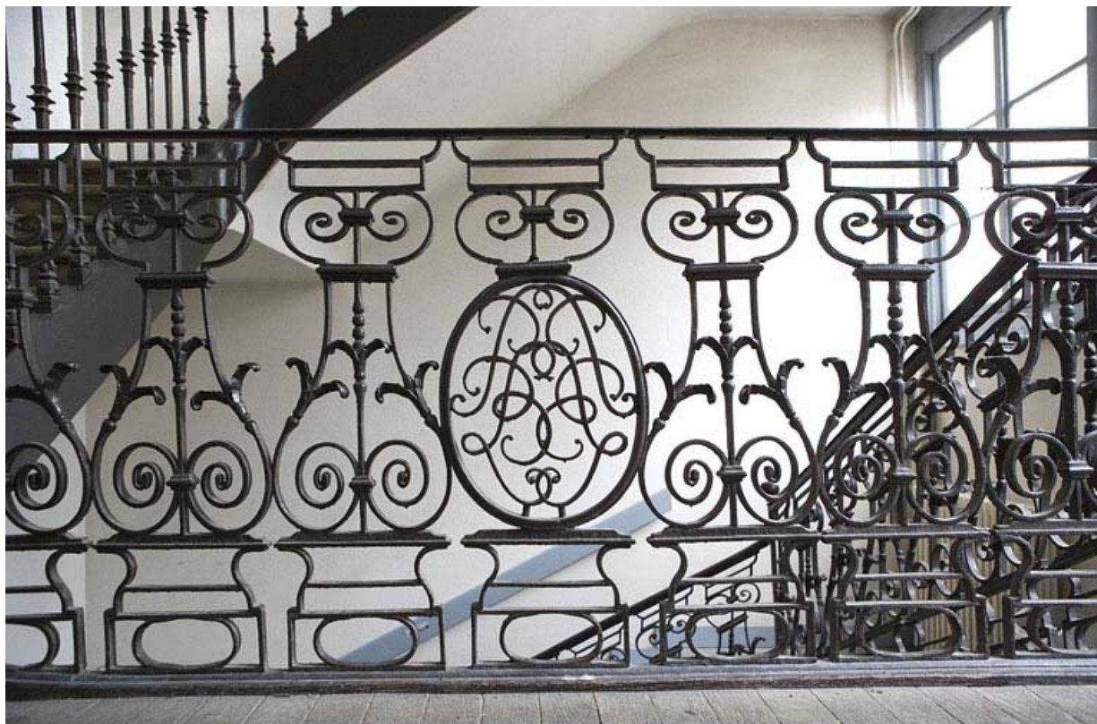
Détail des motifs en fer forgé de la rampe d'escalier.

25, Besançon, 47 rue Mégevand, lieudit : îlot Granvelle