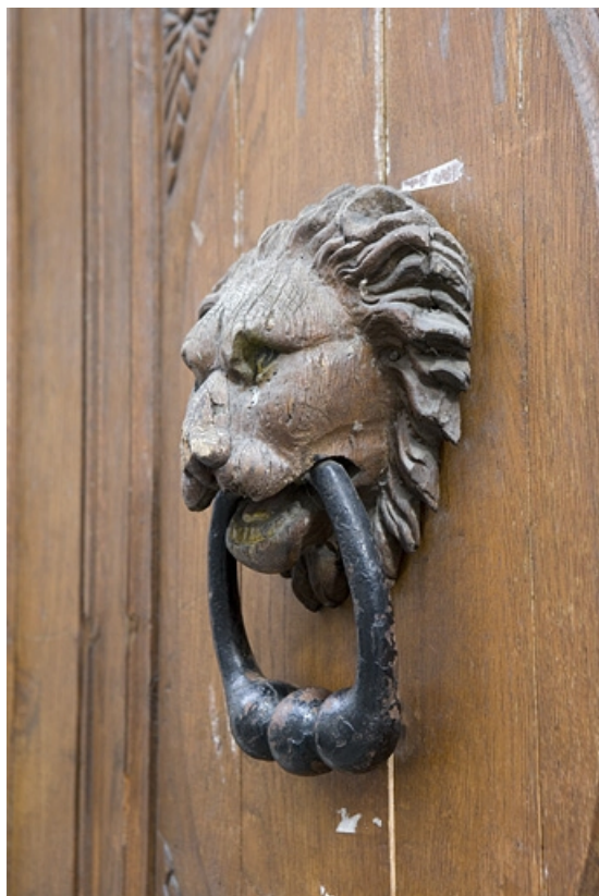
Vantail droit du portail d'entrée : détail du mufle de lion situé sur le panneau central, de trois quarts. 25, Besançon, 47 rue Mégevand, lieudit : îlot Granvelle