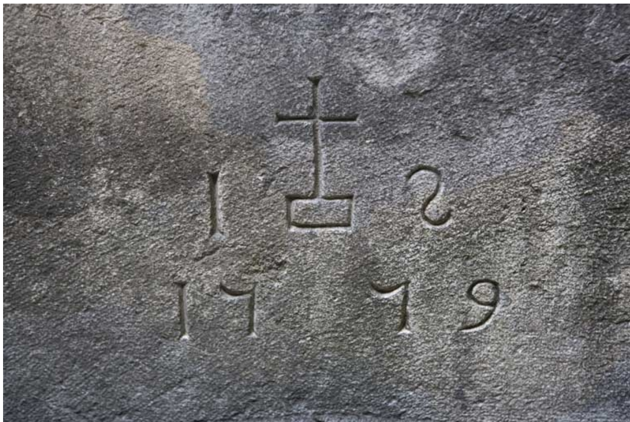
Détail de la date située sur le soupirail de la cave.

25, Besançon, 1 rue de la Vieille Monnaie, lieudit : îlot Ronchaux