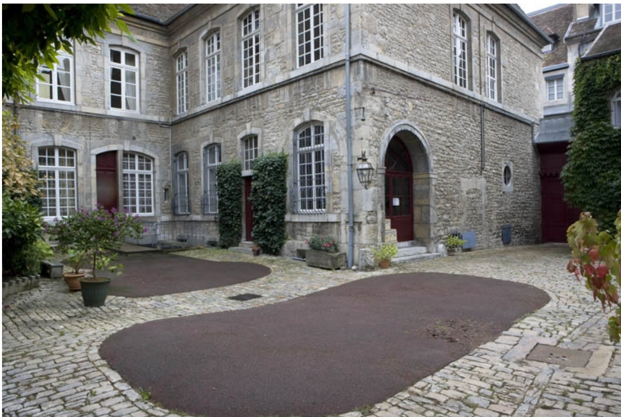
Vue d'ensemble de la cour et du rez-de-chaussée de l'hôtel. 25, Besançon, 3 rue de la Vieille Monnaie, lieudit : îlot Ronchaux