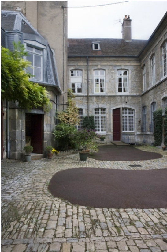
Vue d'ensemble des façades sur cour de l'hôtel.

25, Besançon, 3 rue de la Vieille Monnaie, lieudit : îlot Ronchaux