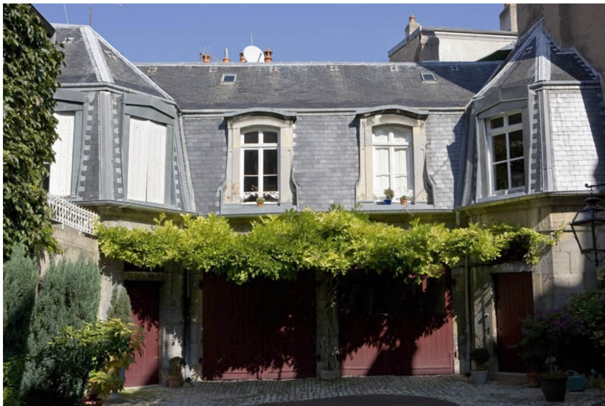
Vue d'ensemble du bâtiment des communs situé en fond de cour.

25, Besançon, 3 rue de la Vieille Monnaie, lieudit : îlot Ronchaux