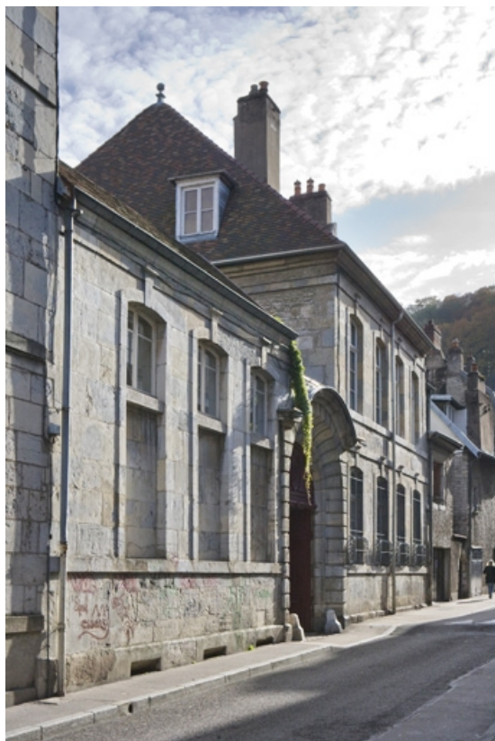
Vue d'ensemble depuis la rue, de trois quarts gauche.

25, Besançon, 3 rue de la Vieille Monnaie, lieudit : îlot Ronchaux