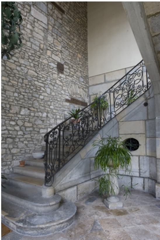
Intérieur : détail de la première volée de l'escalier d'honneur. 25, Besançon, 3 rue de la Vieille Monnaie, lieudit : îlot Ronchaux