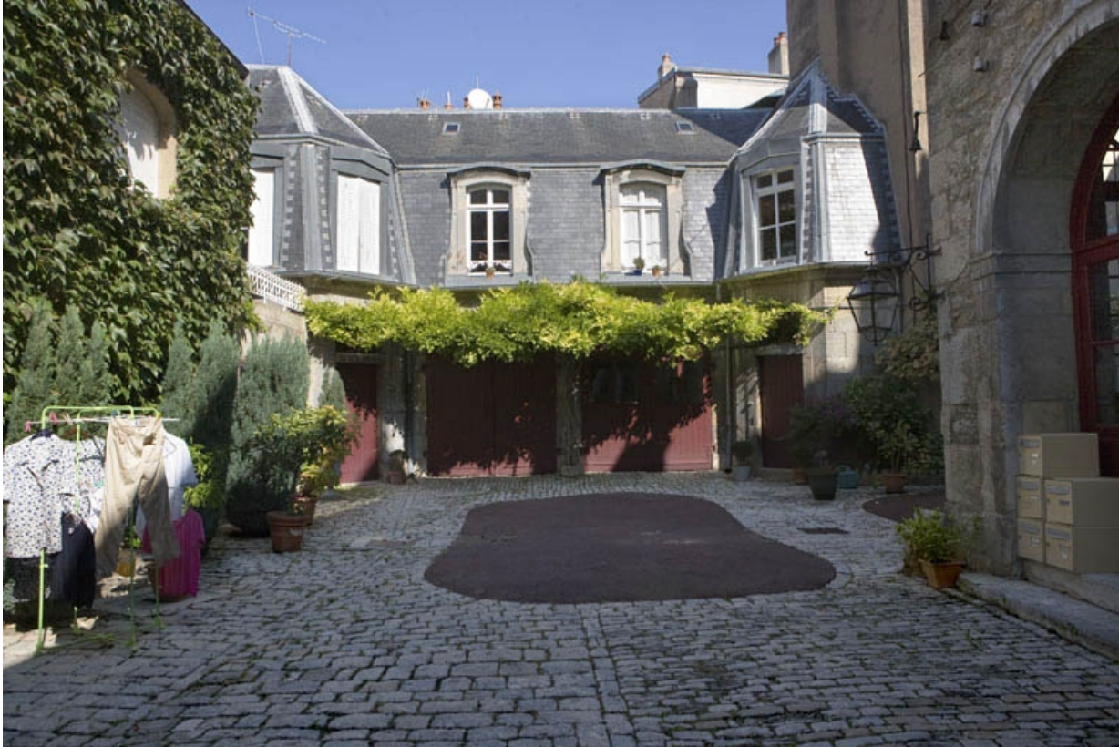
Vue d'ensemble de la cour depuis l'entrée.

25, Besançon, 3 rue de la Vieille Monnaie, lieudit : îlot Ronchaux