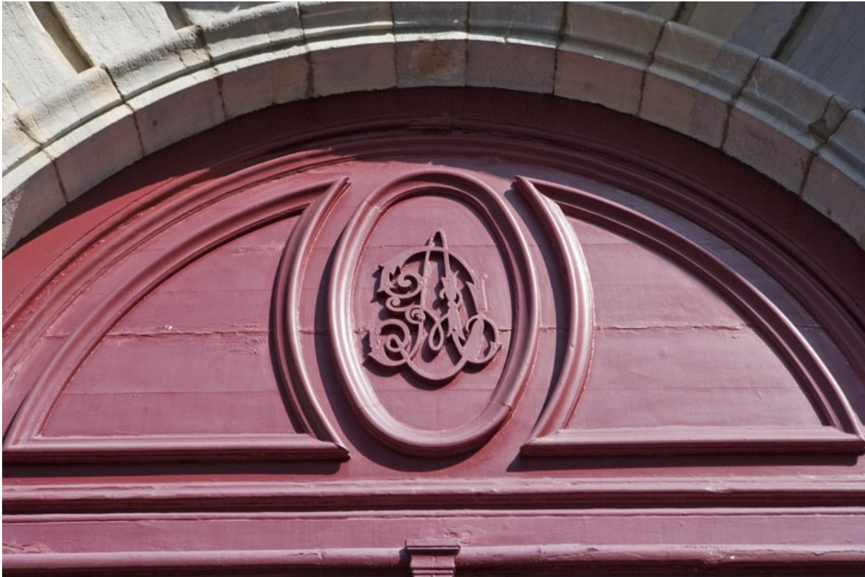
Détail du tympan en menuiserie du portail d'entrée.

25, Besançon, 3 rue de la Vieille Monnaie, lieudit : îlot Ronchaux