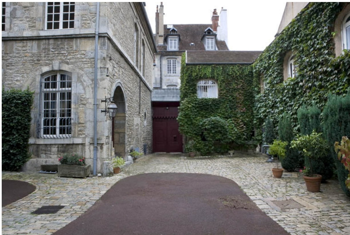
Vue d'ensemble de la cour depuis le bâtiment des communs.

25, Besançon, 3 rue de la Vieille Monnaie, lieudit : îlot Ronchaux