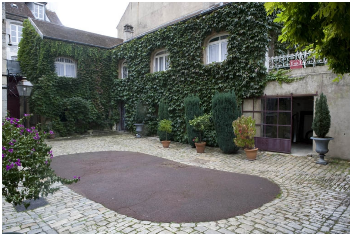
Vue d'ensemble du logis secondaire à l'entrée de la cour.

25, Besançon, 3 rue de la Vieille Monnaie, lieudit : îlot Ronchaux