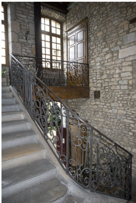
Intérieur : détail de la rampe en fer forgé de l'escalier d'honneur.

25, Besançon, 3 rue de la Vieille Monnaie, lieudit : îlot Ronchaux