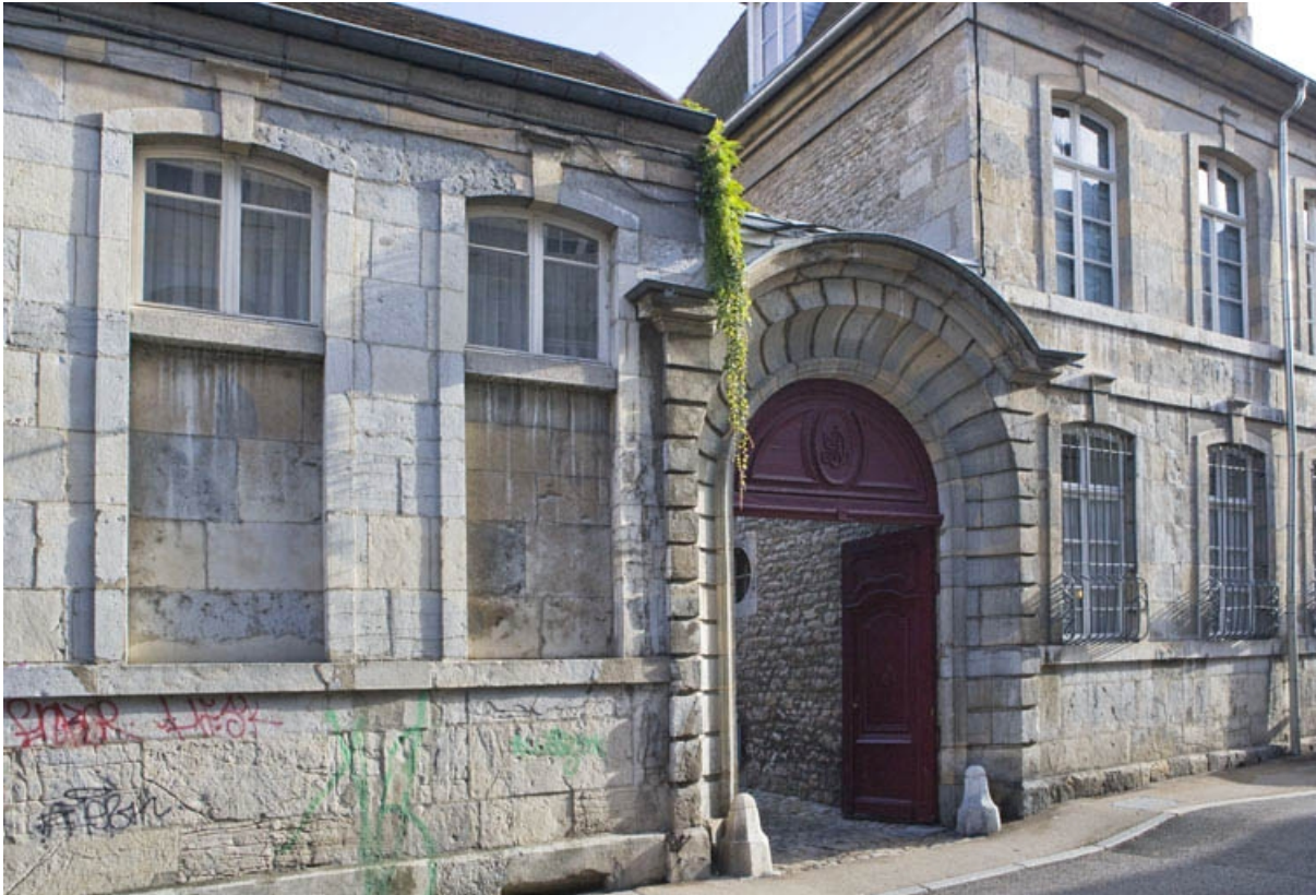
Détail du portail d'entrée, de trois quarts gauche.

25, Besançon, 3 rue de la Vieille Monnaie, lieudit : îlot Ronchaux