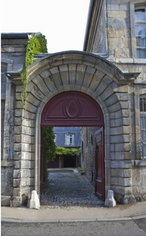
Détail du portail d'entrée et de la cour, de face.

25, Besançon, 3 rue de la Vieille Monnaie, lieudit : îlot Ronchaux