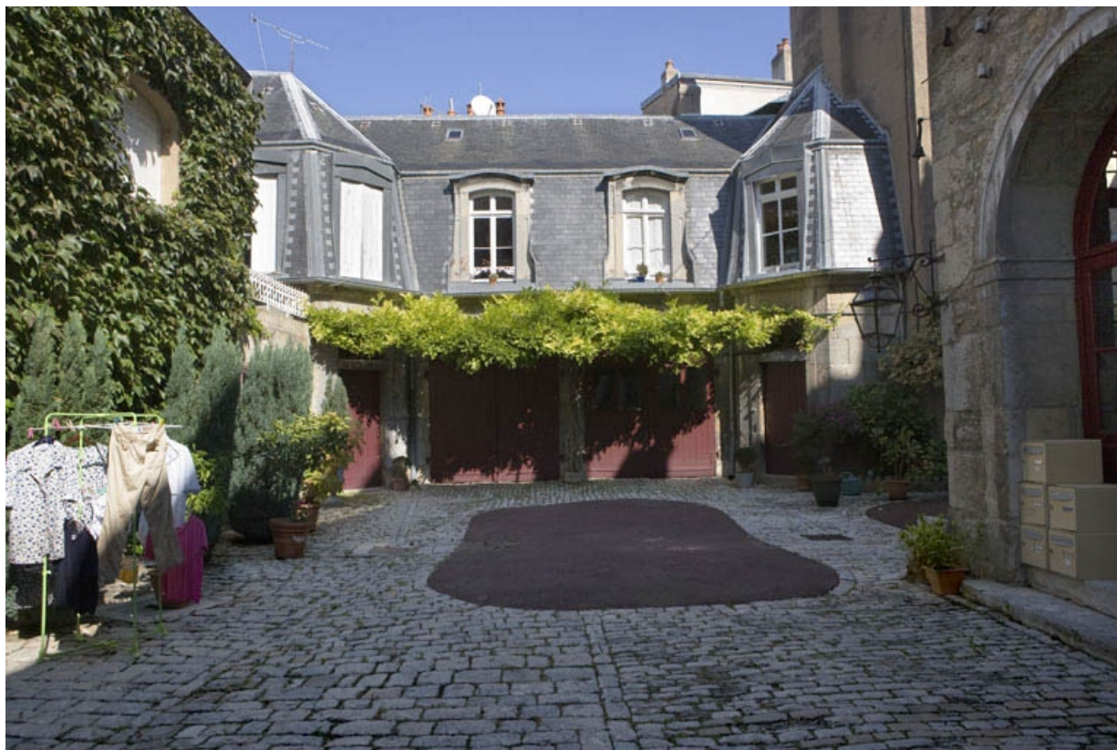
Vue d'ensemble de la cour depuis l'entrée.

25, Besançon, 3 rue de la Vieille Monnaie, lieudit : îlot Ronchaux