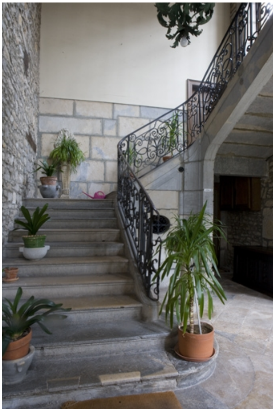
Intérieur : vue d'ensemble de l'escalier d'honneur.

25, Besançon, 3 rue de la Vieille Monnaie, lieudit : îlot Ronchaux