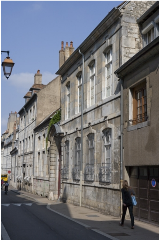
Vue d'ensemble depuis la rue, de trois quarts droit.

25, Besançon, 3 rue de la Vieille Monnaie, lieudit : îlot Ronchaux