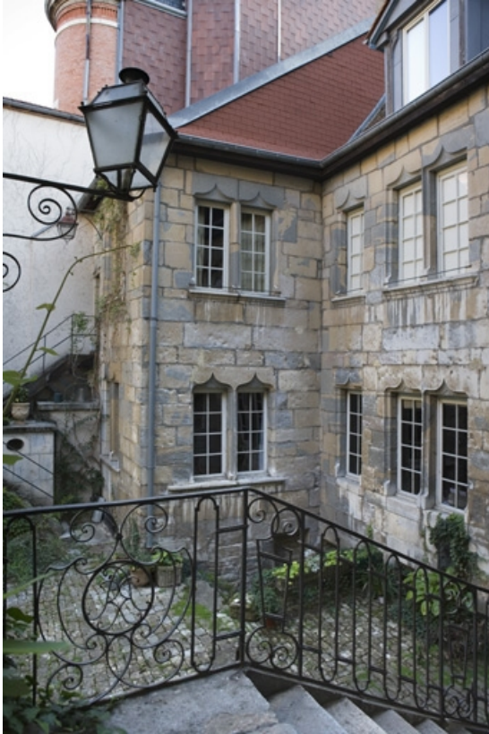
Façade postérieure du logis depuis l'escalier extérieur, de trois quarts droit. 25, Besançon, 36 rue Renan, lieudit : îlot Ronchaux