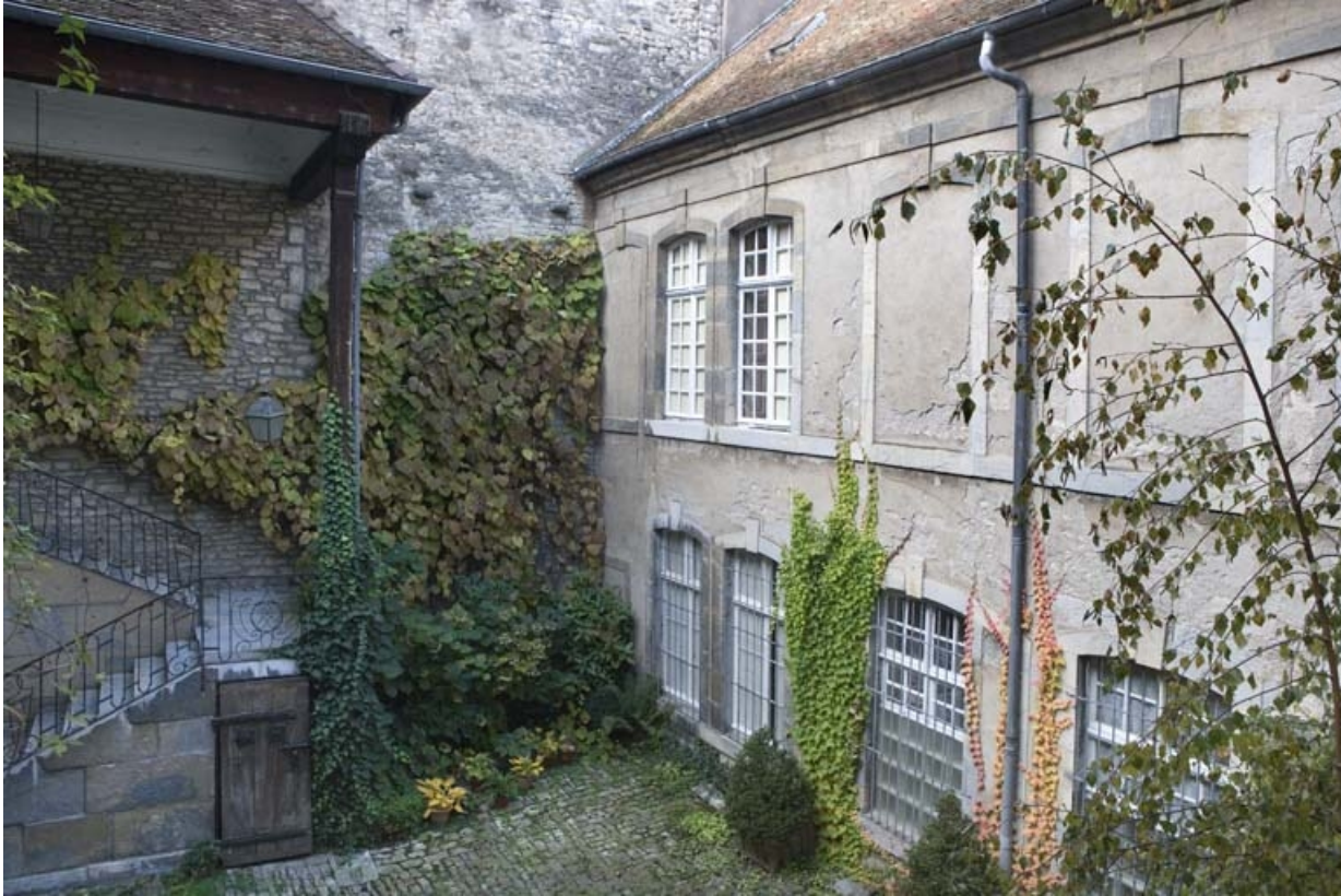
Détail du fond de la cour, de trois quarts droit.

25, Besançon, 36 rue Renan, lieudit : îlot Ronchaux