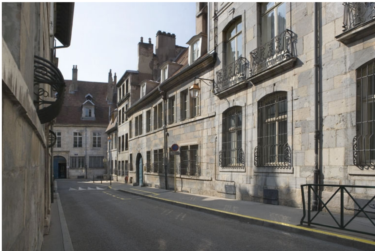
Vue d'ensemble du logis principal dans l'alignement de la rue.

25, Besançon, 36 rue Renan, lieudit : îlot Ronchaux