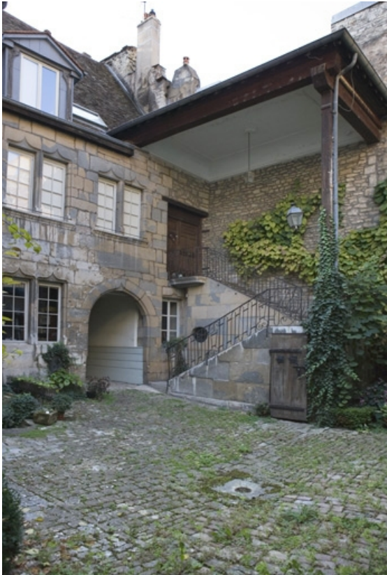
Vue d'ensemble de l'escalier extérieur, de trois quarts droit.

25, Besançon, 36 rue Renan, lieudit : îlot Ronchaux