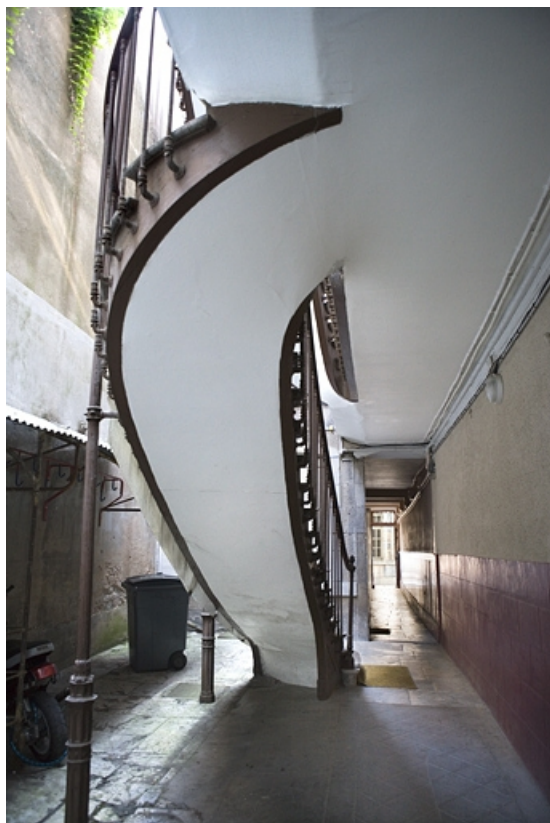
Détail de l'escalier à cage ouverte sur cour, depuis le fond de la première cour. 25, Besançon, 30 rue Renan, lieudit : îlot Ronchaux