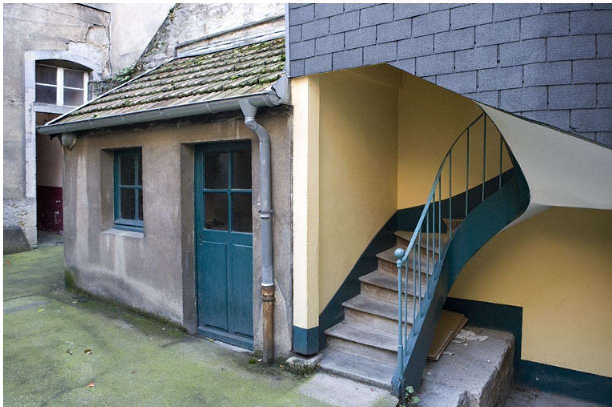
Détail de la buanderie dans la deuxième cour. 25, Besançon, 30 rue Renan, lieudit : îlot Ronchaux