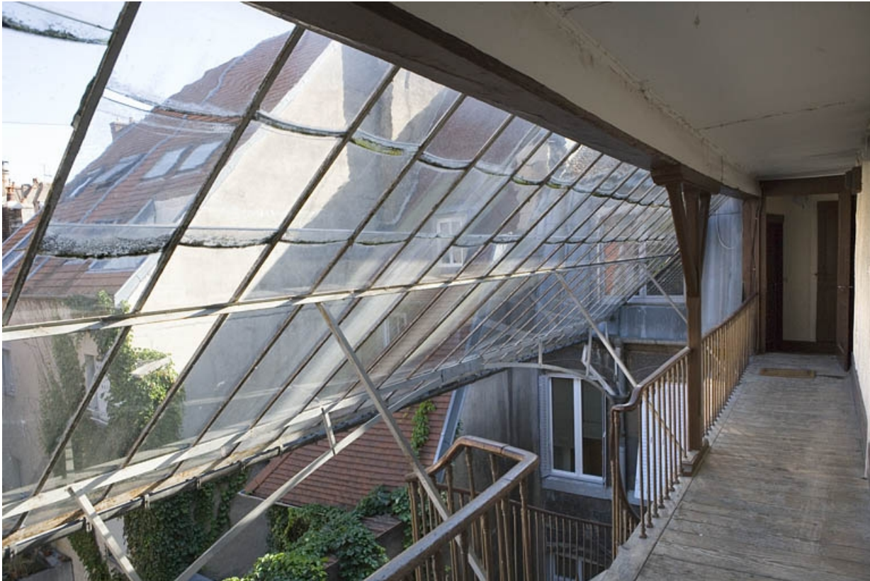
Détail de la verrière sur l'escalier à cage ouverte de la première cour.

25, Besançon, 30 rue Renan, lieudit : îlot Ronchaux