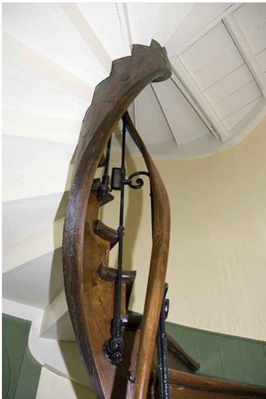
Détail de la rampe et du limon de l'escalier situé dans la tour.

25, Besançon, 34 rue Renan, lieudit : îlot Ronchaux