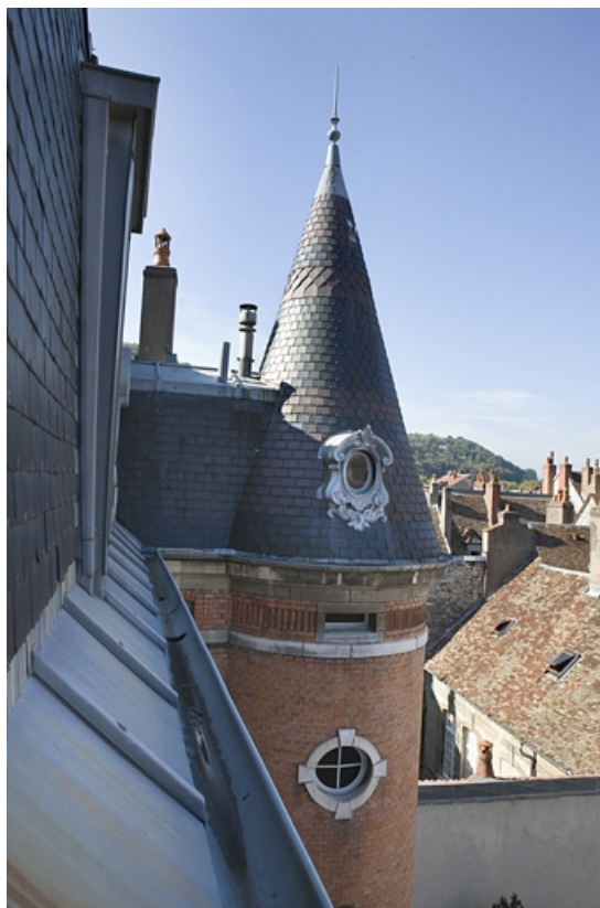
Détail du dernier étage et du toit de la tour d'escalier.

25, Besançon, 34 rue Renan, lieudit : îlot Ronchaux