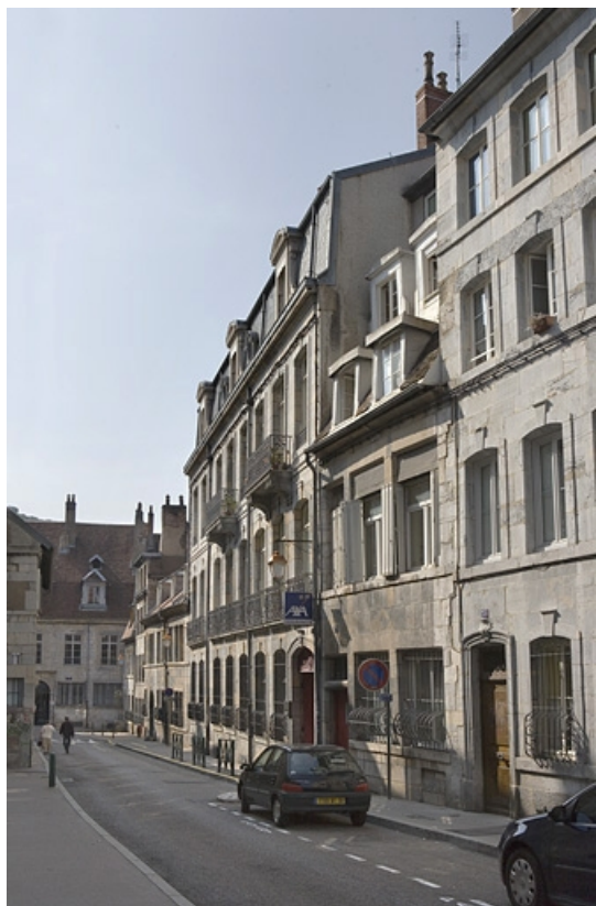
Vue d'ensemble du logis principal dans l'alignement de la rue.

25, Besançon, 34 rue Renan, lieudit : îlot Ronchaux