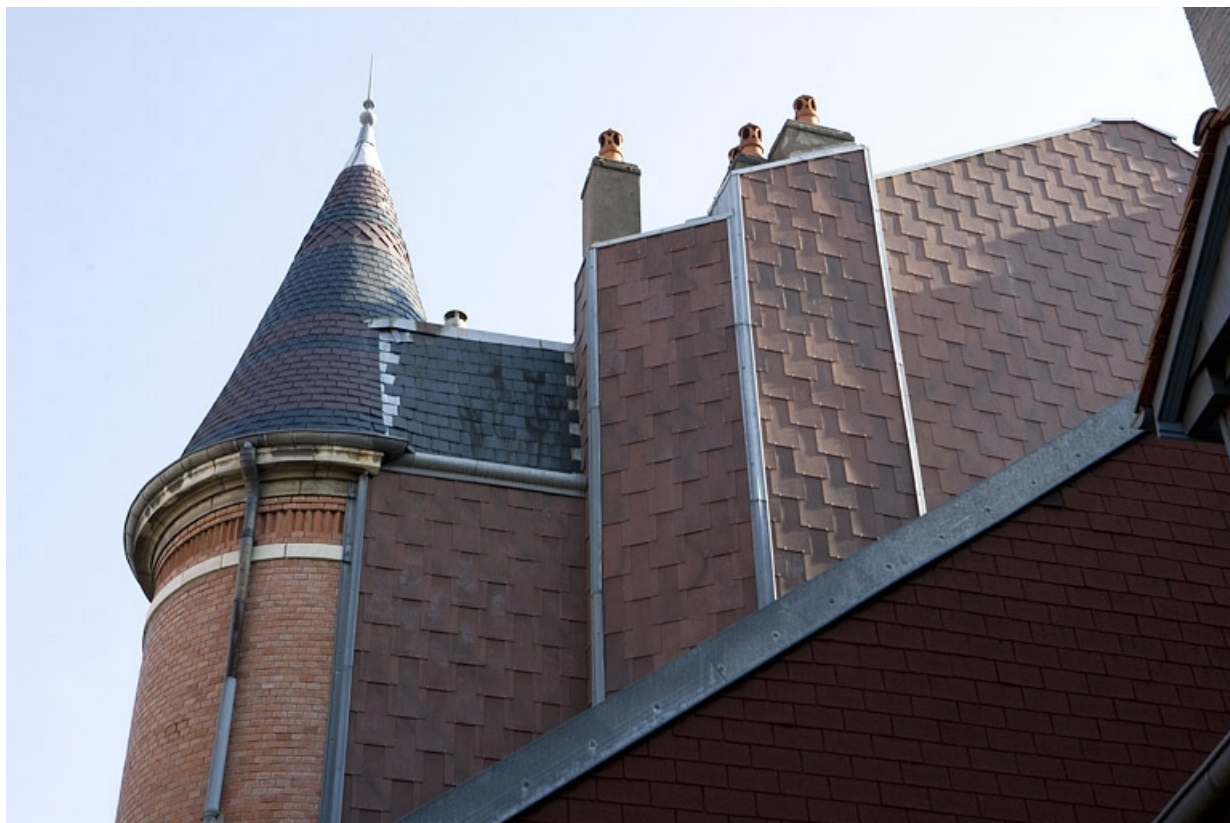
Détail de la partie supérieure de la tour d'escalier au niveau de la toiture du logis principal.

25, Besançon, 34 rue Renan, lieudit : îlot Ronchaux