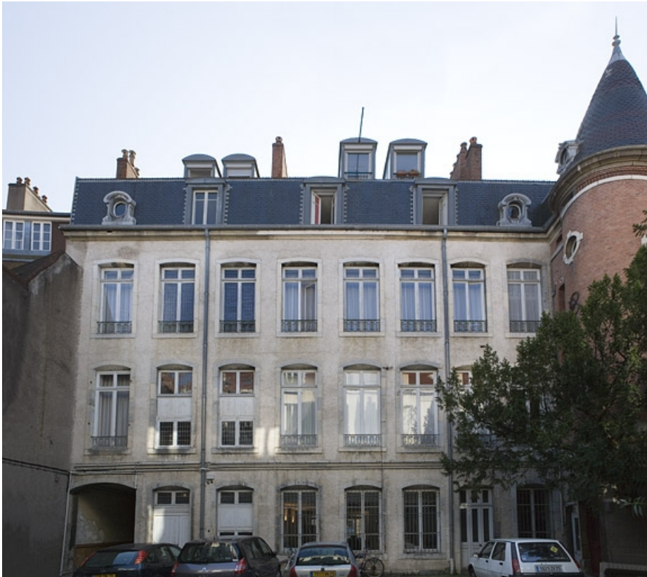
Vue d'ensemble de la façade postérieure du logis principal.

25, Besançon, 34 rue Renan, lieudit : îlot Ronchaux