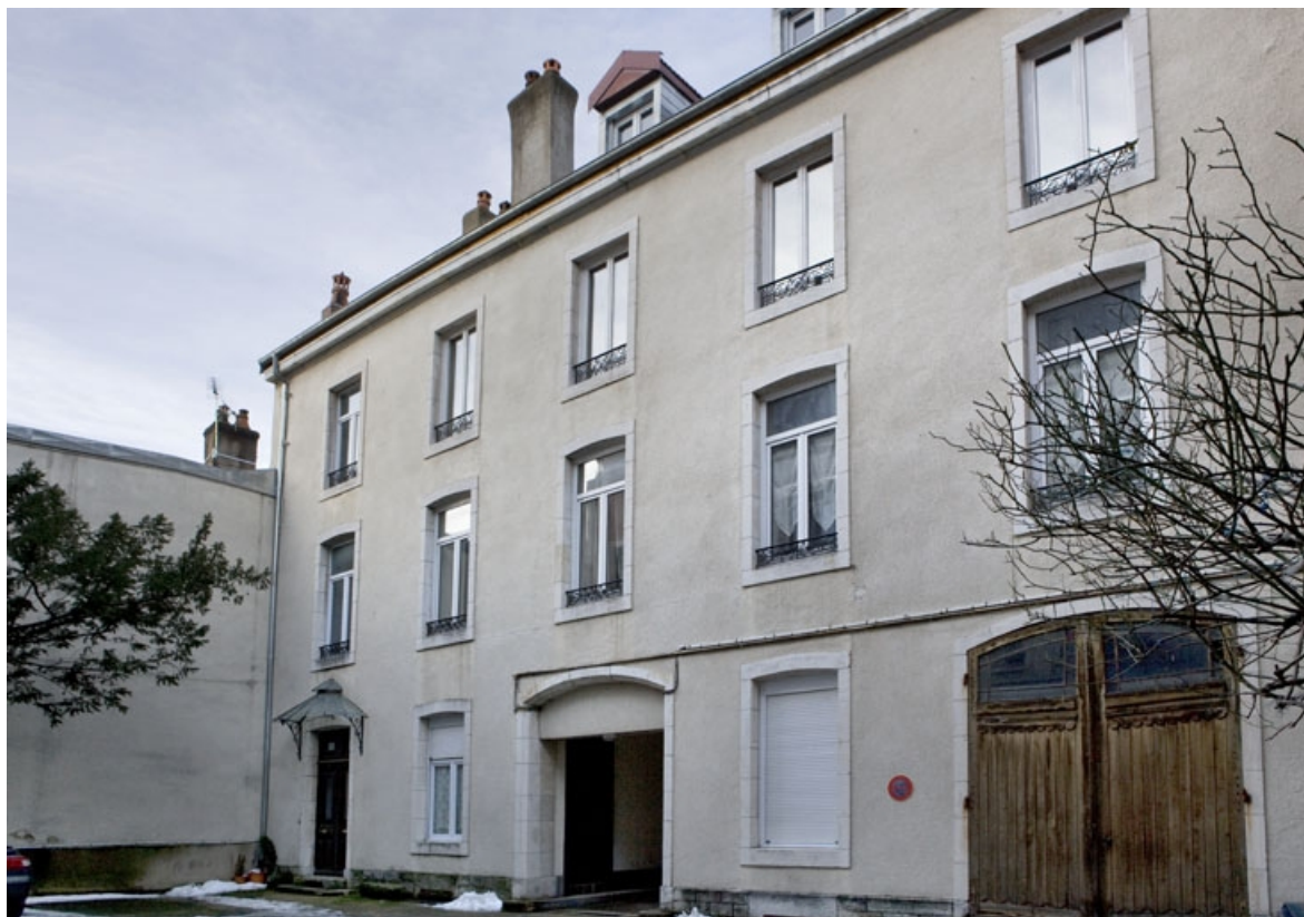
Vue d'ensemble du logis secondaire, de trois quarts droit.

25, Besançon, 34 rue Renan, lieudit : îlot Ronchaux