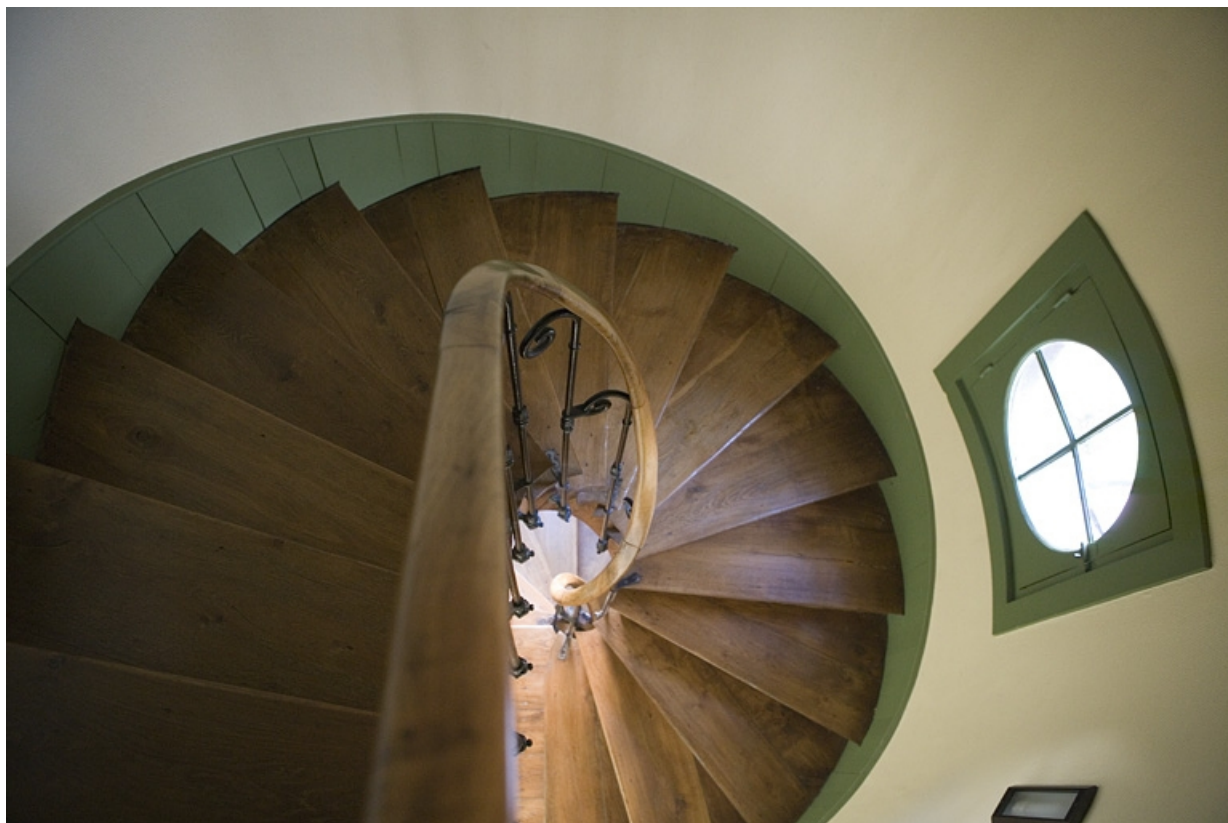
Détail de l'escalier situé dans la tour.

25, Besançon, 34 rue Renan, lieudit : îlot Ronchaux