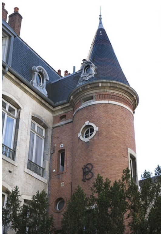
Détail de la partie supérieure de la tour d'escalier, de trois quarts.

25, Besançon, 34 rue Renan, lieudit : îlot Ronchaux