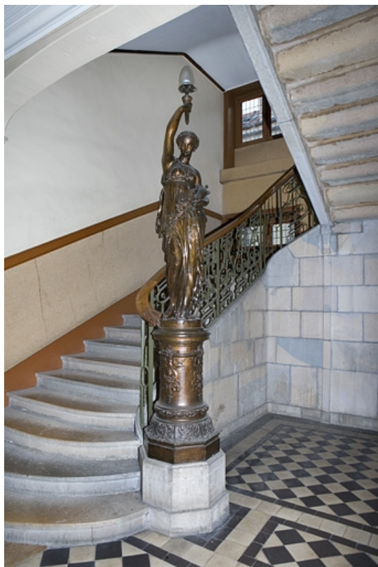
Détail du départ de l'escalier principal couronné d'une statue.

25, Besançon, 34 rue Renan, lieudit : îlot Ronchaux