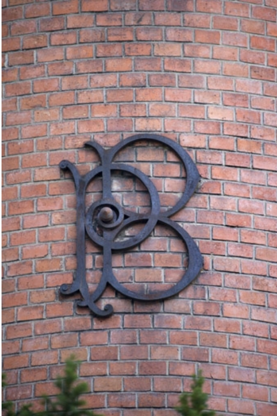
Détail des initiales en fer apposées sur la tour d'escalier.

25, Besançon, 34 rue Renan, lieudit : îlot Ronchaux