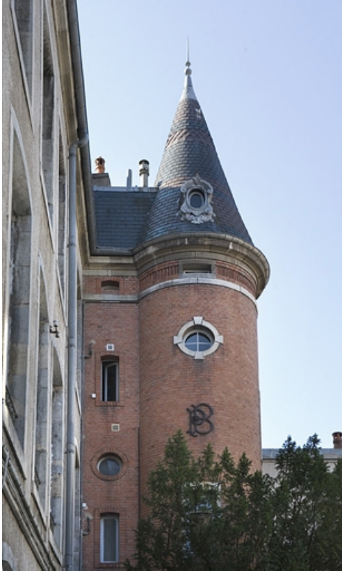
Détail de la partie supérieure de la tour d'escalier, de profil.

25, Besançon, 34 rue Renan, lieudit : îlot Ronchaux