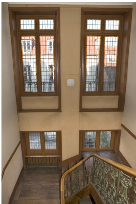
Détail des fenêtres éclairant l'escalier principal. 25, Besançon, 34 rue Renan, lieudit : îlot Ronchaux