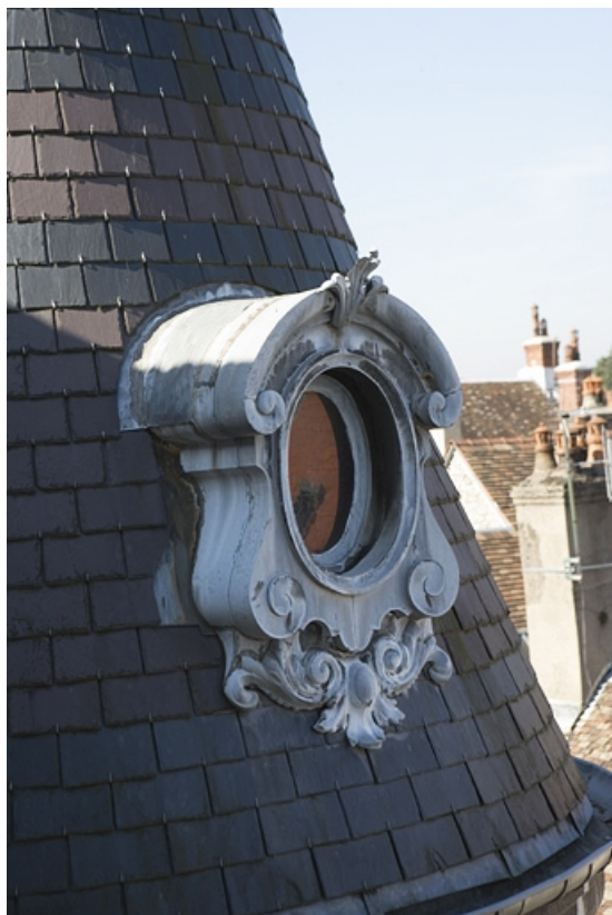
Détail de la lucarne dans le toit de la tour d'escalier.

25, Besançon, 34 rue Renan, lieudit : îlot Ronchaux