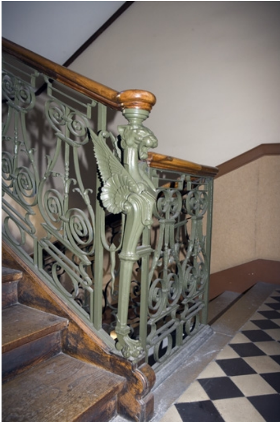
Escalier principal : détail d'un montant de la rampe représentant un griffon.

25, Besançon, 34 rue Renan, lieudit : îlot Ronchaux