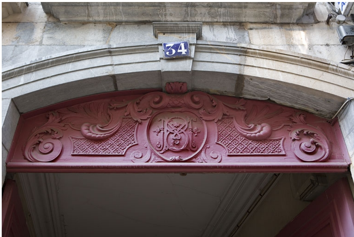
Détail du tympan en menuiserie du portail d'entrée.

25, Besançon, 34 rue Renan, lieudit : îlot Ronchaux