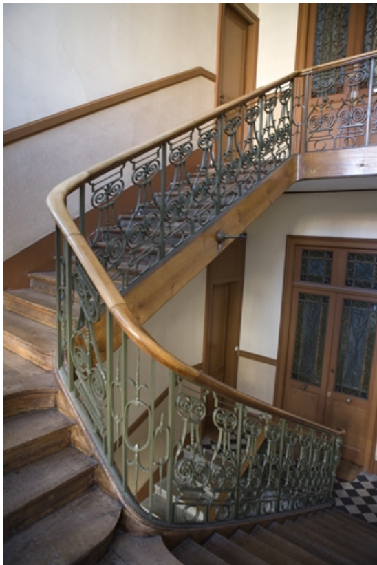
Vue d'ensemble de l'escalier principal.

25, Besançon, 34 rue Renan, lieudit : îlot Ronchaux