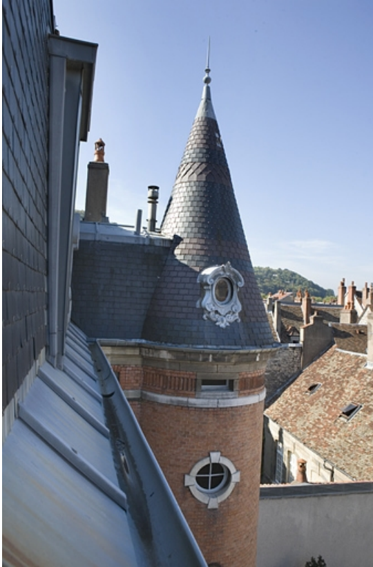
Détail du dernier étage et du toit de la tour d'escalier.

25, Besançon, 34 rue Renan, lieudit : îlot Ronchaux