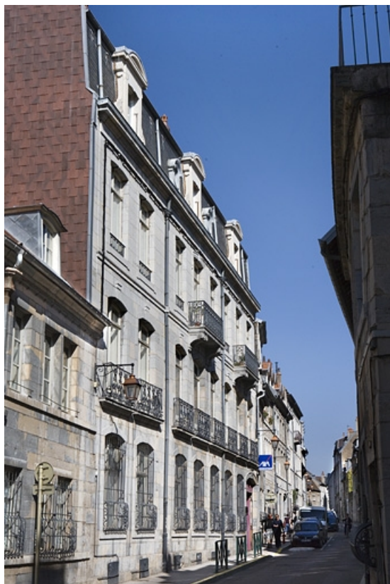
Vue d'ensemble du logis principal sur rue, de trois quarts gauche.

25, Besançon, 34 rue Renan, lieudit : îlot Ronchaux