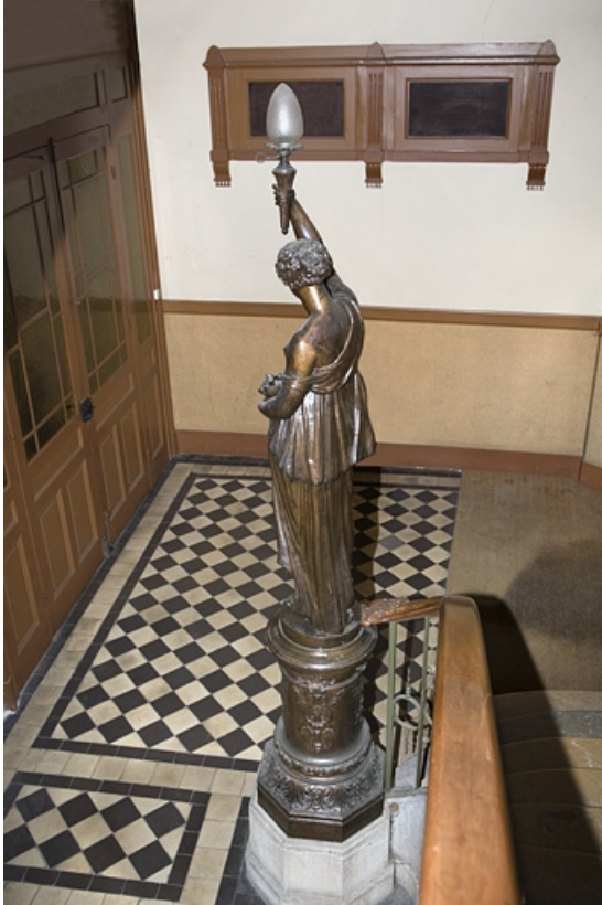
Détail du départ de l'escalier principal : statue vue de dos.

25, Besançon, 34 rue Renan, lieudit : îlot Ronchaux