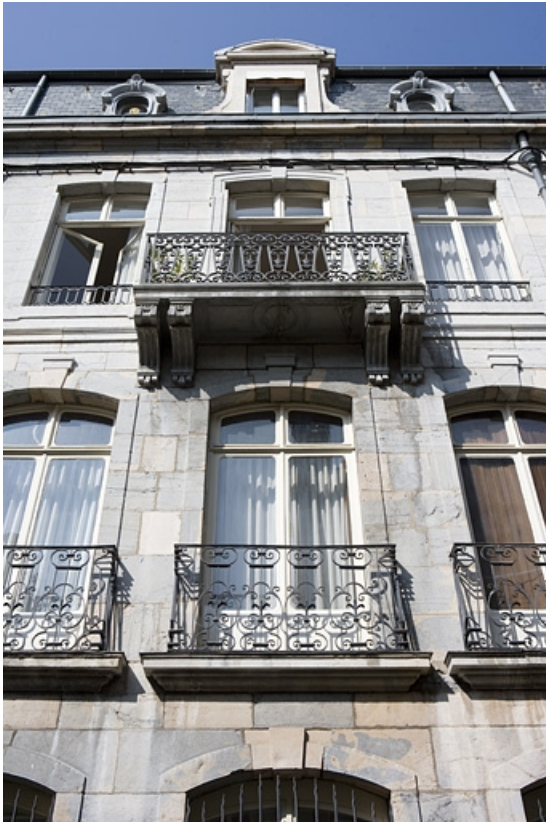
Détail de la travée centrale de la façade antérieure du logis principal à partir du premier étage.

25, Besançon, 34 rue Renan, lieudit : îlot Ronchaux