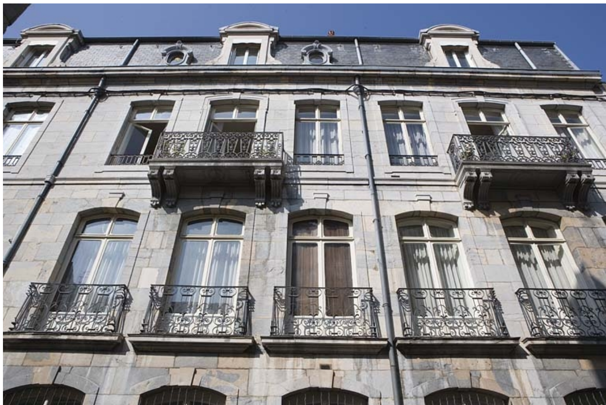
Façade antérieure du logis principal à partir du premier étage, de face.

25, Besançon, 34 rue Renan, lieudit : îlot Ronchaux