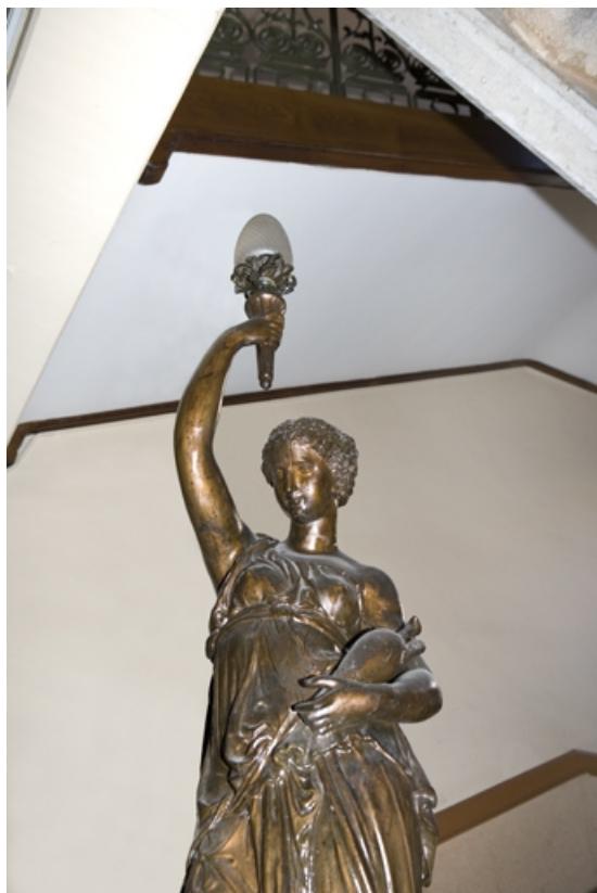
Détail du départ de l'escalier principal : statue vue à mi-corps.

25, Besançon, 34 rue Renan, lieudit : îlot Ronchaux