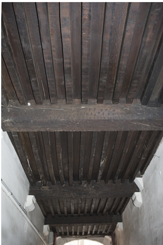
Détail du plafond à la française du passage cocher. 25, Besançon, 20 rue Renan, lieudit : îlot Ronchaux