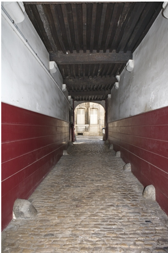
Passage cocher, depuis la cour.

25, Besançon, 20 rue Renan, lieudit : îlot Ronchaux