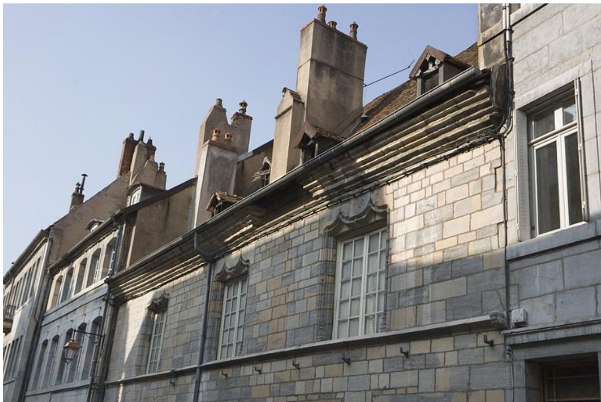
Détail du premier étage sur rue.

25, Besançon, 20 rue Renan, lieudit : îlot Ronchaux