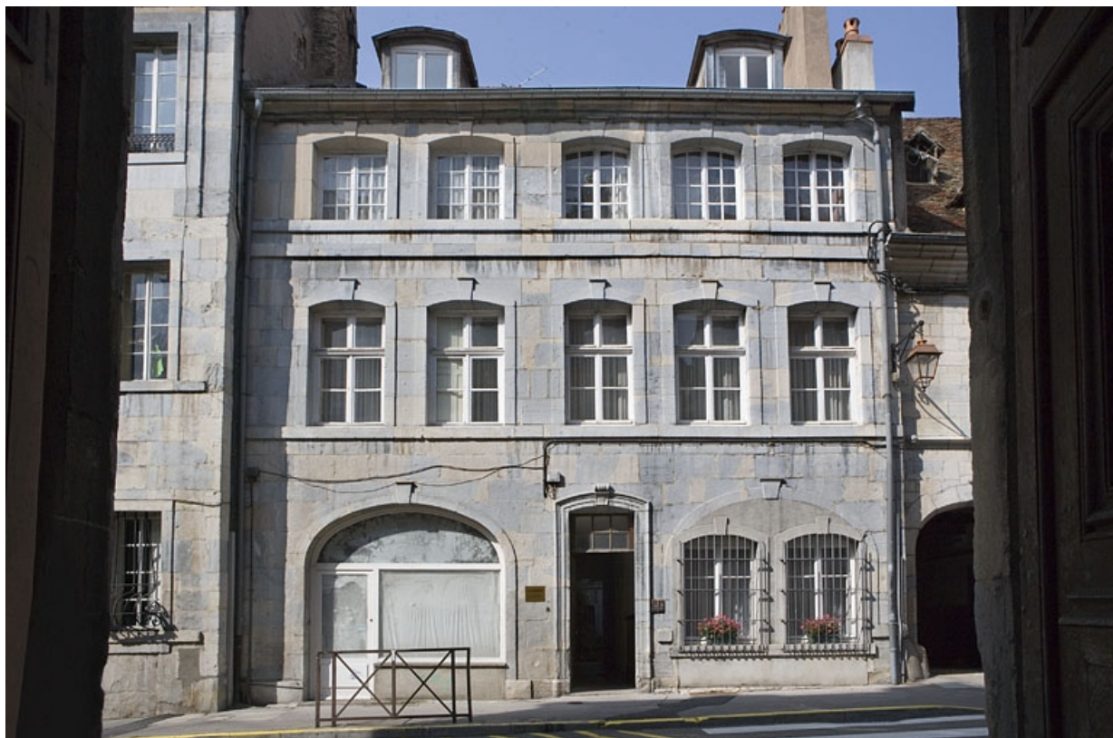
Vue d'ensemble du logis sur rue, de face.

25, Besançon, 22 rue Renan, lieudit : îlot Ronchaux