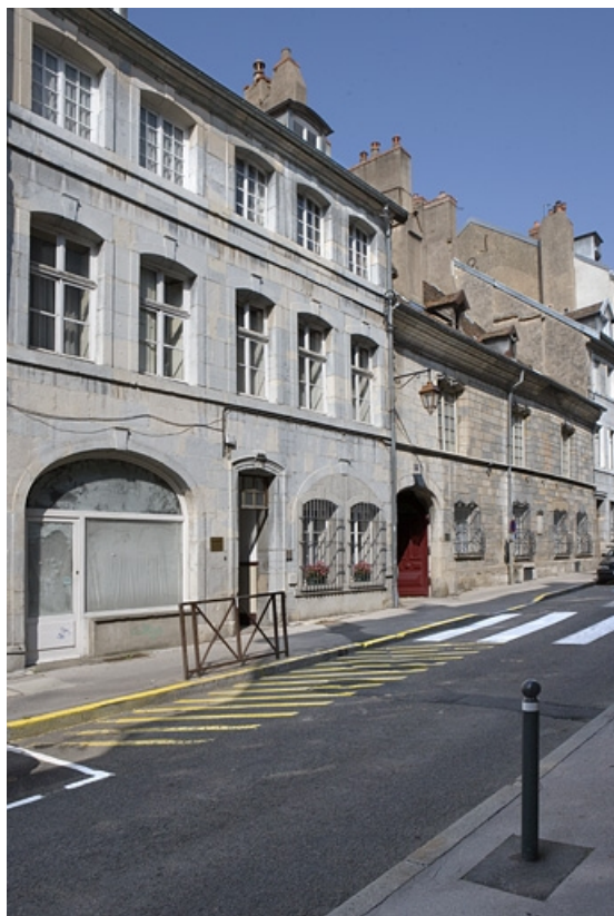
Vue d'ensemble du logis sur rue, de trois quarts gauche.

25, Besançon, 22 rue Renan, lieudit : îlot Ronchaux