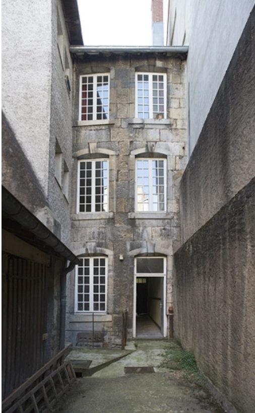
Vue d'ensemble de la façade postérieure du logis secondaire sur la deuxième cour. 25, Besançon, 22 rue Renan, lieudit : îlot Ronchaux