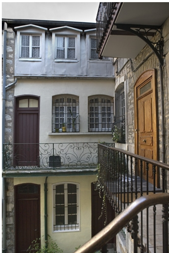
Détail de l'aile droite sur cour depuis l'escalier à cage ouverte.

25, Besançon, 22 rue Renan, lieudit : îlot Ronchaux