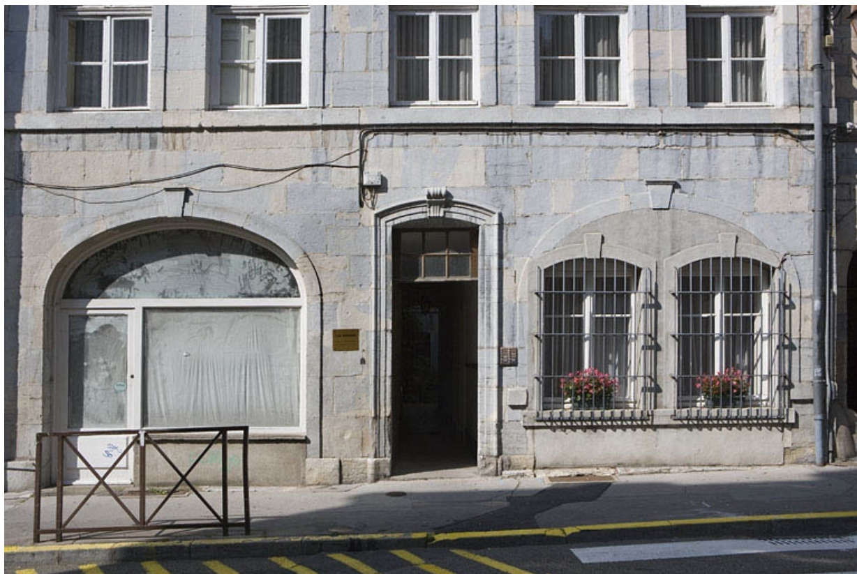
Logis sur rue, détail du rez-de-chaussée.

25, Besançon, 22 rue Renan, lieudit : îlot Ronchaux