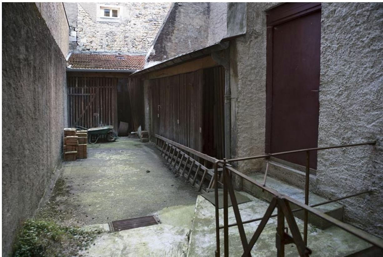
Vue d'ensemble des bûchers dans la deuxième cour.

25, Besançon, 22 rue Renan, lieudit : îlot Ronchaux