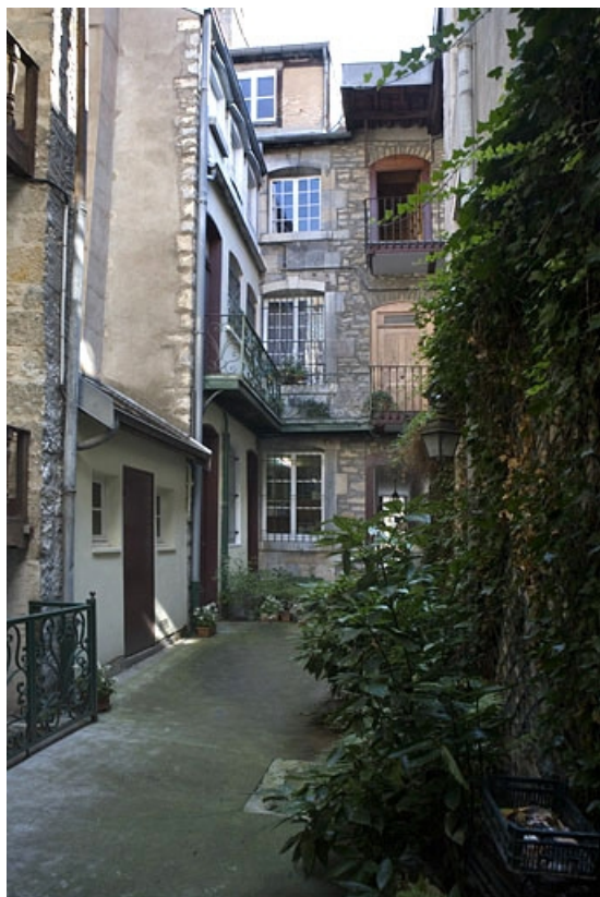
Vue d'ensemble des bâtiments depuis le fond de la cour.

25, Besançon, 22 rue Renan, lieudit : îlot Ronchaux