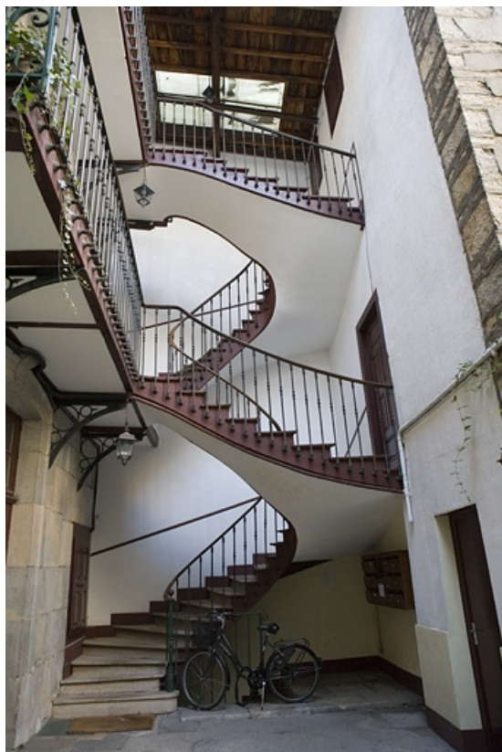
Détail de l'escalier à cage ouverte du logis principal.

25, Besançon, 22 rue Renan, lieu-dit : îlot Ronchaux