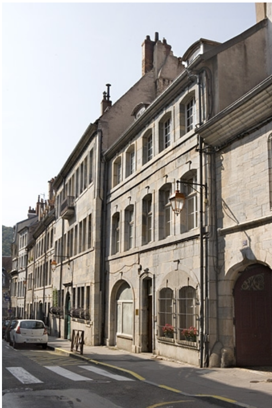
Vue d'ensemble du logis sur rue, de trois quarts droit.

25, Besançon, 22 rue Renan, lieudit : îlot Ronchaux