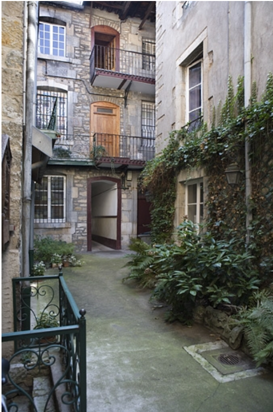
Vue d'ensemble de la façade postérieure du logis sur rue depuis le fond de la cour.

25, Besançon, 22 rue Renan, lieudit : îlot Ronchaux