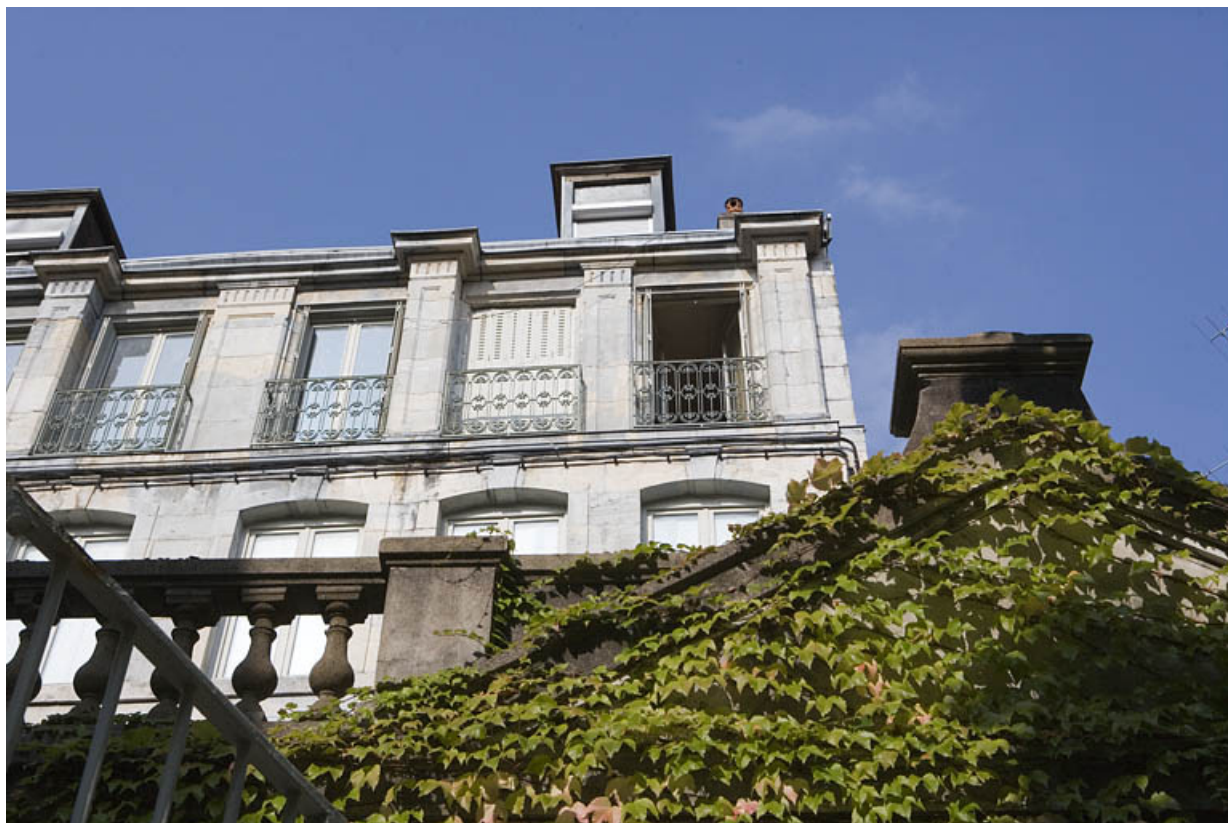
Détail de la surélévation sur rue depuis l'autre côté de la rue.

25, Besançon, 16 rue Renan, lieu-dit : îlot Ronchaux