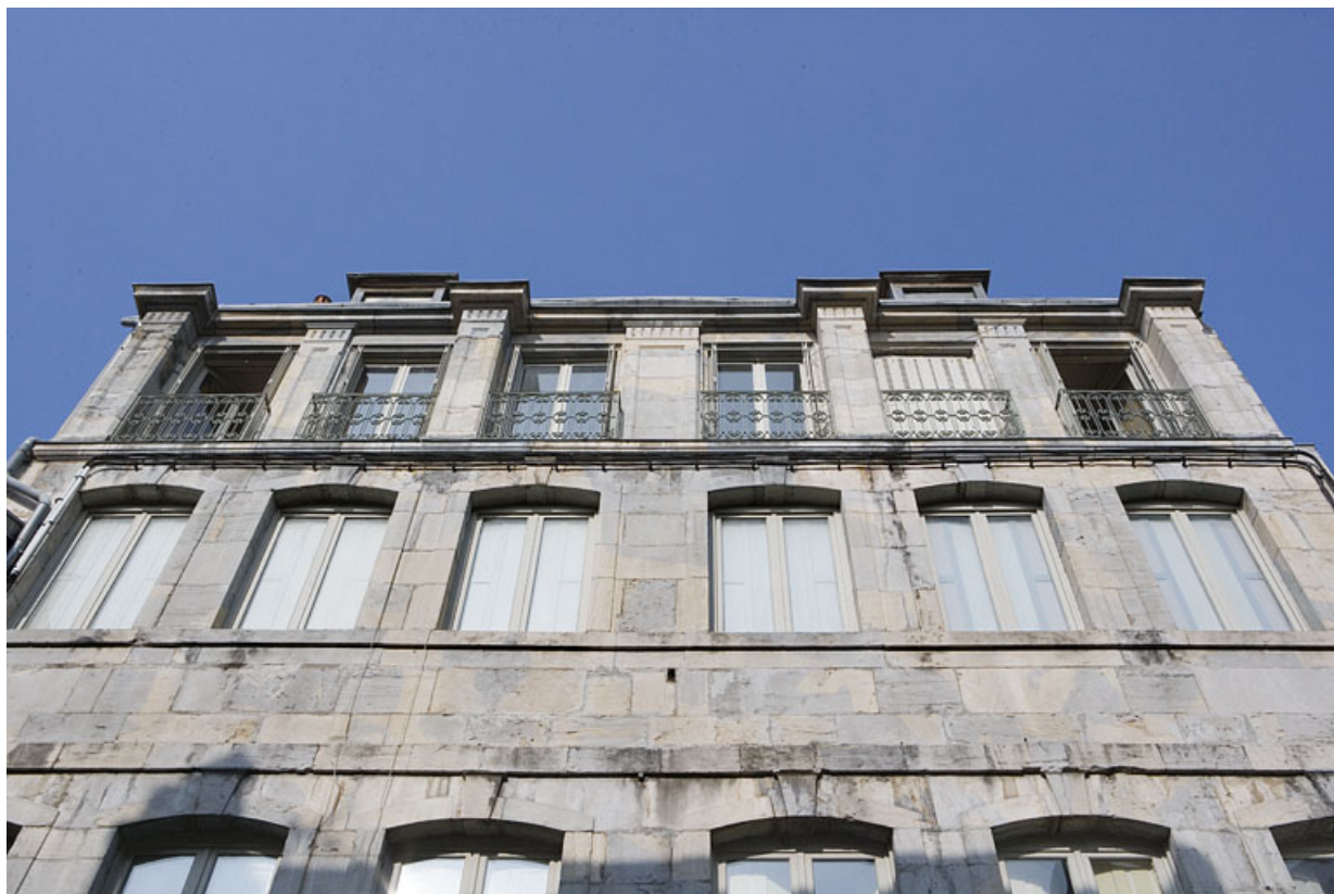
Détail des deuxième et troisième étages sur rue. 25, Besançon, 16 rue Renan, lieudit : îlot Ronchoux