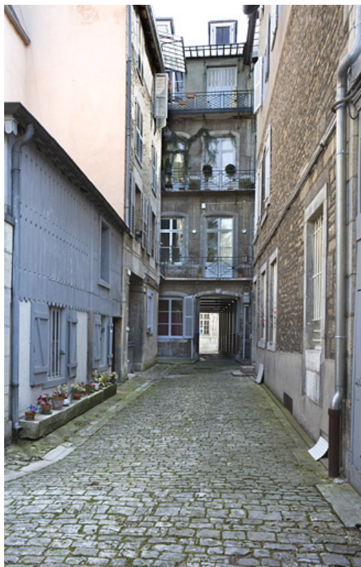
Vue d'ensemble de la façade postérieure du logis principal depuis le fond de la cour.

25, Besançon, 16 rue Renan, lieudit : îlot Ronchaux