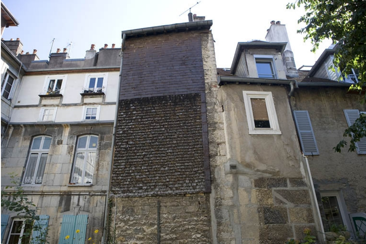
Détail de la façade postérieure de l'aile des bûchers sur jardin.

25, Besançon Grande Rue 136, lieudit : îlot Ronchaux