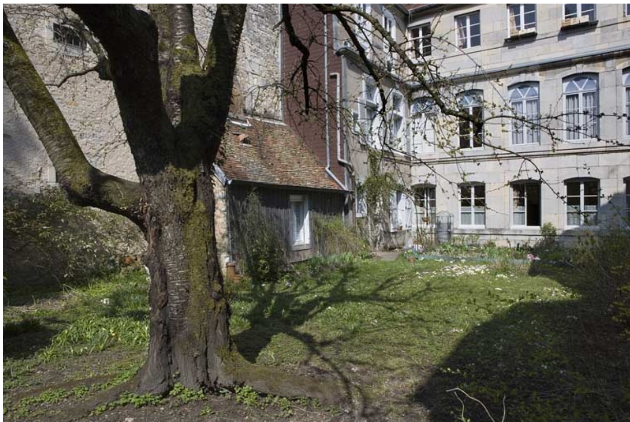
Vue partielle de la façade postérieure du logis secondaire depuis le fond du jardin.

25, Besançon Grande Rue 136, lieudit : îlot Ronchaux