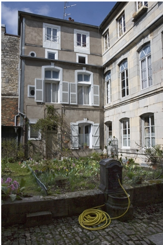
Vue partielle de la façade postérieure du logis secondaire sur jardin, de trois quarts droit. 25, Besançon Grande Rue 136, lieudit : îlot Ronchaux