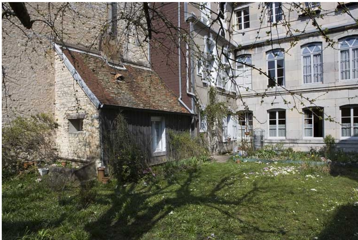
Détail de l'édicule adossé (buanderie ?) contre le mur droit du jardin.

25, Besançon Grande Rue 136, lieudit : îlot Ronchaux