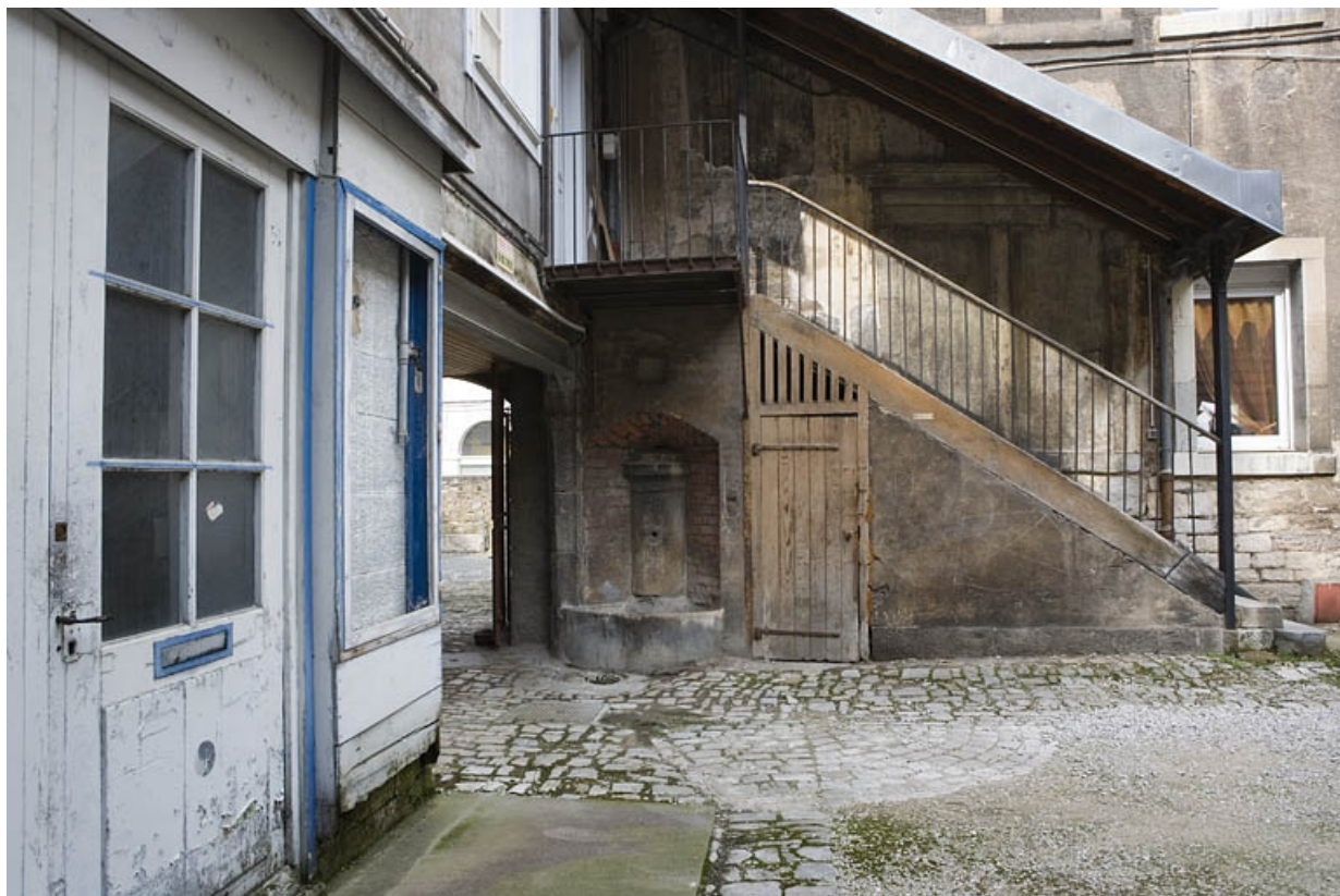
Détail de l'escalier extérieur à l'extrémité de l'aile.

25, Besançon Grande Rue 132, 130, 128, lieudit : îlot Ronchaux