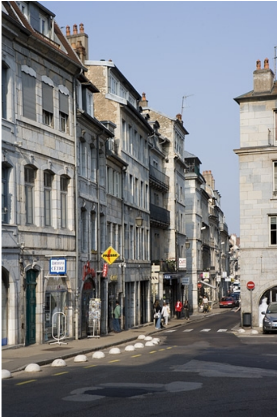
Façade sur rue, vue éloignée de trois quarts gauche.

25, Besançon Grande Rue 132, 130, 128, lieudit : îlot Ronchaux