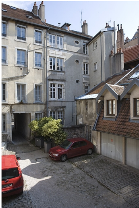
Façade postérieure du logis principal sur rue, partie droite.

25, Besançon Grande Rue 132, 130, 128, lieudit : îlot Ronchaux