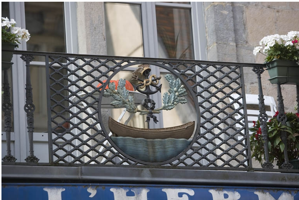
Détail du décor en médaillon au centre du balcon.

25, Besançon Grande Rue 132, 130, 128, lieudit : îlot Ronchaux