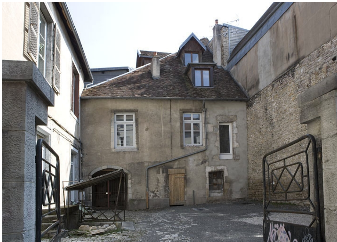
Vue d'ensemble de la cour secondaire donnant rue Ronchaux.

25, Besançon Grande Rue 132, 130, 128, lieudit : îlot Ronchaux