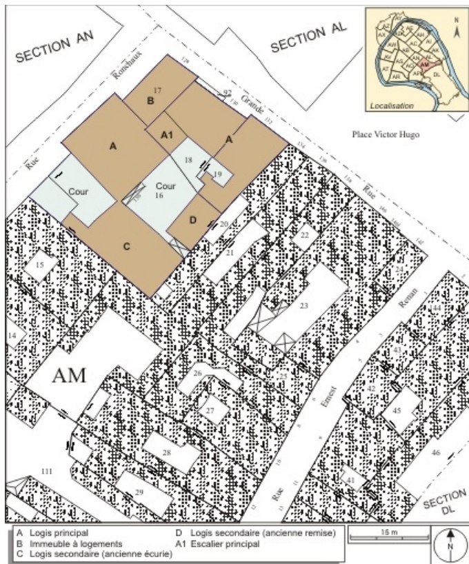
Plan masse et de situation. Extrait du plan cadastral, 1974, section AM. 25, Besançon Grande Rue 132, 130, 128, lieudit : îlot Ronchaux