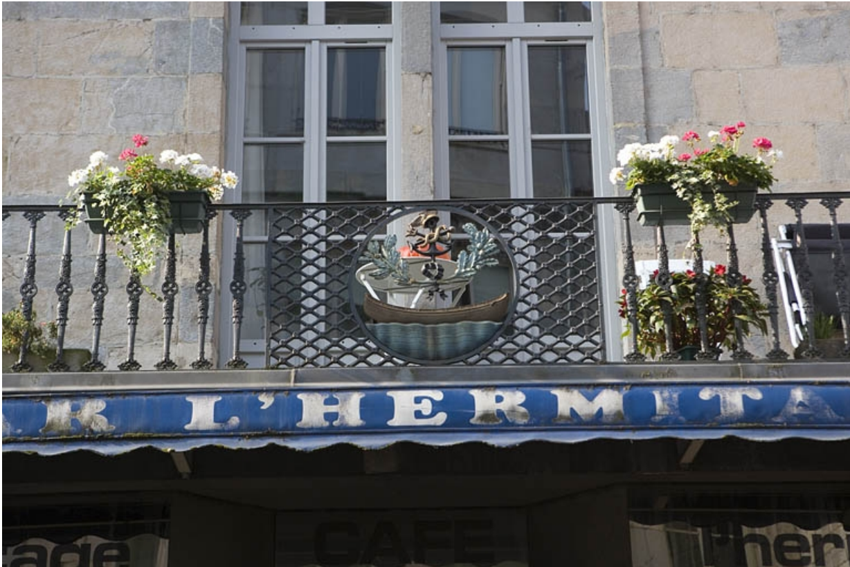
Détail du balcon sur la partie centrale de la façade sur rue, de face.

25, Besançon Grande Rue 132, 130, 128, lieudit : îlot Ronchaux