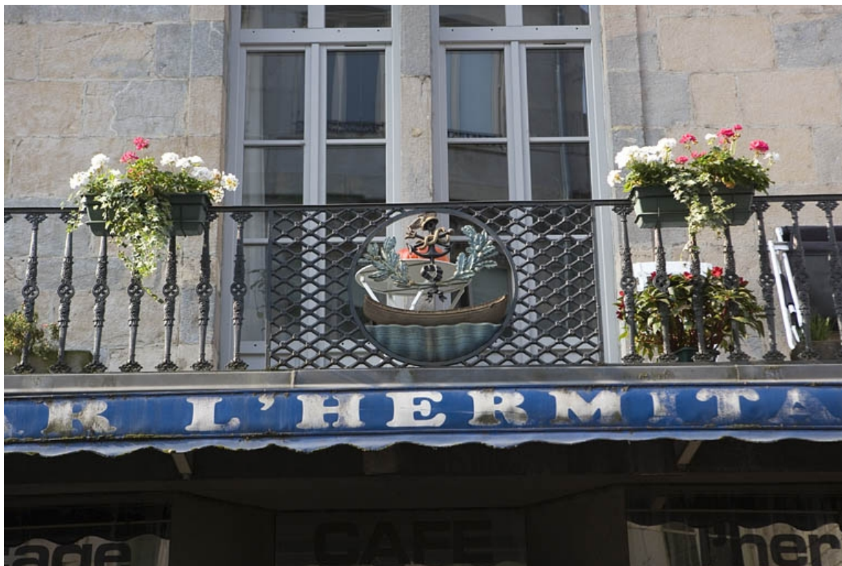
Détail du balcon sur la partie centrale de la façade sur rue, de face.

25, Besançon Grande Rue 132, 130, 128, lieudit : îlot Ronchaux