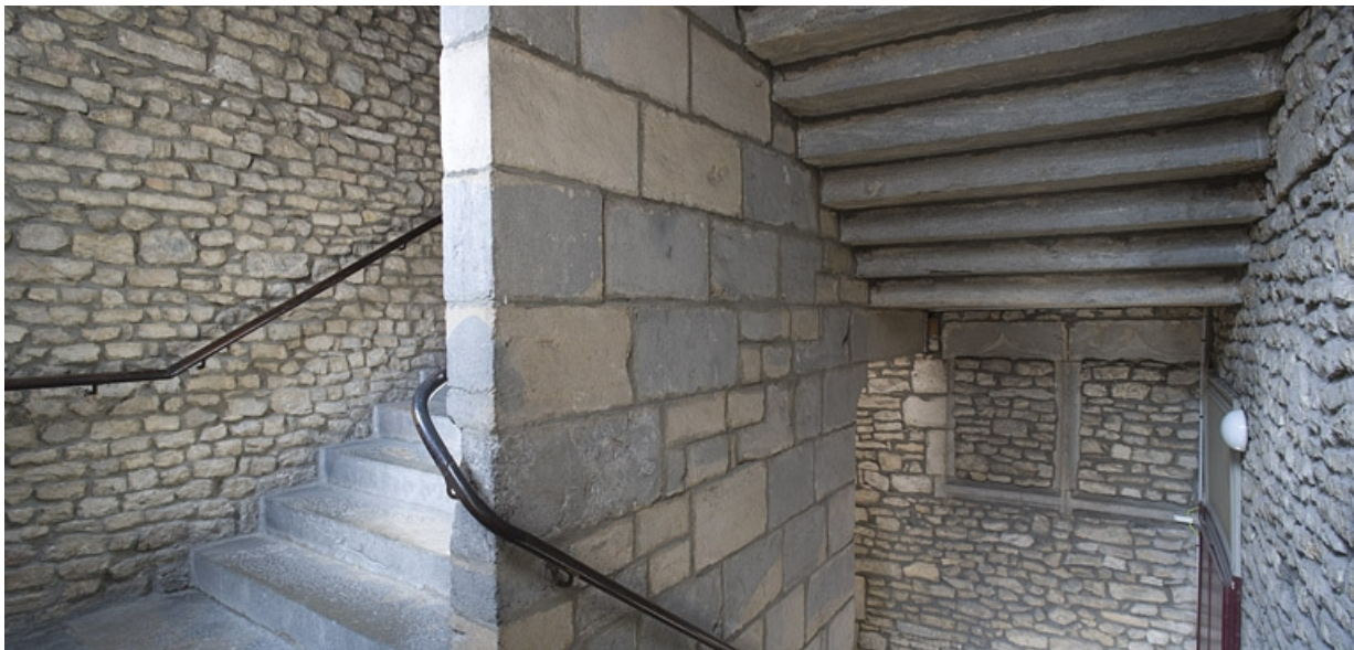
Détail de l'escalier principal en maçonnerie.

25, Besançon Grande Rue 132, 130, 128, lieudit : îlot Ronchaux