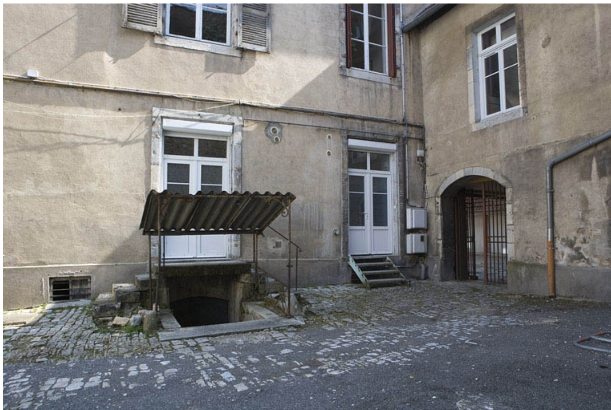
Cour secondaire donnant rue Ronchaux : détail d'une entrée de cave.

25, Besançon Grande Rue 132, 130, 128, lieudit : îlot Ronchaux