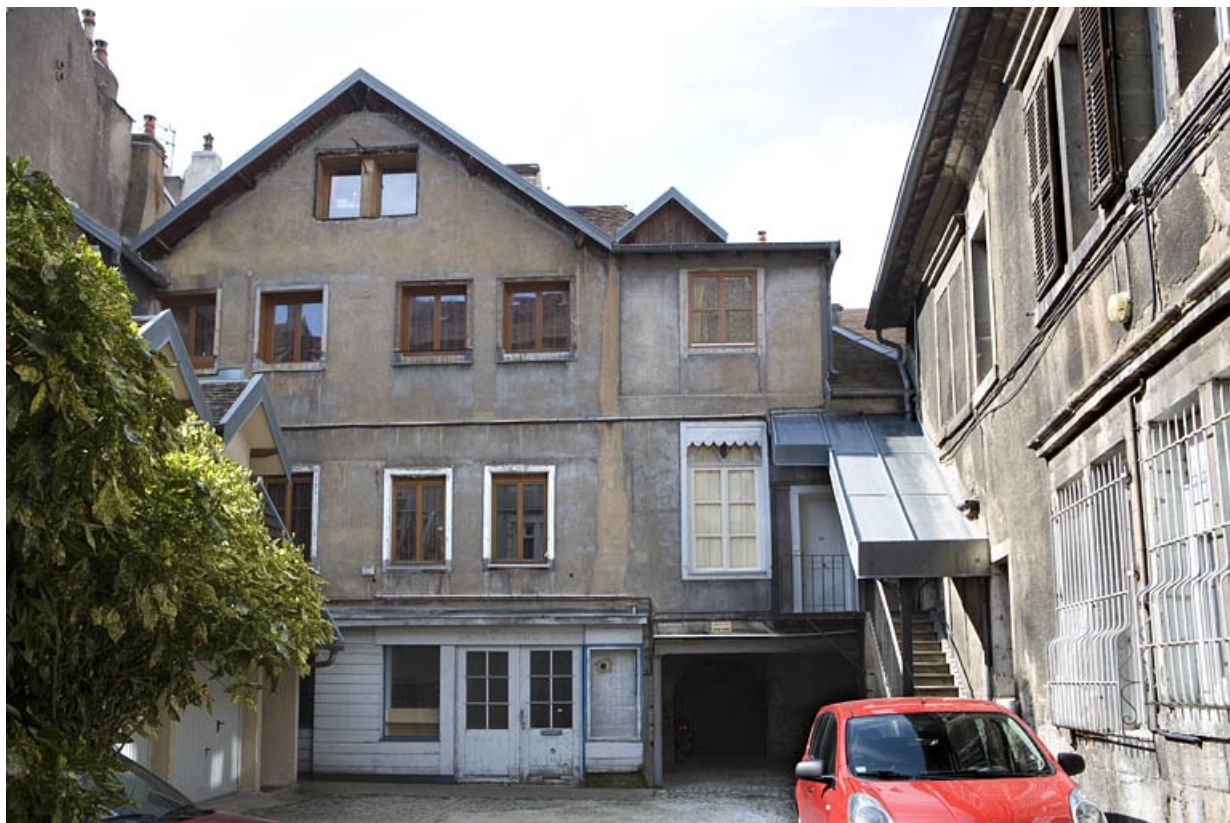
Vue d'ensemble des bâtiments en fond de cour.

25, Besançon Grande Rue 132, 130, 128, lieudit : îlot Ronchaux