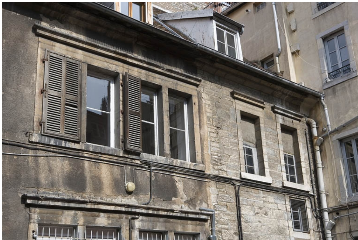
Aile sur cour, détail des fenêtres du premier étage.

25, Besançon Grande Rue 132, 130, 128, lieudit : îlot Ronchaux