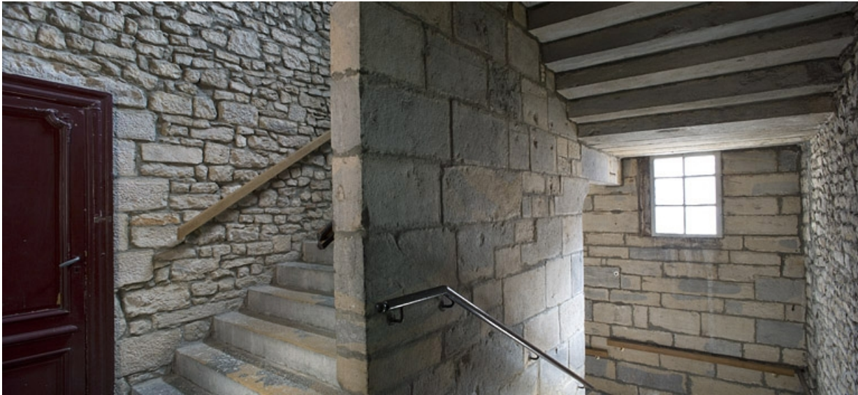
Détail de l'escalier principal en maçonnerie, avec la fenêtre éclairant la cage.

25, Besançon Grande Rue 132, 130, 128, lieudit : îlot Ronchaux