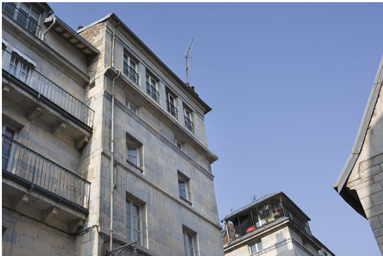
Détail de la partie supérieure de la façade de l'immeuble d'angle.

25, Besançon Grande Rue 132, 130, 128, lieudit : îlot Ronchaux