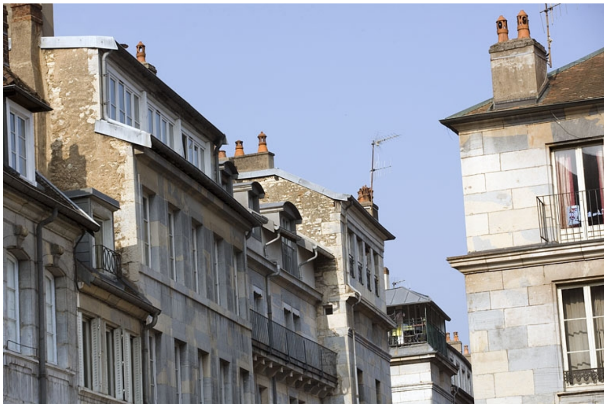
Partie supérieure de la façade sur rue.

25, Besançon Grande Rue 132, 130, 128, lieudit : îlot Ronchaux