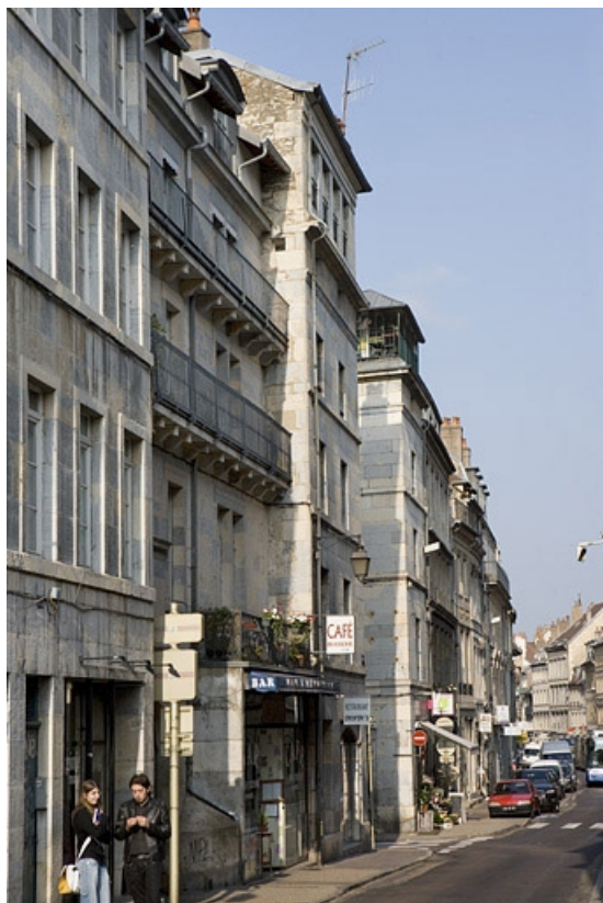
Partie centrale de la façade sur rue, de trois quarts gauche.

25, Besançon Grande Rue 132, 130, 128, lieudit : îlot Ronchaux