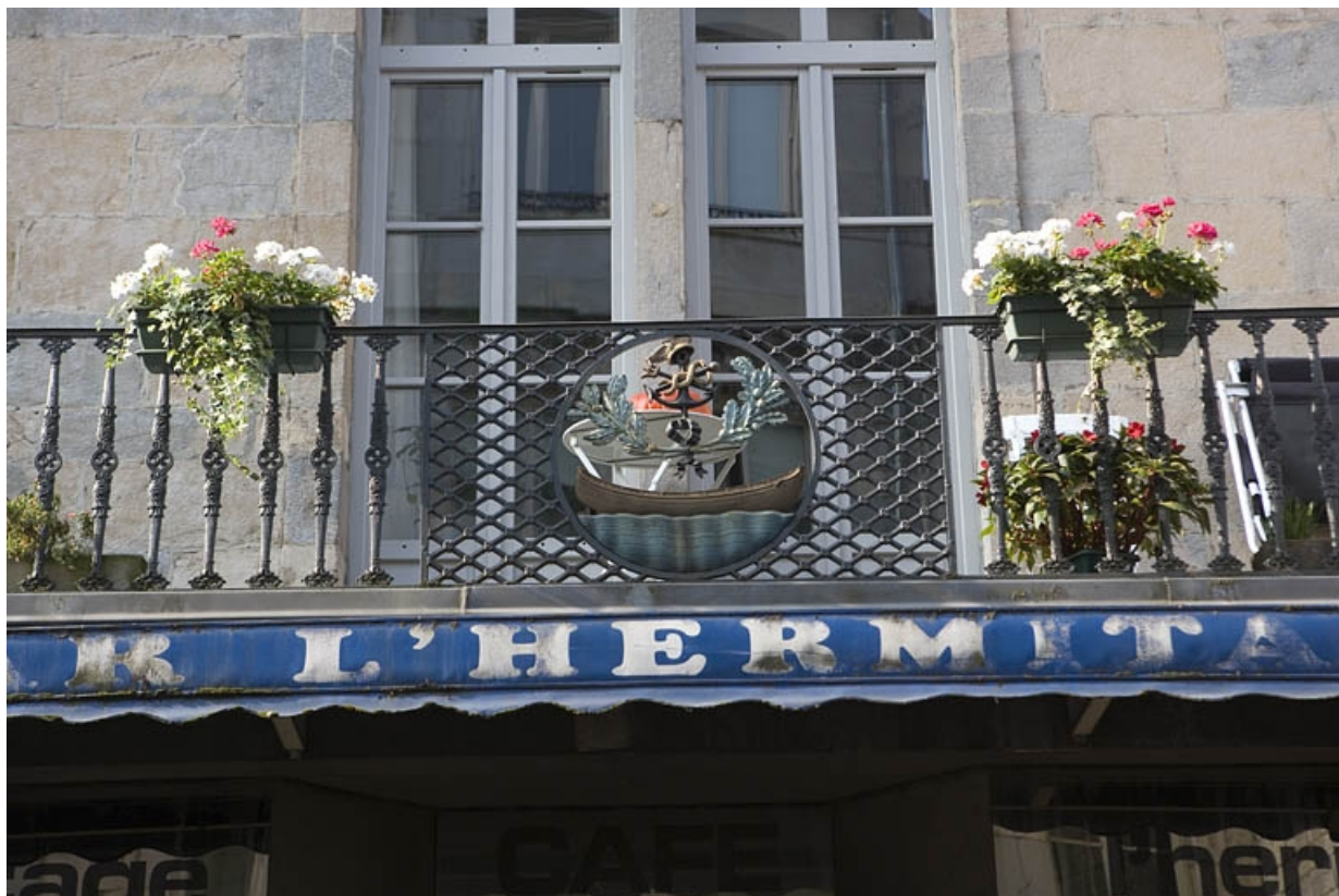
Détail du balcon sur la partie centrale de la façade sur rue, de face.

25, Besançon Grande Rue 132, 130, 128, lieudit : îlot Ronchaux