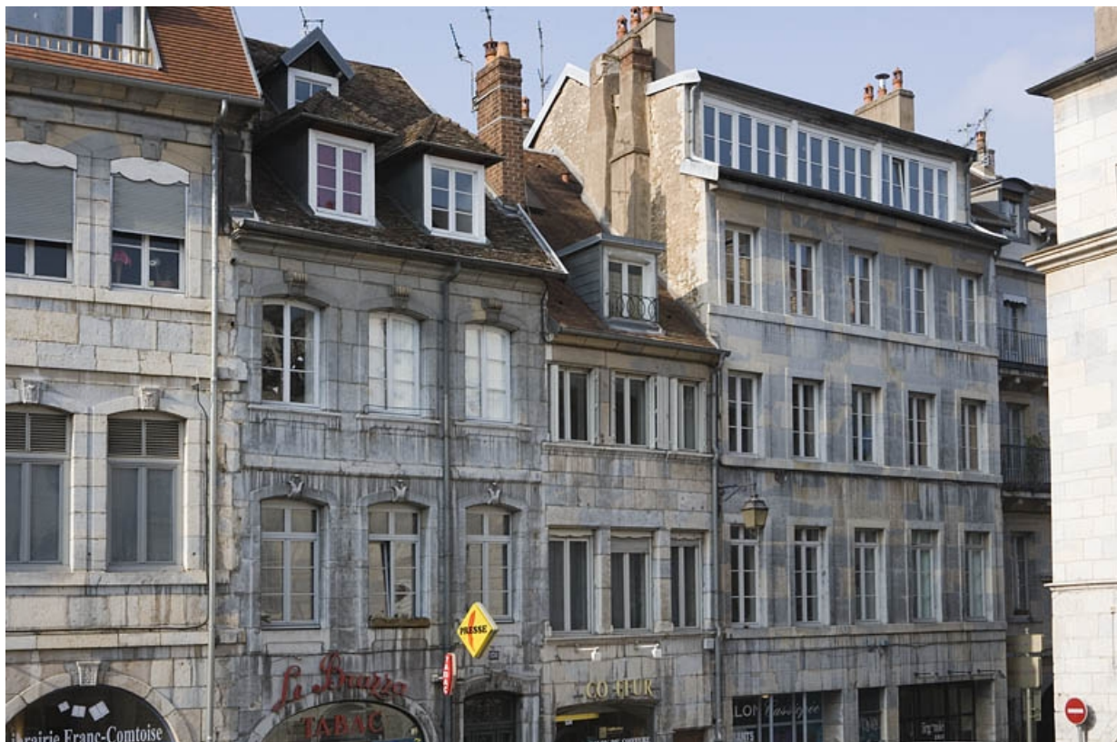
Vue d'ensemble de la partie gauche de l'édifice sur rue.

25, Besançon Grande Rue 132, 130, 128, lieudit : îlot Ronchaux