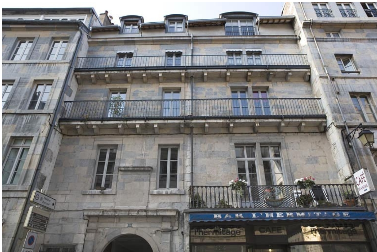
Partie centrale de la façade sur rue, de face.

25, Besançon Grande Rue 132, 130, 128, lieudit : îlot Ronchaux