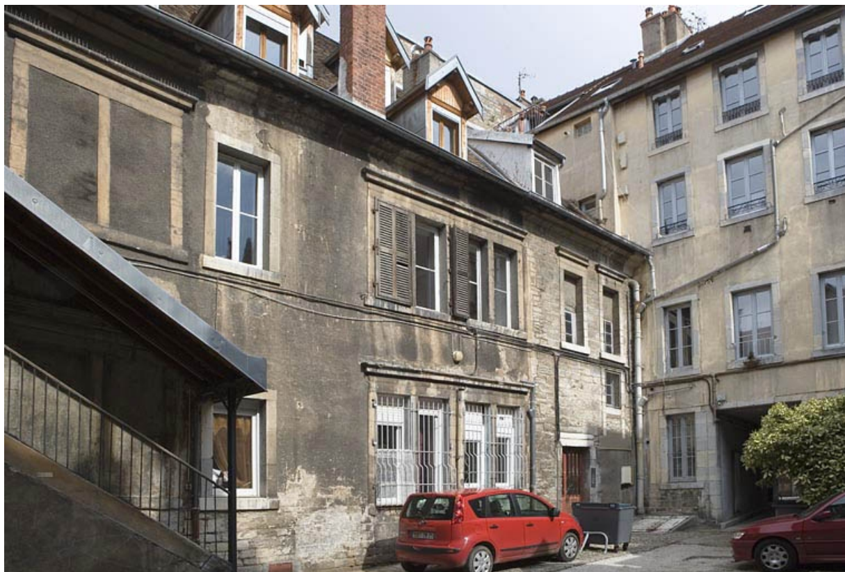
Vue d'ensemble de l'aile sur cour.

25, Besançon Grande Rue 132, 130, 128, lieudit : îlot Ronchaux