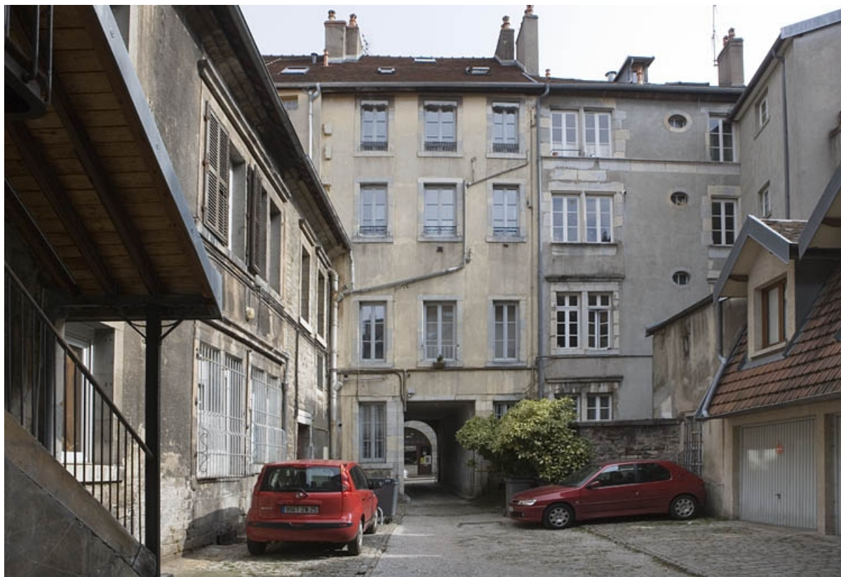
Vue d'ensemble depuis le fond de la cour.

25, Besançon Grande Rue 132, 130, 128, lieudit : îlot Ronchaux