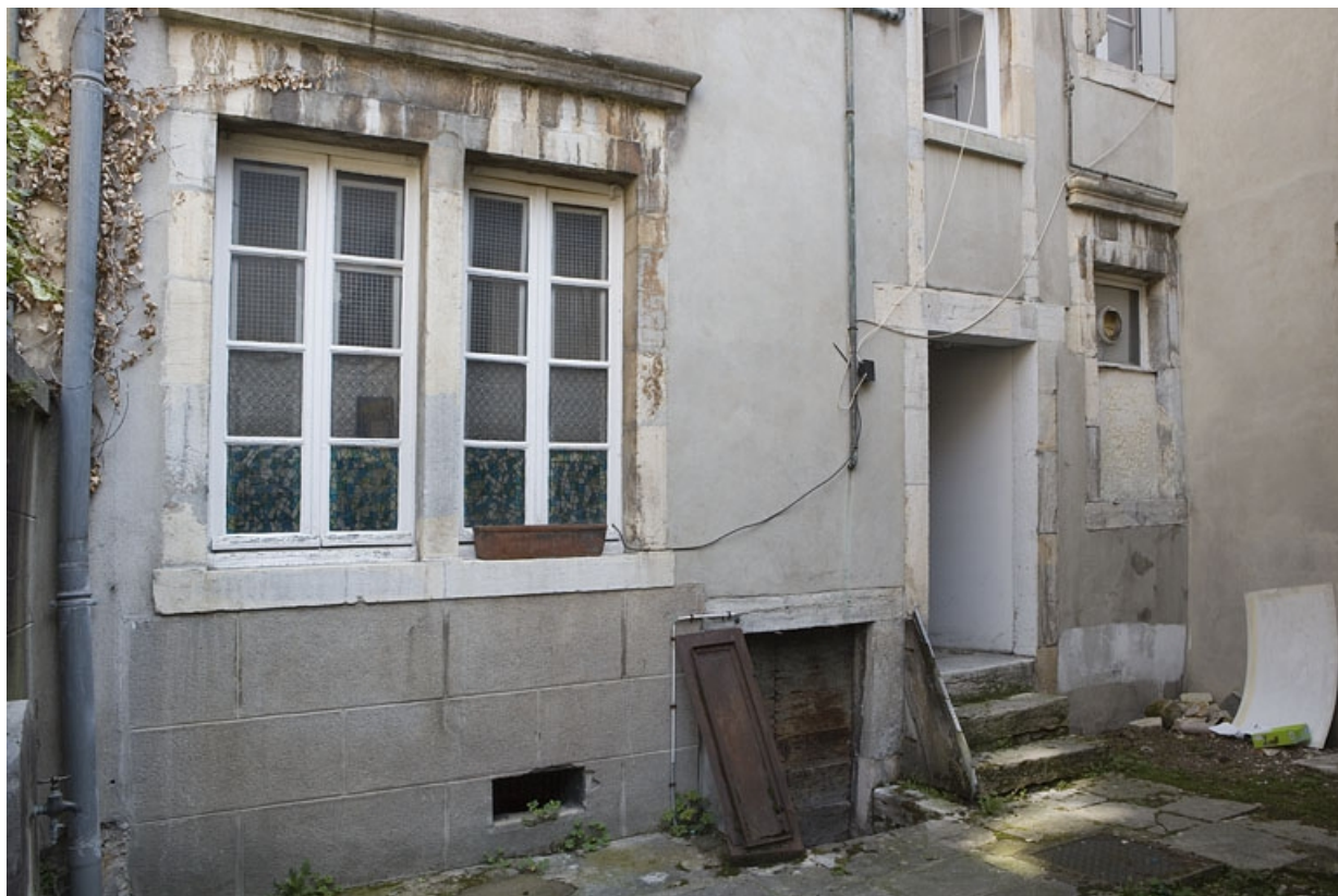
Façade postérieure du logis principal sur rue, partie droite : détail des fenêtres du rez-de-chaussée.

25, Besançon Grande Rue 132, 130, 128, lieudit : îlot Ronchaux