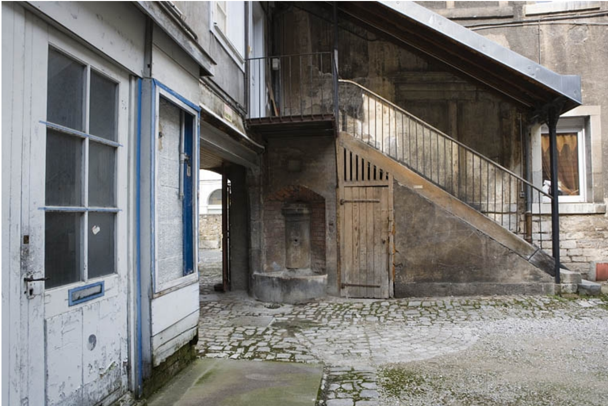
Détail de l'escalier extérieur à l'extrémité de l'aile.

25, Besançon Grande Rue 132, 130, 128, lieudit : îlot Ronchaux