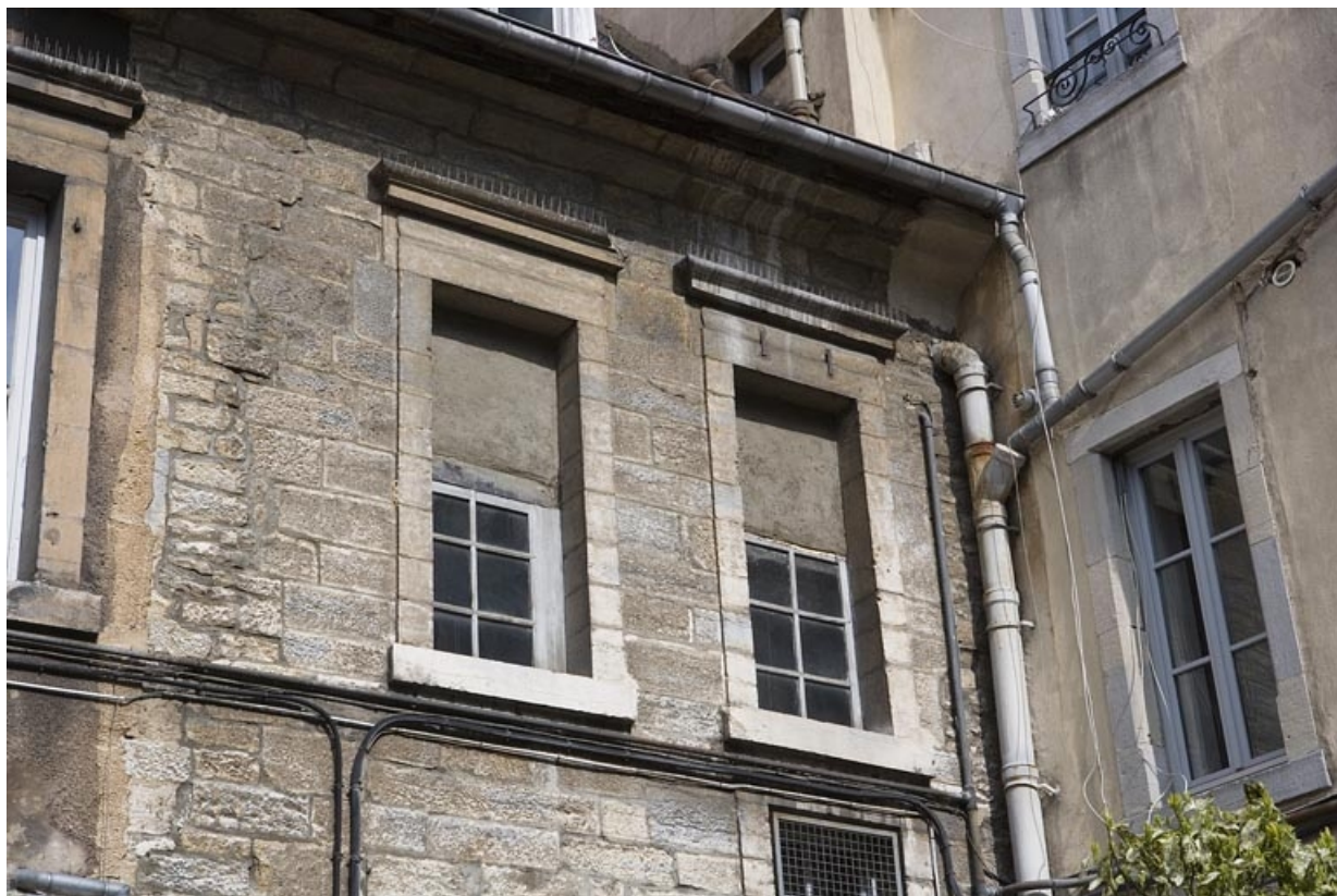
Aile sur cour, détail de deux fenêtres du premier étage.

25, Besançon Grande Rue 132, 130, 128, lieudit : îlot Ronchaux