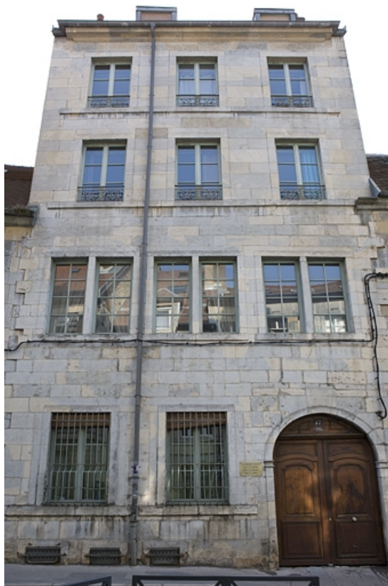
Façade sur rue : de face.

25, Besançon, 17 rue Ronchaux, lieudit : îlot Ronchaux