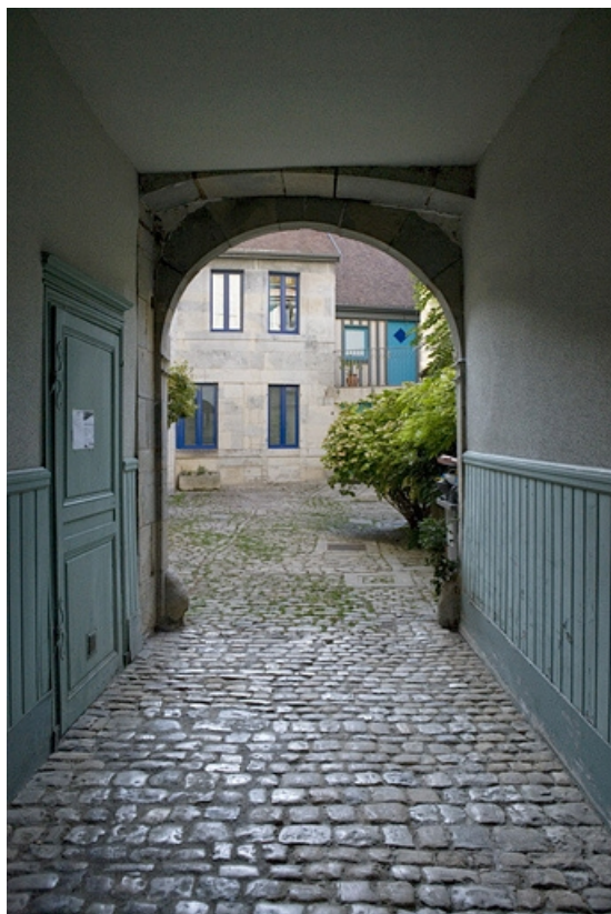
Vue de la cour depuis l'entrée du passage cocher.

25, Besançon, 17 rue Ronchaux, lieudit : îlot Ronchaux