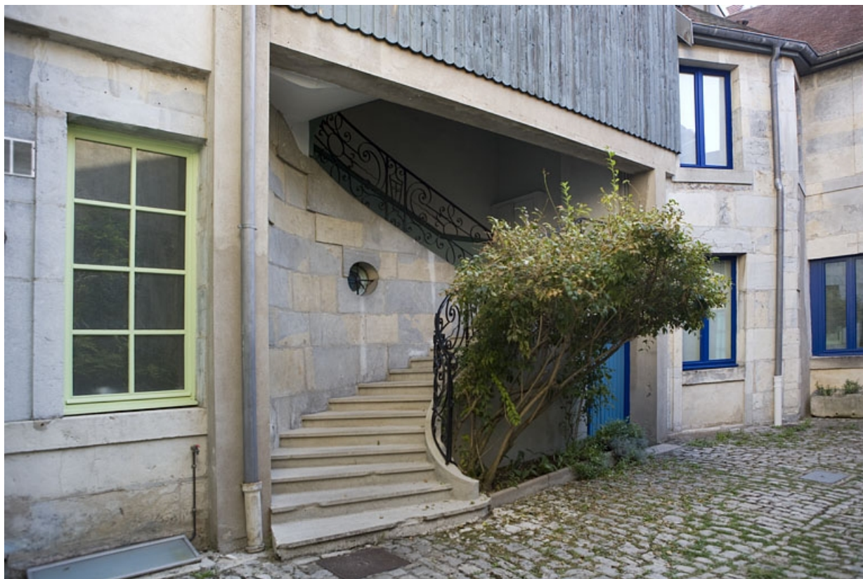
Détail du départ de l'escalier à cage ouverte sur cour.

25, Besançon, 17 rue Ronchaux, lieudit : îlot Ronchaux