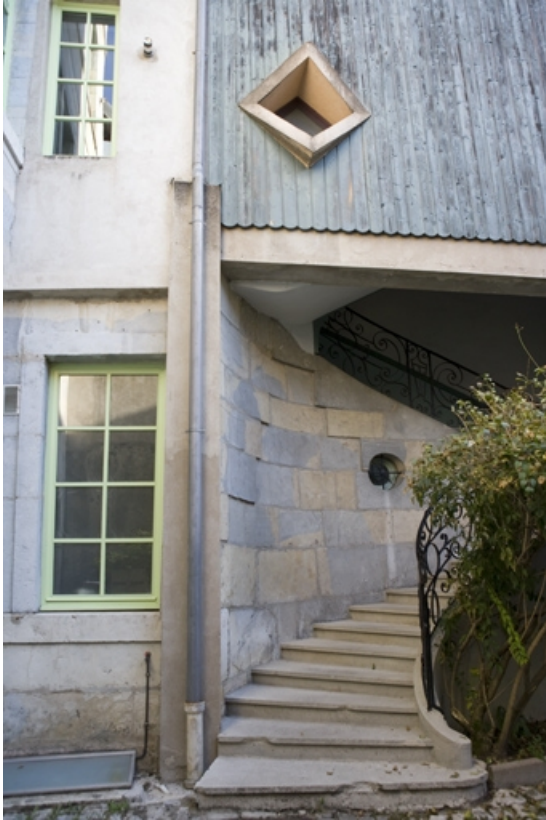
Détail du départ de l'escalier à cage ouverte sur cour, vue verticale. 25, Besançon, 17 rue Ronchaux, lieudit : îlot Ronchaux