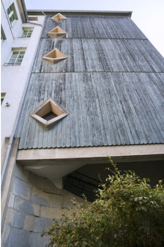
Escalier à cage ouverte sur cour : détail de la fermeture de la cage.

25, Besançon, 17 rue Ronchaux, lieudit : îlot Ronchaux