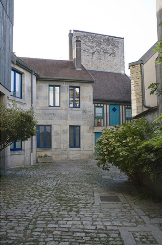
Vue d'ensemble des logis situés autour de la cour. 25, Besançon, 17 rue Ronchaux, lieudit : îlot Ronchaux