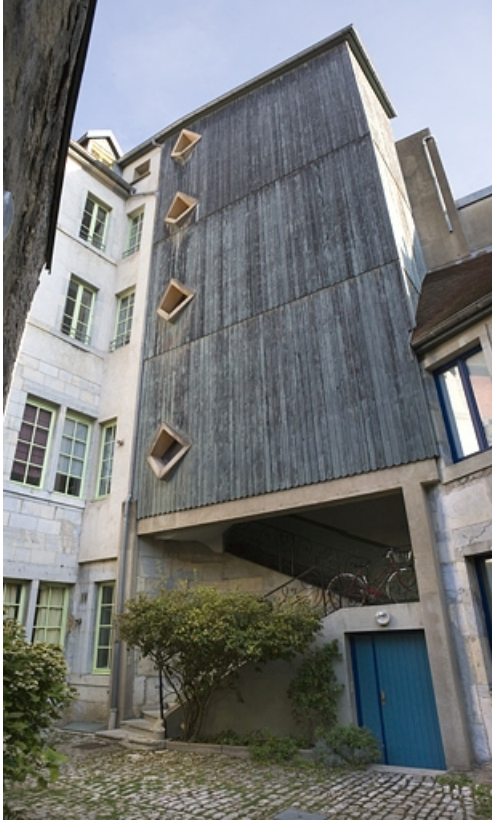
Vue d'ensemble de l'escalier à cage ouverte sur cour. 25, Besançon, 17 rue Ronchaux, lieudit : îlot Ronchaux