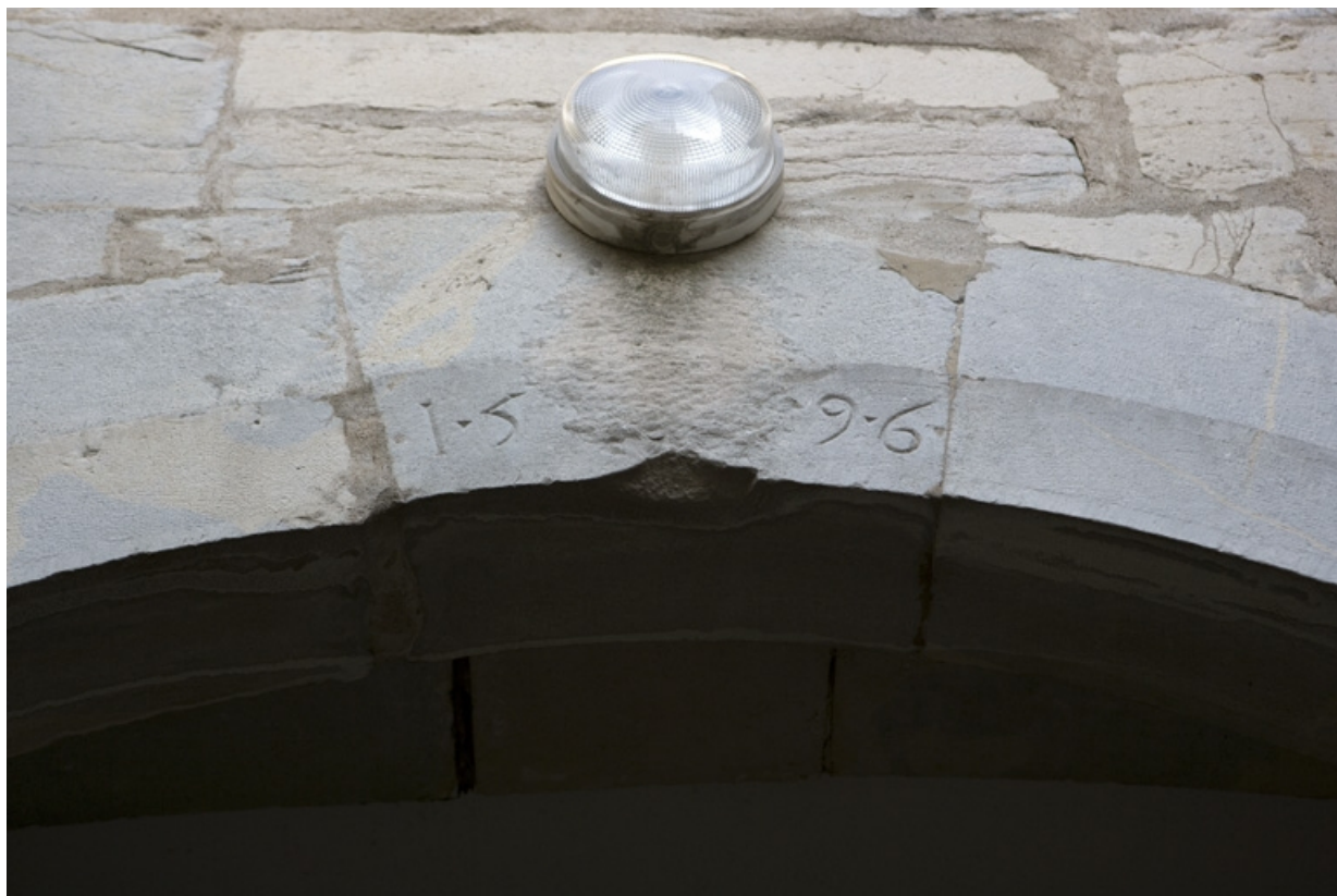
Détail de la date sur l'arc du portail d'entrée.

25, Besançon, 17 rue Ronchaux, lieudit : îlot Ronchaux