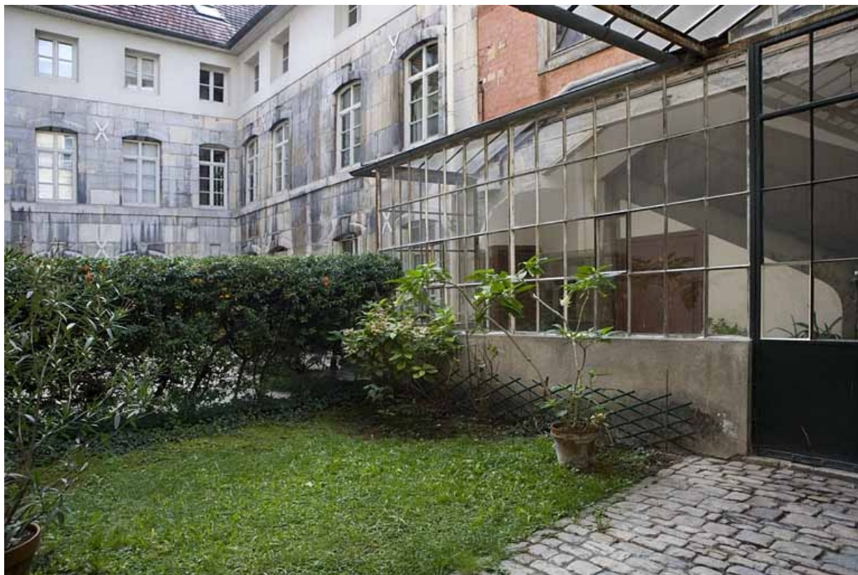
Vue d'ensemble des communs depuis l'entrée de la cour.

25, Besançon, 15 rue Ronchaux, lieudit : îlot Ronchaux