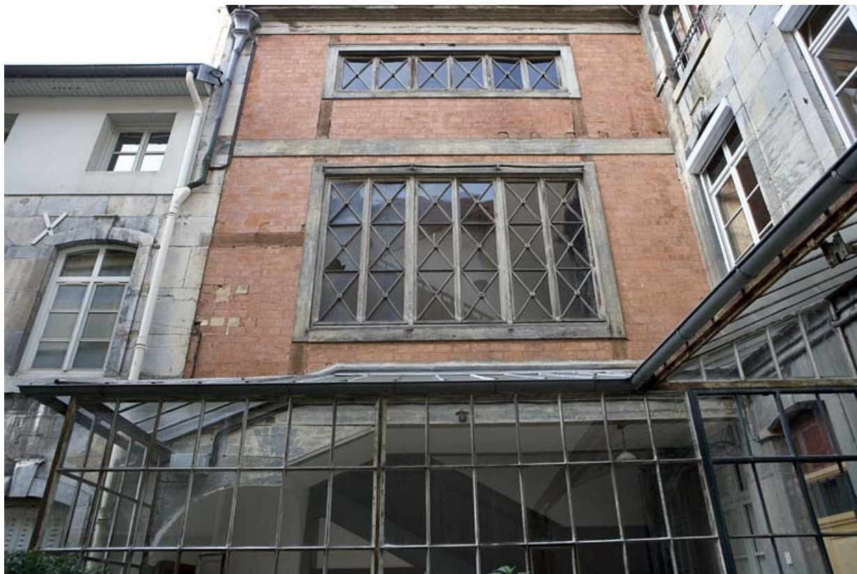
Détail de l'aile contenant l'escalier principal.

25, Besançon, 15 rue Ronchaux, lieudit : îlot Ronchaux