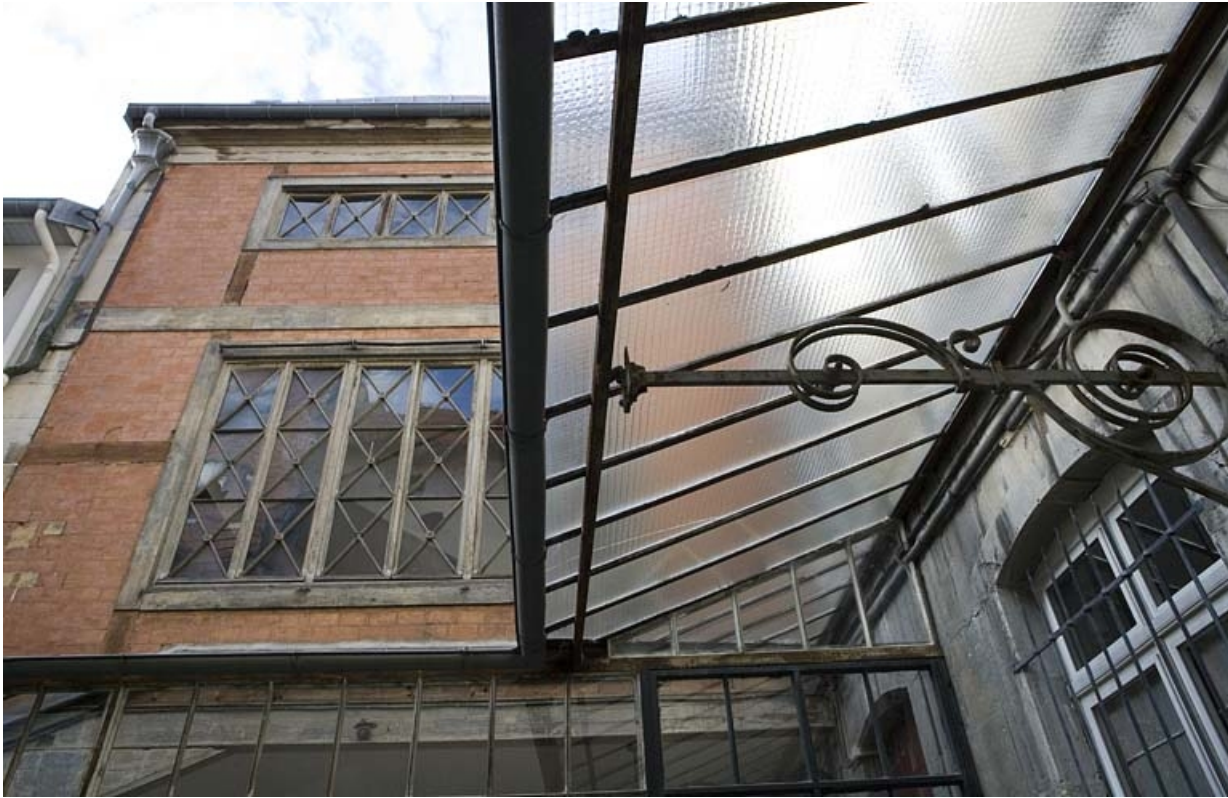
Détail de l'aile contenant l'escalier et de l'auvent situé sur la façade postérieure du logis principal. 25, Besançon, 15 rue Ronchaux, lieudit : îlot Ronchaux