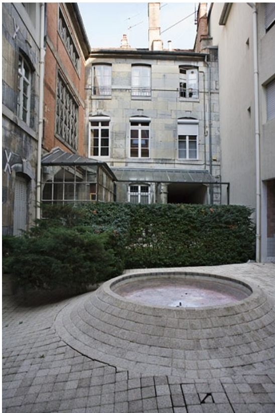
Vue d'ensemble des façades sur cour du logis principal, de face.

25, Besançon, 15 rue Ronchaux, lieudit : îlot Ronchaux