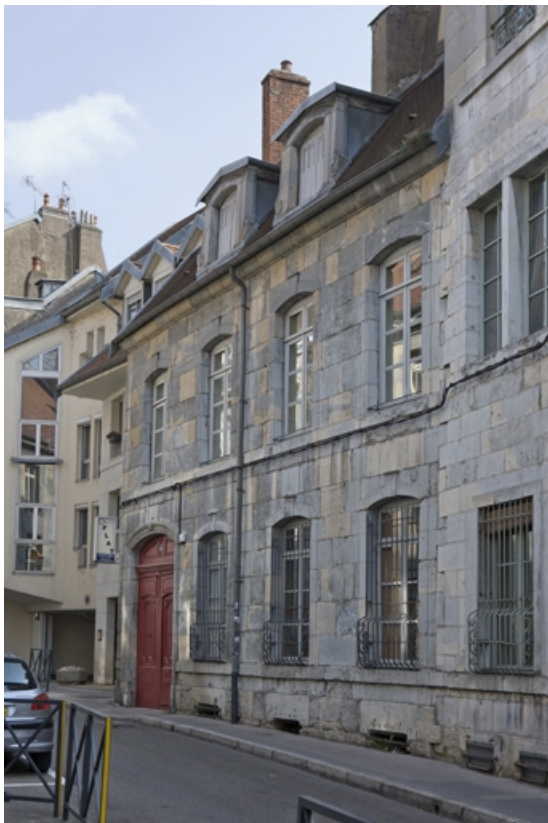
Vue d'ensemble de trois quarts droit.

25, Besançon, 15 rue Ronchaux, lieudit : îlot Ronchaux