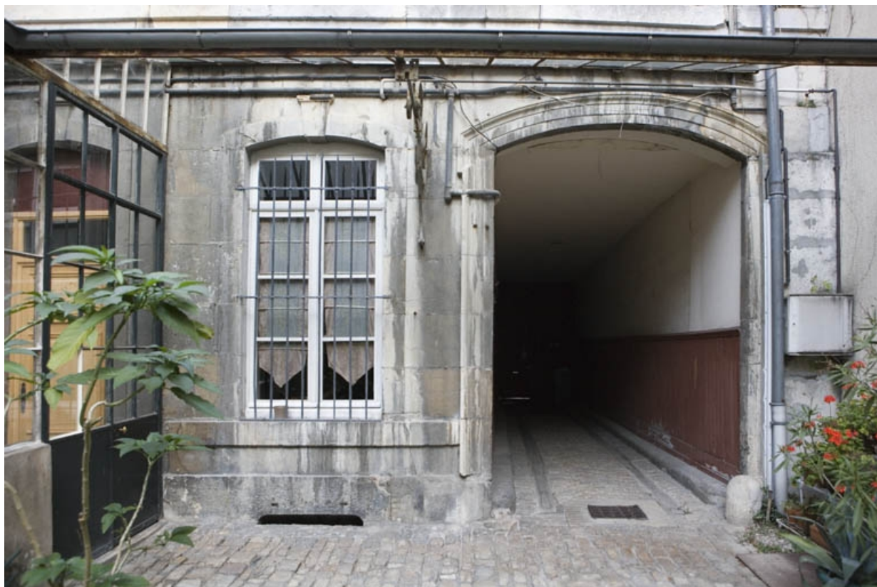
Détail du passage cocher, côté cour.

25, Besançon, 15 rue Ronchaux, lieudit : îlot Ronchaux