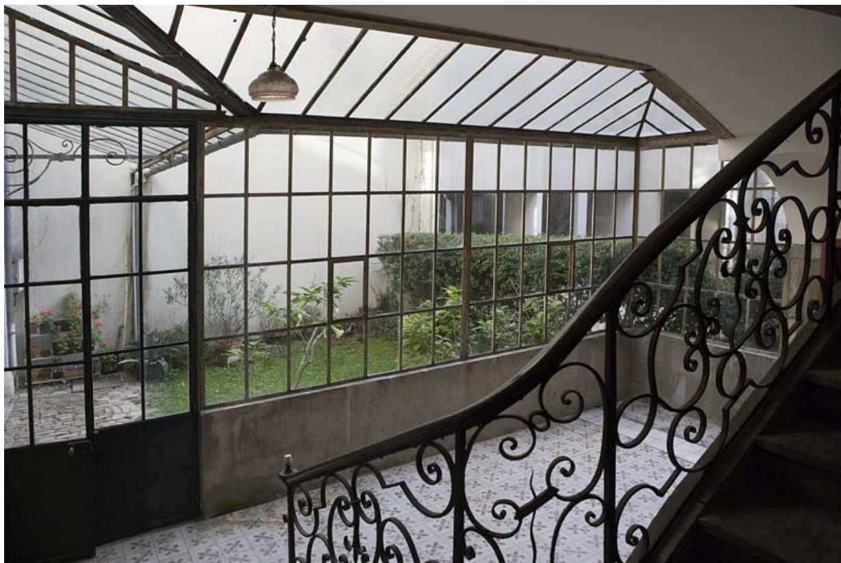
Vue intérieure de la verrière protégeant le rez-de-chaussée de la cage d'escalier.

25, Besançon, 15 rue Ronchaux, lieudit : îlot Ronchaux