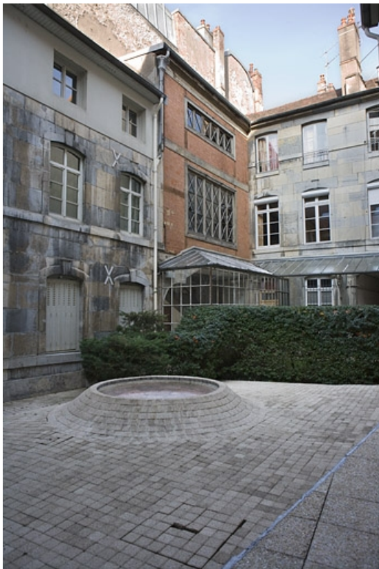
Vue d'ensemble des façades sur cour du logis principal, de trois quarts droit. 25, Besançon, 15 rue Ronchaux, lieudit : îlot Ronchaux