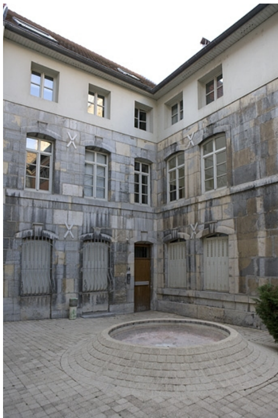
Vue d'ensemble des communs de trois quarts gauche.

25, Besançon, 15 rue Ronchaux, lieudit : îlot Ronchaux