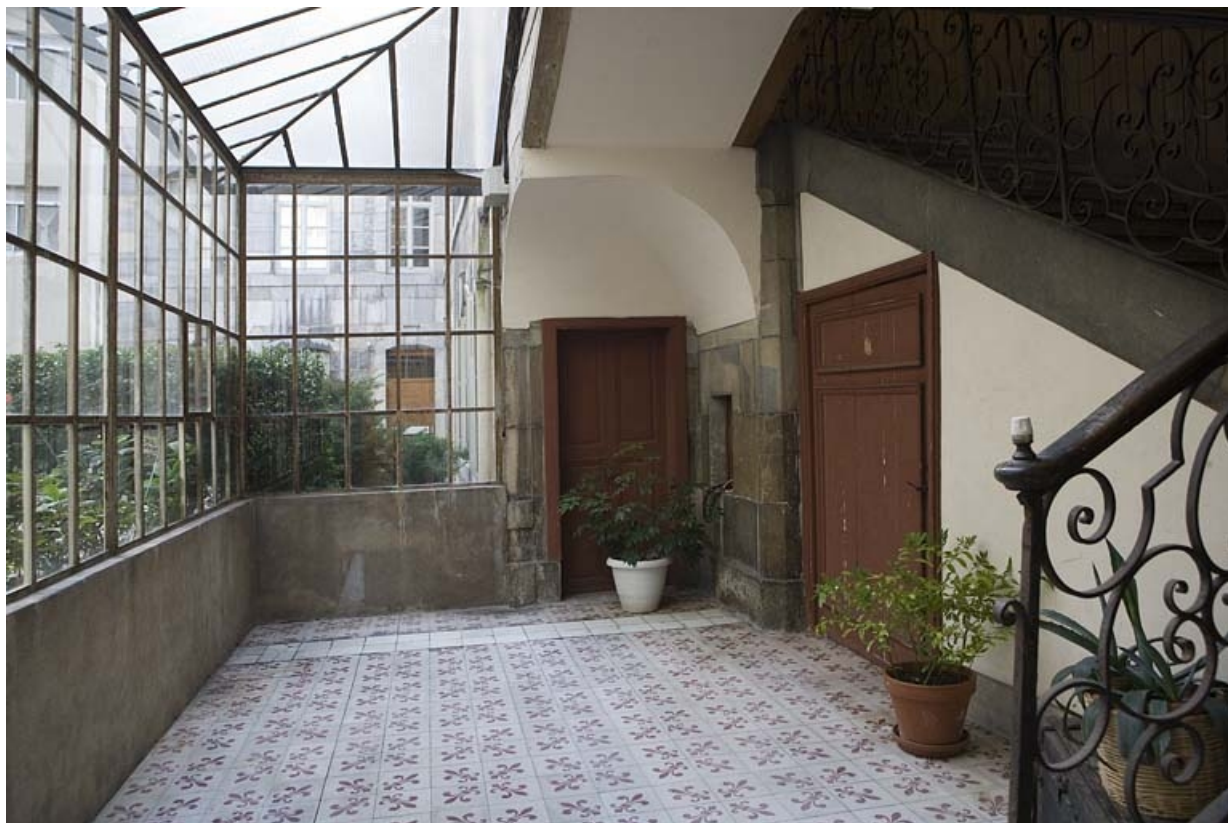
Vue intérieure de la verrière protégeant le rez-de-chaussée de la cage d'escalier, partie gauche.

25, Besançon, 15 rue Ronchaux, lieudit : îlot Ronchaux