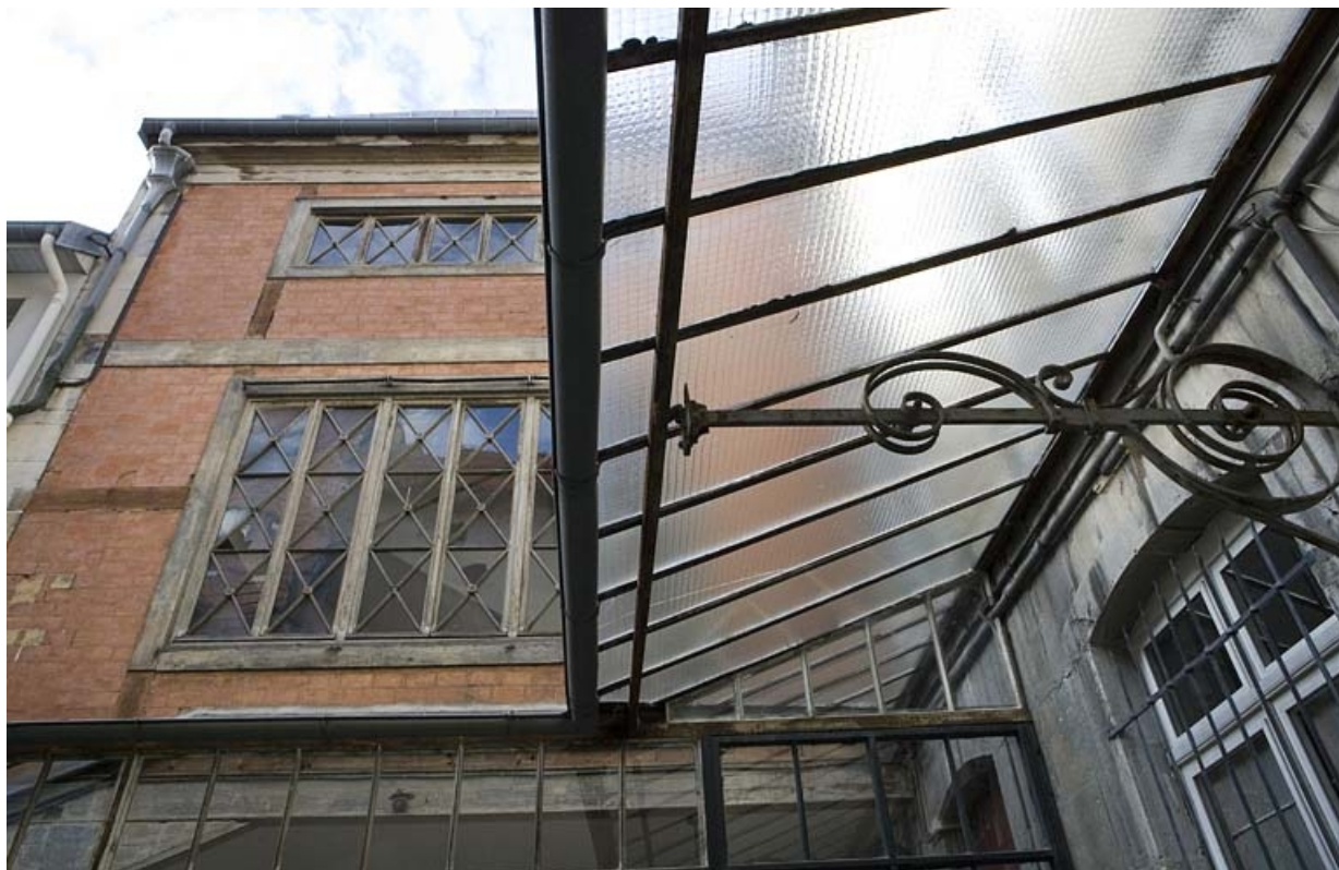
Détail de l'aile contenant l'escalier et de l'auvent situé sur la façade postérieure du logis principal.

25, Besançon, 15 rue Ronchaux, lieudit : îlot Ronchaux