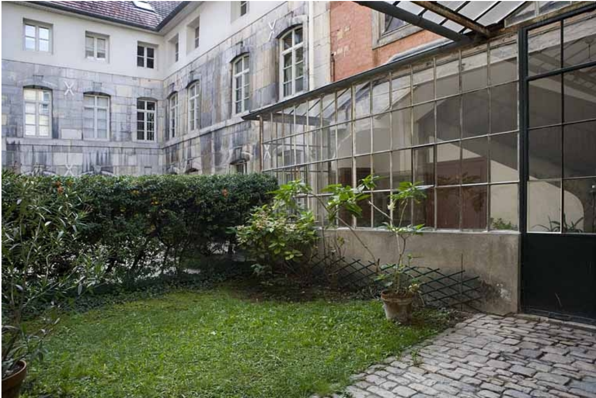
Vue d'ensemble des communs depuis l'entrée de la cour.

25, Besançon, 15 rue Ronchaux, lieudit : îlot Ronchaux