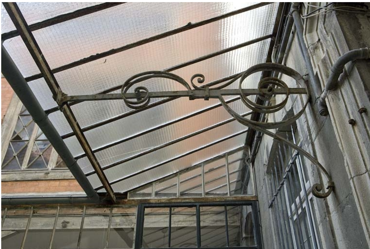
Détail de l'auvent situé sur la façade postérieure du logis principal.

25, Besançon, 15 rue Ronchaux, lieudit : îlot Ronchaux