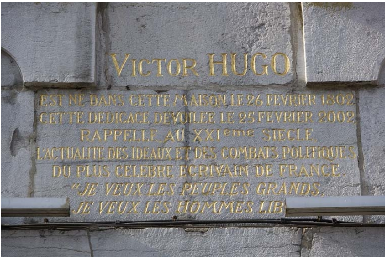
Façade sur rue : détail de l'inscription sous la plaque commémorative dédiée à Victor Hugo. 25, Besançon Grande Rue 140, lieudit : îlot Ronchaux