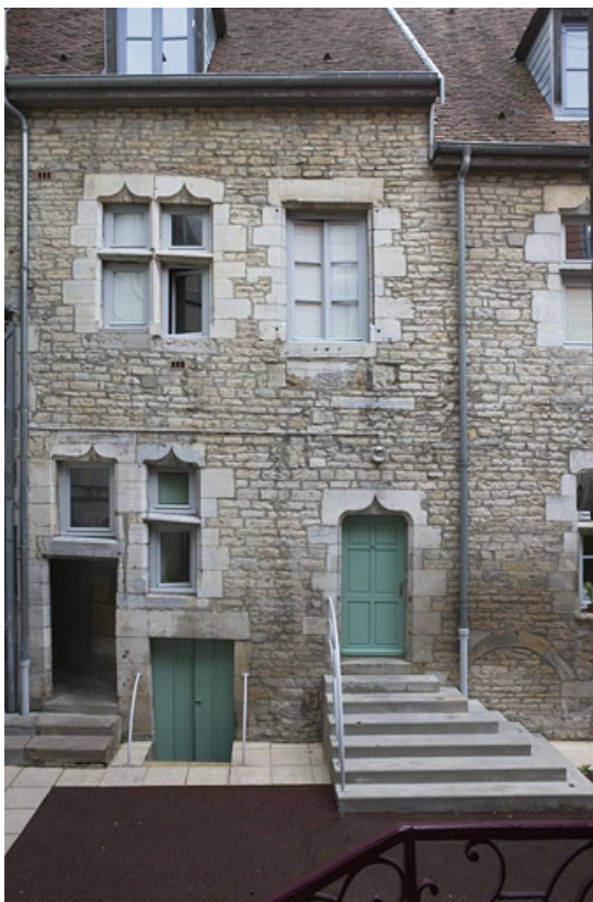
Vue d'une partie de l'aile gauche sur cour, de face.

25, Besançon Grande Rue 140, lieudit : îlot Ronchaux