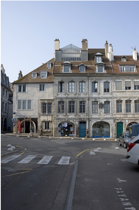
Vue d'ensemble éloignée de la façade sur rue rue. 25, Besançon Grande Rue 140, lieudit : îlot Ronchaux