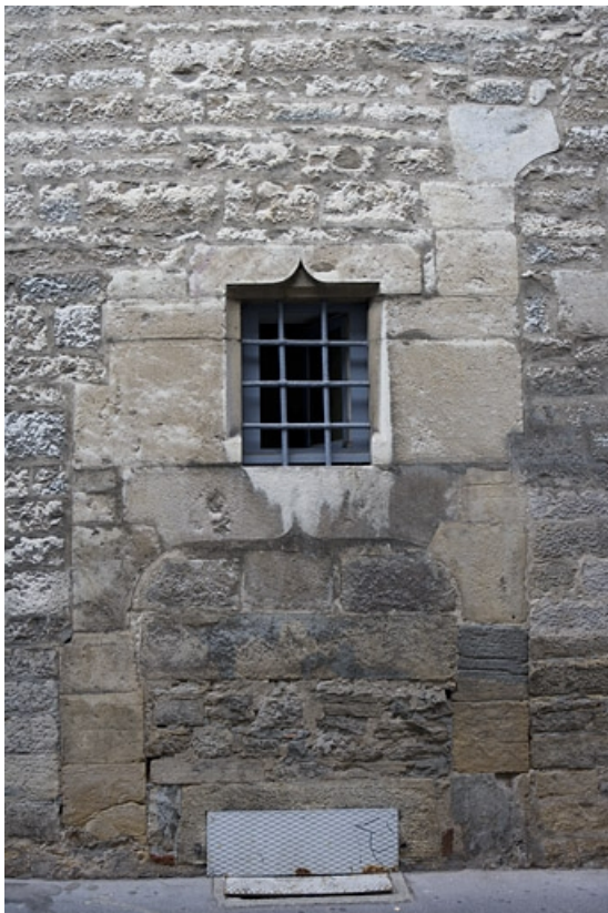
Façade latérale gauche : détail d'une fenêtre en accolade.

25, Besançon Grande Rue 140, lieudit : îlot Ronchaux