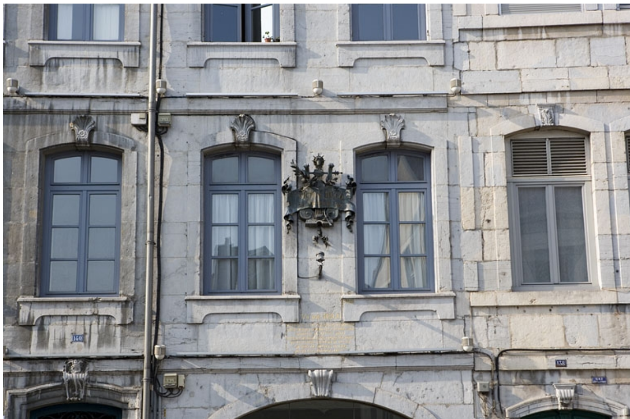
Façade sur rue : détail de la plaque commémorative dédiée à Victor Hugo. 25, Besançon Grande Rue 140, lieudit : îlot Ronchaux