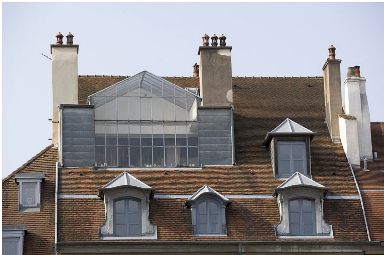
Toiture : détail de la verrière de l'atelier d'artiste.

25, Besançon Grande Rue 140, lieudit : îlot Ronchaux