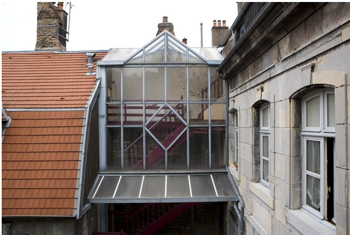
Détail de la verrière au-dessus de l'escalier à cage ouverte.

25, Besançon Grande Rue 140, lieudit : îlot Ronchaux