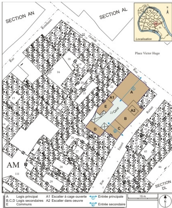
Plan masse et de situation. Extrait du plan cadastral, 1974, section AM. 25, Besançon Grande Rue 140, lieudit : îlot Ronchaux