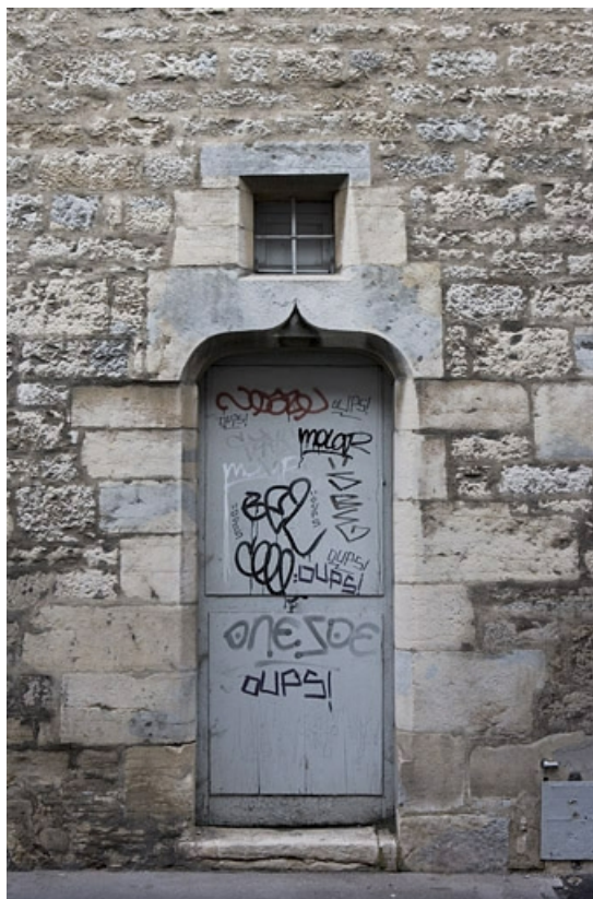
Façade latérale gauche : détail d'une porte en accolade.

25, Besançon Grande Rue 140, lieudit : îlot Ronchaux