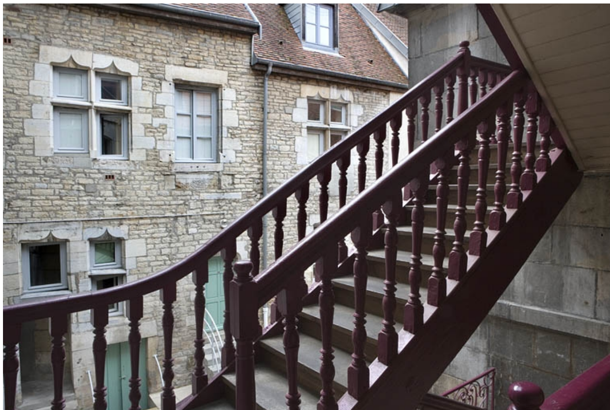
Escalier à cage ouverte sur cour, détail d'une volée.

25, Besançon Grande Rue 140, lieudit : îlot Ronchaux