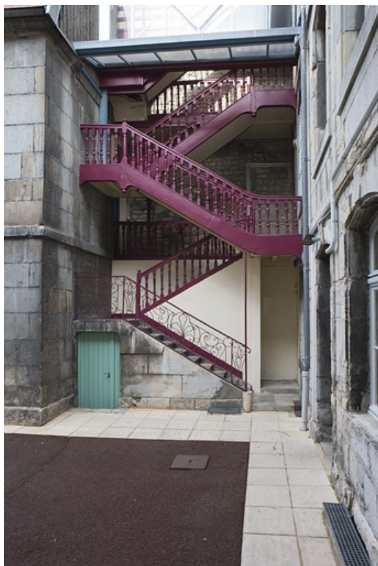
Vue d'ensemble de l'escalier à cage ouverte en dessous de la verrière.

25, Besançon Grande Rue 140, lieudit : îlot Ronchaux