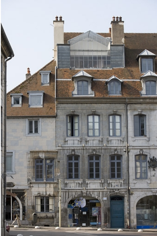
Partie gauche de la façade sur rue, de face.

25, Besançon Grande Rue 140, lieudit : îlot Ronchaux