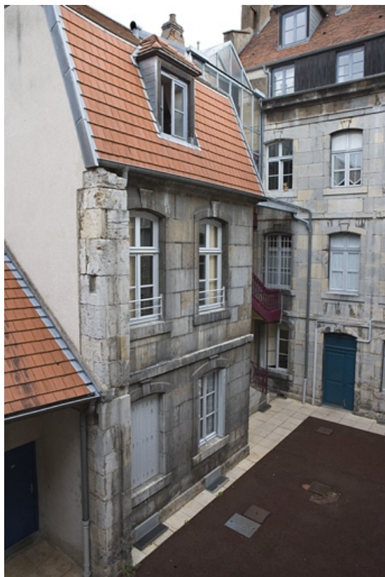
Vue d'ensemble de l'aile droite depuis le fond de la cour.

25, Besançon Grande Rue 140, lieudit : îlot Ronchaux