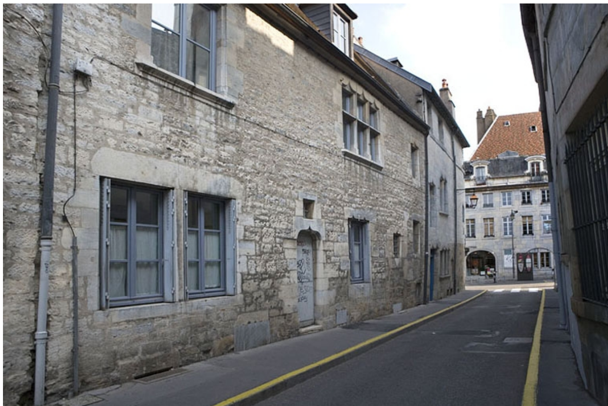
Vue d'ensemble de la façade latérale gauche, de trois quarts gauche.

25, Besançon Grande Rue 140, lieudit : îlot Ronchaux