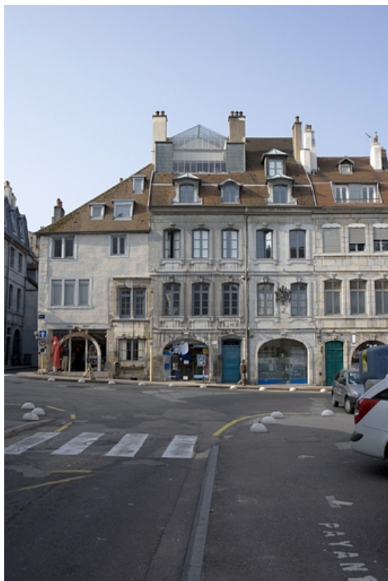
Vue d'ensemble éloignée de la façade sur rue rue. 25, Besançon Grande Rue 140, lieudit : îlot Ronchaux