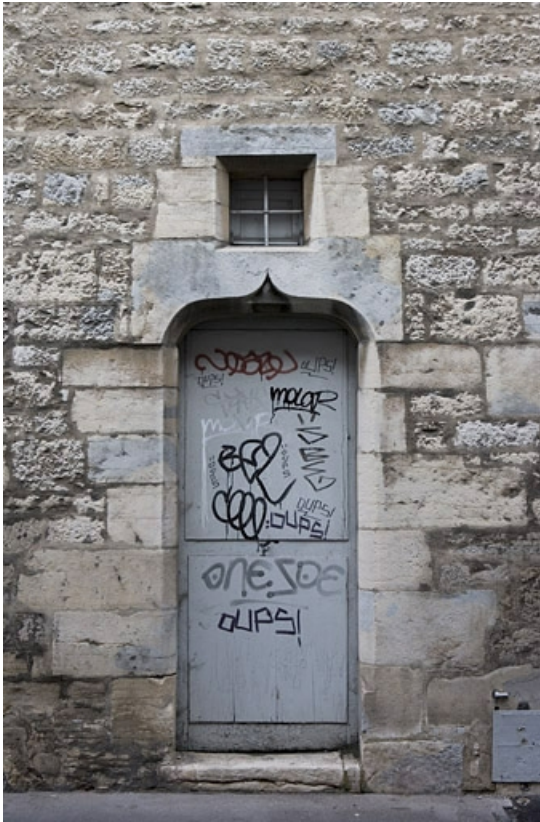
Façade latérale gauche : détail d'une porte en accolade.

25, Besançon Grande Rue 140, lieudit : îlot Ronchaux