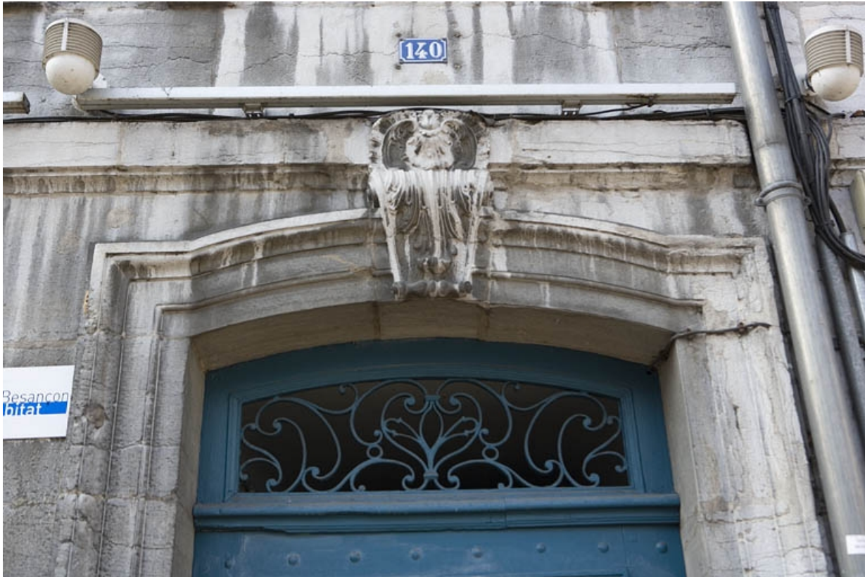
Façade sur rue : détail de la partie supérieure de la porte d'entrée.

25, Besançon Grande Rue 140, lieudit : îlot Ronchaux