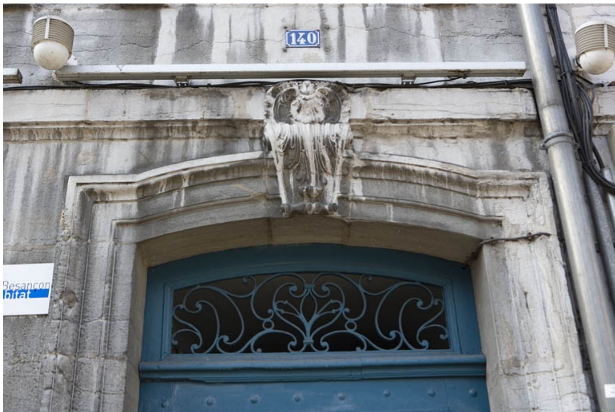
Façade sur rue : détail de la partie supérieure de la porte d'entrée.

25, Besançon Grande Rue 140, lieudit : îlot Ronchaux