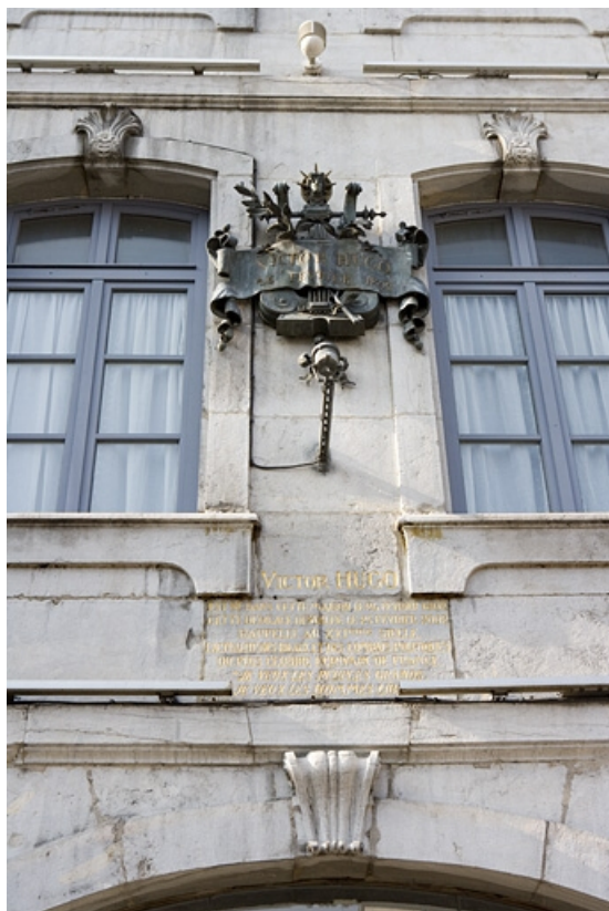
Façade sur rue : détail de la plaque commémorative dédiée à Victor Hugo. 25, Besançon Grande Rue 140, lieudit : îlot Ronchaux