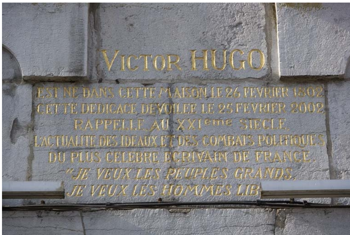
Façade sur rue : détail de l'inscription sous la plaque commémorative dédiée à Victor Hugo.

25, Besançon Grande Rue 140, lieudit : îlot Ronchaux