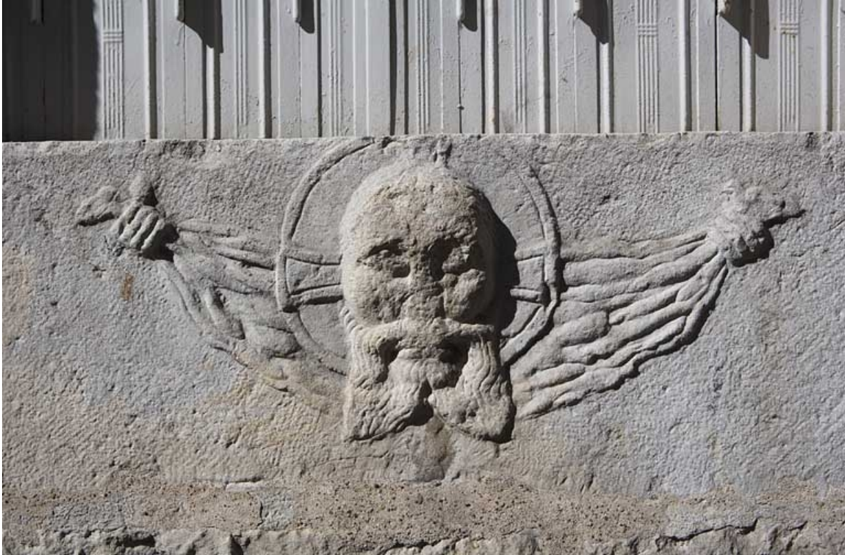
Façade latérale gauche : détail du bas-relief représentant une tête de Christ sur un linge.

25, Besançon Grande Rue 140, lieudit : îlot Ronchaux