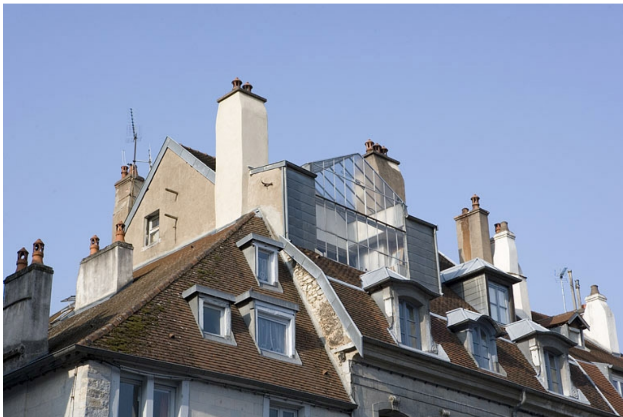
Toiture : détail de la verrière de l'atelier d'artiste, de trois quarts gauche.

25, Besançon Grande Rue 140, lieudit : îlot Ronchaux