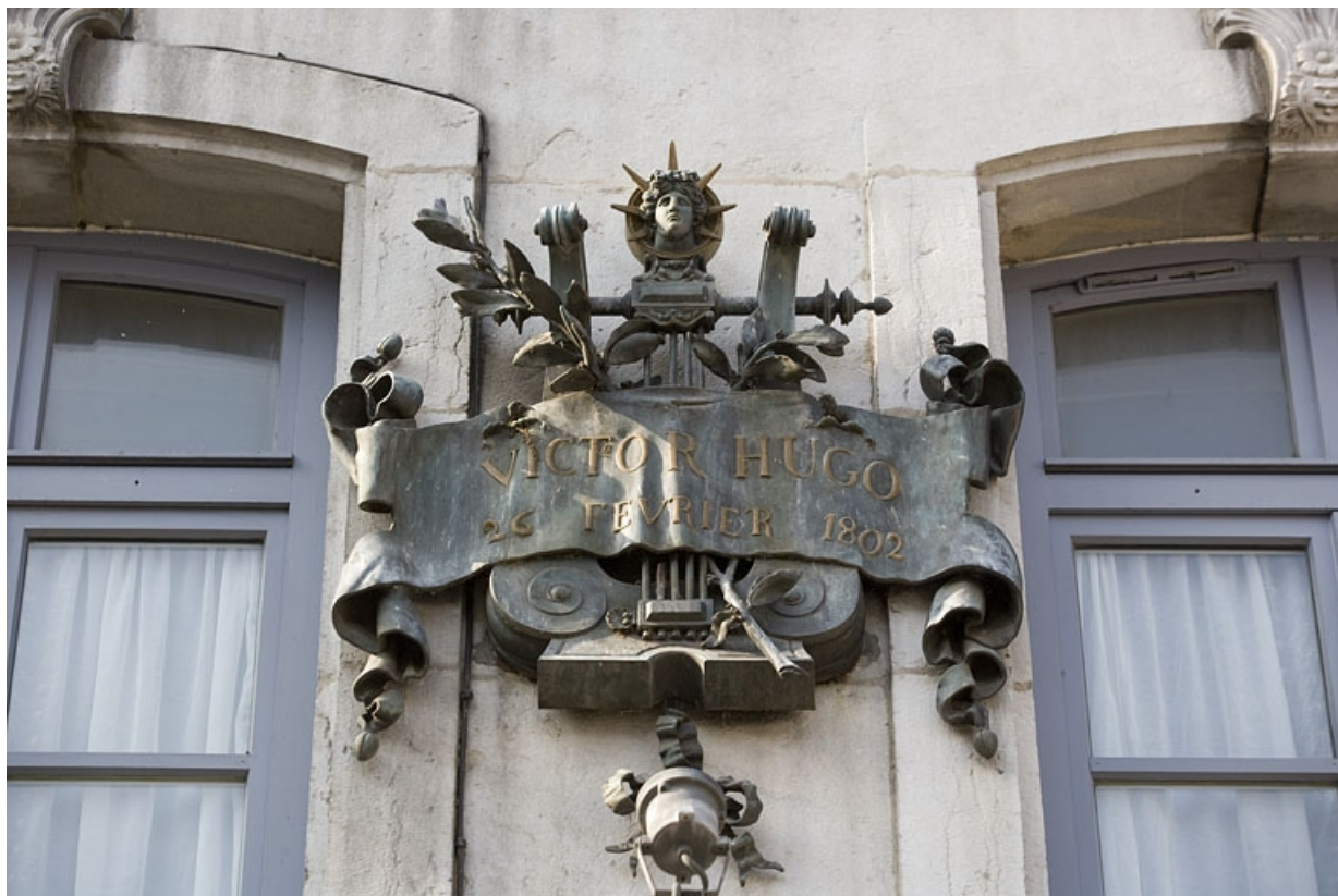
Façade sur rue : plaque commémorative dédiée à Victor Hugo, vue rapprochée. 25, Besançon Grande Rue 140, lieudit : îlot Ronchaux