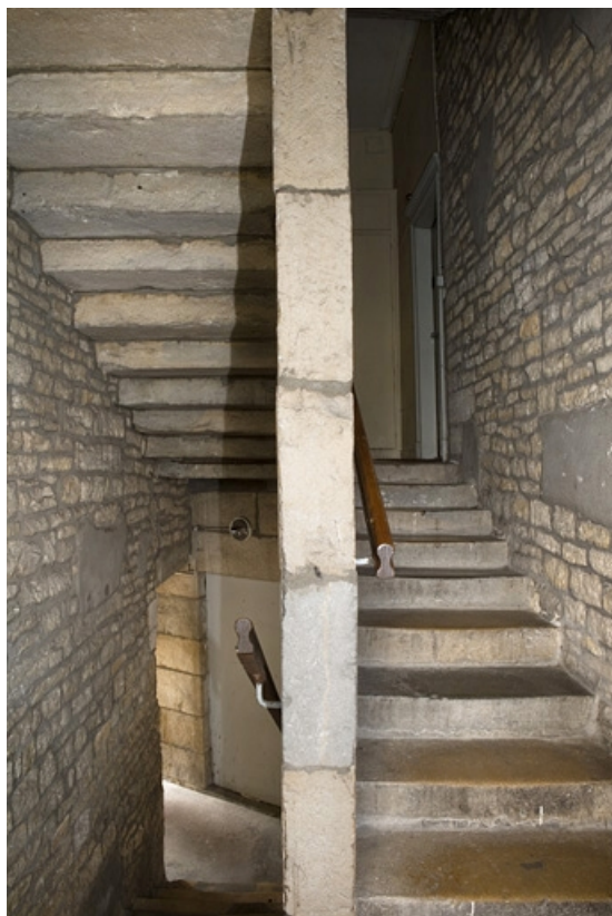
Détail de l'escalier rampe sur rampe dans oeuvre de l'aile gauche.

25, Besançon Grande Rue 140, lieudit : îlot Ronchaux