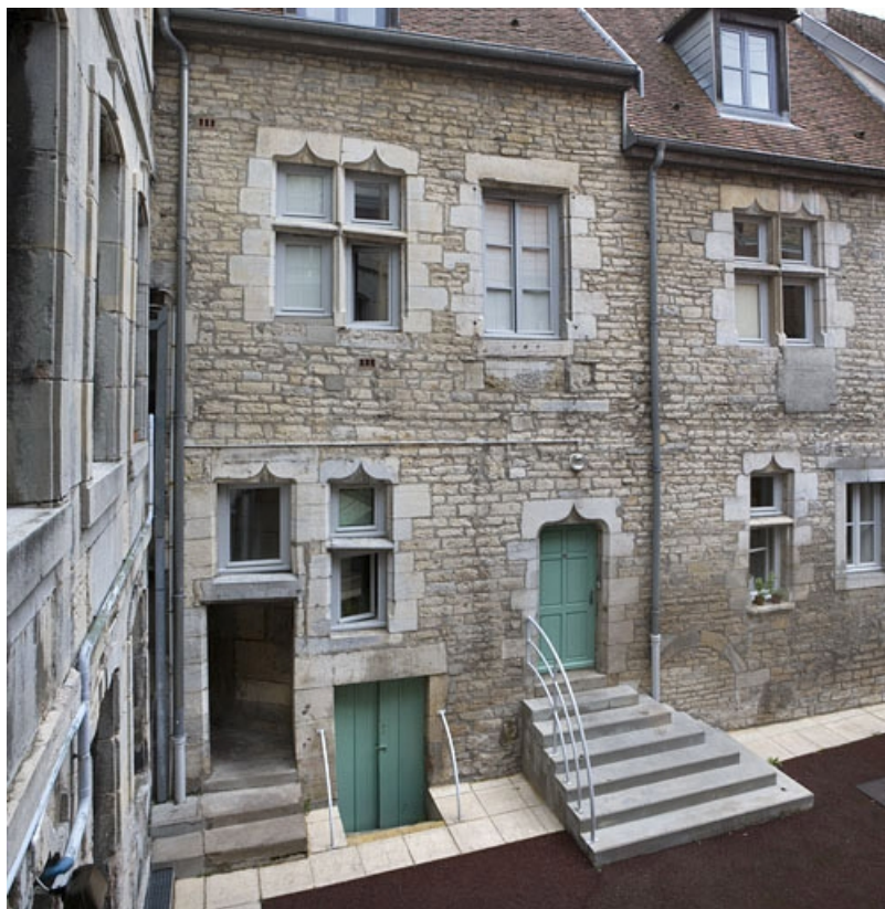
Vue d'une partie de l'aile gauche sur cour.

25, Besançon Grande Rue 140, lieudit : îlot Ronchaux