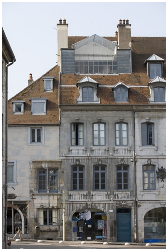
Partie gauche de la façade sur rue, de face.

25, Besançon Grande Rue 140, lieudit : îlot Ronchaux