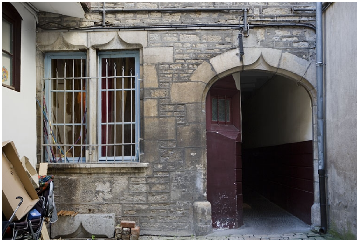
Détail du rez-de-chaussée de la façade postérieure du logis principal.

25, Besançon, 1 rue Mégevand, lieudit : îlot Terrier de Santans