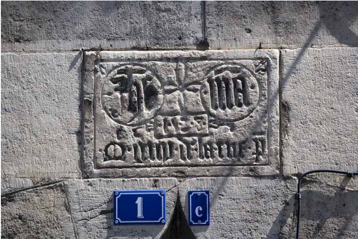
Détail de l'inscription au dessus de la porte d'entrée.

25, Besançon, 1 rue Mégevand, lieudit : îlot Terrier de Santans