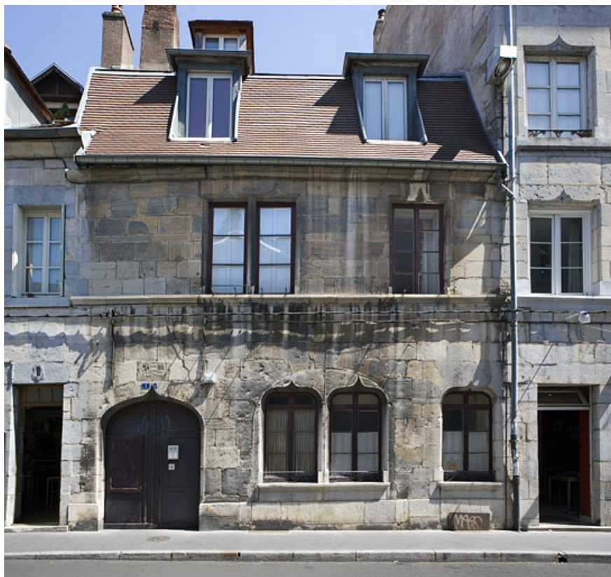
Vue d'ensemble de la façade sur rue : de face.

25, Besançon, 1 rue Mégevand, lieudit : îlot Terrier de Santans