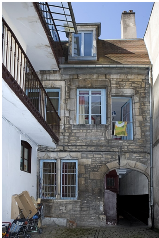
Façade postérieure du logis principal, de face.

25, Besançon, 1 rue Mégevand, lieudit : îlot Terrier de Santans