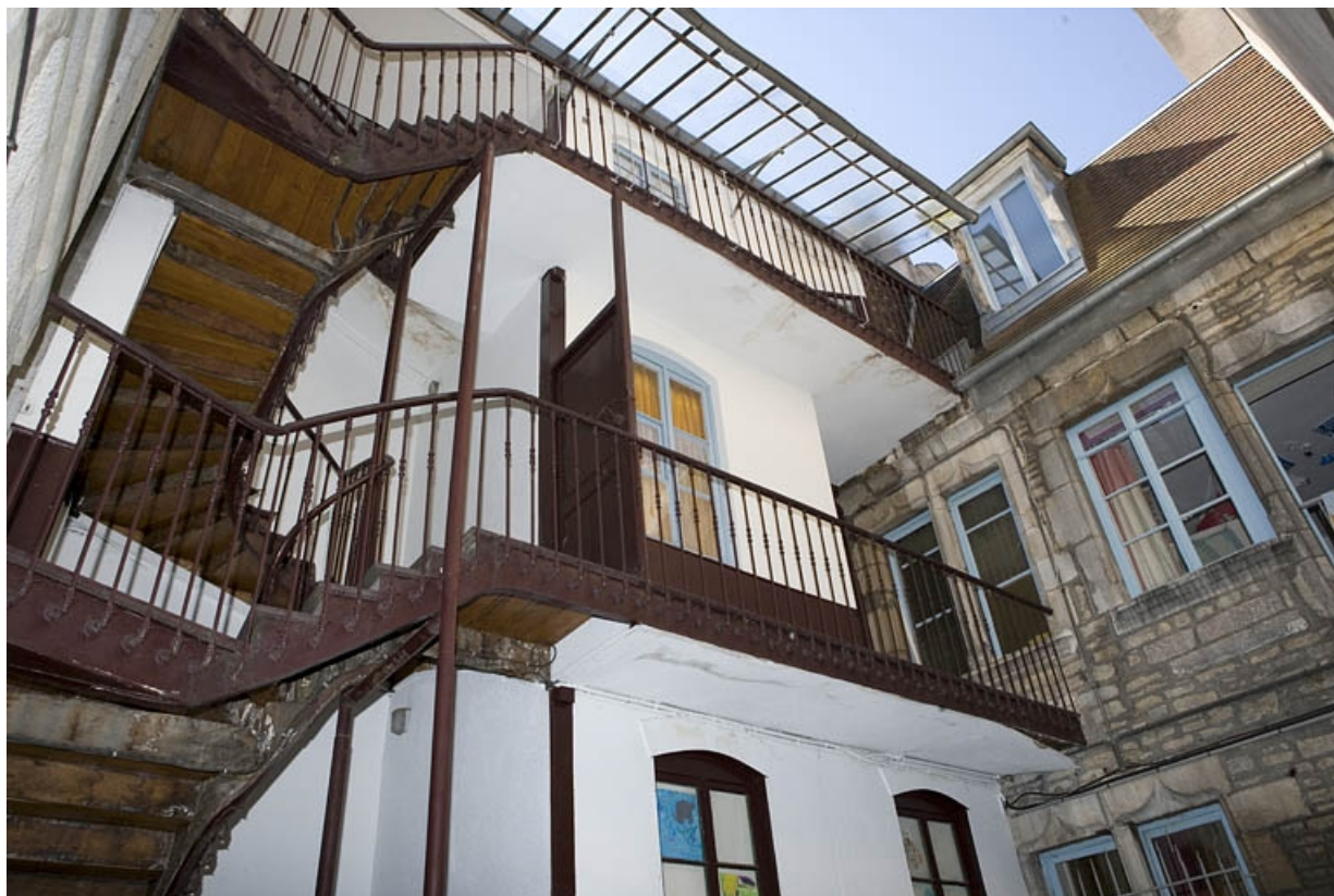
Détail de l'escalier à cage ouverte sur cour et de la façade postérieure du logis principal.

25, Besançon, 1 rue Mégevand, lieudit : îlot Terrier de Santans