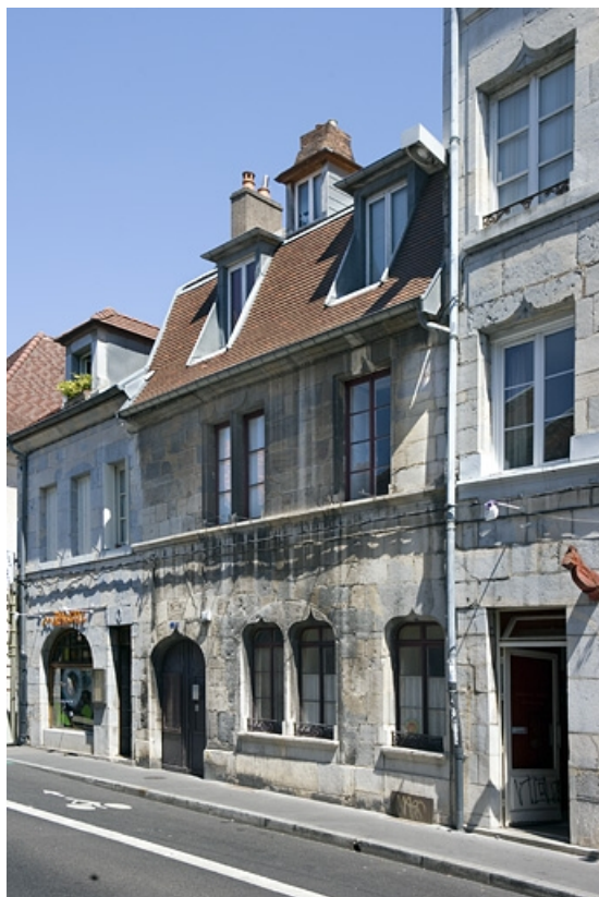
Vue d'ensemble depuis la rue, de trois quarts droit.

25, Besançon, 1 rue Mégevand, lieudit : îlot Terrier de Santans