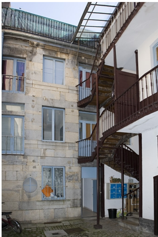
Façade antérieure du logis secondaire avec l'escalier à cage ouverte. 25, Besançon, 1 rue Mégevand, lieudit : îlot Terrier de Santans