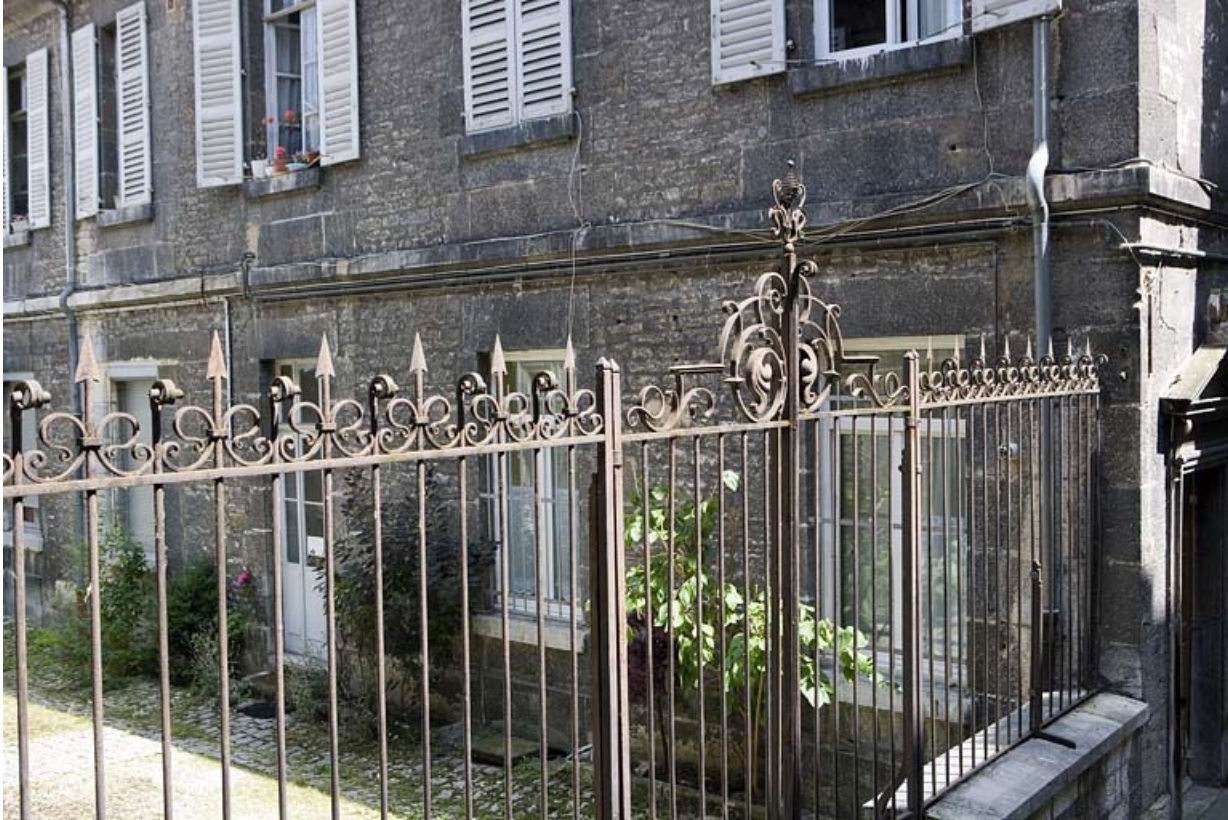
Vue de la grille séparant les deux cours, de trois quarts gauche.

25, Besançon, 19 rue Mégevand, lieudit : îlot Terrier de Santans