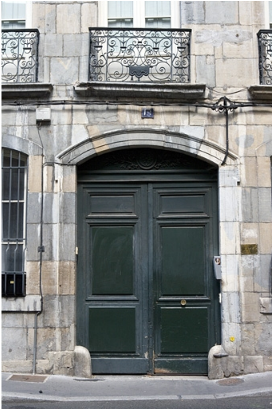
Logis principal : détail du portail d'entrée.

25, Besançon, 19 rue Mégevand, lieudit : îlot Terrier de Santans