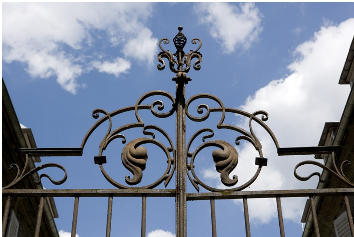
Détail de la partie supérieure de la grille séparant les deux cours.

25, Besançon, 19 rue Mégevand, lieudit : îlot Terrier de Santans