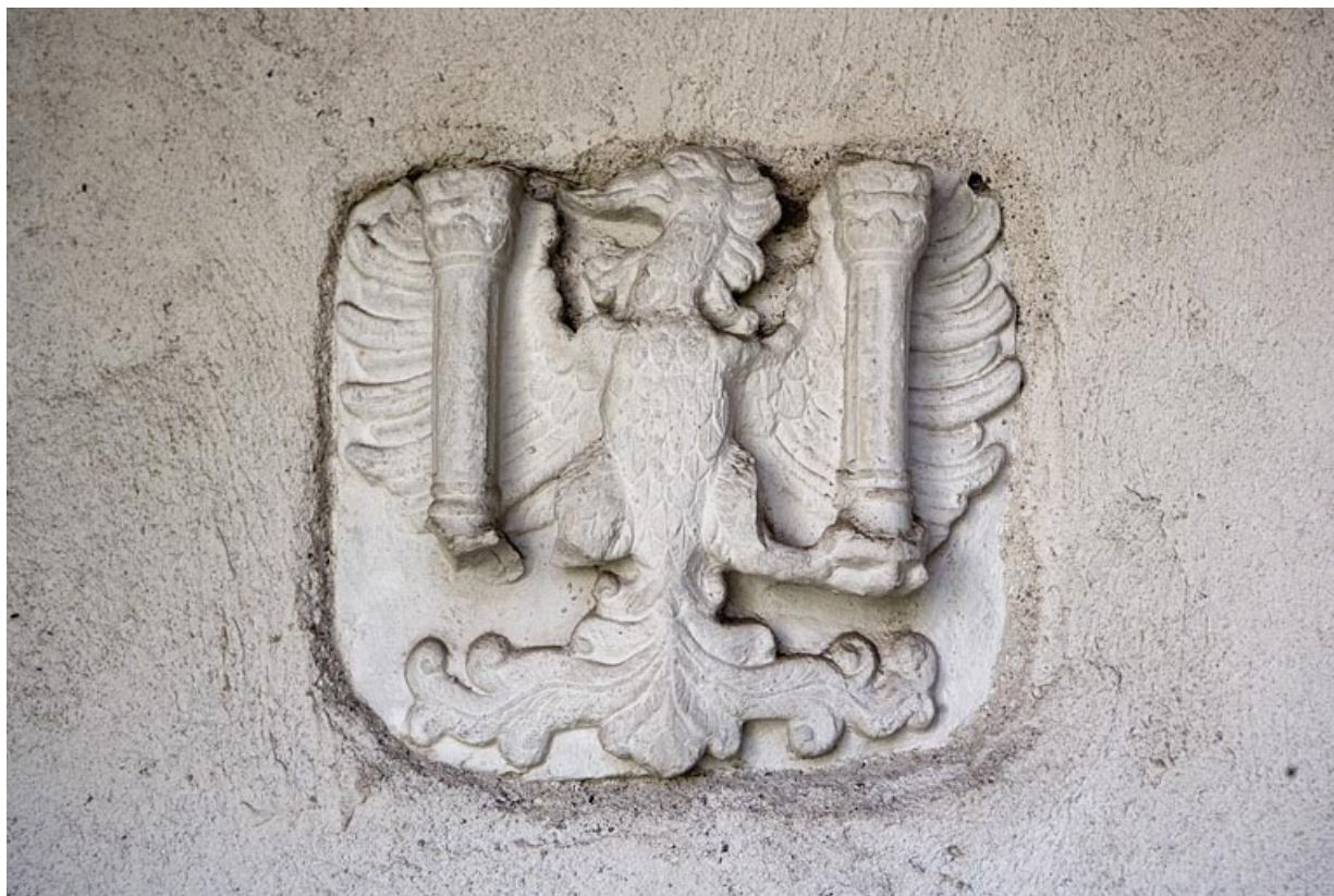
Détail du bas-relief représentant les armoiries de la ville situé dans l'escalier.

25, Besançon, 5 rue Mégevand, lieudit : îlot Terrier de Santans