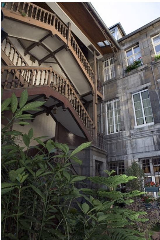
Vue de l'escalier à cage ouverte, de trois quart gauche. 25, Besançon, 5 rue Mégevand, lieudit : îlot Terrier de Santans