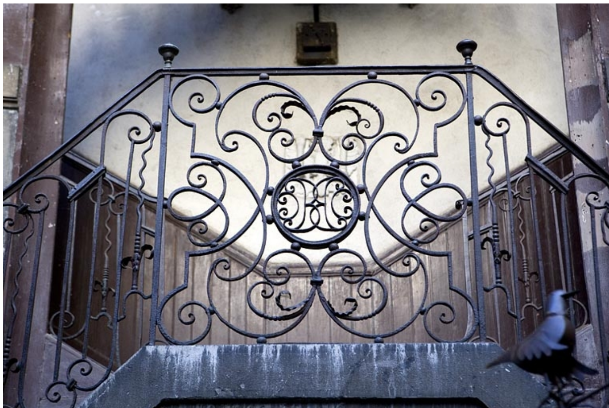
Détail de la rampe en ferronnerie de l'escalier à cage ouverte, avec le monogramme du propriétaire. 25, Besançon, 5 rue Mégevand, lieudit : îlot Terrier de Santans