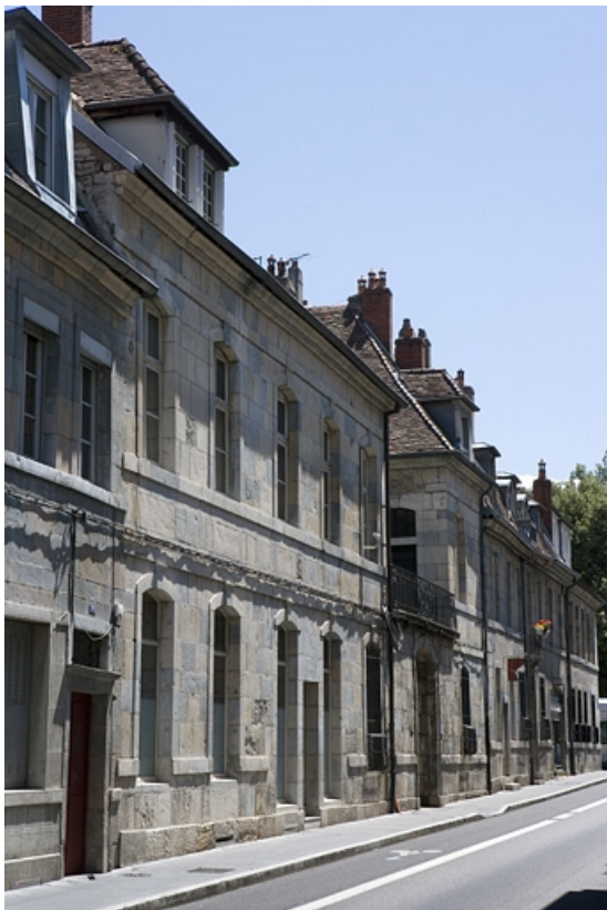
Vue d'ensemble de l'édifice, de trois quarts gauche.

25, Besançon, 33 rue Mégevand, lieudit : îlot Terrier de Santans