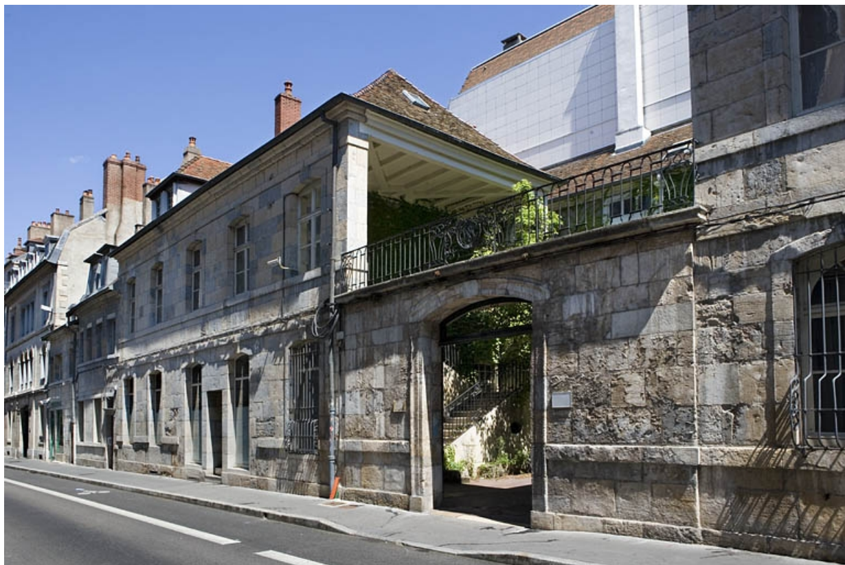
Vue d'ensemble de l'édifice depuis la rue, de trois quarts droit : vue rapprochée.

25, Besançon, 33 rue Mégevand, lieudit : îlot Terrier de Santans