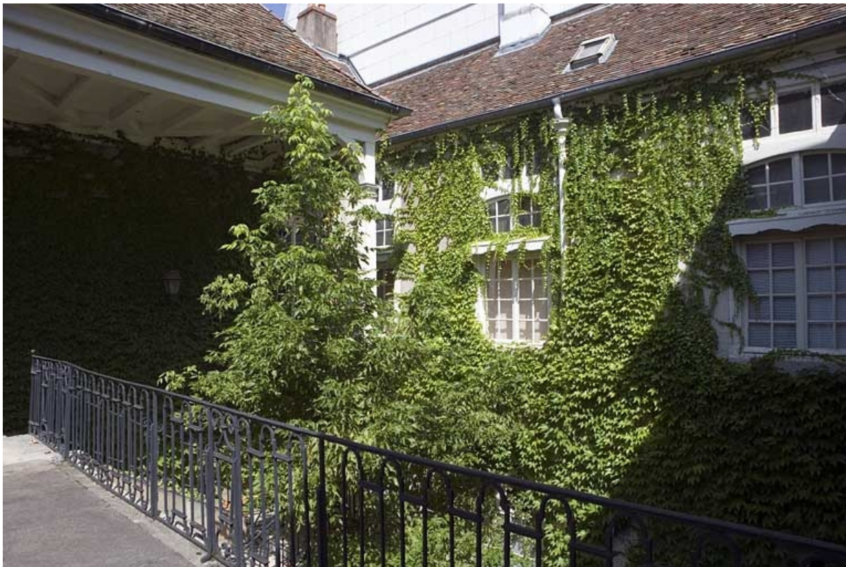
Détail de l'aile en fond de cour depuis le passage au-dessus du portail dans clôture.

25, Besançon, 33 rue Mégevand, lieudit : îlot Terrier de Santans