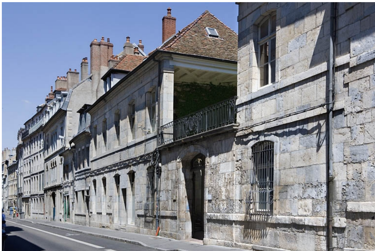
Vue d'ensemble de l'édifice depuis la rue, de trois quarts droit.

25, Besançon, 33 rue Mégevand, lieudit : îlot Terrier de Santans