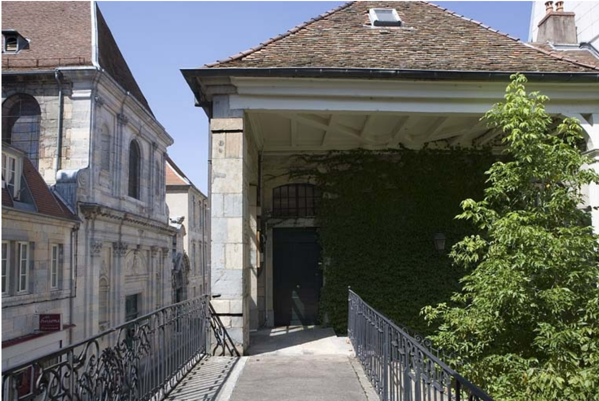
Vue du passage au-dessus du portail dans clôture depuis le bâtiment droit.

25, Besançon, 33 rue Mégevand, lieudit : îlot Terrier de Santans