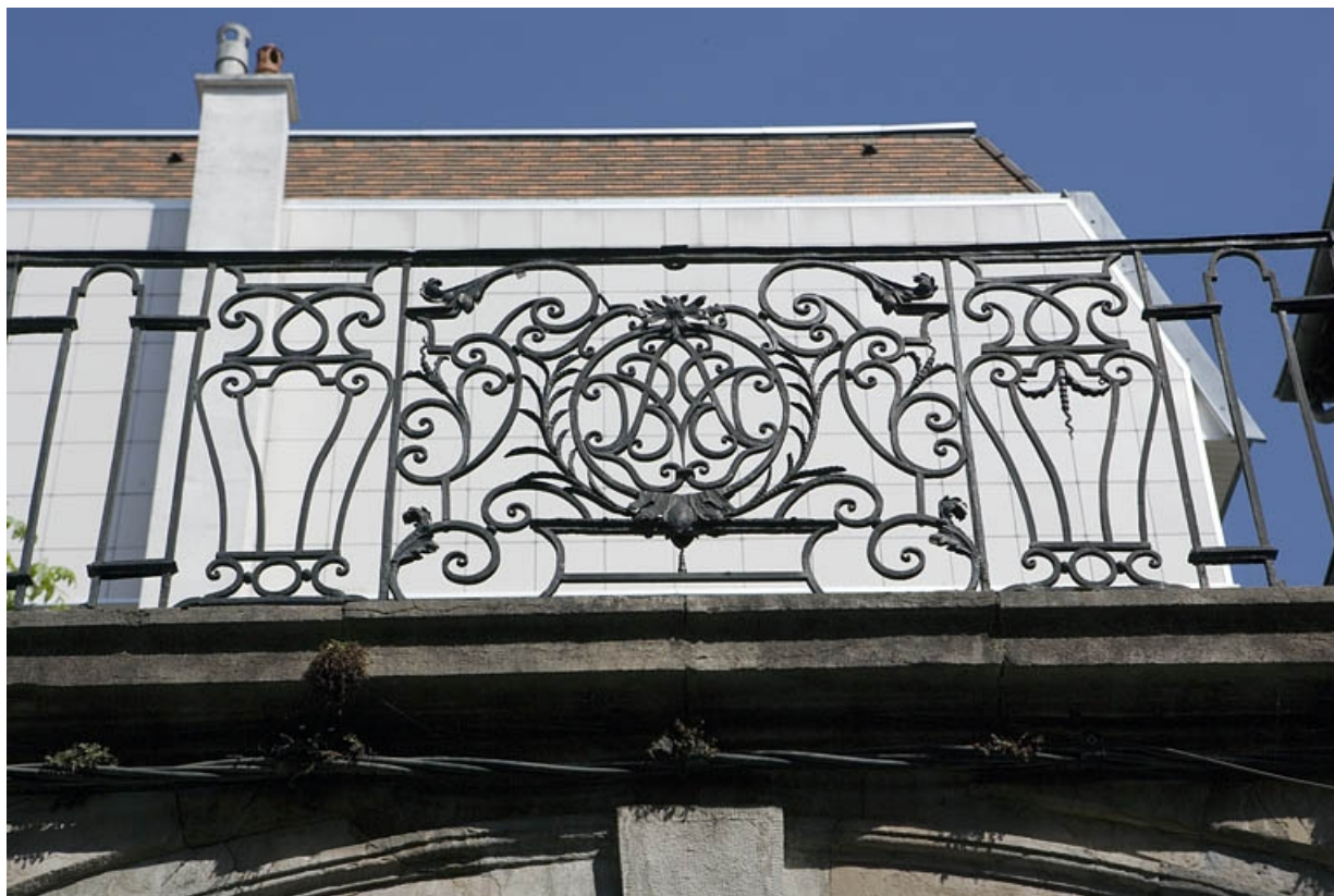
Passage au-dessus du portail dans clôture : détail de la partie centrale du garde-corps en ferronnerie. 25, Besançon, 33 rue Mégevand, lieudit : îlot Terrier de Santans