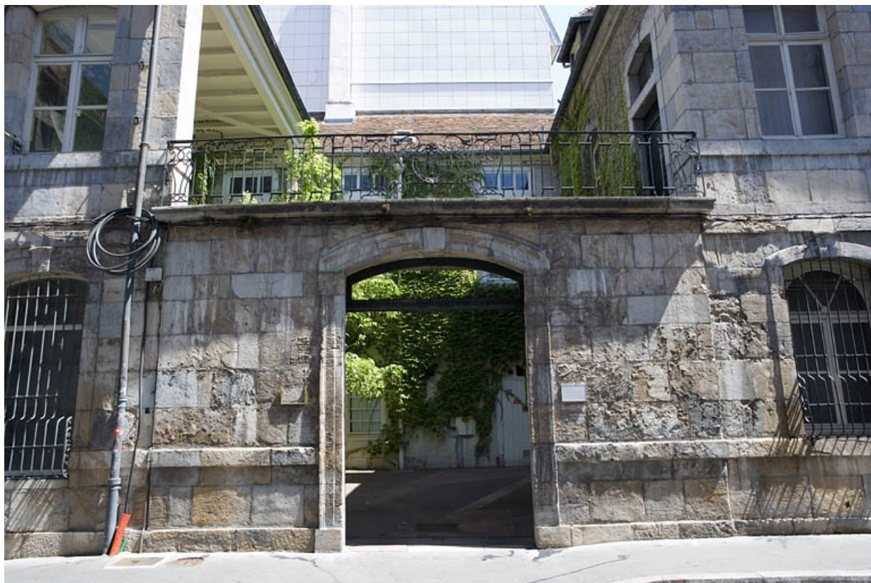
Détail du portail dans clôture depuis la rue, de face.

25, Besançon, 33 rue Mégevand, lieudit : îlot Terrier de Santans