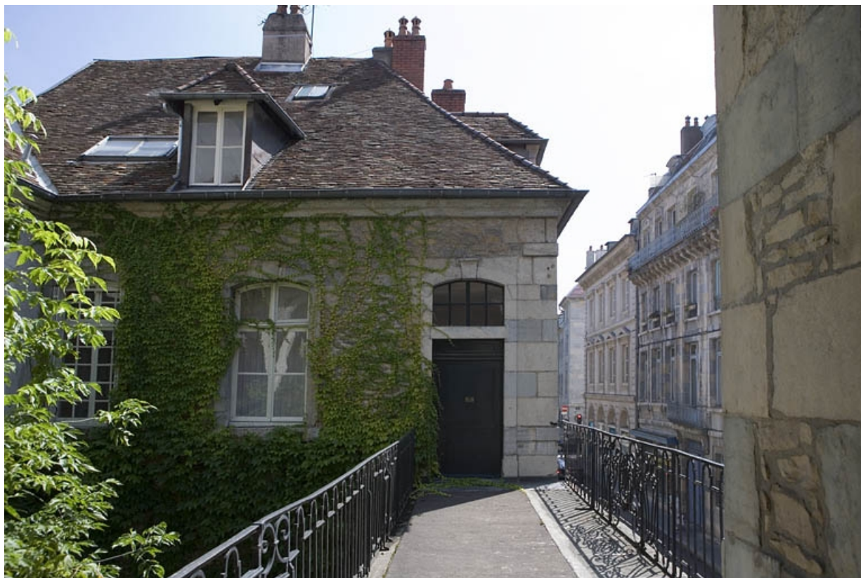
Vue du passage au-dessus du portail dans clôture depuis le bâtiment gauche. 25, Besançon, 33 rue Mégevand, lieudit : îlot Terrier de Santans