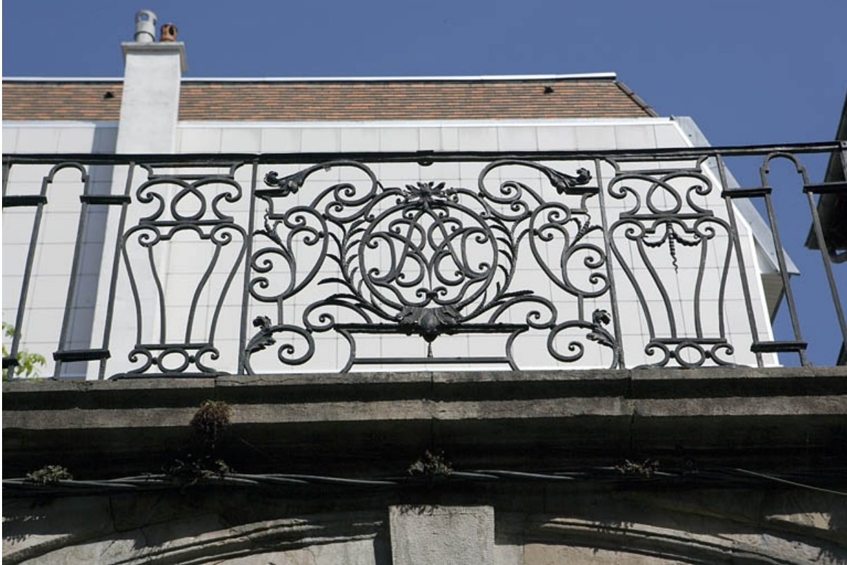
Passage au-dessus du portail dans clôture : détail de la partie centrale du garde-corps en ferronnerie.

25, Besançon, 33 rue Mégevand, lieudit : îlot Terrier de Santans