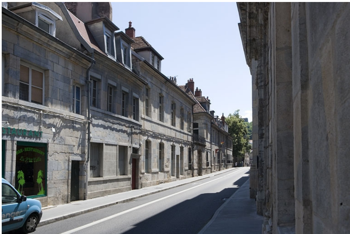
Vue d'ensemble de l'édifice dans l'alignement de la rue, de trois quarts gauche.

25, Besançon, 33 rue Mégevand, lieudit : îlot Terrier de Santans