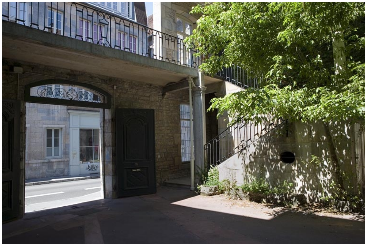
Vue du portail dans clôture depuis la cour, de trois quarts gauche.

25, Besançon, 33 rue Mégevand, lieudit : îlot Terrier de Santans