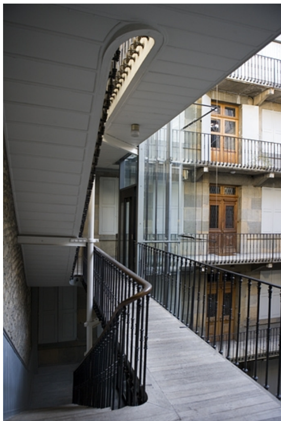
Détail de l'escalier à cage ouverte depuis l'un des paliers. 25, Besançon Grande Rue 70, lieudit : îlot Terrier de Santans