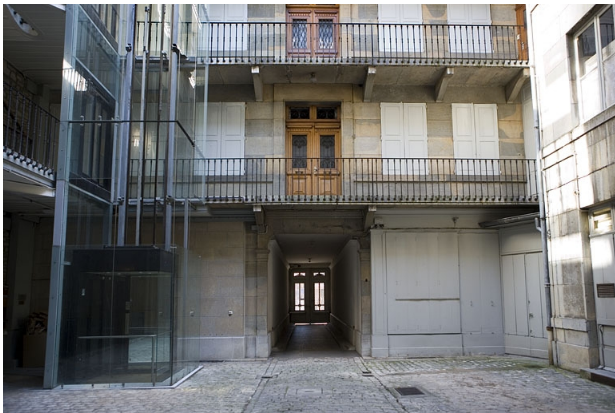
Vue du logis en fond de cour avec son passage cocher.

25, Besançon Grande Rue 70, lieudit : îlot Terrier de Santans