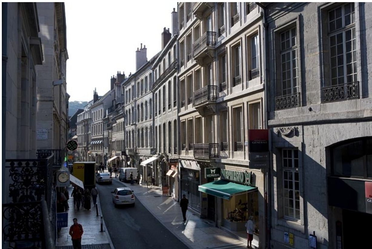
Vue d'ensemble de l'édifice dans l'alignement de la rue : de trois quarts droit.

25, Besançon Grande Rue 70, lieudit : îlot Terrier de Santans