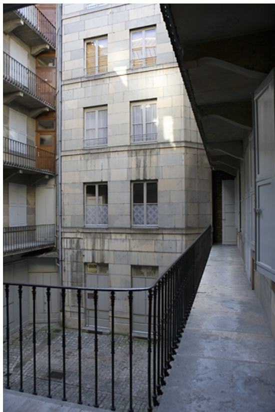
Vue de l'aile gauche sur cour de trois quarts droit.

25, Besançon Grande Rue 70, lieudit : îlot Terrier de Santans