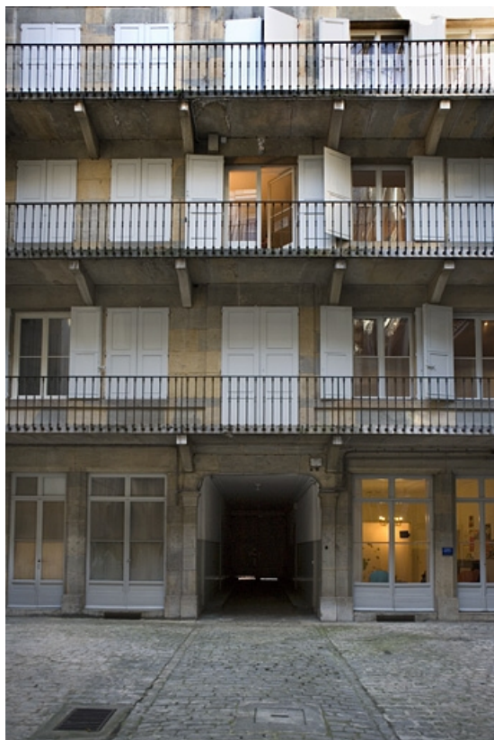
Vue de la façade postérieure du logis sur rue.

25, Besançon Grande Rue 70, lieudit : îlot Terrier de Santans