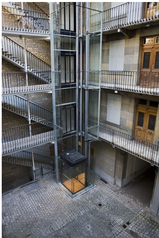
Vue de l'ascenseur situé à un angle de la cour.

25, Besançon Grande Rue 70, lieu-dit : îlot Terrier de Santans