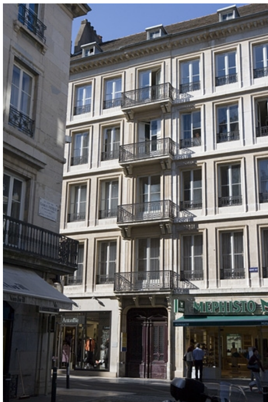
Vue d'ensemble rapprochée de l'édifice depuis la rue. 25, Besançon Grande Rue 70, lieudit : îlot Terrier de Santans