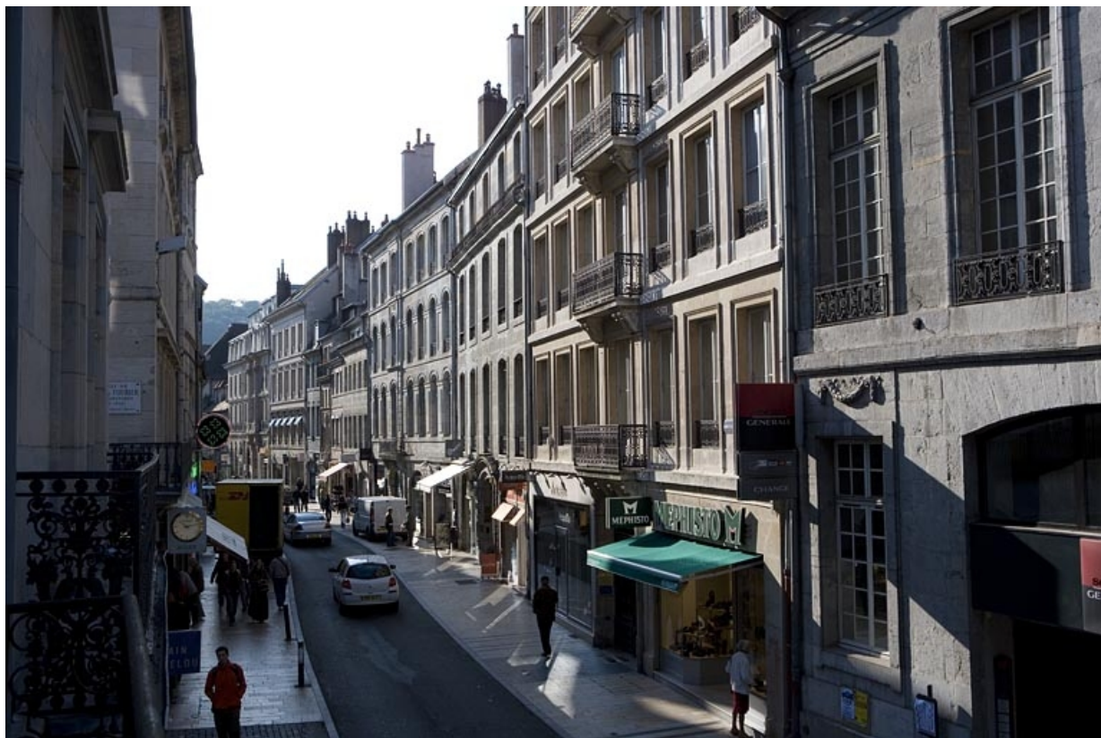
Vue d'ensemble de l'édifice dans l'alignement de la rue : de trois quarts droit.

25, Besançon Grande Rue 70, lieudit : îlot Terrier de Santans