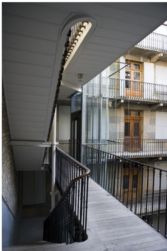
Détail de l'escalier à cage ouverte depuis l'un des paliers. 25, Besançon Grande Rue 70, lieudit : îlot Terrier de Santans