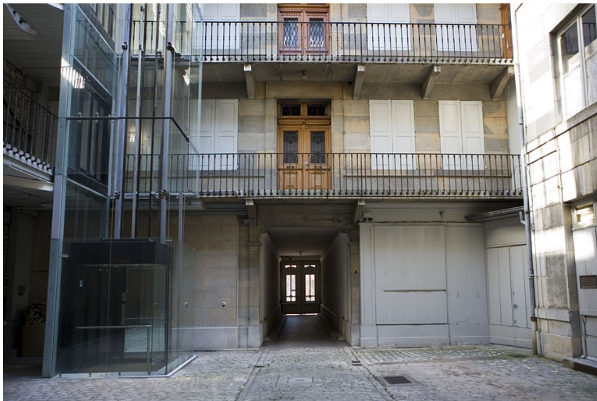
Vue du logis en fond de cour avec son passage cocher.

25, Besançon Grande Rue 70, lieudit : îlot Terrier de Santans