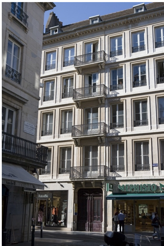
Vue d'ensemble rapprochée de l'édifice depuis la rue. 25, Besançon Grande Rue 70, lieudit : îlot Terrier de Santans