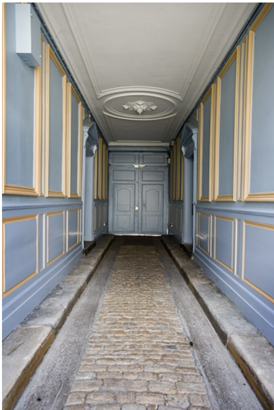
Logis principal : vue rapprochée du passage cocher depuis la cour. 25, Besançon, 17 rue Mégevand, lieudit : îlot Terrier de Santans