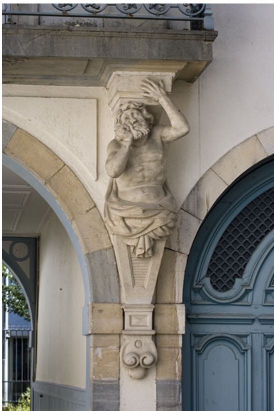
Détail de l'atlante droit supportant le balcon du logis en fond de cour, de face. 25, Besançon, 17 rue Mégevand, lieudit : îlot Terrier de Santans