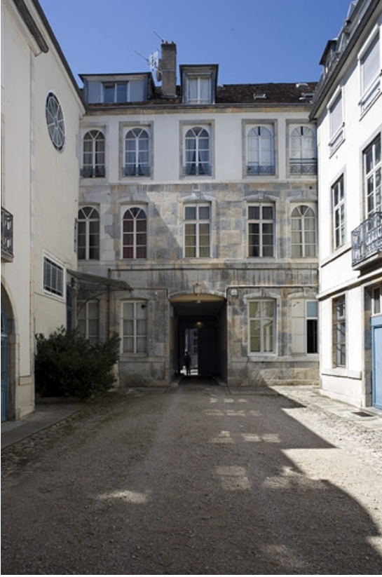
Vue d'ensemble des bâtiments autour de la première cour. 25, Besançon, 17 rue Mégevand, lieudit : îlot Terrier de Santans