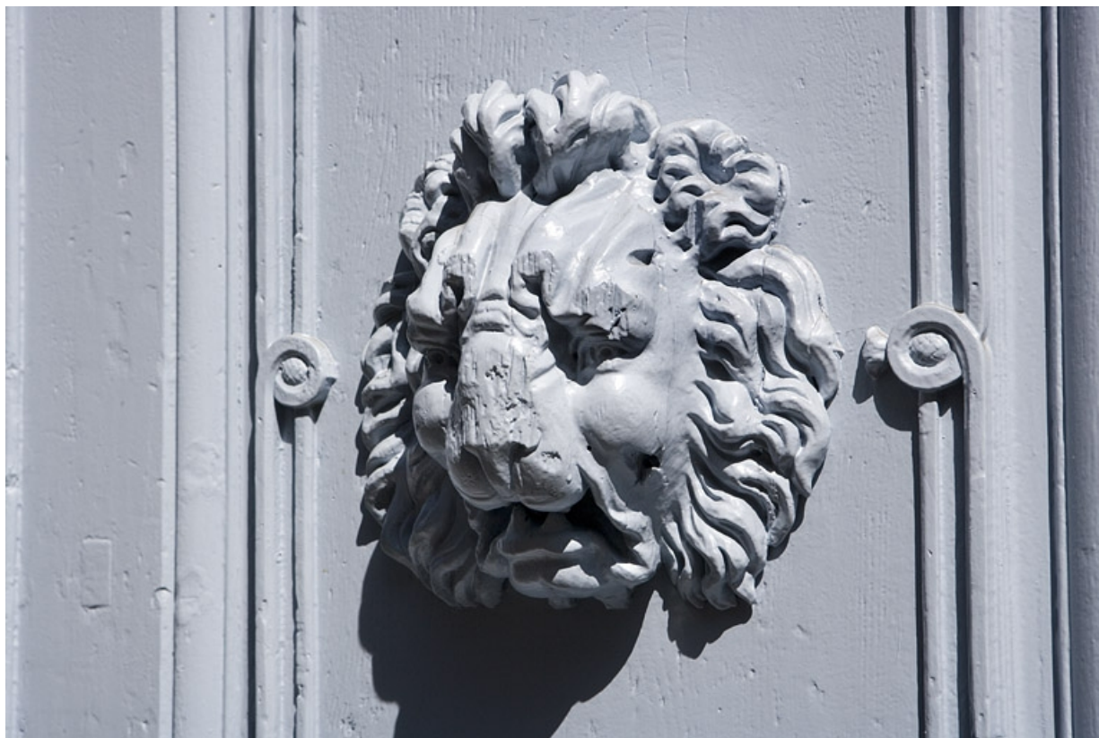
Logis principal : détail d'une tête de lion sur l'un des vantaux du portail d'entrée : de trois quarts. 25, Besançon, 17 rue Mégevand, lieudit : îlot Terrier de Santans