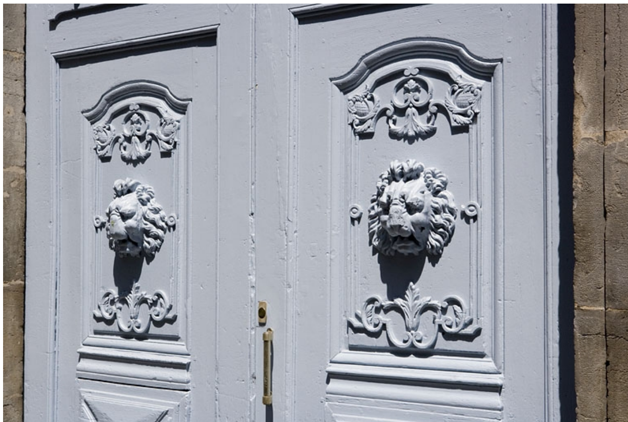
Logis principal : détail des deux vantaux du portail d'entrée décorés d'une tête de lion. 25, Besançon, 17 rue Mégevand, lieudit : îlot Terrier de Santans