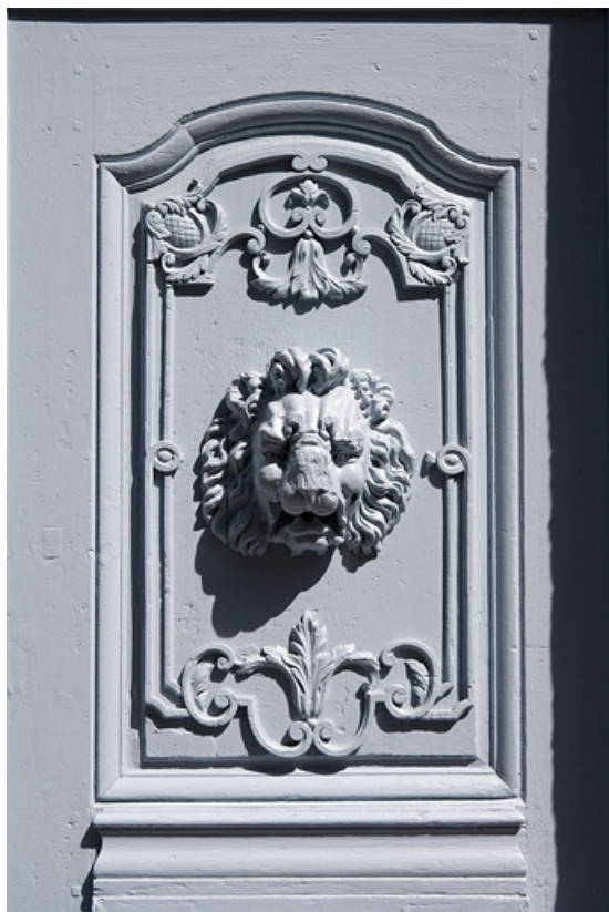
Logis principal : détail d'un panneau des vantaux du portail d'entrée. 25, Besançon, 17 rue Mégevand, lieudit : îlot Terrier de Santans