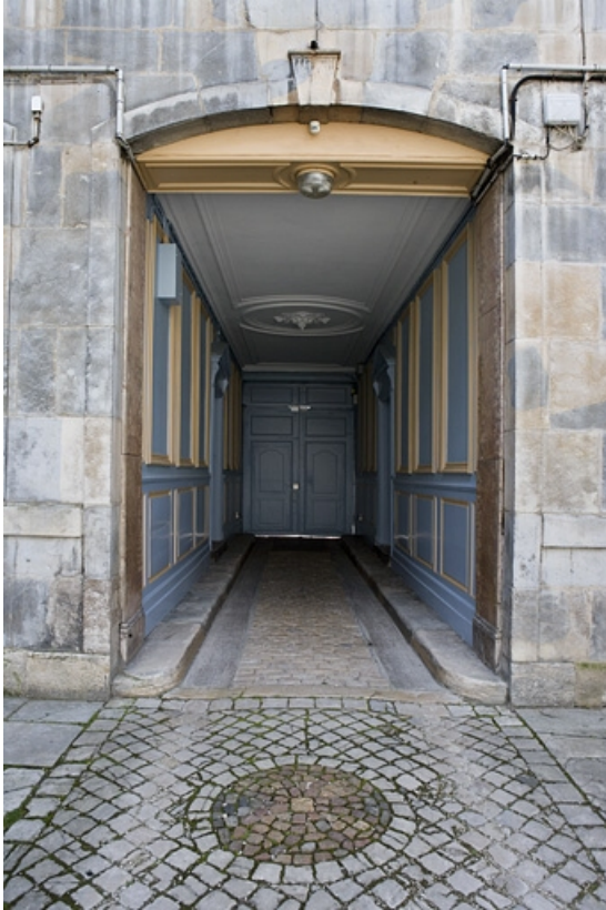
Logis principal : vue d'ensemble du passage cocher depuis la cour. 25, Besançon, 17 rue Mégevand, lieudit : îlot Terrier de Santans