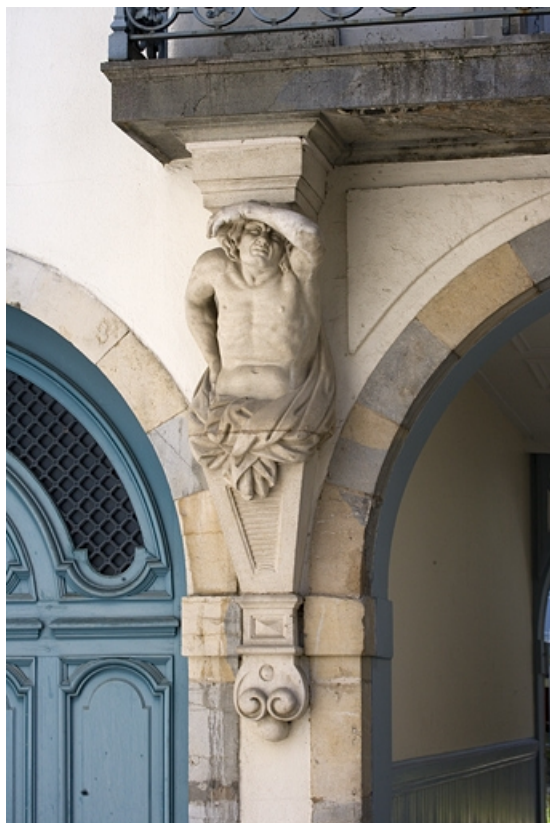
Détail de l'atlante gauche supportant le balcon du logis en fond de cour, de face. 25, Besançon, 17 rue Mégevand, lieudit : îlot Terrier de Santans