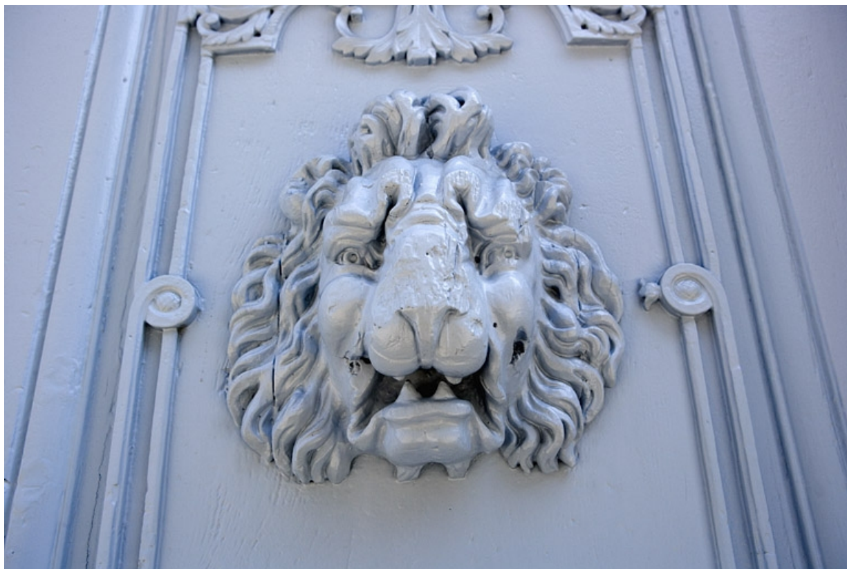
Logis principal : détail d'une tête de lion décorant un des vantaux du portail d'entrée. 25, Besançon, 17 rue Mégevand, lieudit : îlot Terrier de Santans