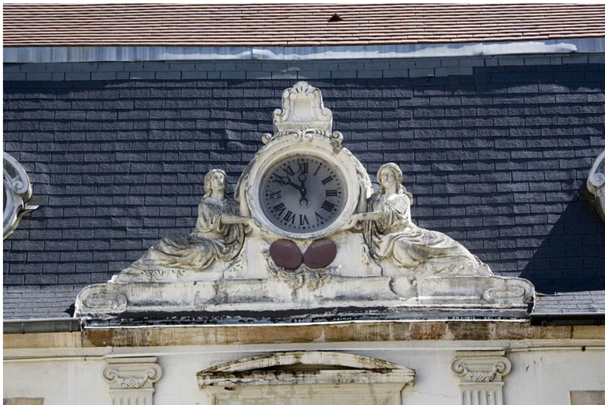
Détail de l'horloge couronnant la partie centrale du logis au fond de la première cour : vue rapprochée. 25, Besançon, 17 rue Mégevand, lieudit : îlot Terrier de Santans