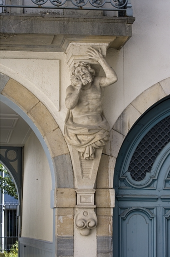
Détail de l'atlante droit supportant le balcon du logis en fond de cour, de face. 25, Besançon, 17 rue Mégevand, lieudit : îlot Terrier de Santans