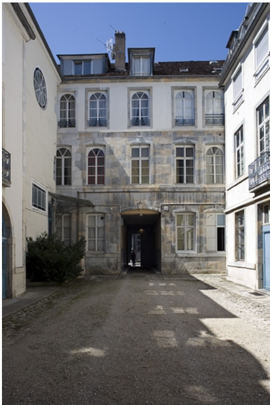
Vue d'ensemble des bâtiments autour de la première cour. 25, Besançon, 17 rue Mégevand, lieudit : îlot Terrier de Santans