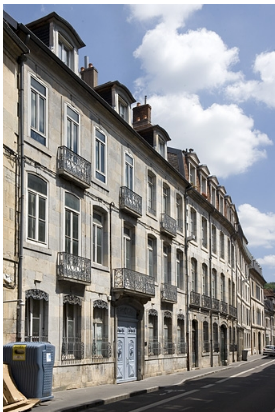
Vue d'ensemble dans l'alignement de la rue, de trois quarts gauche. 25, Besançon, 17 rue Mégevand, lieudit : îlot Terrier de Santans