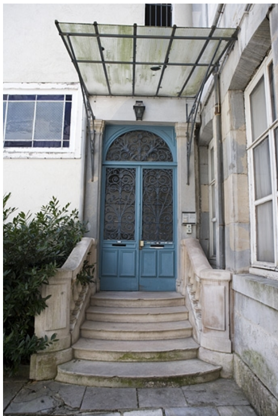
Détail de la porte d'entrée de l'escalier situé dans l'aile droite sur cour. 25, Besançon, 17 rue Mégevand, lieudit : îlot Terrier de Santans