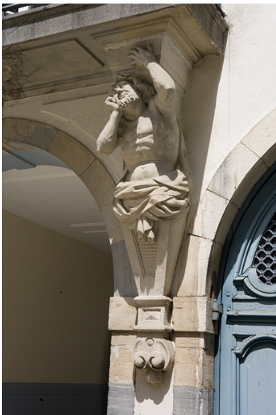
Détail de l'atlante droit supportant le balcon du logis en fond de cour, de trois quarts. 25, Besançon, 17 rue Mégevand, lieudit : îlot Terrier de Santans