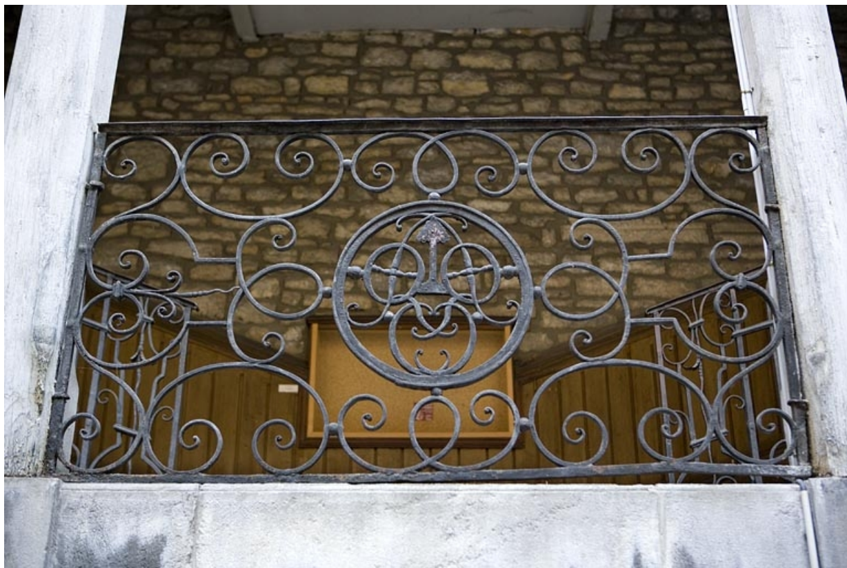
Détail du monogramme situé sur la rampe en ferronnerie de l'escalier à cage ouverte droit.

25, Besançon, 64 Grande Rue, lieudit : îlot Terrier de Santans