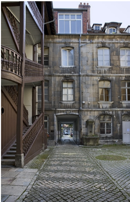
Vue d'ensemble de l'escalier gauche et du logis secondaire depuis l'entrée de la première cour.

25, Besançon, 64 Grande Rue, lieudit : îlot Terrier de Santans