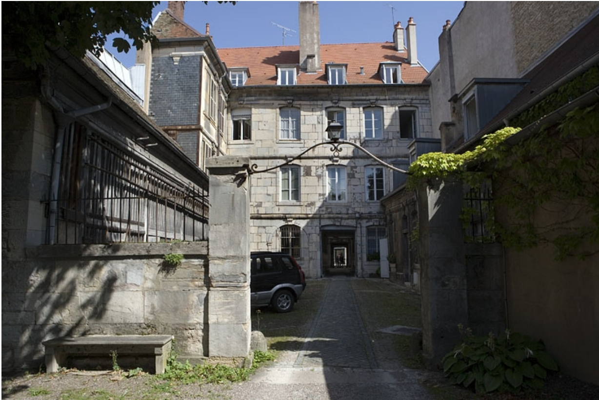
Vue de la façade postérieure du logis secondaire depuis l'entrée de la troisième cour.

25, Besançon, 64 Grande Rue, lieudit : îlot Terrier de Santans