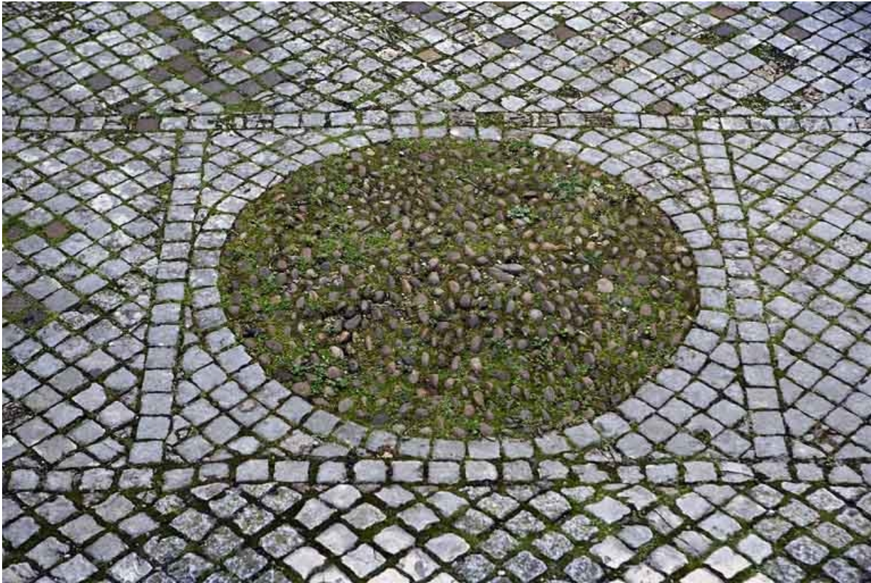
Pavage de la première cour : détail du motif central.

25, Besançon, 64 Grande Rue, lieudit : îlot Terrier de Santans