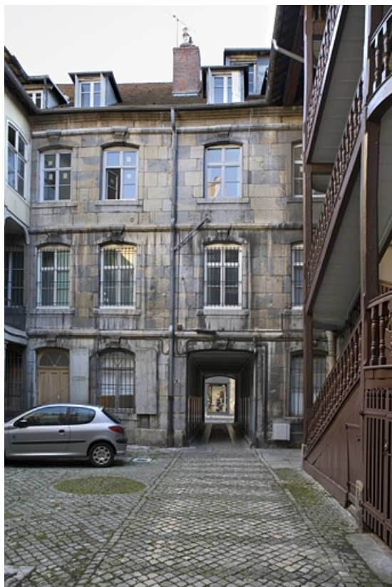
Vue d'ensemble de la façade postérieure du logis principal depuis le fond de la première cour, de face. 25, Besançon, 64 Grande Rue, lieudit : îlot Terrier de Santans