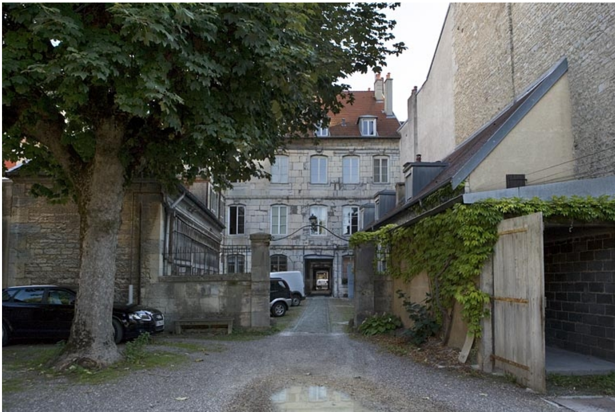
Vue d'ensemble des bâtiments depuis le fond de la parcelle.

25, Besançon, 64 Grande Rue, lieudit : îlot Terrier de Santans