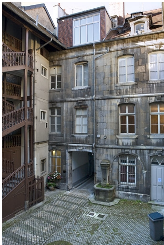
Vue du logis secondaire au fond de la première cour depuis l'escalier droit. 25, Besançon, 64 Grande Rue, lieudit : îlot Terrier de Santans