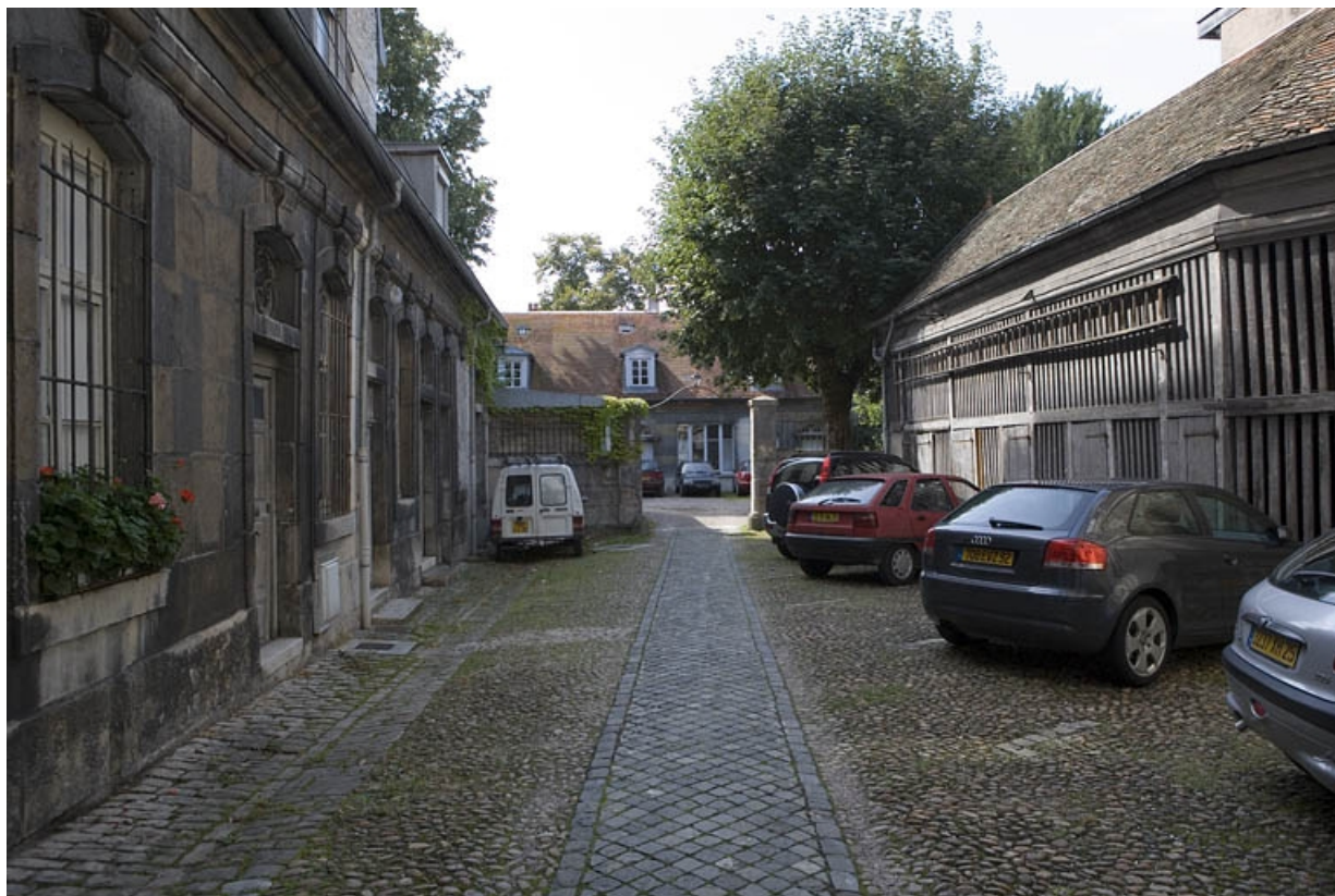
Vue d'ensemble des bâtiments situés dans la deuxième cour.

25, Besançon, 64 Grande Rue, lieudit : îlot Terrier de Santans