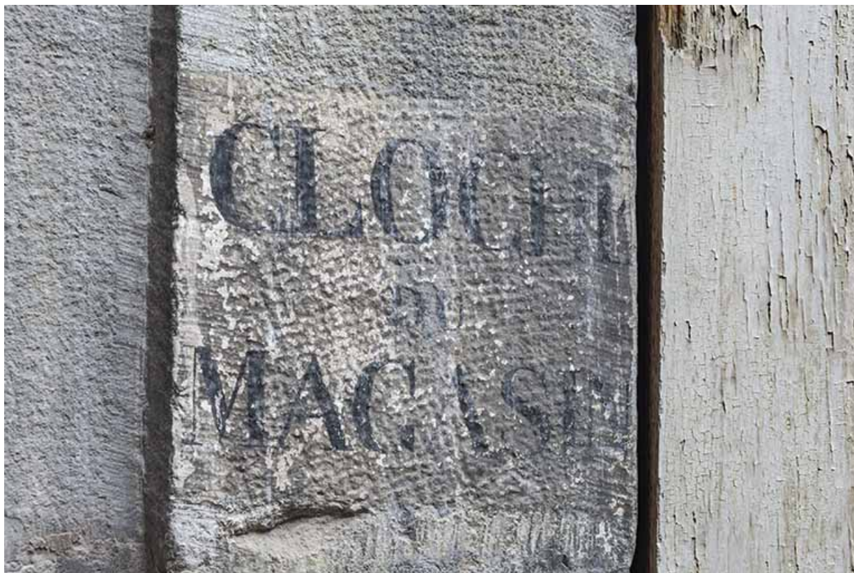
Détail de l'inscription "Cloche du magasin" sur la façade postérieure du logis principal.

25, Besançon, 64 Grande Rue, lieudit : îlot Terrier de Santans