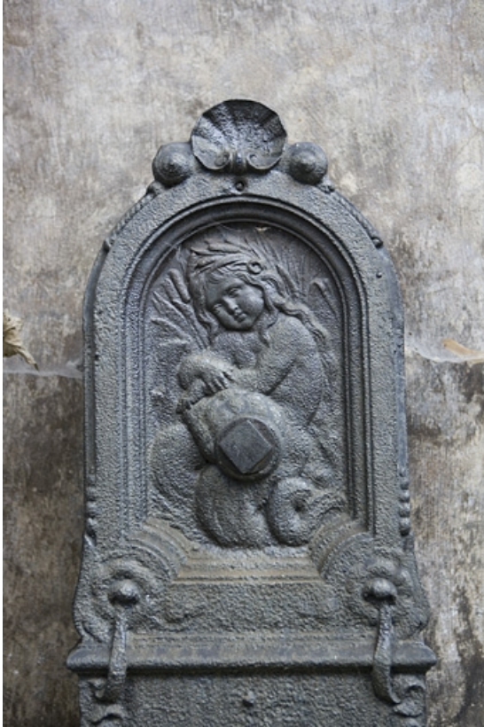
Détail de la partie supérieure de la borne fontaine située dans la deuxième cour. 25, Besançon, 64 Grande Rue, lieudit : îlot Terrier de Santans