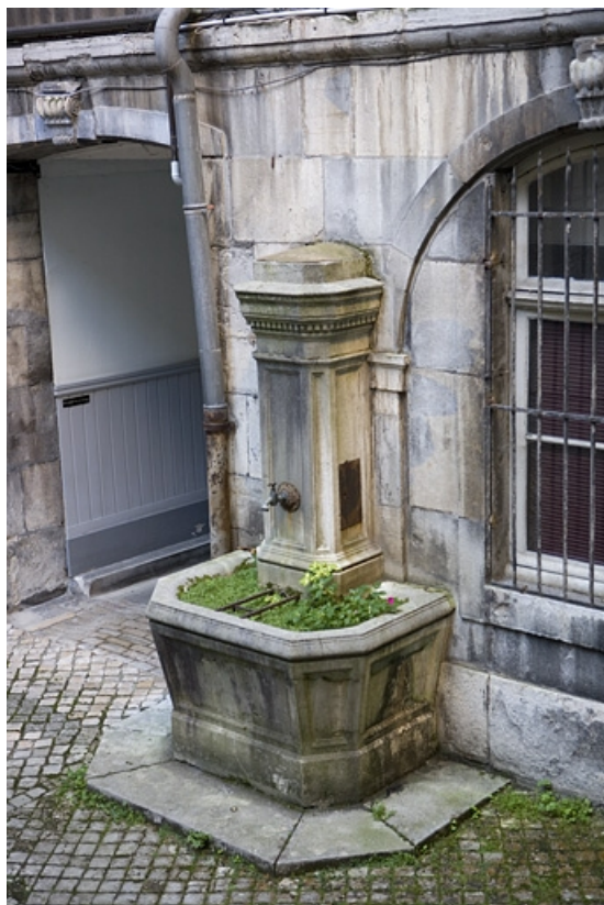
Détail de la borne fontaine située dans la première cour. 25, Besançon, 64 Grande Rue, lieudit : îlot Terrier de Santans