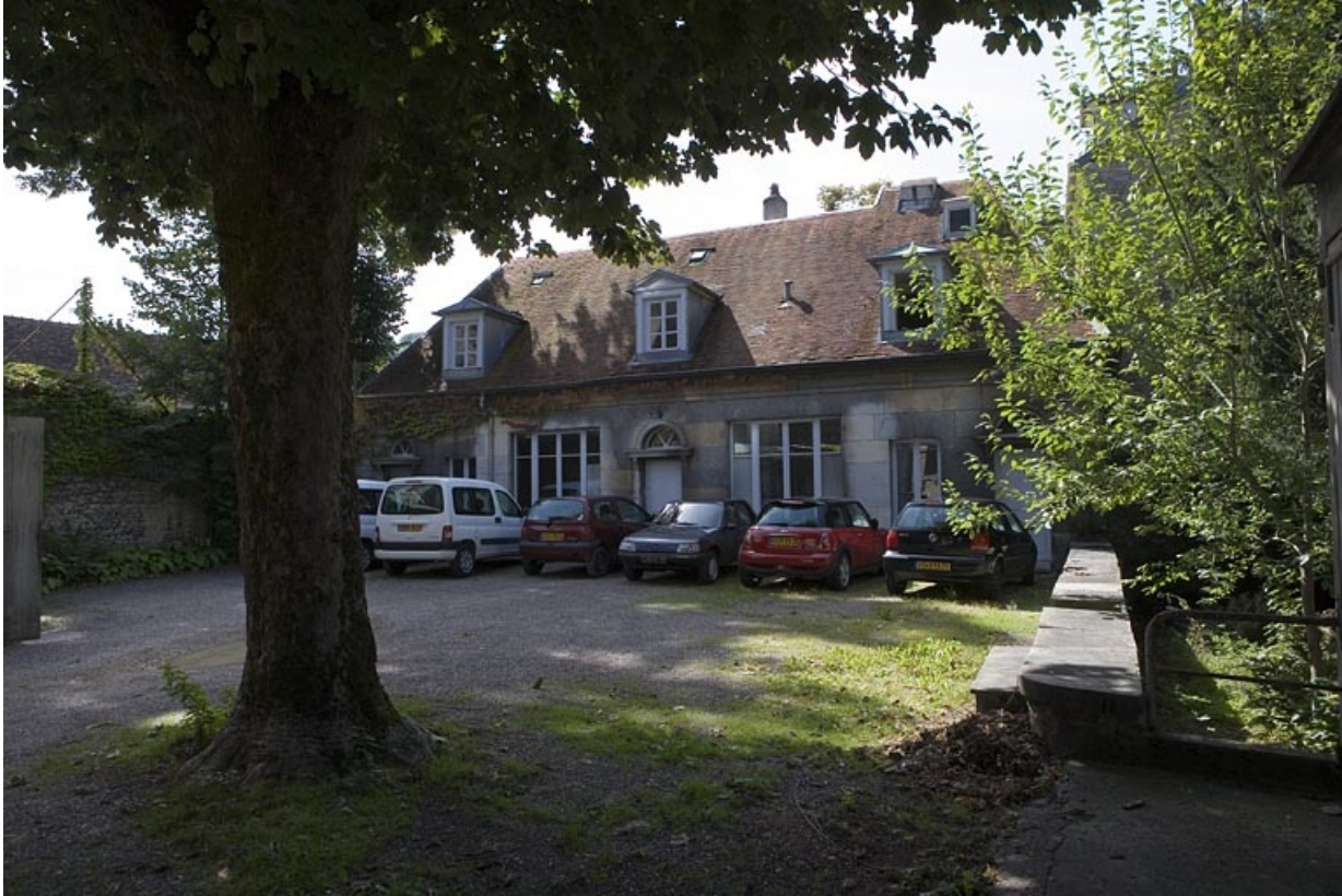
Vue du bâtiment des anciennes remise et écurie situé en fond de parcelle.

25, Besançon, 64 Grande Rue, lieudit : îlot Terrier de Santans