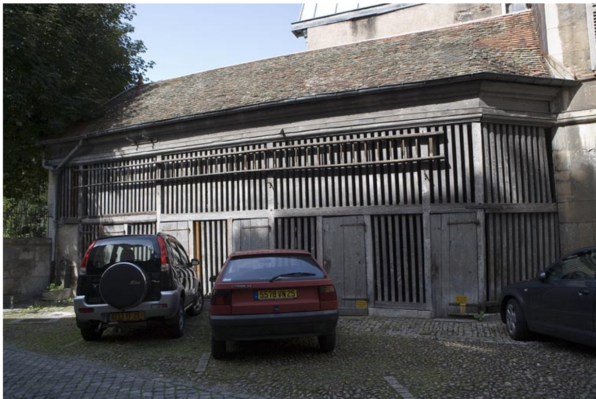
Vue du bûcher, de trois quarts droit, situé dans la deuxième cour.

25, Besançon, 64 Grande Rue, lieudit : îlot Terrier de Santans