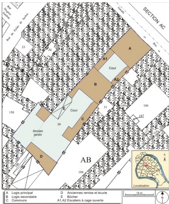
Plan masse et de situation. Extrait du plan cadastral, 1974, section AB. 25, Besançon, 64 Grande Rue, lieudit : îlot Terrier de Santans