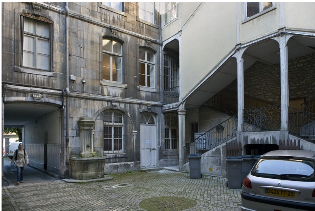
Vue de l'escalier à cage ouverte droit et du logis secondaire, de trois quarts gauche, depuis l'entrée de la première cour. 25, Besançon, 64 Grande Rue, lieudit : îlot Terrier de Santans