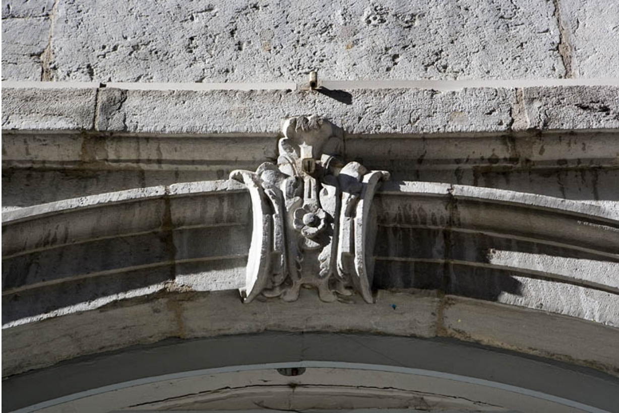
Portail d'entrée : détail de la clé de l'arc.

25, Besançon, 64 Grande Rue, lieudit : îlot Terrier de Santans