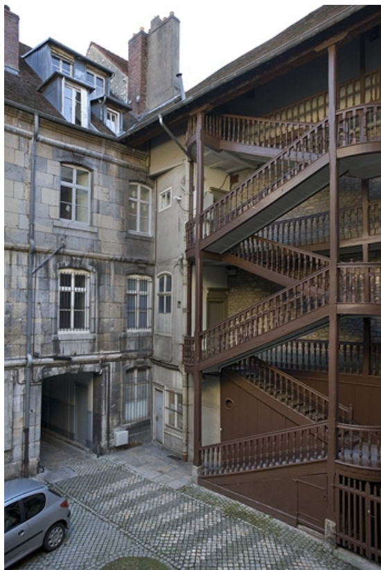
Vue de la façade postérieure du logis principal et de l'escalier gauche depuis le fond de la première cour. 25, Besançon, 64 Grande Rue, lieudit : îlot Terrier de Santans