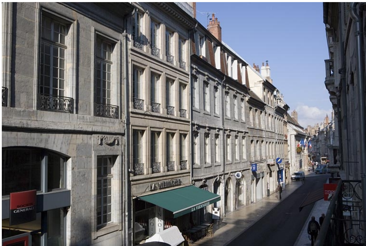
Vue d'ensemble de l'édifice dans l'alignement de la rue : de trois quarts gauche.

25, Besançon, 64 Grande Rue, lieudit : îlot Terrier de Santans