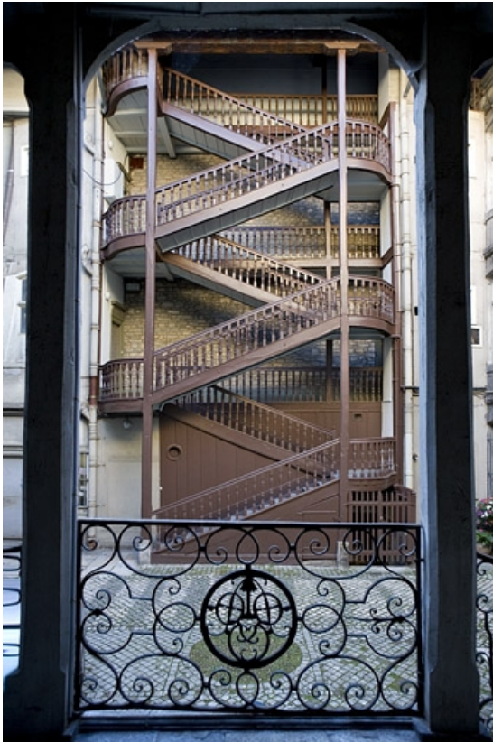
Vue de l'escalier à cage ouverte gauche, de face, depuis l'escalier droit.

25, Besançon, 64 Grande Rue, lieudit : îlot Terrier de Santans