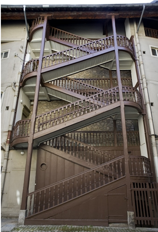
Vue de l'escalier à cage ouverte gauche, de face, depuis la cour.

25, Besançon, 64 Grande Rue, lieudit : îlot Terrier de Santans