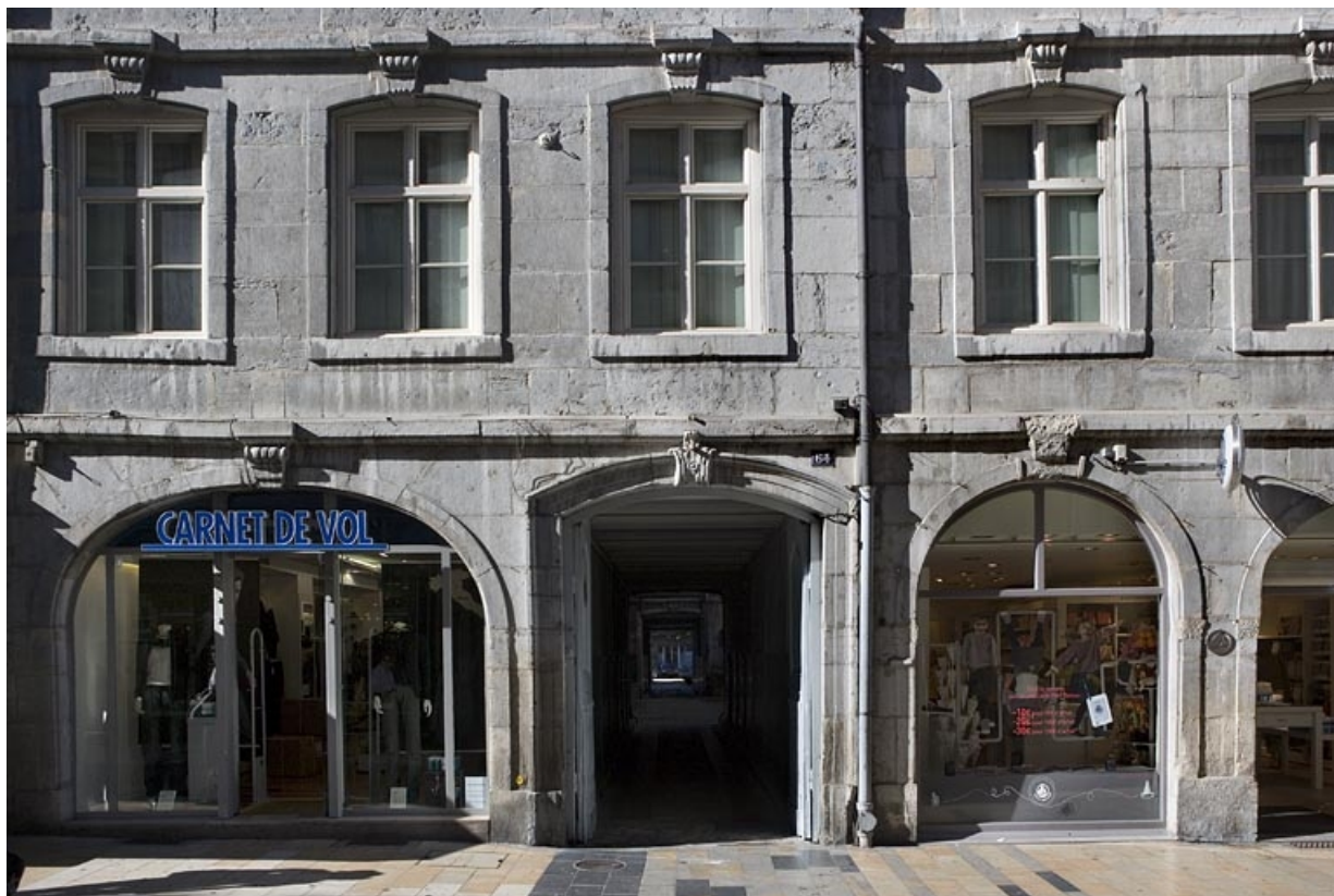
Façade sur rue du logis principal : détail du portail d'entrée, de face. 25, Besançon, 64 Grande Rue, lieudit : îlot Terrier de Santans