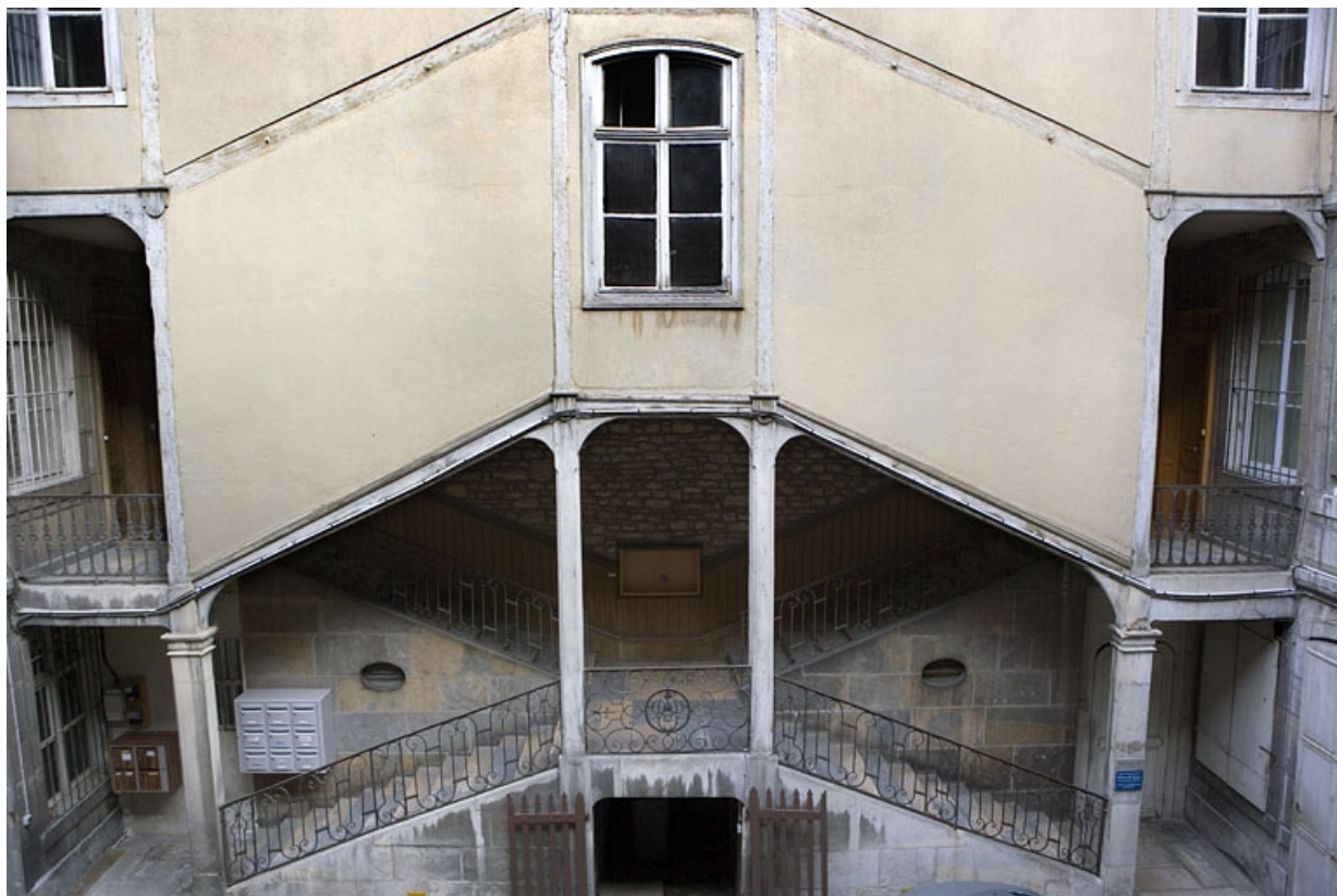
Vue d'ensemble de l'escalier à cage ouverte droit, de face, depuis l'escalier gauche.

25, Besançon, 64 Grande Rue, lieudit : îlot Terrier de Santans