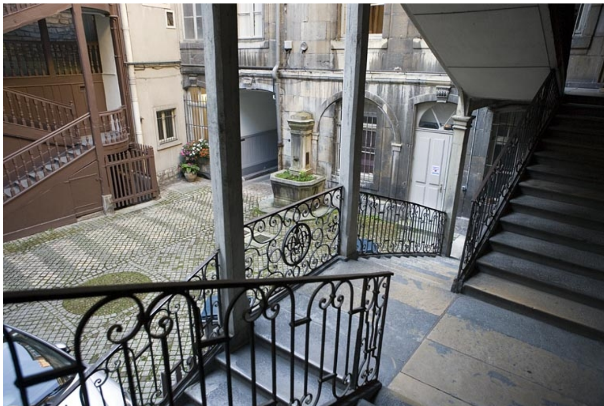
Vue de la rampe en ferronnerie de l'escalier à cage ouverte droit depuis le premier palier. 25, Besançon, 64 Grande Rue, lieudit : îlot Terrier de Santans