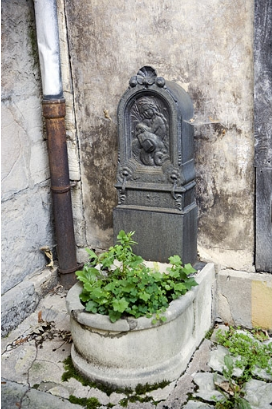
Détail de la borne fontaine située dans la deuxième cour. 25, Besançon, 64 Grande Rue, lieudit : îlot Terrier de Santans