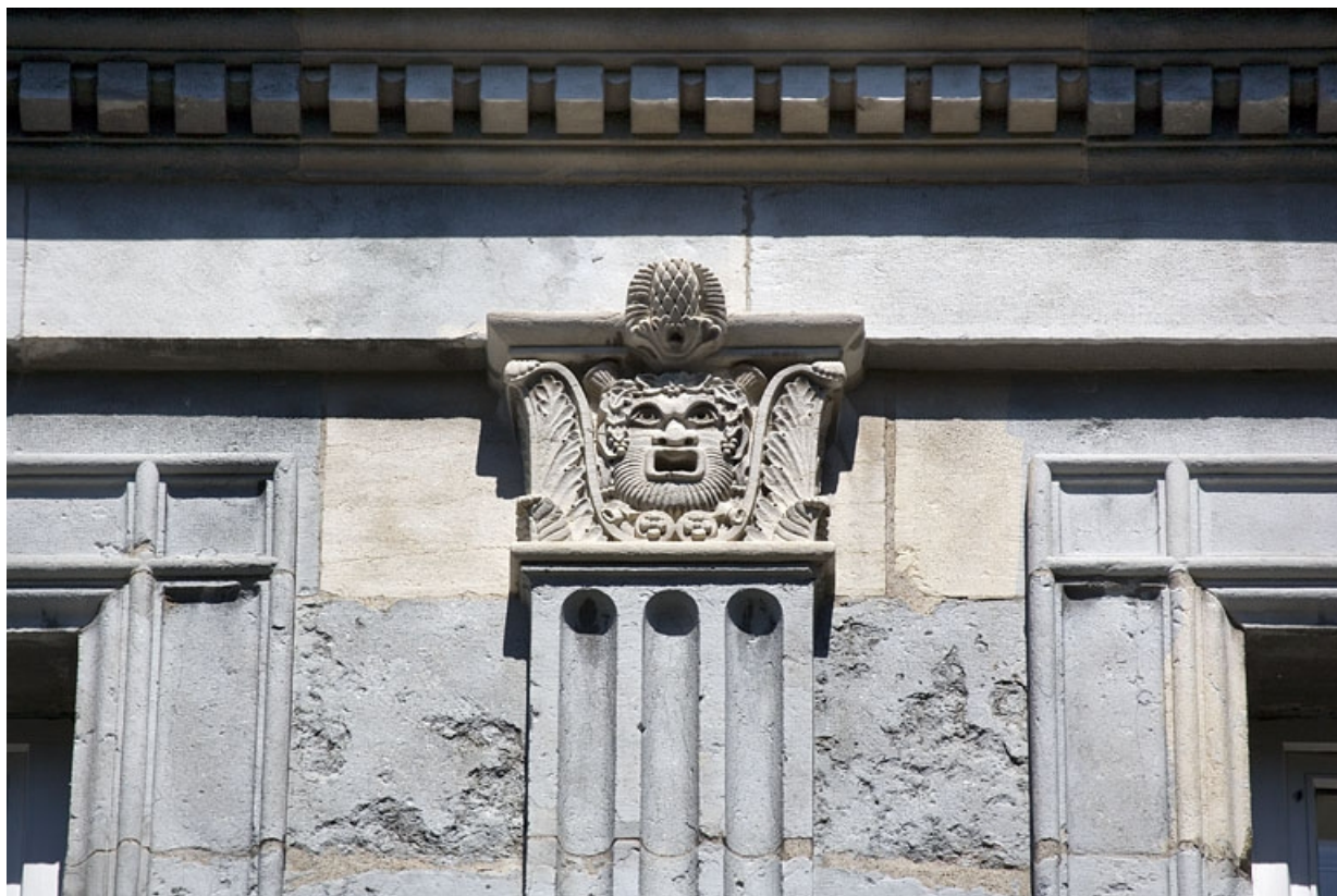
Façade sur rue : détail du chapiteau d'un pilastre du deuxième étage.

25, Besançon, 10 rue de la Préfecture, lieudit : îlot Terrier de Santans