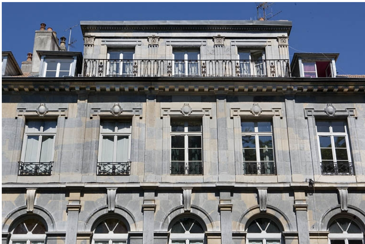
Vue d'ensemble de la partie haute de la façade sur rue.

25, Besançon, 10 rue de la Préfecture, lieudit : îlot Terrier de Santans