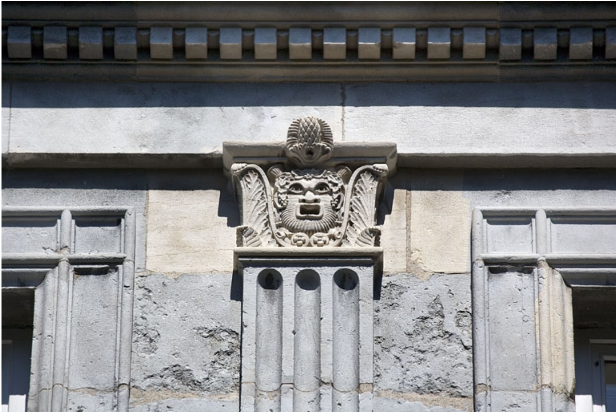
Façade sur rue : détail du chapiteau d'un pilastre du deuxième étage. 25, Besançon, 10 rue de la Préfecture, lieudit : îlot Terrier de Santans