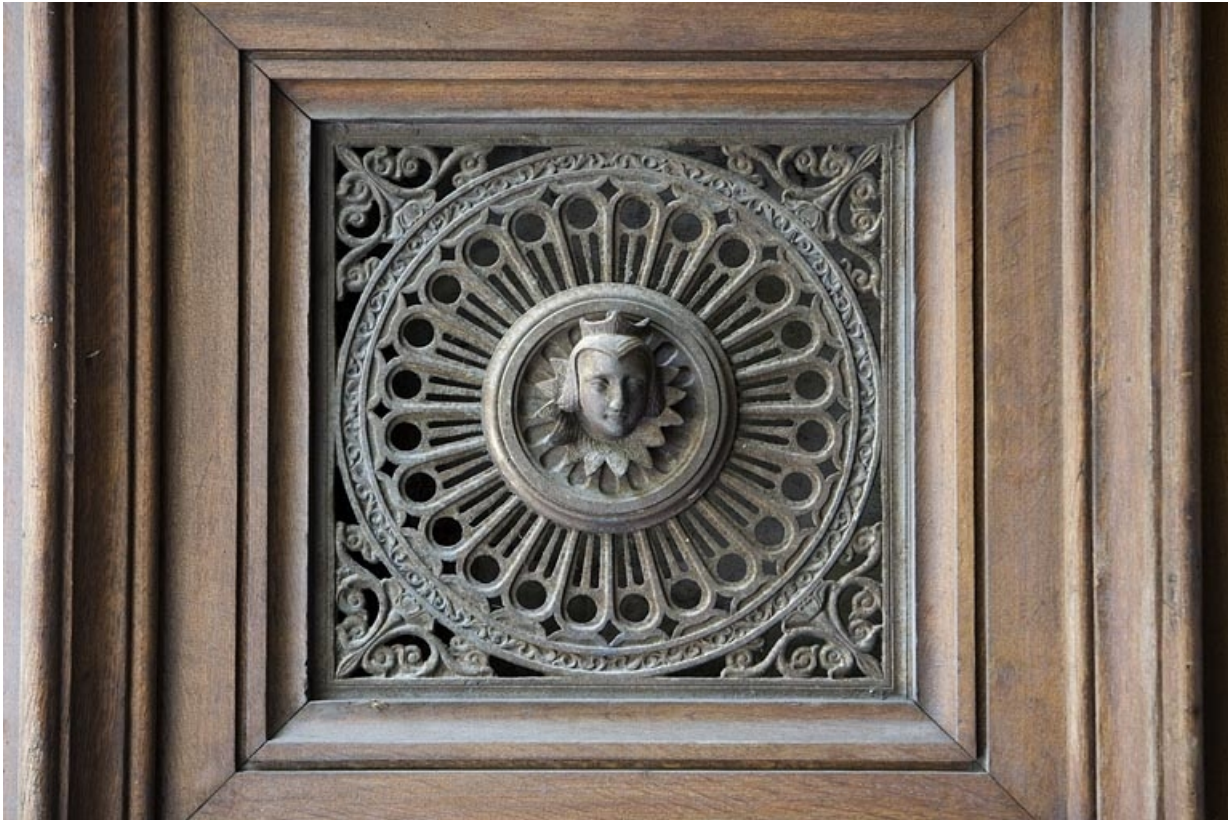
Détail du décor en fonte d'un des vantaux du portail d'entrée : tête de femme.

25, Besançon, 10 rue de la Préfecture, lieudit : îlot Terrier de Santans