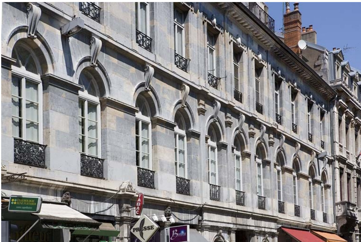
Façade sur rue : Vue d'ensemble du premier étage.

25, Besançon, 10 rue de la Préfecture, lieudit : îlot Terrier de Santans