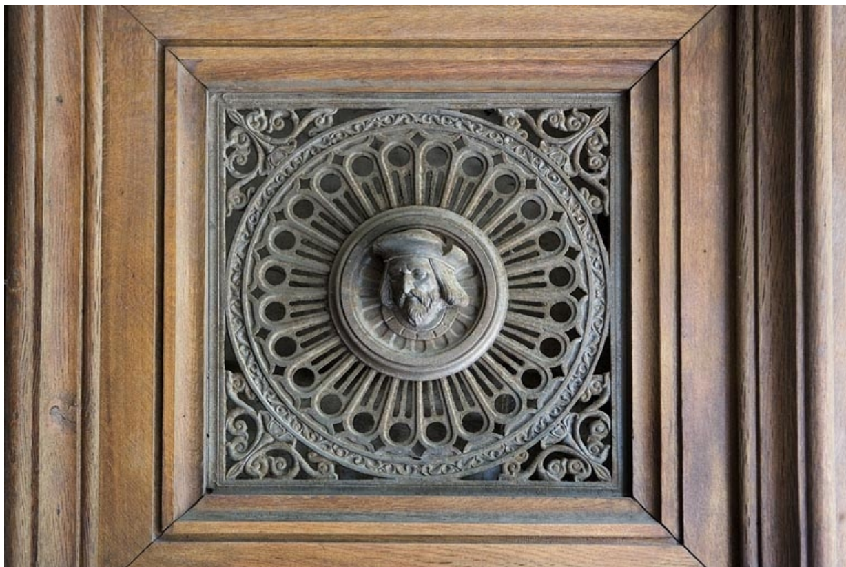
Détail du décor en fonte d'un des vantaux du portail d'entrée : tête d'homme.

25, Besançon, 10 rue de la Préfecture, lieudit : îlot Terrier de Santans