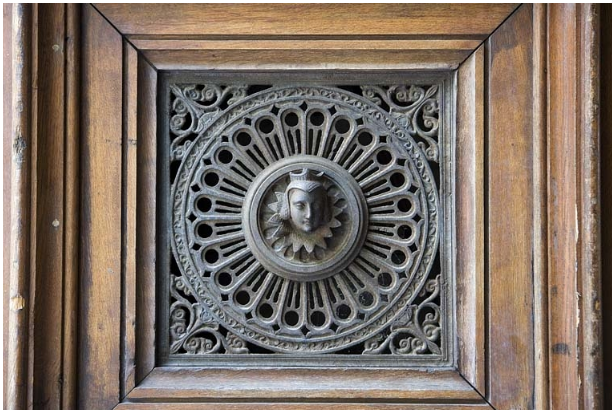
Détail du décor en fonte d'un des vantaux du portail d'entrée : tête de femme. 25, Besançon, 10 rue de la Préfecture, lieudit : îlot Terrier de Santans