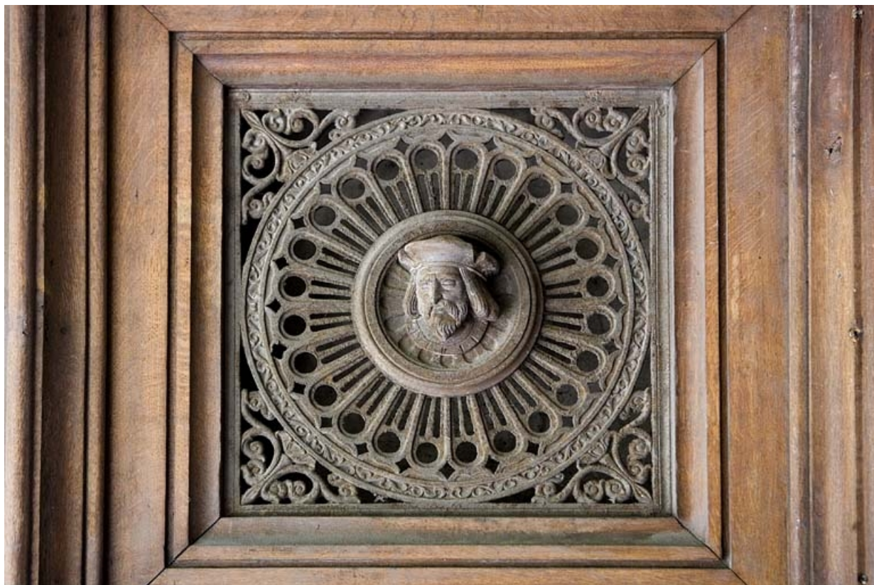
Détail du décor en fonte d'un des vantaux du portail d'entrée : tête d'homme.

25, Besançon, 10 rue de la Préfecture, lieudit : îlot Terrier de Santans