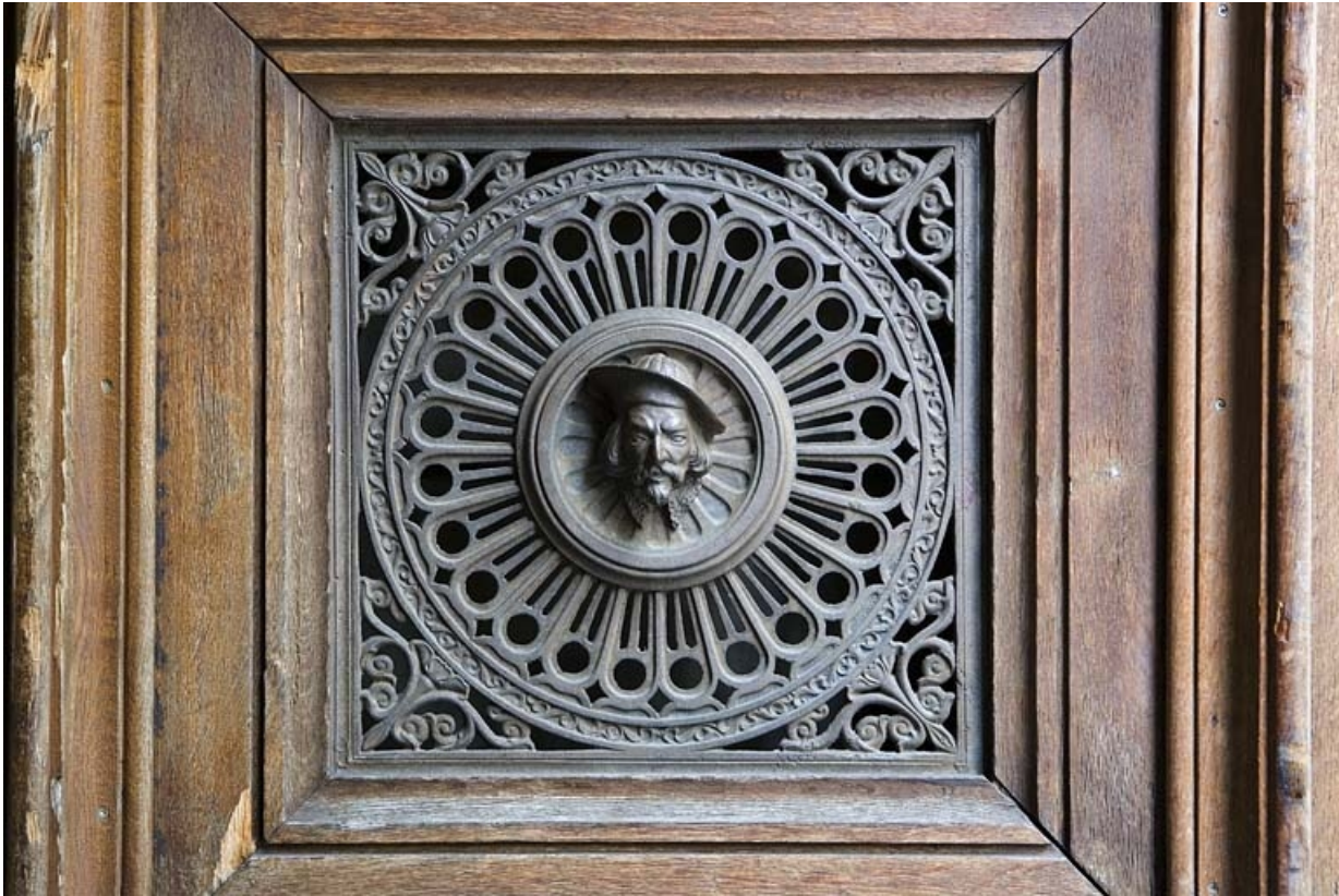
Détail du décor en fonte d'un des vantaux du portail d'entrée : tête d'homme.

25, Besançon, 10 rue de la Préfecture, lieudit : îlot Terrier de Santans