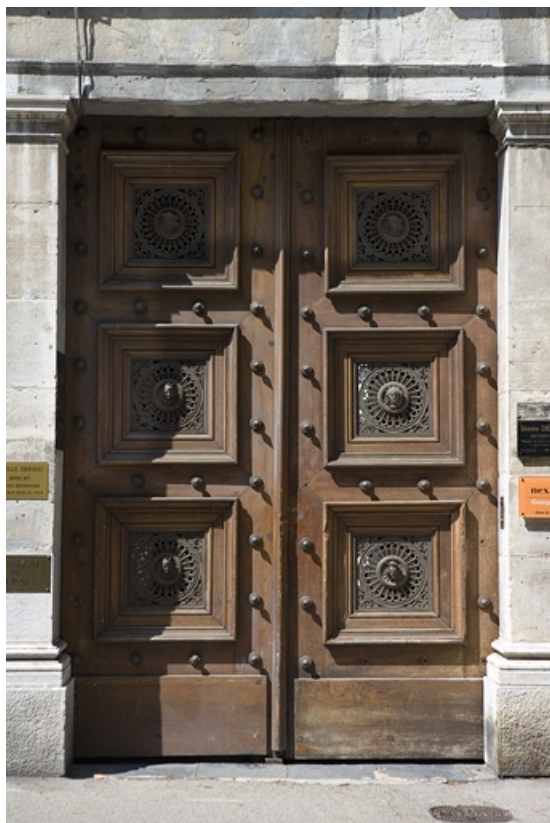
Façade sur rue : détail des vantaux en menuiserie du portail d'entrée. 25, Besançon, 10 rue de la Préfecture, lieudit : îlot Terrier de Santans