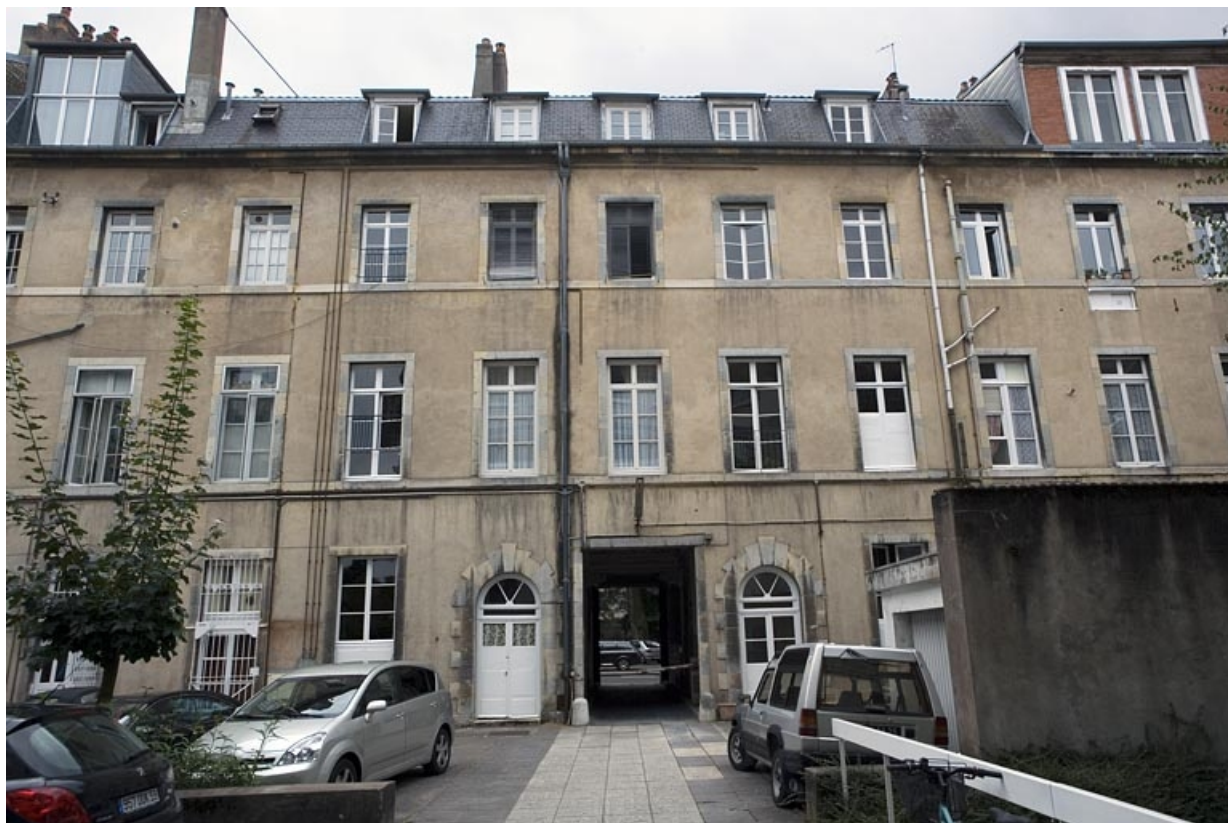
Vue d'ensemble de la façade postérieure du logis principal.

25, Besançon, 10 rue de la Préfecture, lieudit : îlot Terrier de Santans