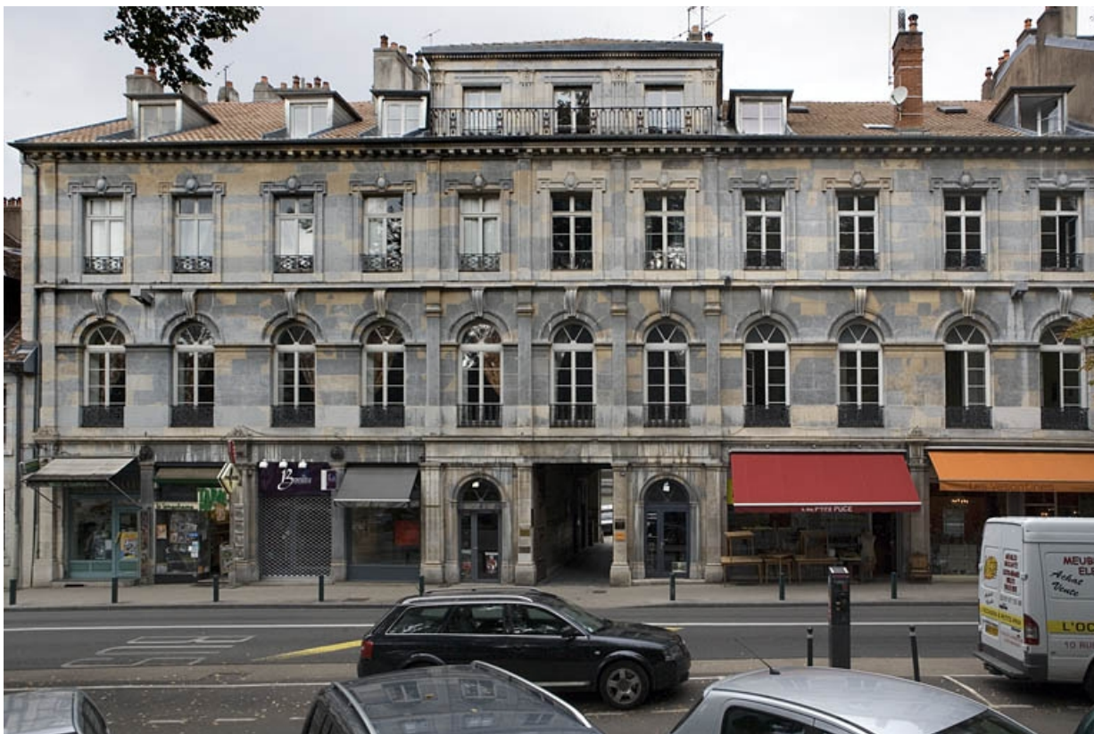
Vue d'ensemble de la façade sur rue, de face.

25, Besançon, 10 rue de la Préfecture, lieudit : îlot Terrier de Santans