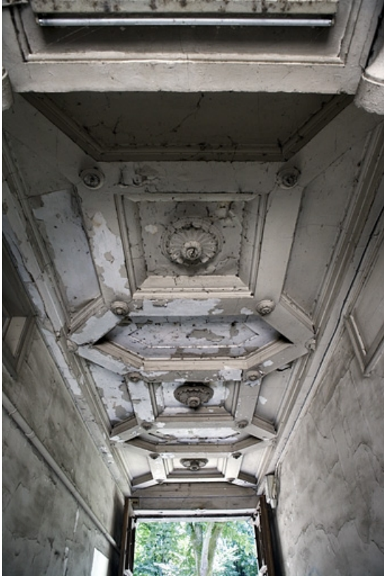
Détail du plafond du passage cocher depuis l'entrée.

25, Besançon, 10 rue de la Préfecture, lieudit : îlot Terrier de Santans