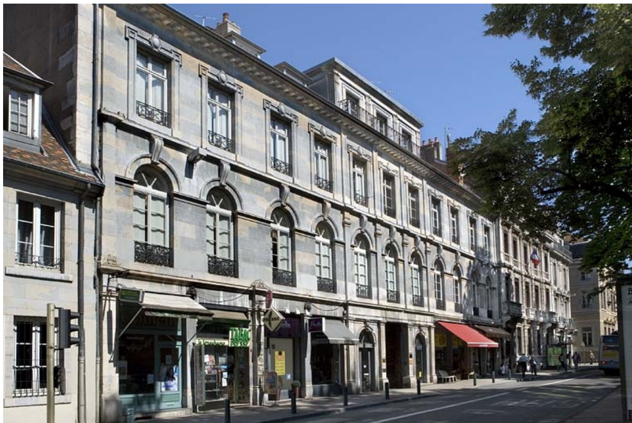
Vue d'ensemble de la façade sur rue, de trois quarts gauche.

25, Besançon, 10 rue de la Préfecture, lieudit : îlot Terrier de Santans