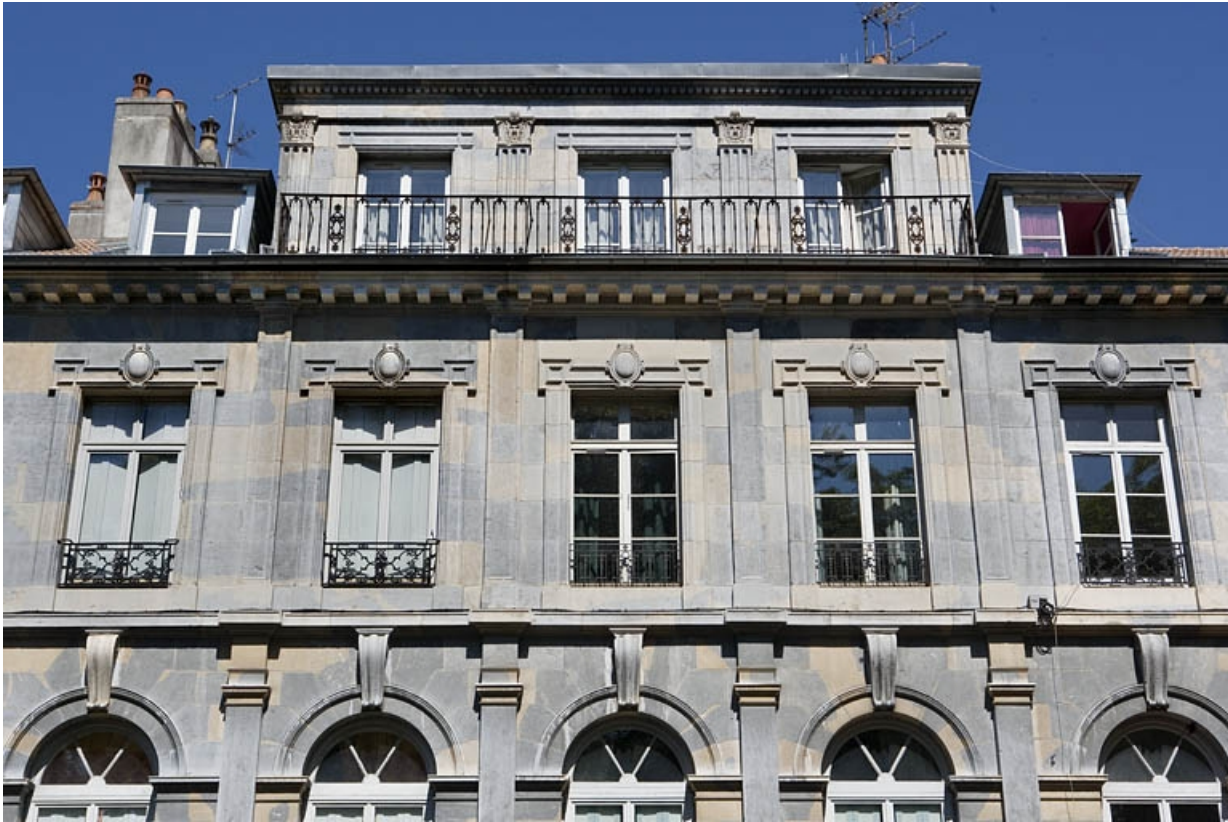
Vue d'ensemble de la partie haute de la façade sur rue.

25, Besançon, 10 rue de la Préfecture, lieudit : îlot Terrier de Santans