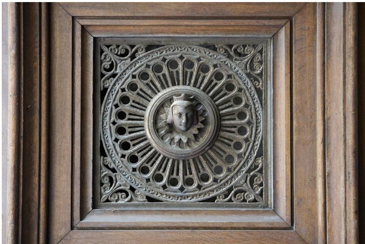
Détail du décor en fonte d'un des vantaux du portail d'entrée : tête de femme.

25, Besançon, 10 rue de la Préfecture, lieudit : îlot Terrier de Santans