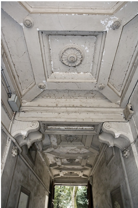
Détail du plafond du passage cocher : vue rapprochée.

25, Besançon, 10 rue de la Préfecture, lieudit : îlot Terrier de Santans