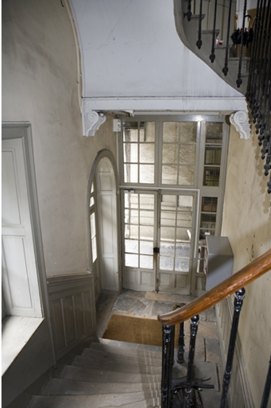
Vue de l'escalier droit.

25, Besançon, 10 rue de la Préfecture, lieudit : îlot Terrier de Santans