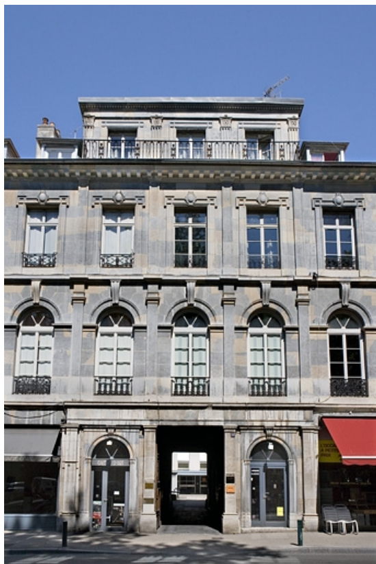
Vue d'ensemble de la partie centrale : façade sur rue.

25, Besançon, 10 rue de la Préfecture, lieudit : îlot Terrier de Santans