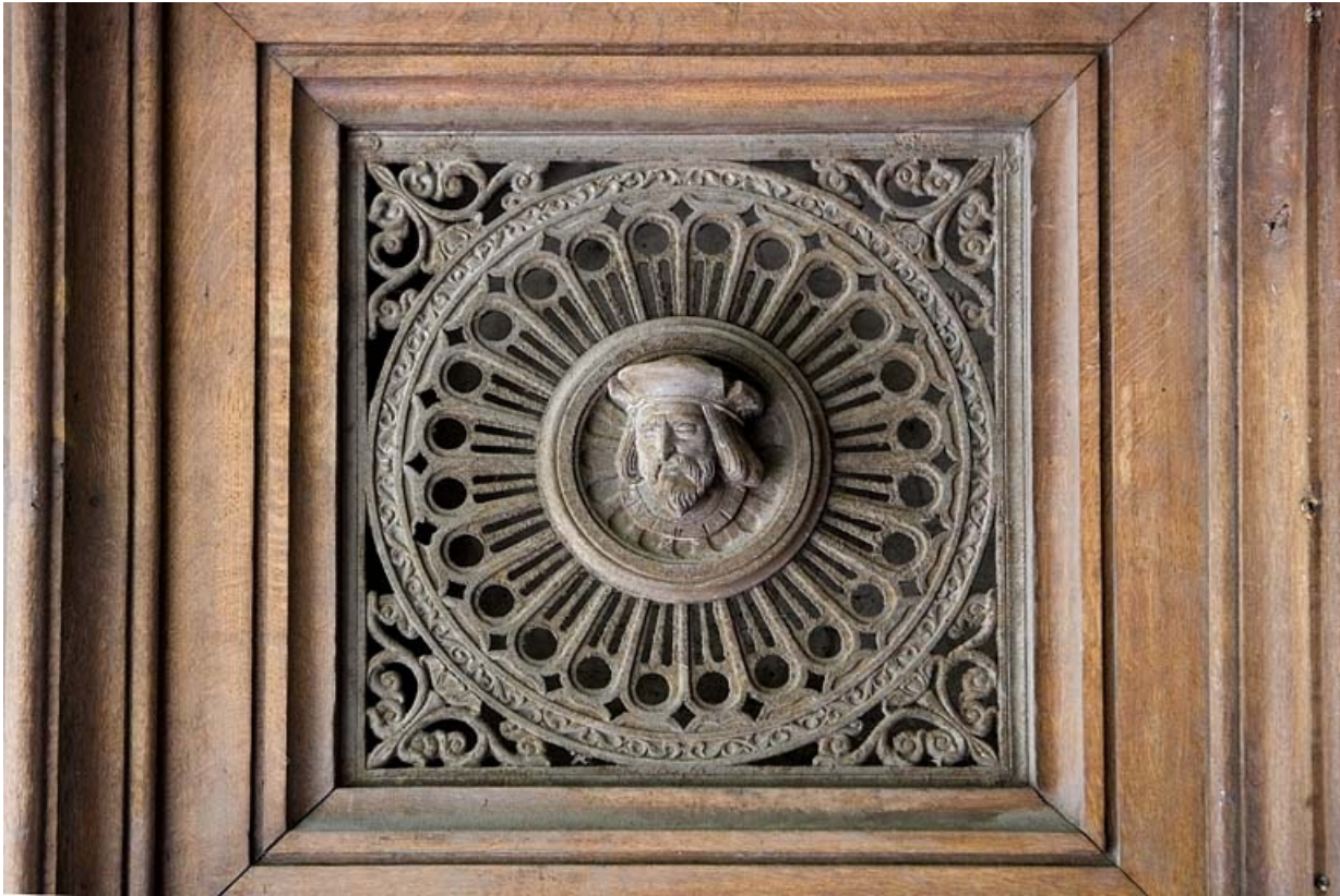
Détail du décor en fonte d'un des vantaux du portail d'entrée : tête d'homme.

25, Besançon, 10 rue de la Préfecture, lieudit : îlot Terrier de Santans