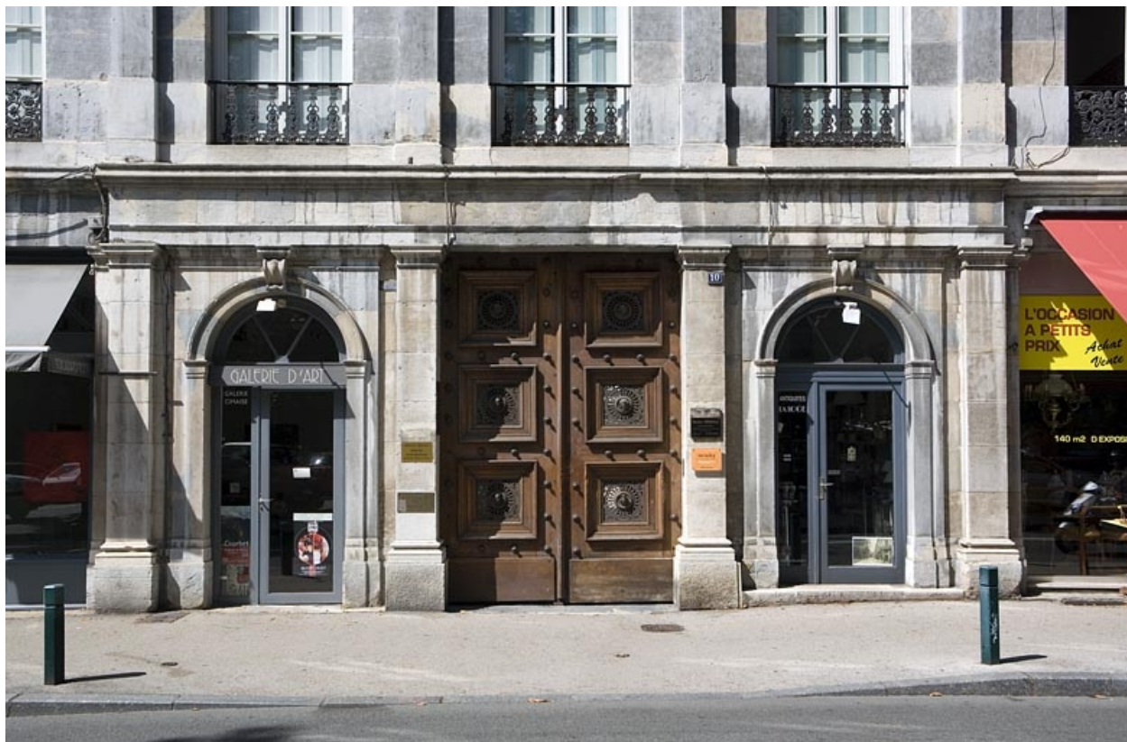
Façade sur rue : détail du portail d'entrée.

25, Besançon, 10 rue de la Préfecture, lieudit : îlot Terrier de Santans