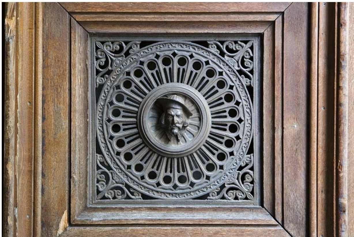
Détail du décor en fonte d'un des vantaux du portail d'entrée : tête d'homme.

25, Besançon, 10 rue de la Préfecture, lieudit : îlot Terrier de Santans