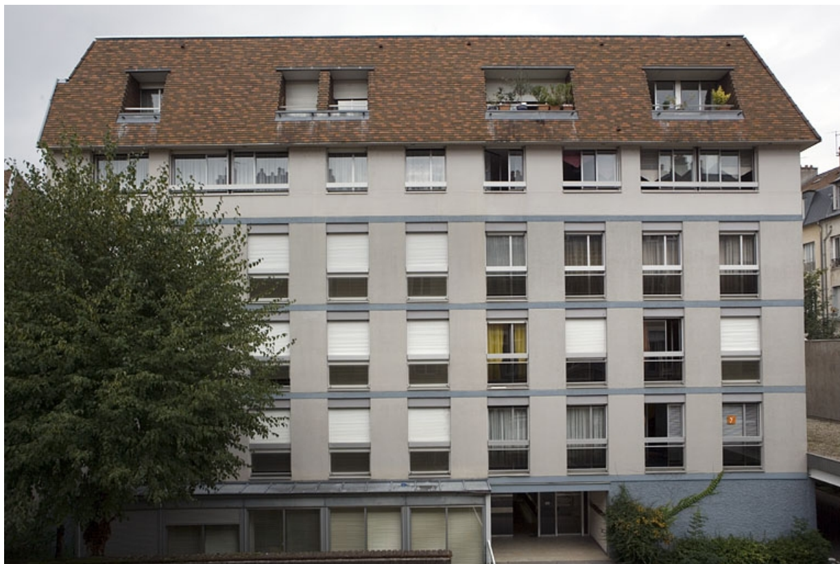
Vue d'ensemble de l'immeuble situé dans la cour.

25, Besançon, 10 rue de la Préfecture, lieudit : îlot Terrier de Santans