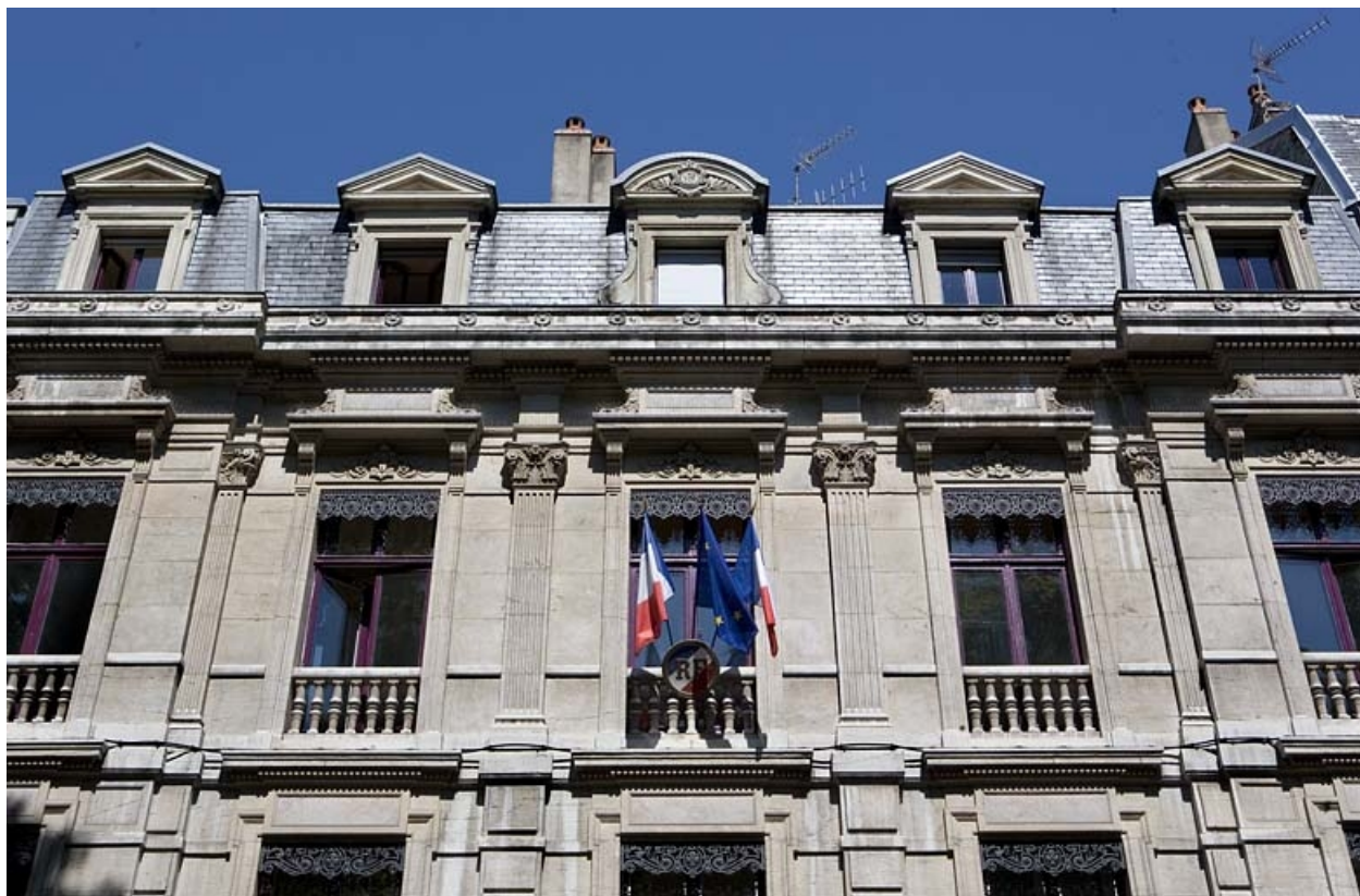
Détail du deuxième étage et de l'étage de comble : façade sur rue, de face.

25, Besançon, 8 rue de la Préfecture, lieudit : îlot Terrier de Santans