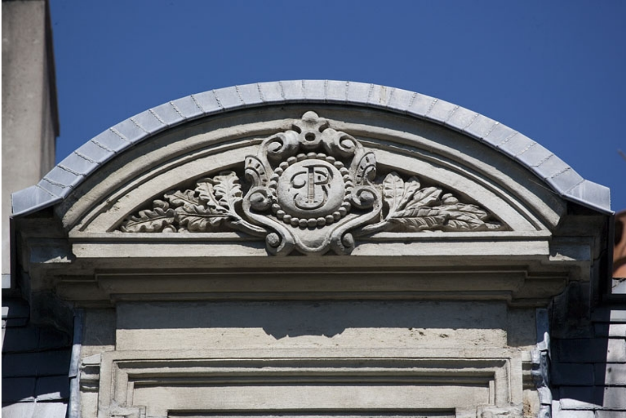
Détail du monogramme sur l'un des frontons cintrés de l'étage de comble.

25, Besançon, 8 rue de la Préfecture, lieudit : îlot Terrier de Santans