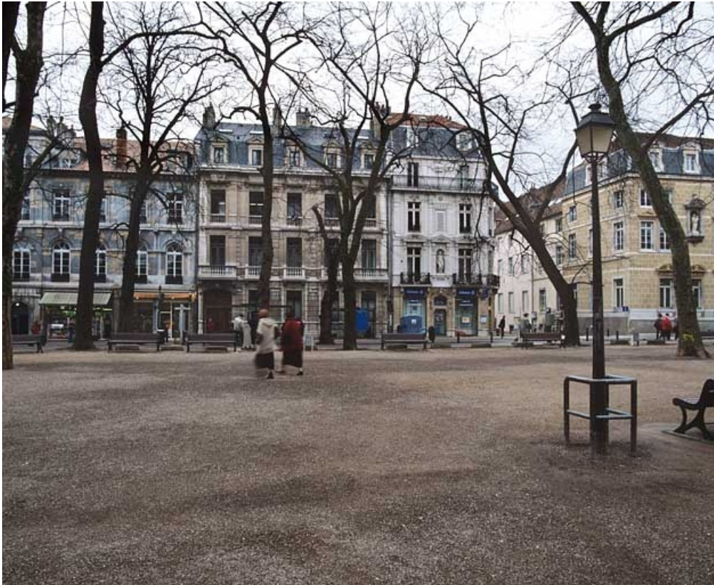
Vue d'ensemble de face.

25, Besançon, 8 rue de la Préfecture, lieudit : îlot Terrier de Santans