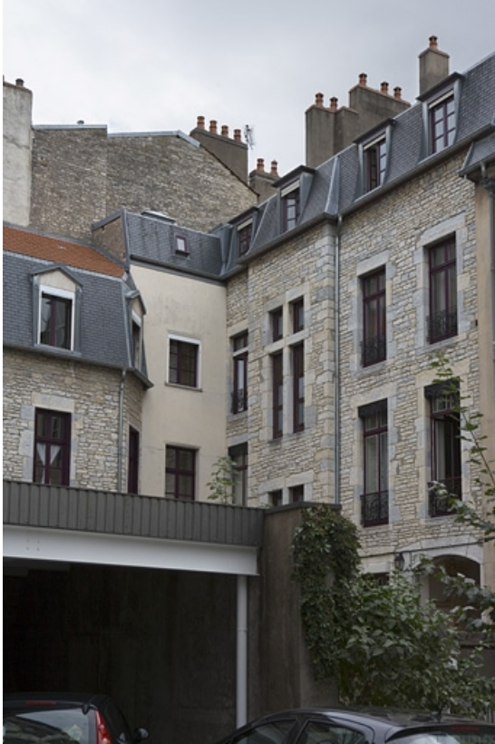
Façade postérieure du logis principal, de trois quarts droit.

25, Besançon, 8 rue de la Préfecture, lieudit : îlot Terrier de Santans