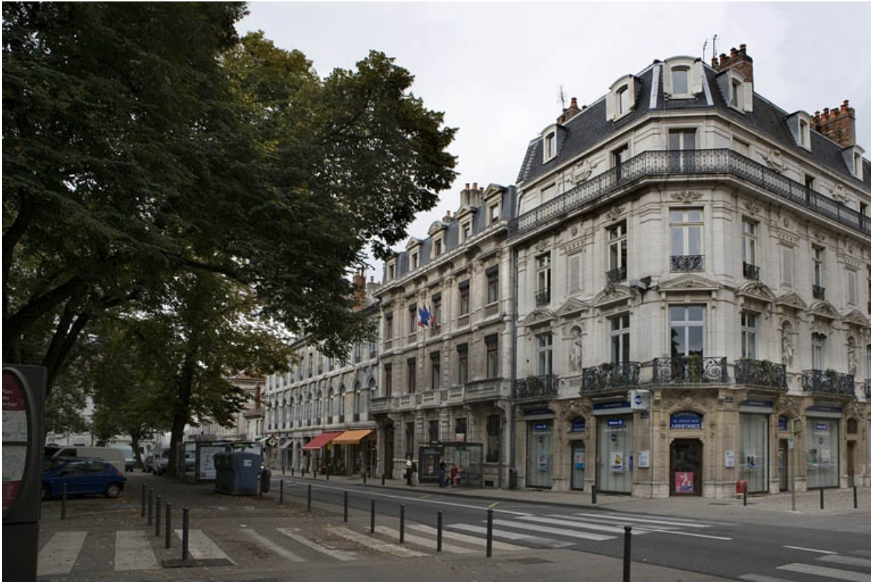
Vue d'ensemble depuis la rue, de trois quarts droit.

25, Besançon, 8 rue de la Préfecture, lieudit : îlot Terrier de Santans