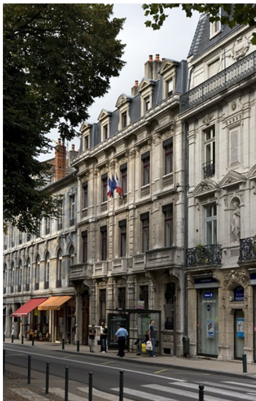
Vue d'ensemble depuis la rue, de trois quarts droit : vue rapprochée.

25, Besançon, 8 rue de la Préfecture, lieudit : îlot Terrier de Santans