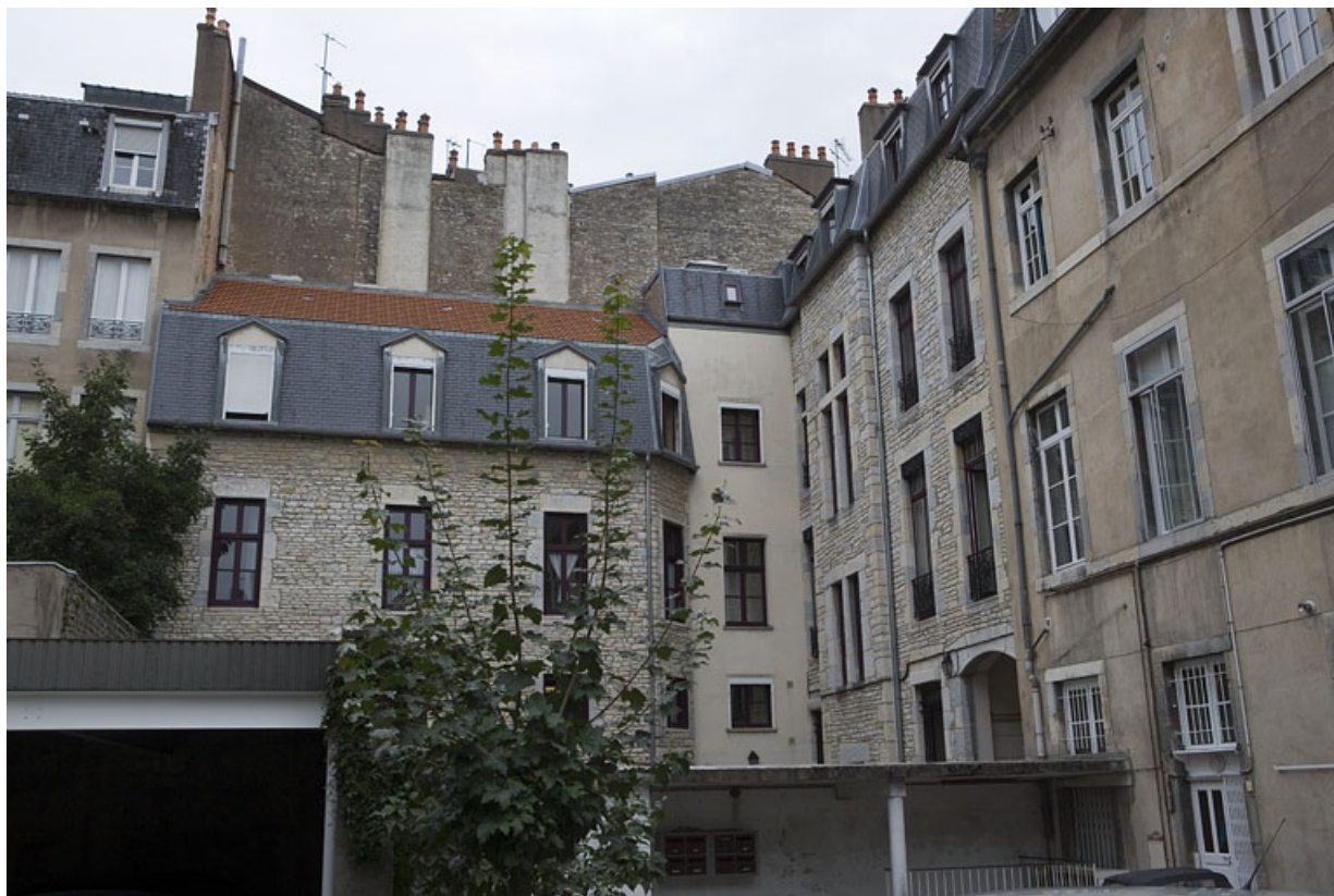
Vue d'ensemble de la façade postérieure du logis principal, et aile droite sur cour.

25, Besançon, 8 rue de la Préfecture, lieudit : îlot Terrier de Santans