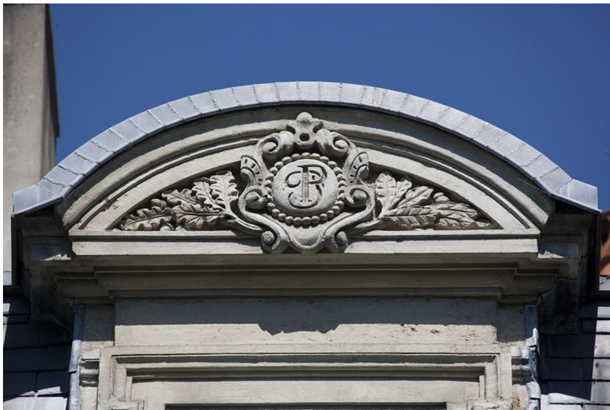
Détail du monogramme sur l'un des frontons cintrés de l'étage de comble.

25, Besançon, 8 rue de la Préfecture, lieudit : îlot Terrier de Santans