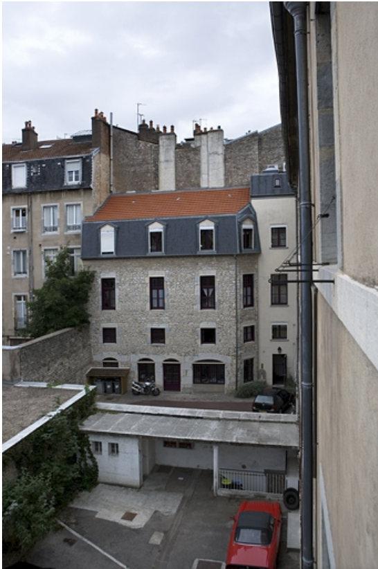
Vue d'ensemble de l'aile droite sur cour.

25, Besançon, 8 rue de la Préfecture, lieudit : îlot Terrier de Santans