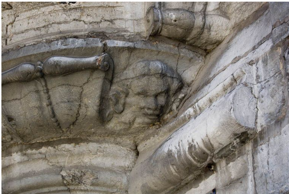
Détail d'une tête sur le culot de l'oriel.

25, Besançon, 12 rue Pasteur, lieudit : îlot d' Anvers