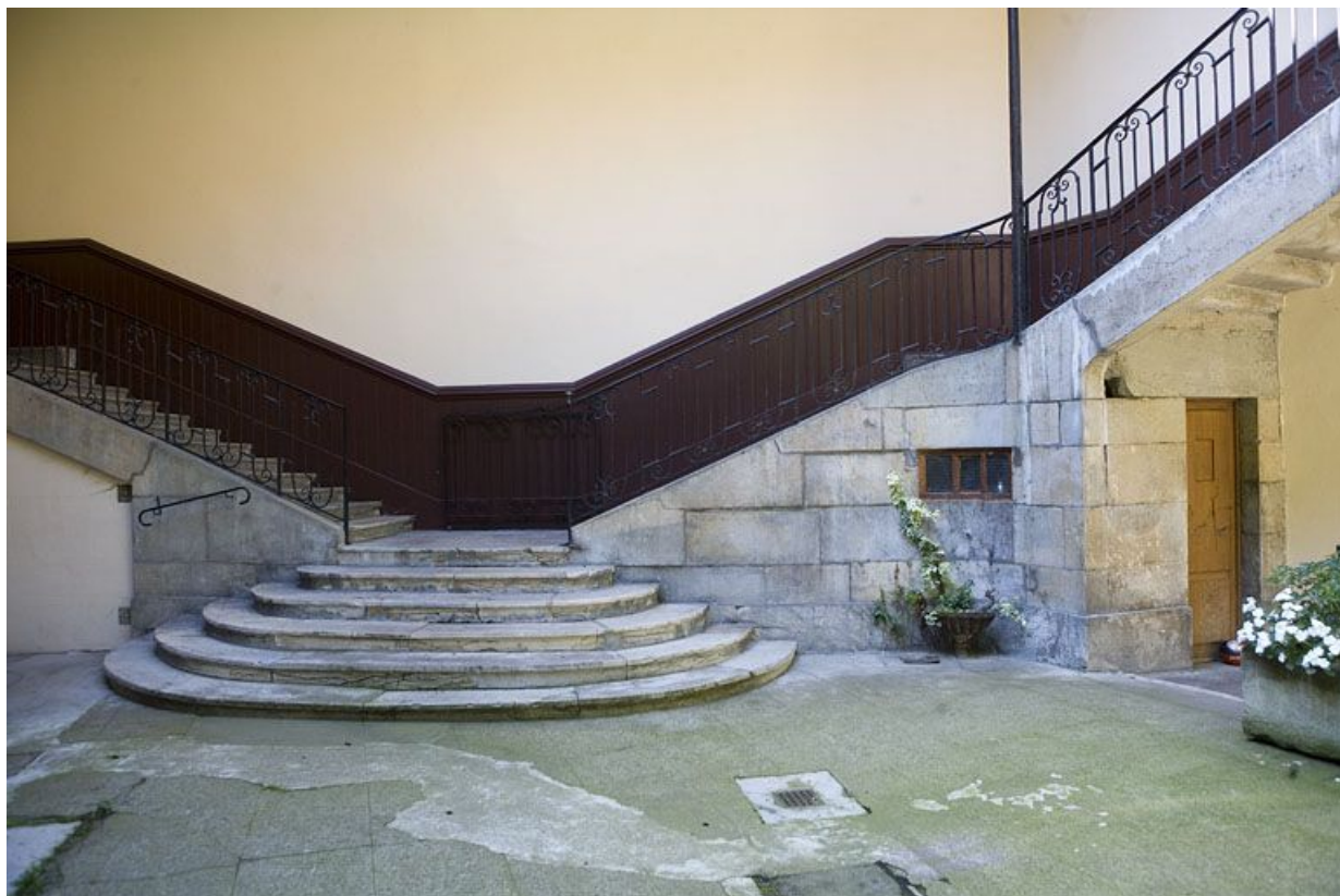
Détail du départ de l'escalier à cage ouverte.

25, Besançon, 12 rue Pasteur, lieudit : îlot d' Anvers