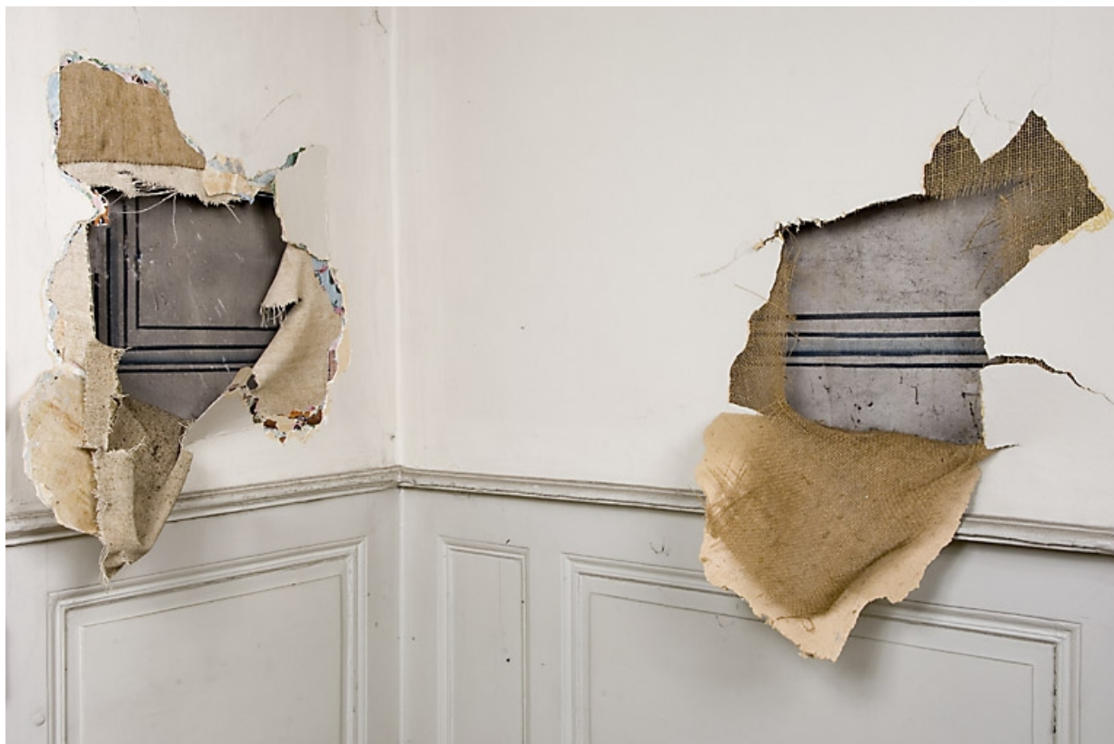
Détail d'un décor peint sous le revêtement actuel : pièce en rez-de-chaussée à gauche de l'escalier principal. 25, Besançon, 9, 9 bis rue Charles Nodier, lieudit : îlot Banque de France