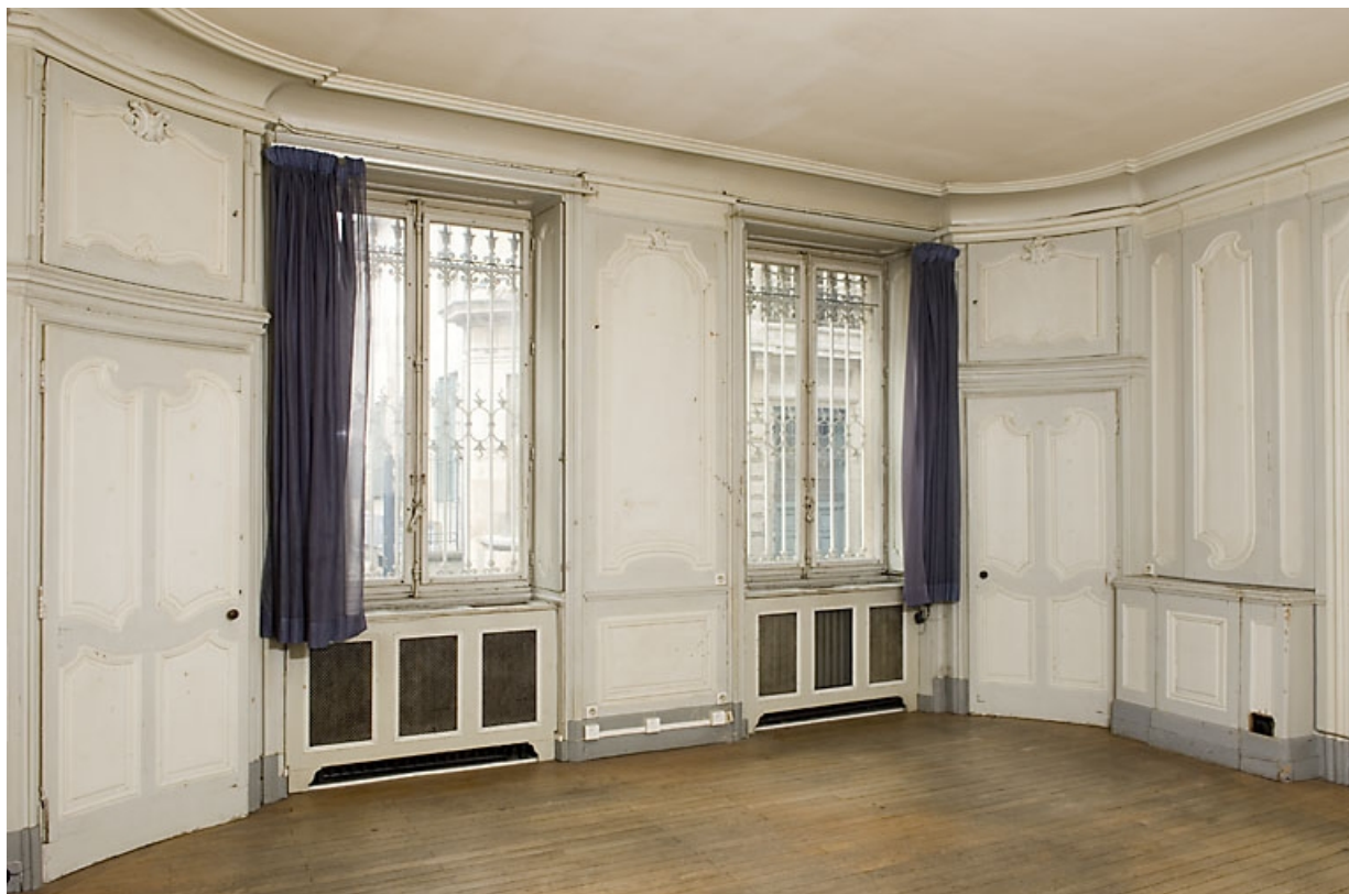
Pièce au rez-de-chaussée, à droite du passage cochier : vue de trois quarts avec les fenêtres.

25, Besançon, 9, 9 bis rue Charles Nodier, lieudit : îlot Banque de France