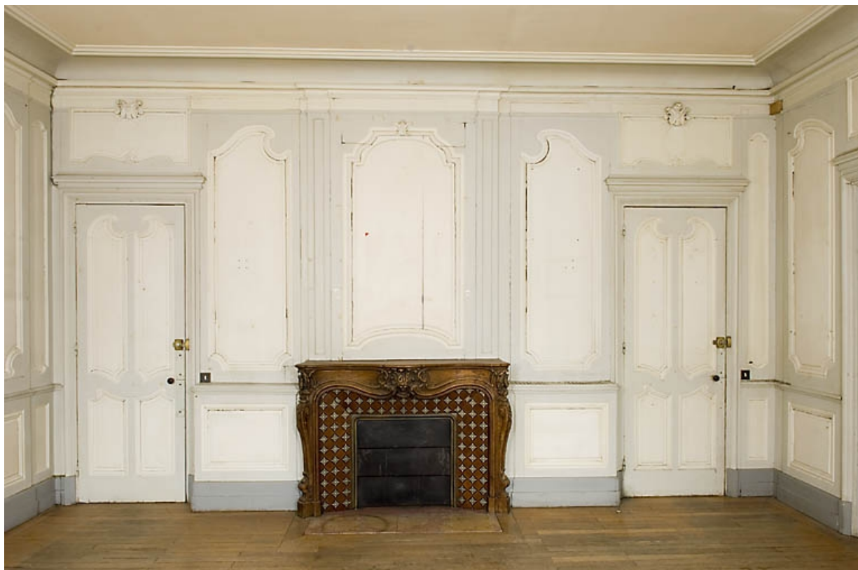
Pièce au rez-de-chaussée, à droite du passage cocher : vue de face avec la cheminée.

25, Besançon, 9, 9 bis rue Charles Nodier, lieudit : îlot Banque de France