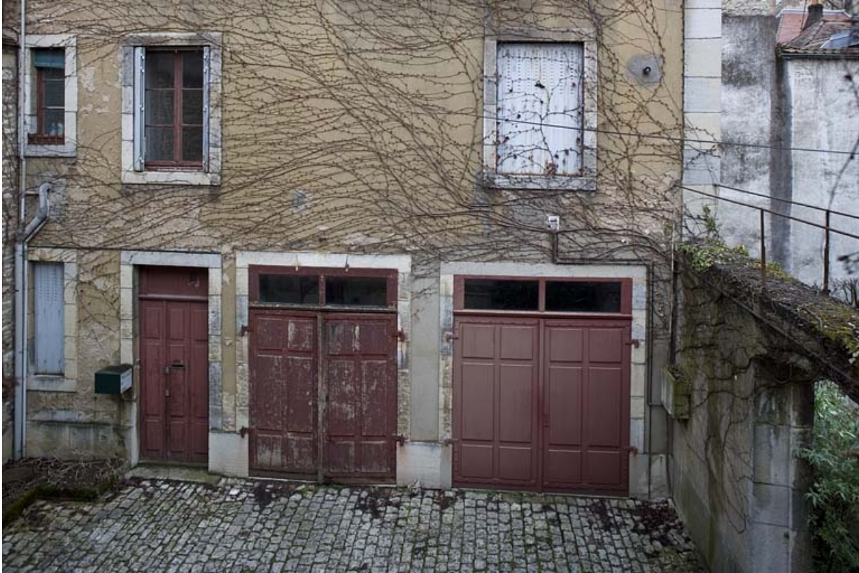
Détail du rez-de-chaussée des communs, à droite de la deuxième cour.

25, Besançon, 9, 9 bis rue Charles Nodier, lieudit : îlot Banque de France