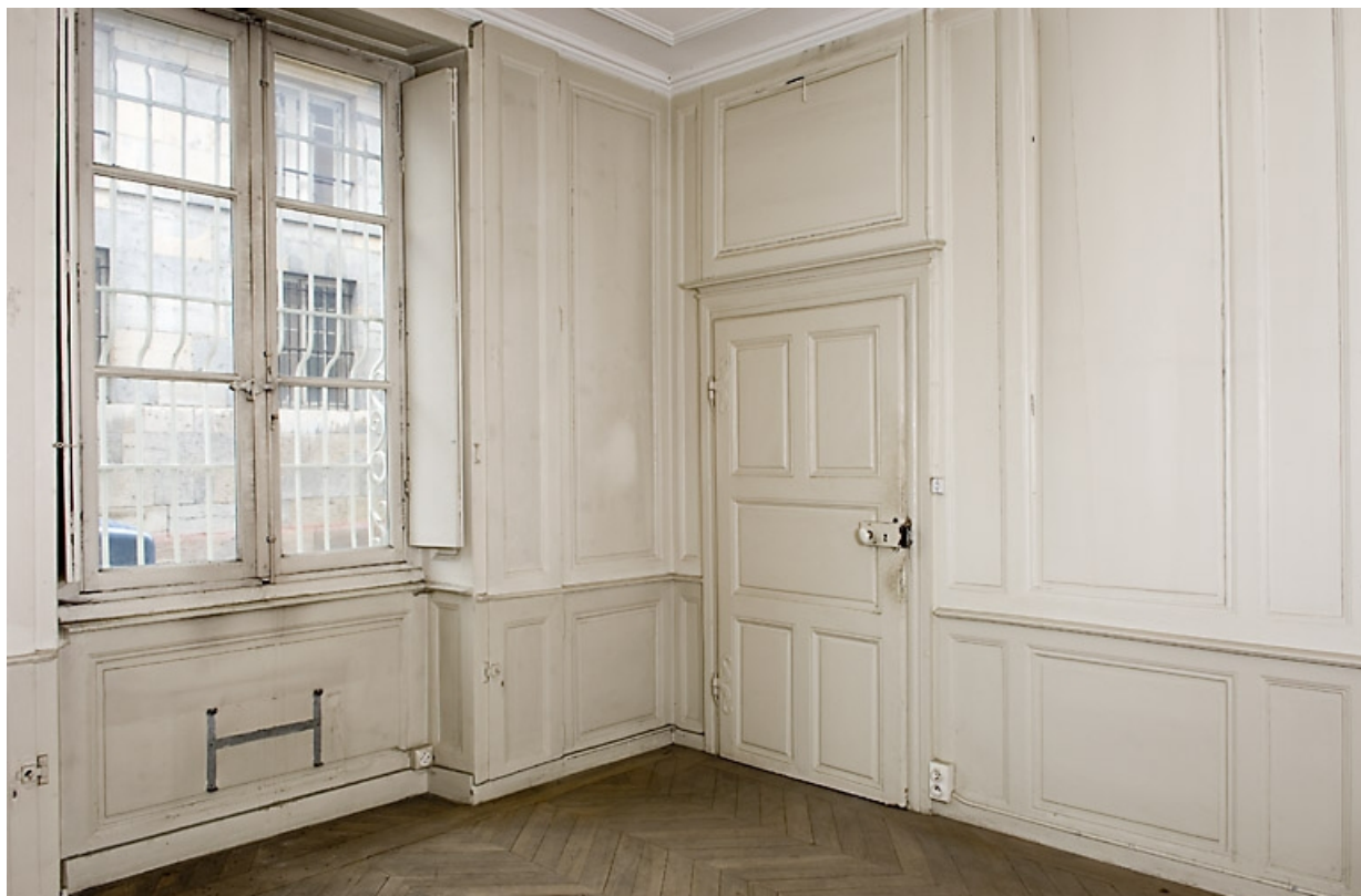
Pièce au rez-de-chaussée : vue de trois quarts.

25, Besançon, 9, 9 bis rue Charles Nodier, lieudit : îlot Banque de France