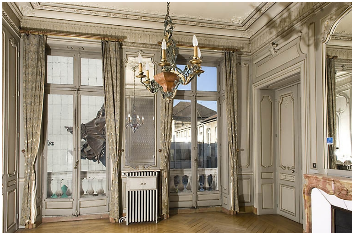
Pièce à gauche du grand salon, vue d'ensemble depuis l'entrée.

25, Besançon, 9, 9 bis rue Charles Nodier, lieudit : îlot Banque de France