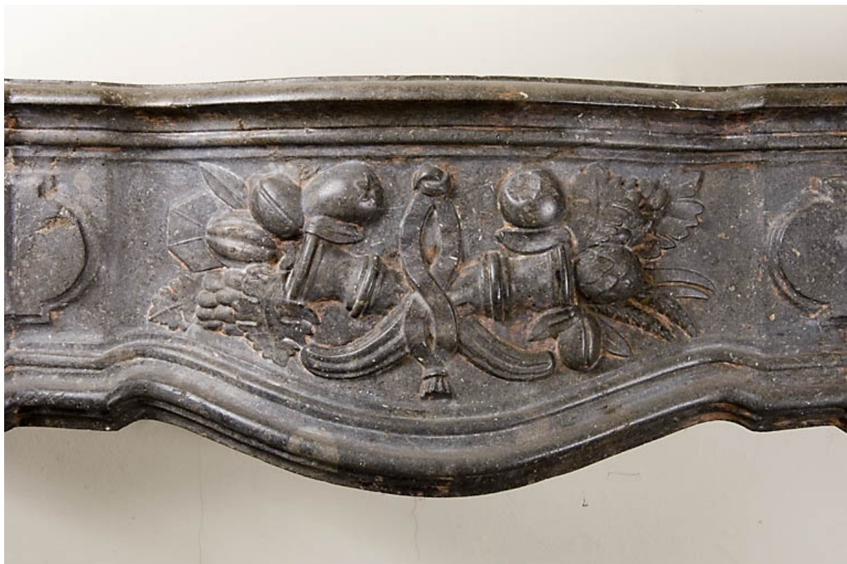
Détail du décor de la cheminée : pièce au rez-de-chaussée à gauche de l'escalier principal. 25, Besançon, 9, 9 bis rue Charles Nodier, lieudit : îlot Banque de France