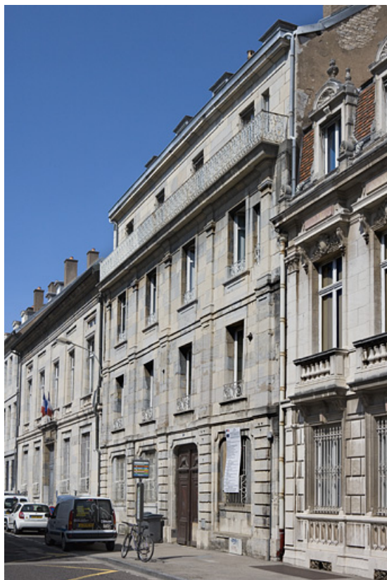
Vue d'ensemble de la façade sur rue, 9 rue Charles Nodier, de trois quarts droit.

25, Besançon, 9, 9 bis rue Charles Nodier, lieudit : îlot Banque de France