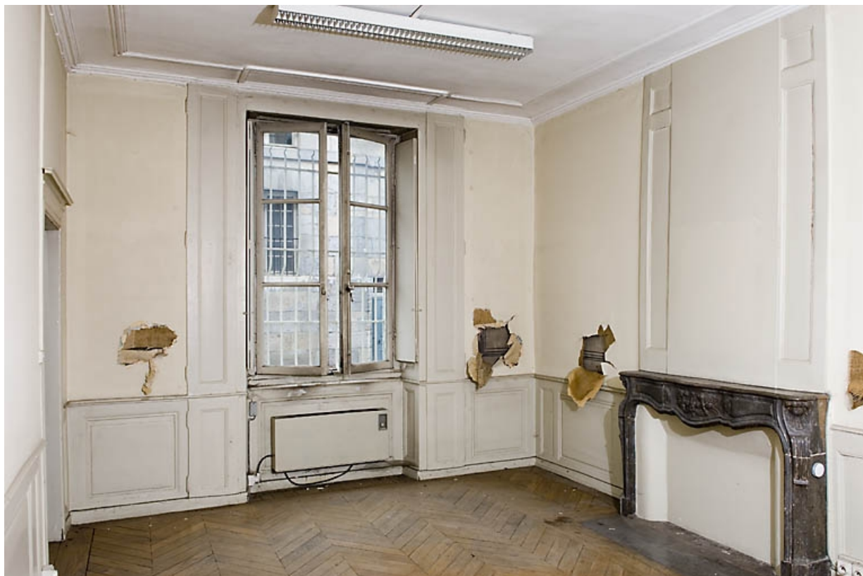
Vue d'ensemble d'une pièce en rez-de-chaussée à gauche de l'escalier principal. 25, Besançon, 9, 9 bis rue Charles Nodier, lieudit : îlot Banque de France