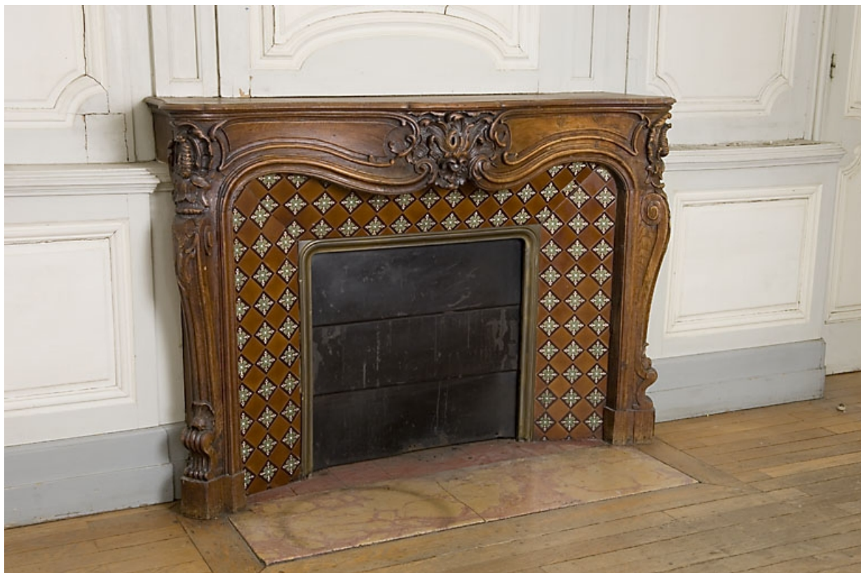
Pièce au rez-de-chaussée, à droite du passage cocher : la cheminée de trois quarts gauche. 25, Besançon, 9, 9 bis rue Charles Nodier, lieudit : îlot Banque de France