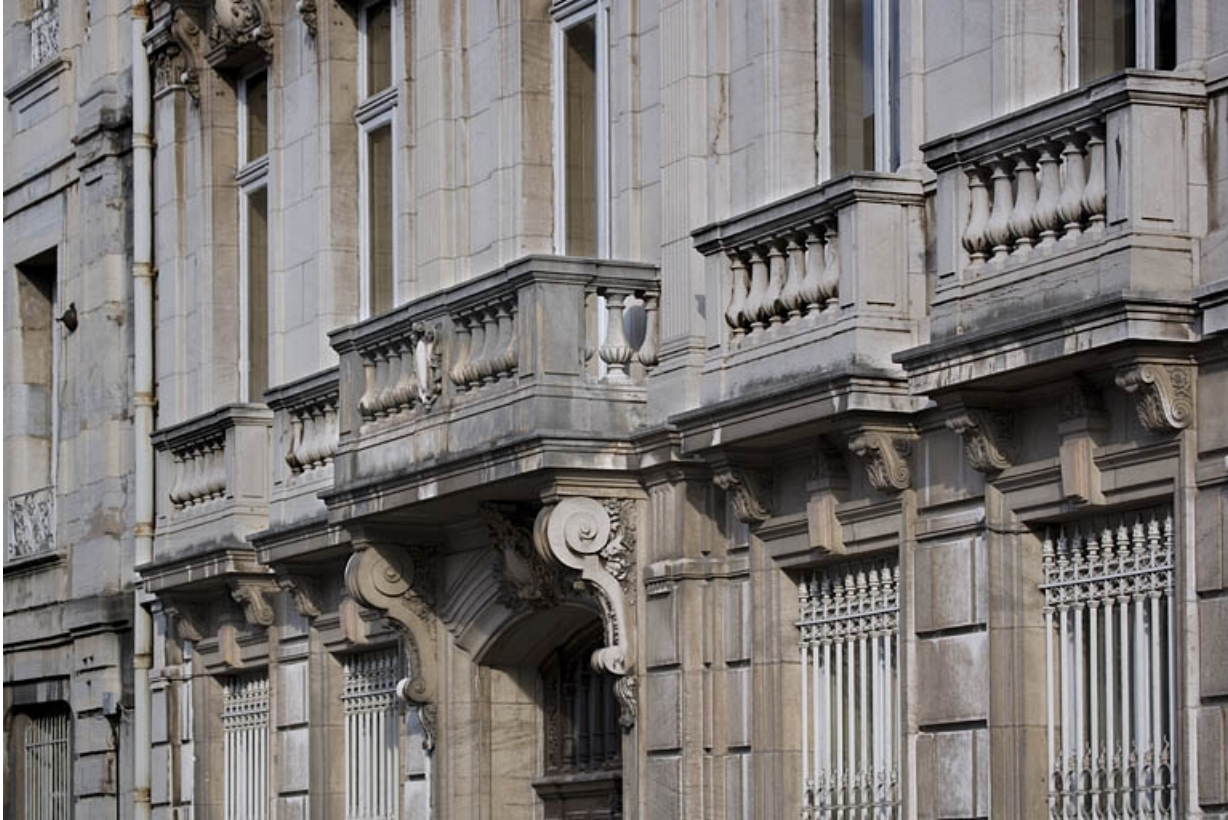
Détail des garde-corps et du balcon du premier étage sur rue.

25, Besançon, 9, 9 bis rue Charles Nodier, lieudit : îlot Banque de France