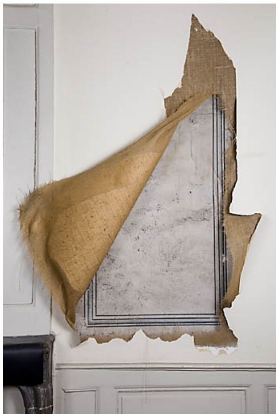
Détail d'un décor peint sous le revêtement actuel : pièce en rez-de-chaussée à gauche de l'escalier principal. 25, Besançon, 9, 9 bis rue Charles Nodier, lieudit : îlot Banque de France