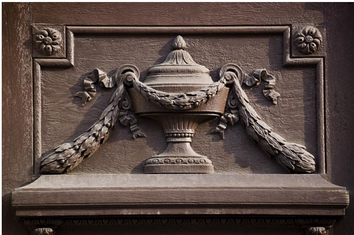
Détail d'un décor sur un vanteau du portail d'entrée, 9 rue Charles Nodier.

25, Besançon, 9, 9 bis rue Charles Nodier, lieudit : îlot Banque de France