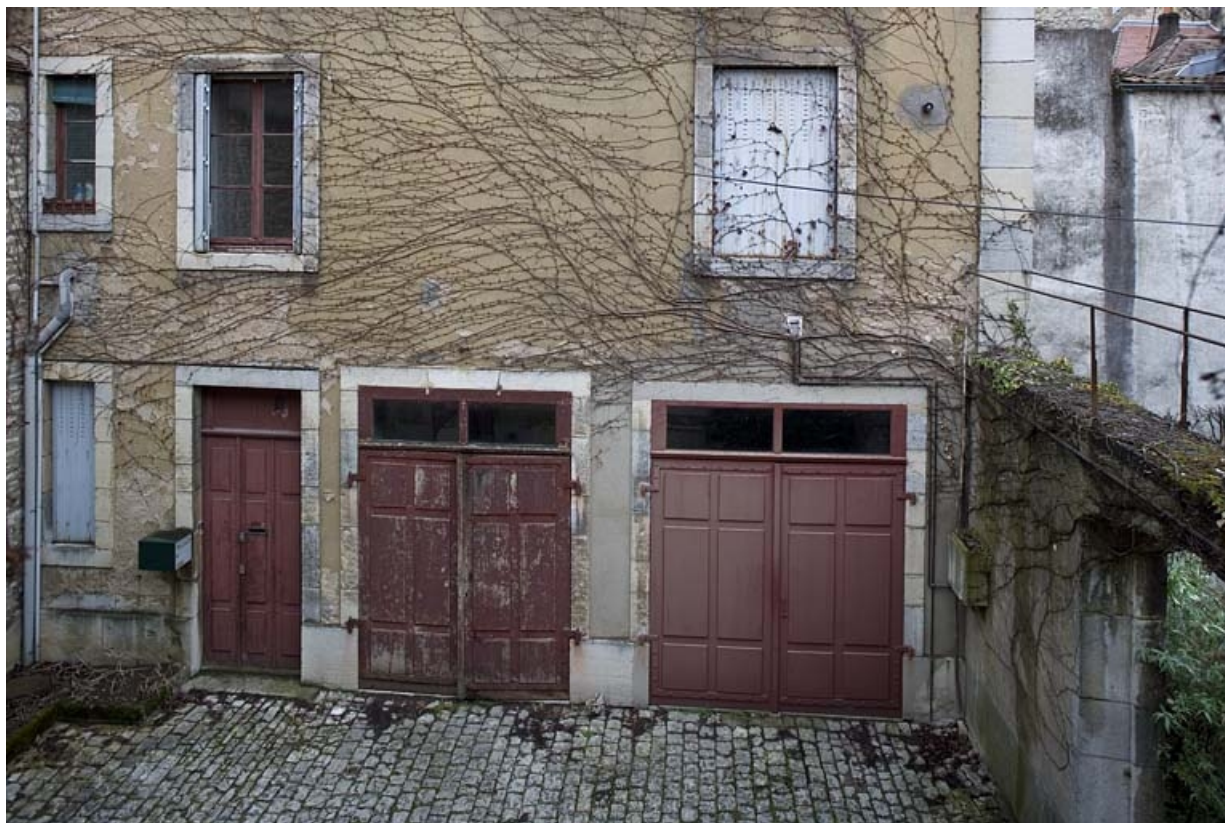
Détail du rez-de-chaussée des communs, à droite de la deuxième cour.

25, Besançon, 9, 9 bis rue Charles Nodier, lieudit : îlot Banque de France