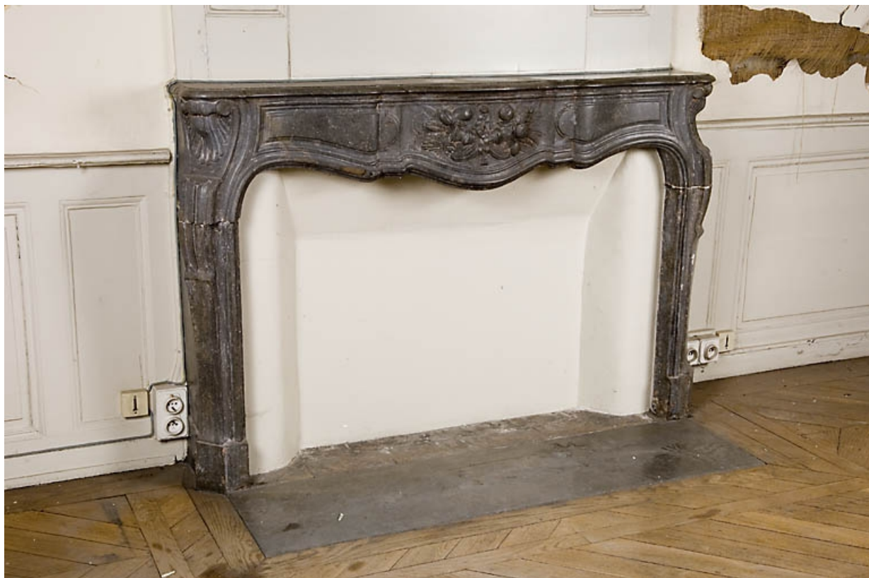
Détail de la cheminée d'une pièce du rez-de-chaussée à gauche de l'escalier principal. 25, Besançon, 9, 9 bis rue Charles Nodier, lieudit : îlot Banque de France