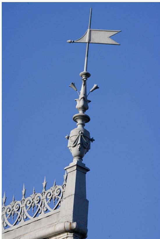
Détail d'un épi de faitage sur la tourelle de l'escalier.

25, Besançon, 9, 9 bis rue Charles Nodier, lieudit : îlot Banque de France