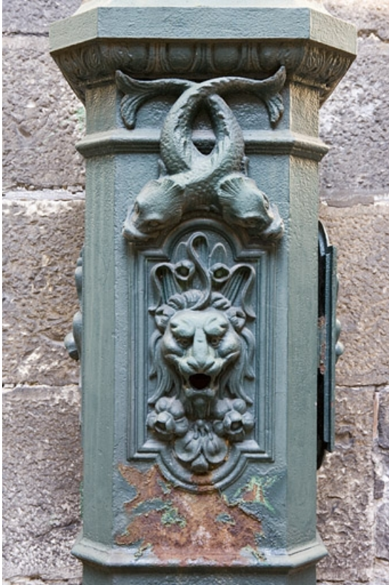
Détail de la partie centrale de la borne fontaine.

25, Besançon, 31 rue de la Préfecture, lieudit : îlot Banque de France