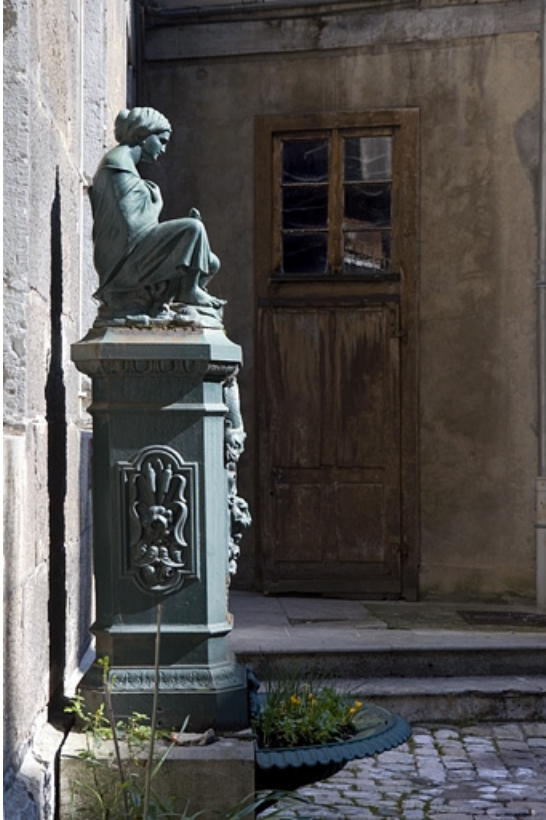
Vue de la borne fontaine de profil gauche.

25, Besançon, 31 rue de la Préfecture, lieudit : îlot Banque de France