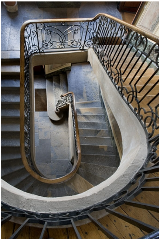
Escalier : vue plongeante.

25, Besançon, 31 rue de la Préfecture, lieudit : îlot Banque de France