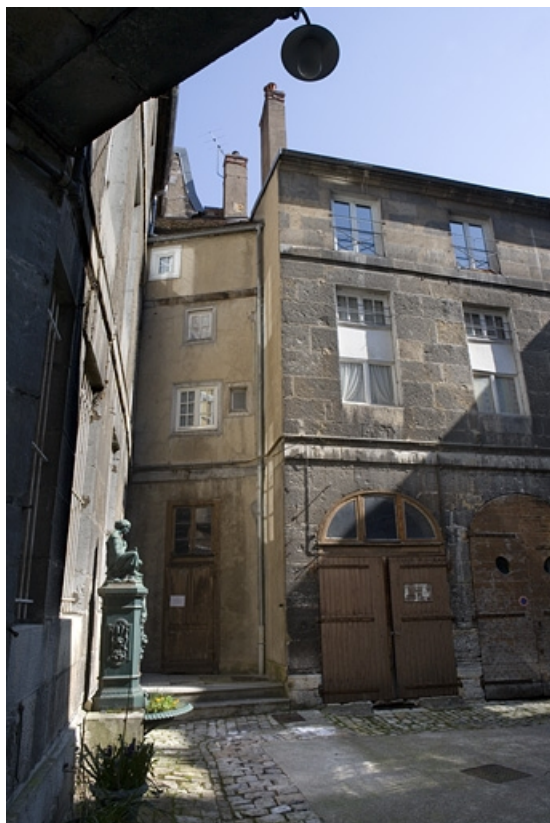
Vue de l'angle gauche de l'aile sur cour depuis l'entrée.

25, Besançon, 31 rue de la Préfecture, lieudit : îlot Banque de France