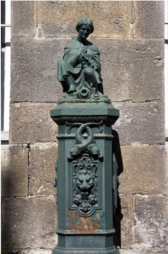
Vue de la partie supérieure de la borne fontaine.

25, Besançon, 31 rue de la Préfecture, lieudit : îlot Banque de France