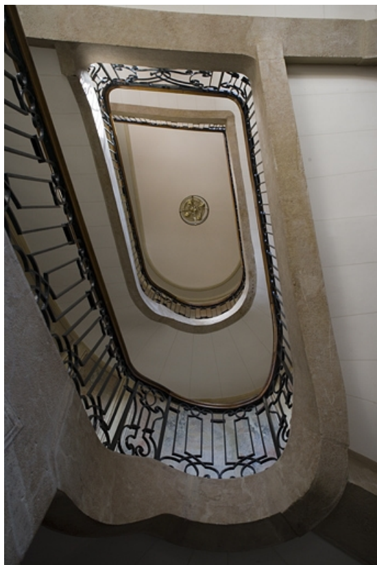
Vue du plafond de l'escalier depuis le rez-de-chaussée.

25, Besançon, 31 rue de la Préfecture, lieudit : îlot Banque de France