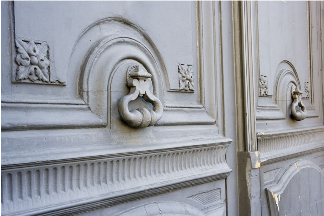
Détail de la partie centrale du portail d'entrée.

25, Besançon, 31 rue de la Préfecture, lieudit : îlot Banque de France