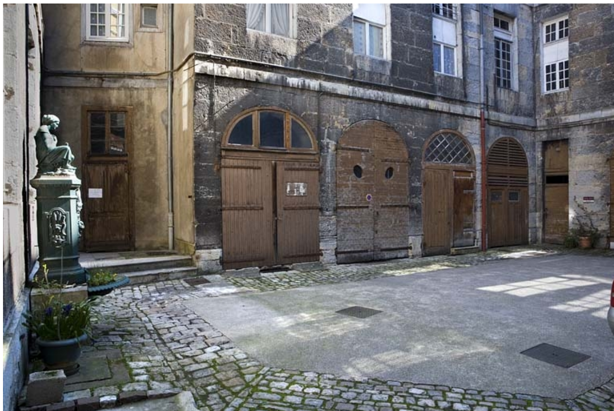
Vue de la cour depuis l'entrée.

25, Besançon, 31 rue de la Préfecture, lieudit : îlot Banque de France