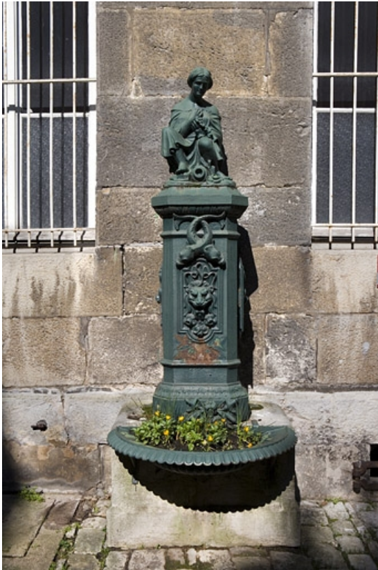
Vue d'ensemble de la borne fontaine.

25, Besançon, 31 rue de la Préfecture, lieudit : îlot Banque de France