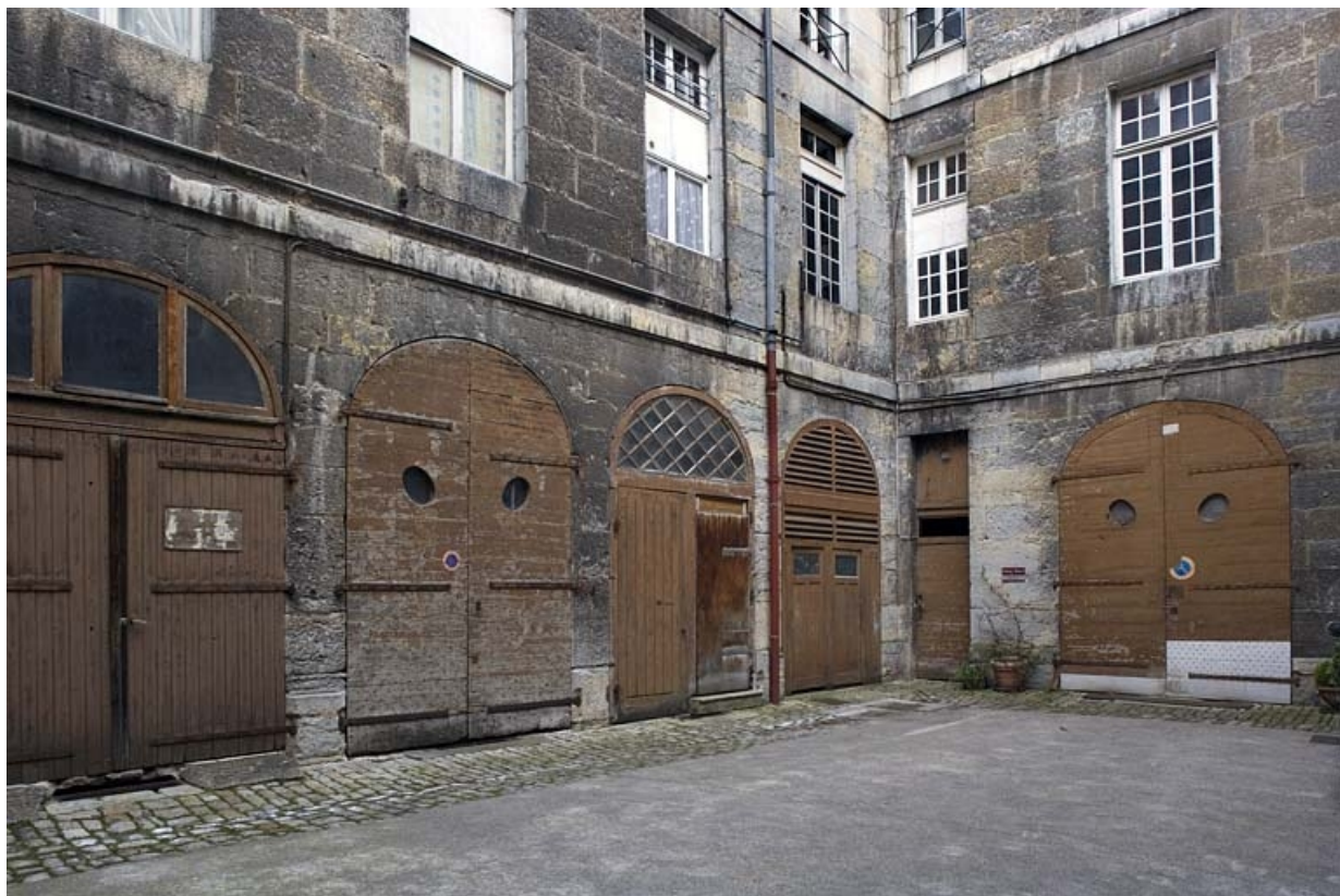
Vue des remises en rez-de-chaussée sur cour.

25, Besançon, 31 rue de la Préfecture, lieudit : îlot Banque de France