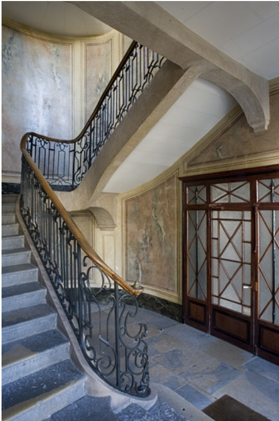
Vue de l'escalier depuis l'entrée.

25, Besançon, 31 rue de la Préfecture, lieudit : îlot Banque de France