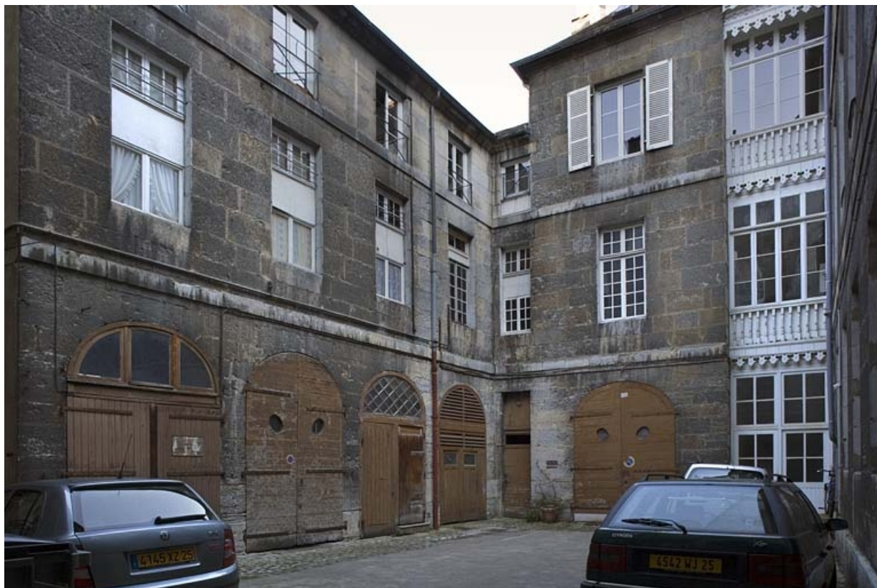
Vue d'ensemble des bâtiments sur cour depuis l'entrée.

25, Besançon, 31 rue de la Préfecture, lieudit : îlot Banque de France