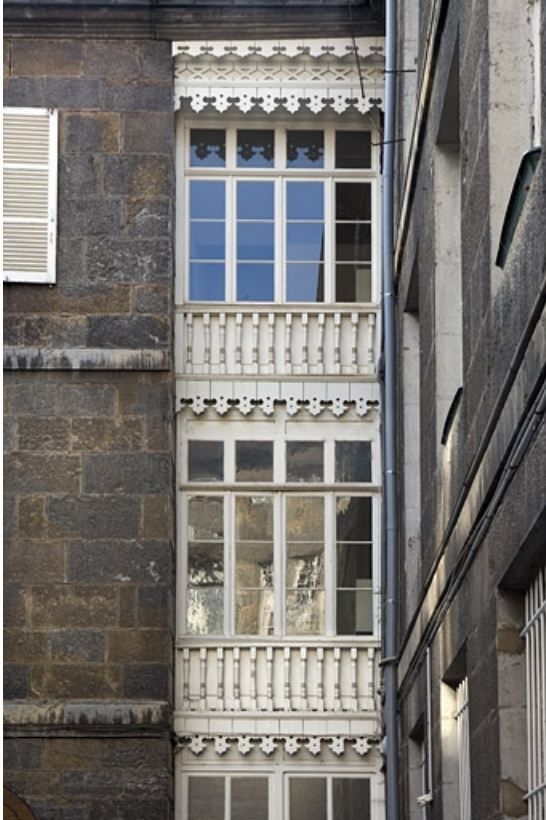
Détail de la façade sur cour de l'escalier secondaire.

25, Besançon, 31 rue de la Préfecture, lieudit : îlot Banque de France