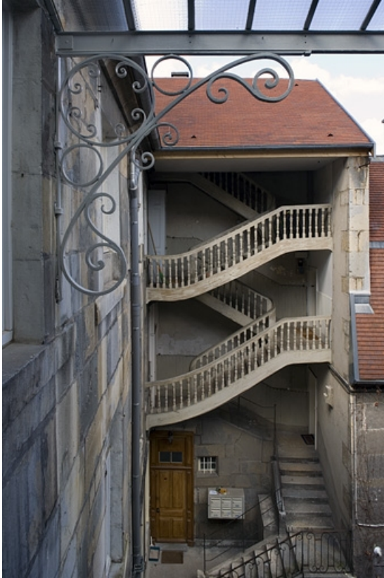
Vue d'ensemble de l'escalier droit depuis l'escalier gauche.

25, Besançon, 11 rue Charles Nodier, lieudit : îlot Banque de France