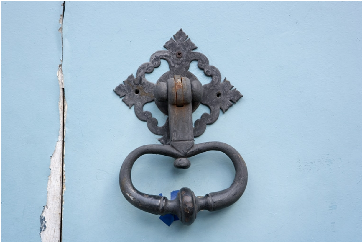
Détail du heurtor du portail d'entrée.

25, Besançon, 11 rue Charles Nodier, lieudit : îlot Banque de France