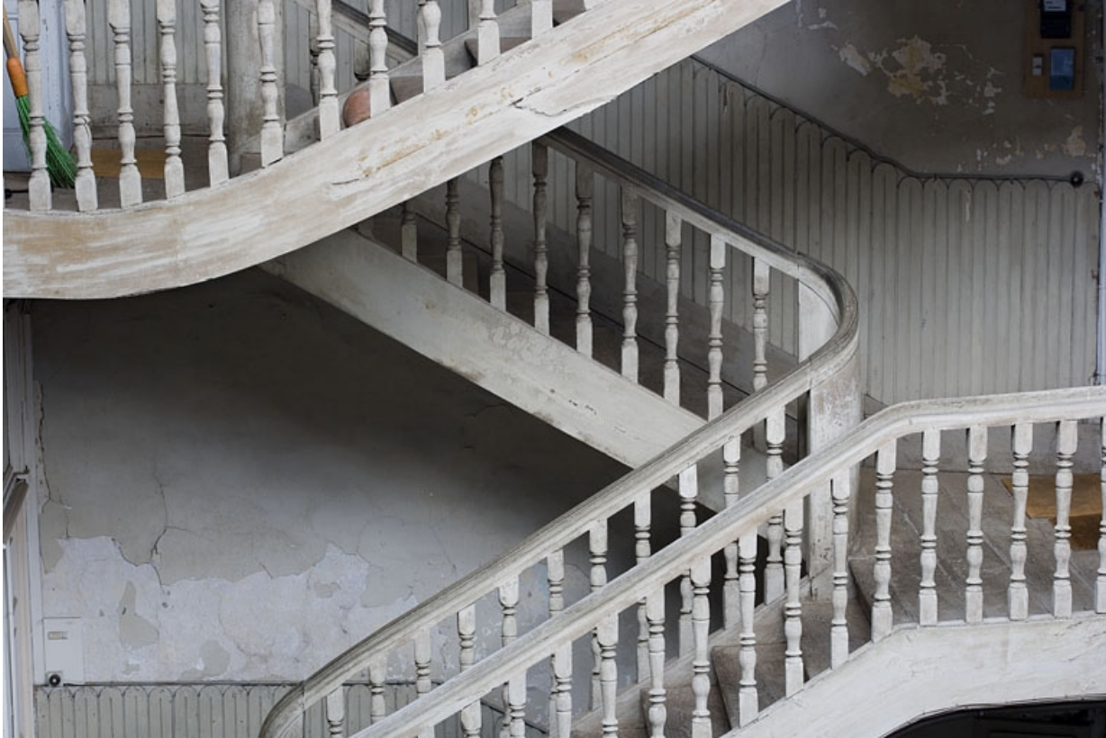
Détail de la rampe en bois tourné de l'escalier droit.

25, Besançon, 11 rue Charles Nodier, lieudit : îlot Banque de France