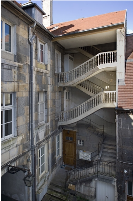
Vue d'ensemble de l'escalier à droite de la cour.

25, Besançon, 11 rue Charles Nodier, lieudit : îlot Banque de France