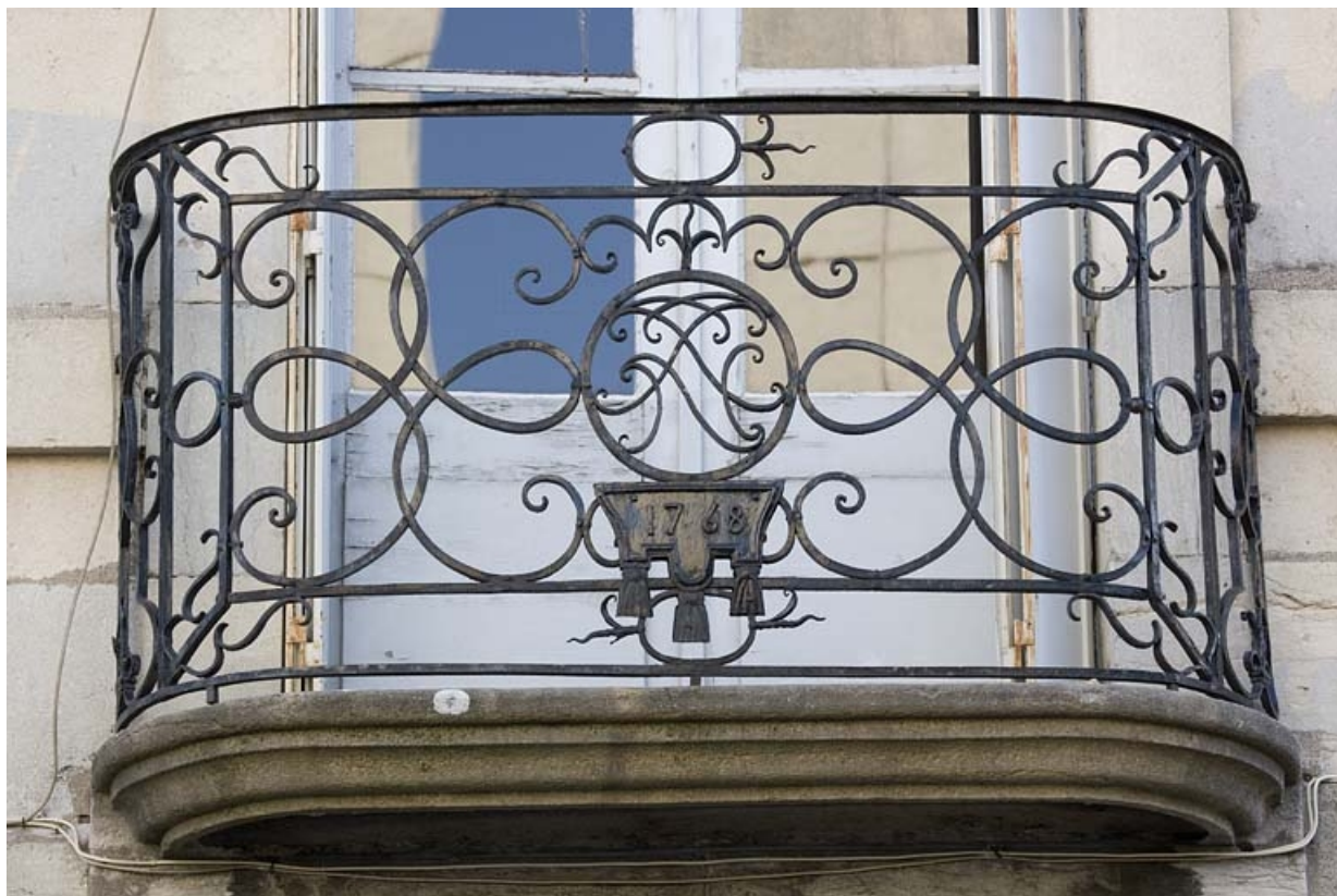
Détail du balcon : vue rapprochée.

25, Besançon, 11 rue Charles Nodier, lieudit : îlot Banque de France