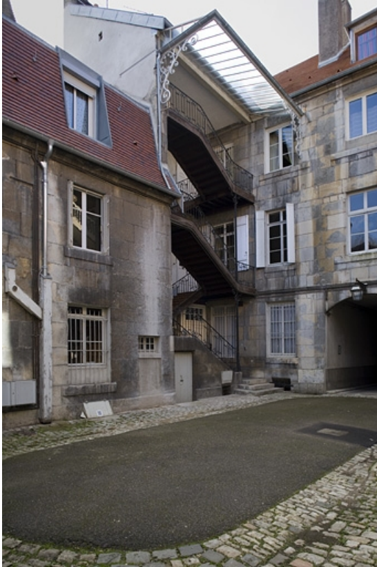
Vue d'ensemble de trois quarts droit depuis le fond de la cour. 25, Besançon, 11 rue Charles Nodier, lieudit : îlot Banque de France