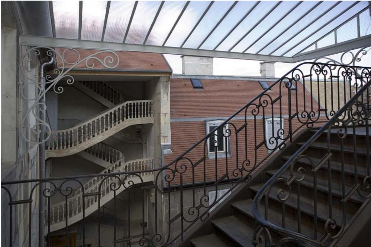
Détail de l'escalier droit depuis l'escalier gauche.

25, Besançon, 11 rue Charles Nodier, lieudit : îlot Banque de France