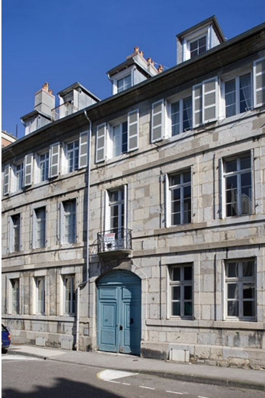
Vue d'ensemble de la façade sur rue de trois quarts droit.

25, Besançon, 11 rue Charles Nodier, lieudit : îlot Banque de France