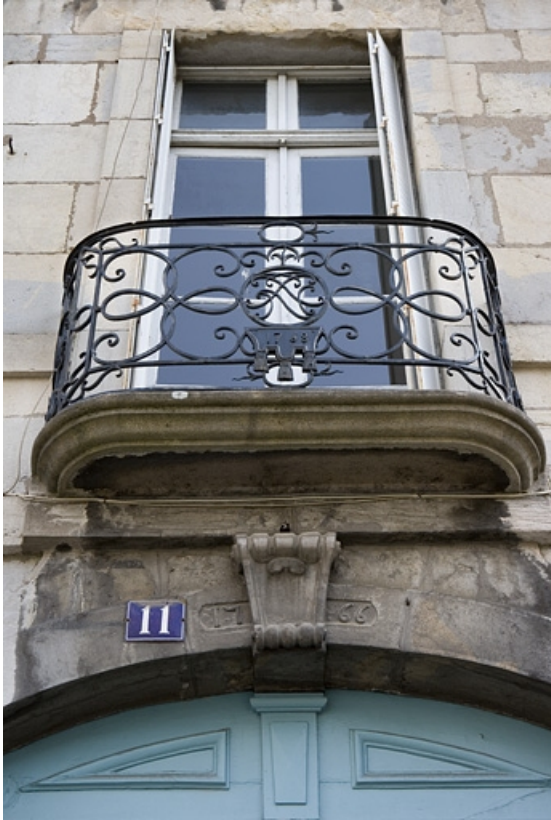
Détail du balcon en fer forgé sur rue avec la porte-fenêtre.

25, Besançon, 11 rue Charles Nodier, lieudit : îlot Banque de France