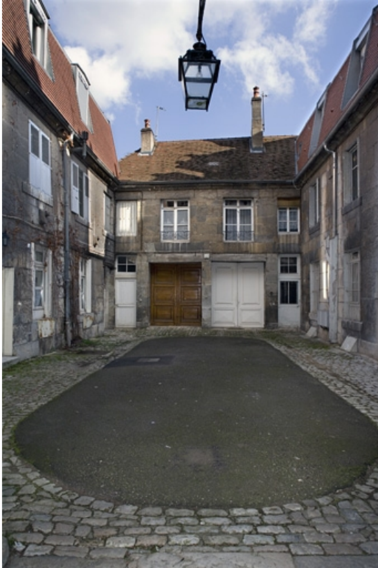
Vue d'ensemble de la cour depuis l'entrée.

25, Besançon, 11 rue Charles Nodier, lieudit : îlot Banque de France