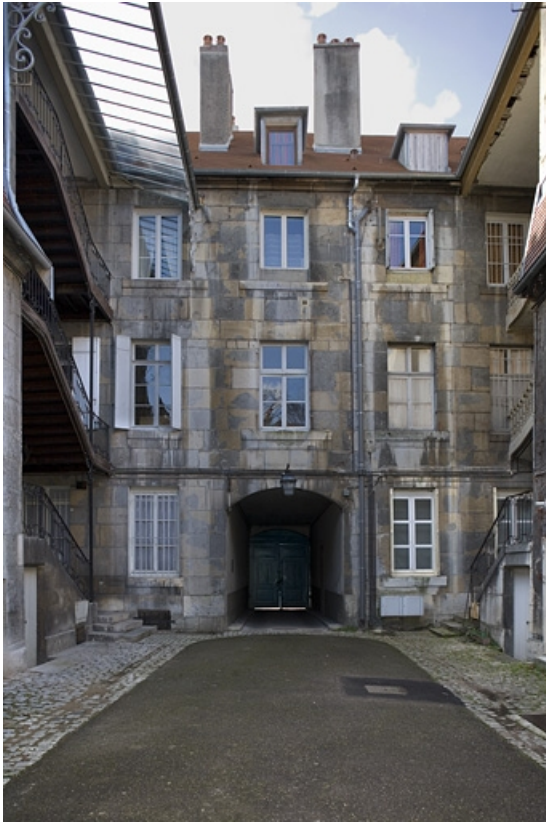
Vue d'ensemble de façade sur cour du logis principal.

25, Besançon, 11 rue Charles Nodier, lieudit : îlot Banque de France