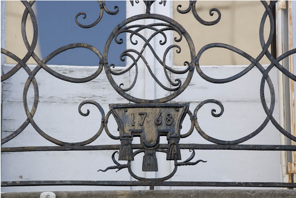
Détail de la date dans la ferronnerie du balcon.

25, Besançon, 11 rue Charles Nodier, lieudit : îlot Banque de France