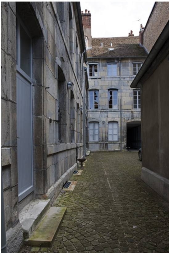
Vue d'ensemble des bâtiments depuis le fond de la cour.

25, Besançon, 24 rue Chifflet, lieudit : îlot Banque de France