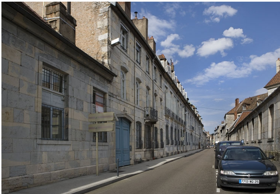
Vue d'ensemble de la façade sur rue dans l'alignement de la rue, de trois quarts gauche.

25, Besançon, 24 rue Chifflet, lieudit : îlot Banque de France