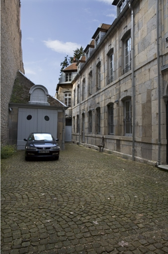
Vue d'ensemble de l' aile sur cour et du bâtiment des remise et écurie.

25, Besançon, 24 rue Chifflet, lieudit : îlot Banque de France