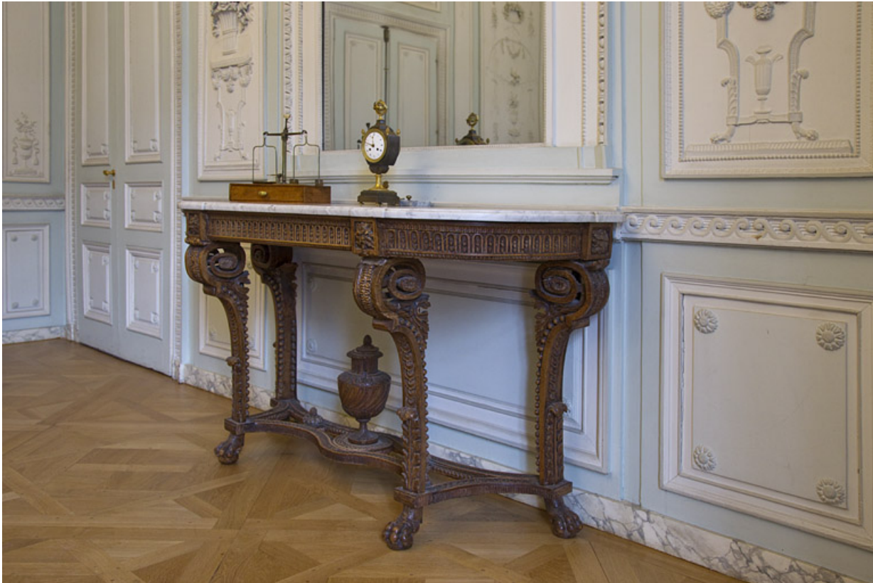
Intérieur, salon du rez-de-chaussée : vue d'ensemble de la console, de trois quarts droit.

25, Besançon, 19 rue de la Préfecture, lieudit : îlot Banque de France