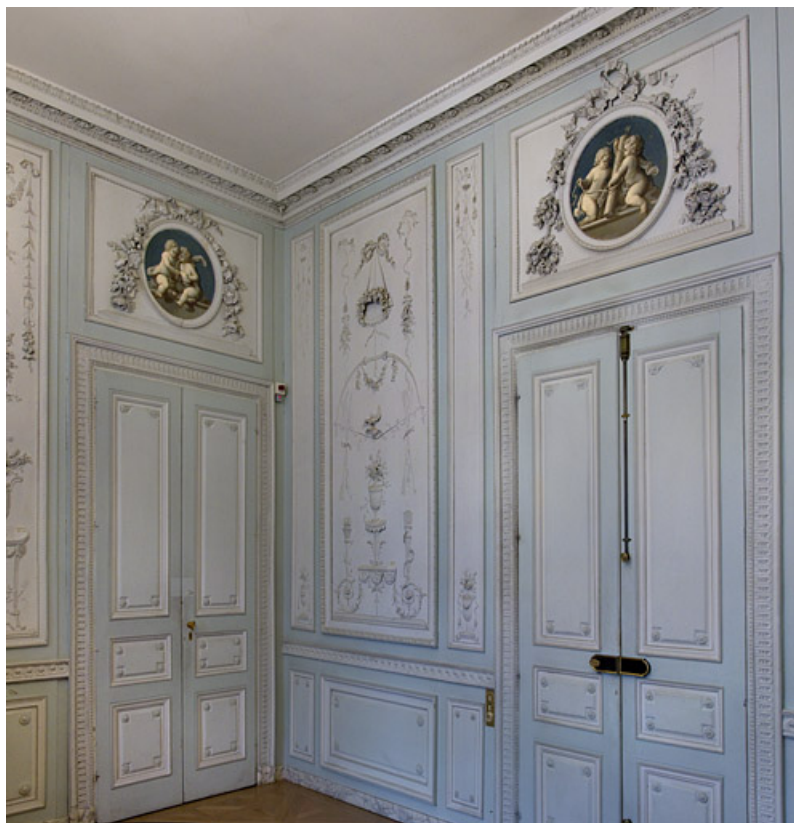
Intérieur, salon du rez-de-chaussée : détail des lambris dans un angle de la pièce. 25, Besançon, 19 rue de la Préfecture, lieudit : îlot Banque de France