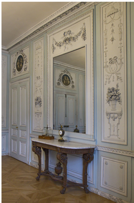
Intérieur, salon du rez-de-chaussée : vue d'ensemble de la console dans son décor de lambris. 25, Besançon, 19 rue de la Préfecture, lieudit : îlot Banque de France