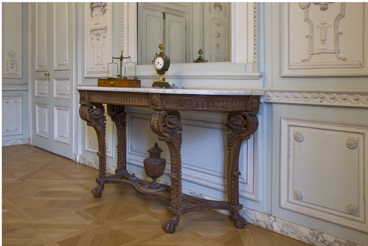
Intérieur, salon du rez-de-chaussée : vue d'ensemble de la console, de trois quarts droit.

25, Besançon, 19 rue de la Préfecture, lieu dit : îlot Banque de France