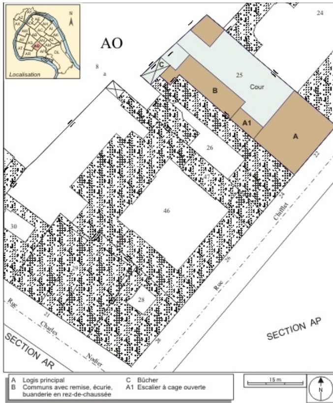
Plan masse et de situation. Extrait du plan cadastral, 1993, section AO. 25, Besançon, 22 rue Chifflet, lieudit : îlot Banque de France