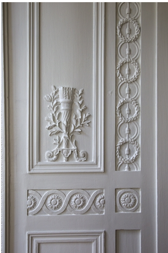
Intérieur, salon du rez-de-chaussée de l'aile gauche : détail du décor d'un panneau de lambris. 25, Besançon, 14 rue Chifflet, lieudit : îlot Banque de France