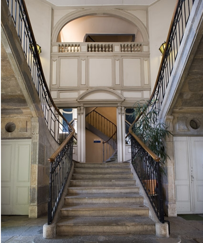
Vue de l'escalier d' honneur de face.

25, Besançon, 21 rue de la Préfecture, lieudit : îlot Banque de France