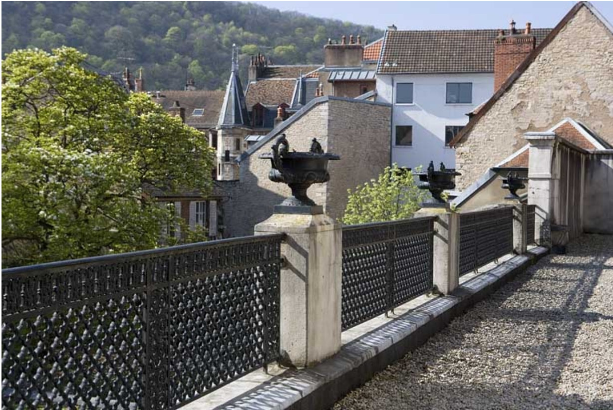
Vue du parapet bordant la terrasse du jardin d'hiver, côté jardin. 25, Besançon, 21 rue de la Préfecture, lieudit : îlot Banque de France