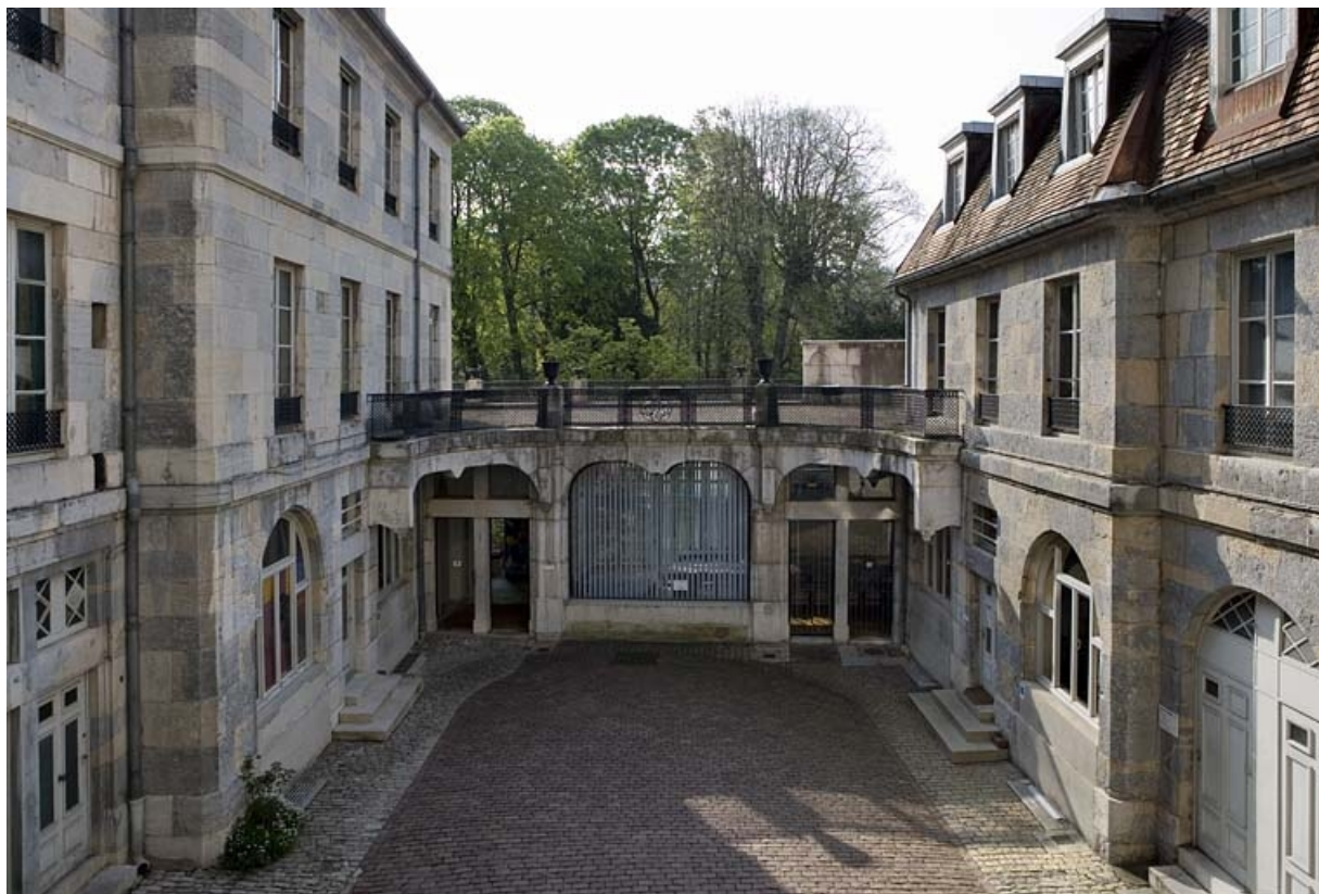
Vue d'ensemble des deux ailes et du jardin d'hiver depuis l'entrée de la cour.

25, Besançon, 21 rue de la Préfecture, lieudit : îlot Banque de France