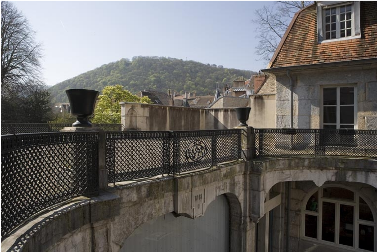
Vue du parapet bordant la terrasse du jardin d'hiver, côté cour.

25, Besançon, 21 rue de la Préfecture, lieudit : îlot Banque de France