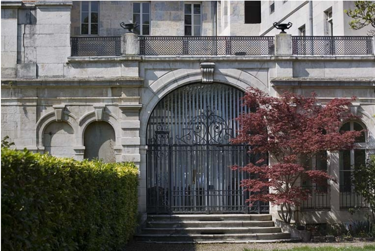
Détail de la façade postérieure du jardin d'hiver.

25, Besançon, 21 rue de la Préfecture, lieudit : îlot Banque de France