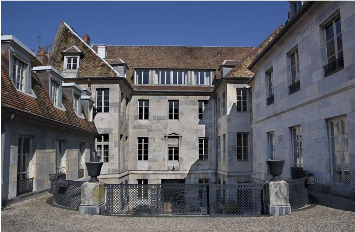
Vue d'ensemble des façades sur cour depuis la terrasse du jardin d'hiver.

25, Besançon, 21 rue de la Préfecture, lieudit : îlot Banque de France