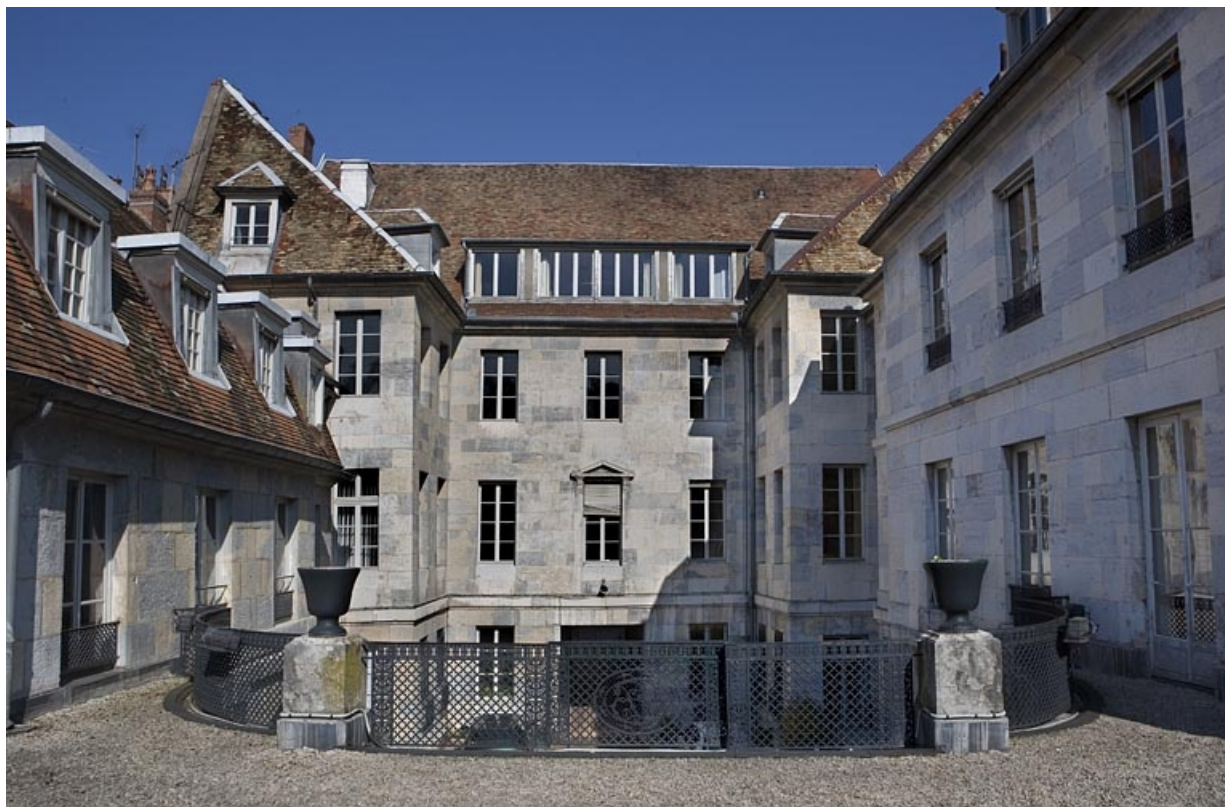
Vue d'ensemble des façades sur cour depuis la terrasse du jardin d'hiver.

25, Besançon, 21 rue de la Préfecture, lieudit : îlot Banque de France