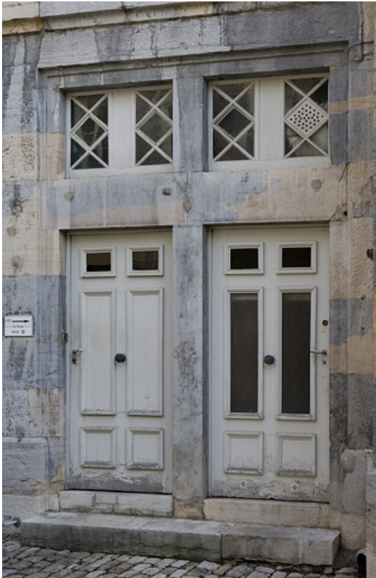
Détail de deux portes de l'aile à gauche de la cour

25, Besançon, 21 rue de la Préfecture, lieudit : îlot Banque de France