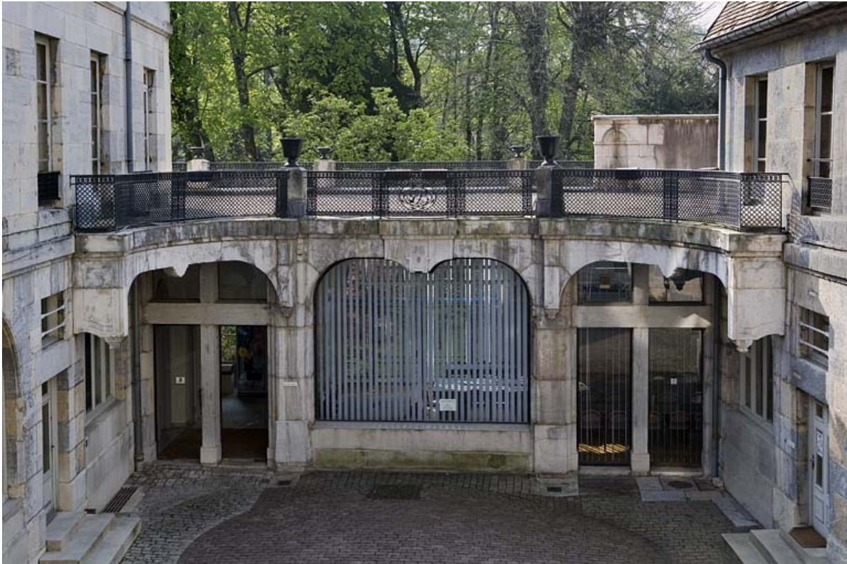
Vue d'ensemble du jardin d'hiver depuis la cour.

25, Besançon, 21 rue de la Préfecture, lieudit : îlot Banque de France