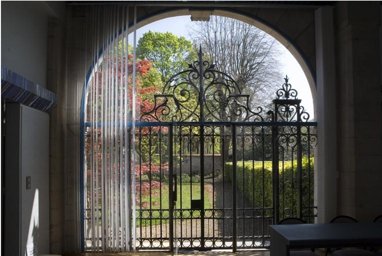
Vue du jardin depuis l'intérieur du jardin d'hiver.

25, Besançon, 21 rue de la Préfecture, lieudit : îlot Banque de France