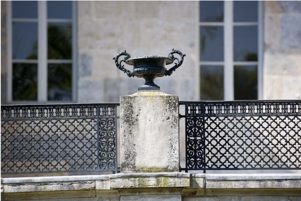
Détail d'un vase en fonte ornant le parapet de la terrasse du jardin d'hiver.

25, Besançon, 21 rue de la Préfecture, lieudit : îlot Banque de France