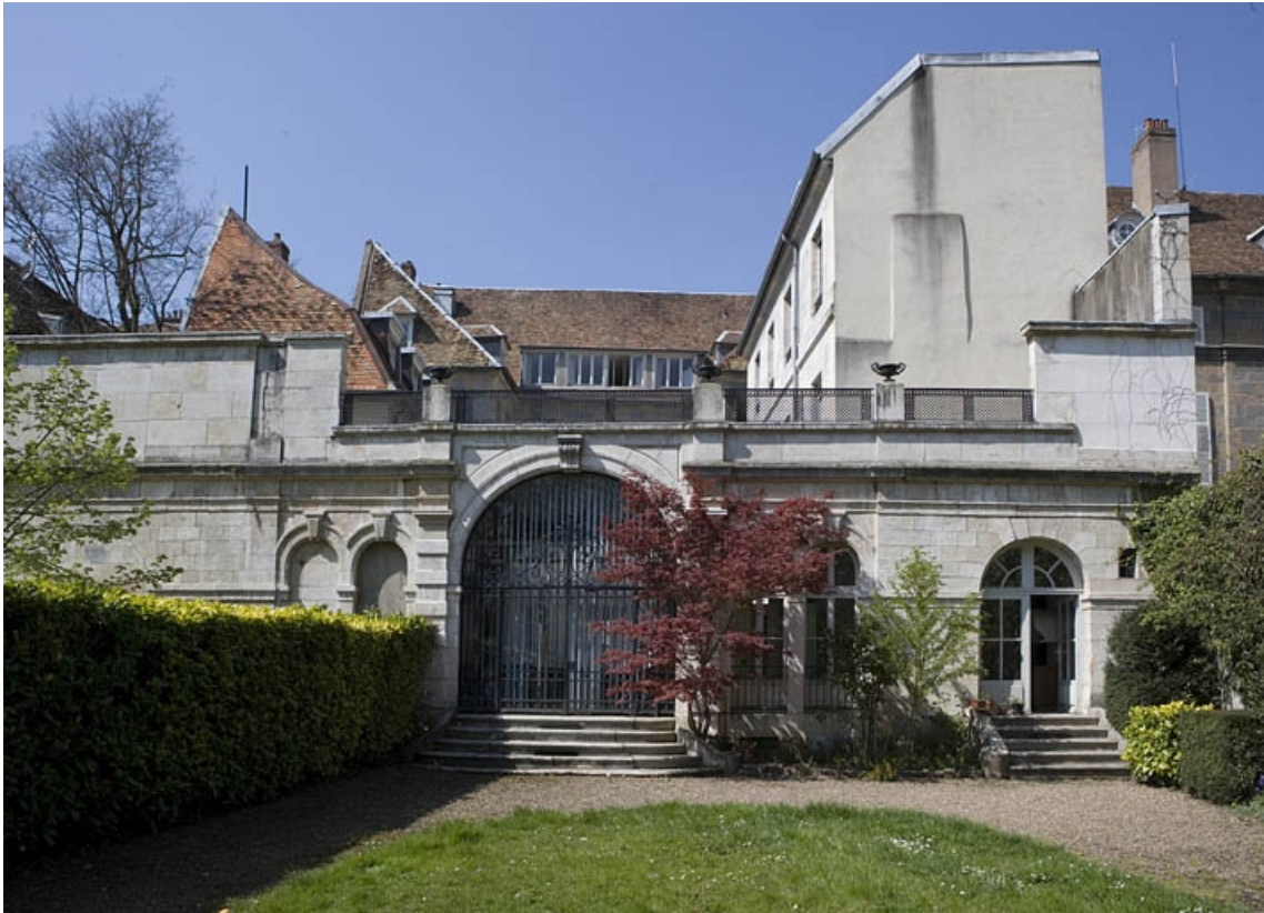
Vue de la façade postérieure du jardin d'hiver.

25, Besançon, 21 rue de la Préfecture, lieudit : îlot Banque de France