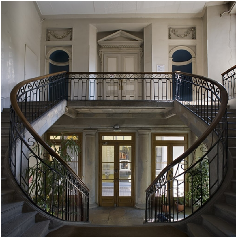
Vue de l'escalier d'honneur depuis le premier palier.

25, Besançon, 21 rue de la Préfecture, lieudit : îlot Banque de France