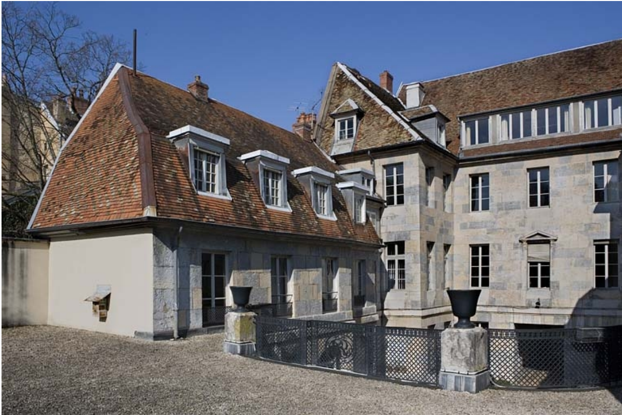
Vue de l'aile droite sur cour depuis la terrasse du jardin d'hiver.

25, Besançon, 21 rue de la Préfecture, lieudit : îlot Banque de France