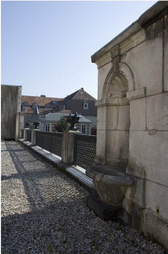
Vue de la borne fontaine sur la terrasse du jardin d'hiver.

25, Besançon, 21 rue de la Préfecture, lieudit : îlot Banque de France