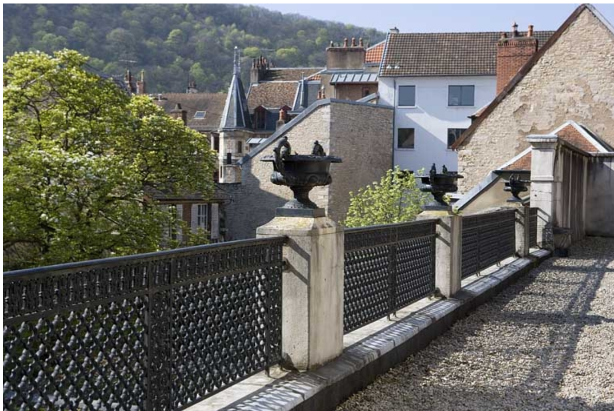
Vue du parapet bordant la terrasse du jardin d'hiver, côté jardin.

25, Besançon, 21 rue de la Préfecture, lieudit : îlot Banque de France