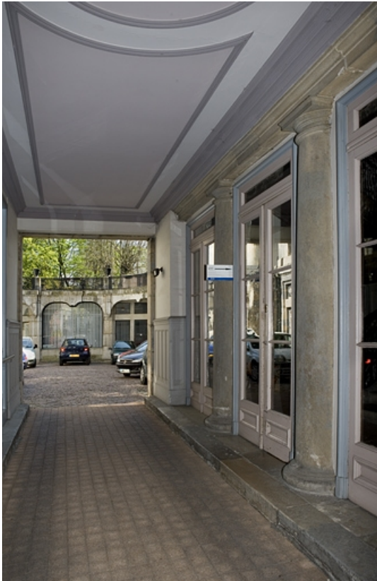
Vue d'ensemble du passage cocher depuis l'entrée.

25, Besançon, 21 rue de la Préfecture, lieudit : îlot Banque de France