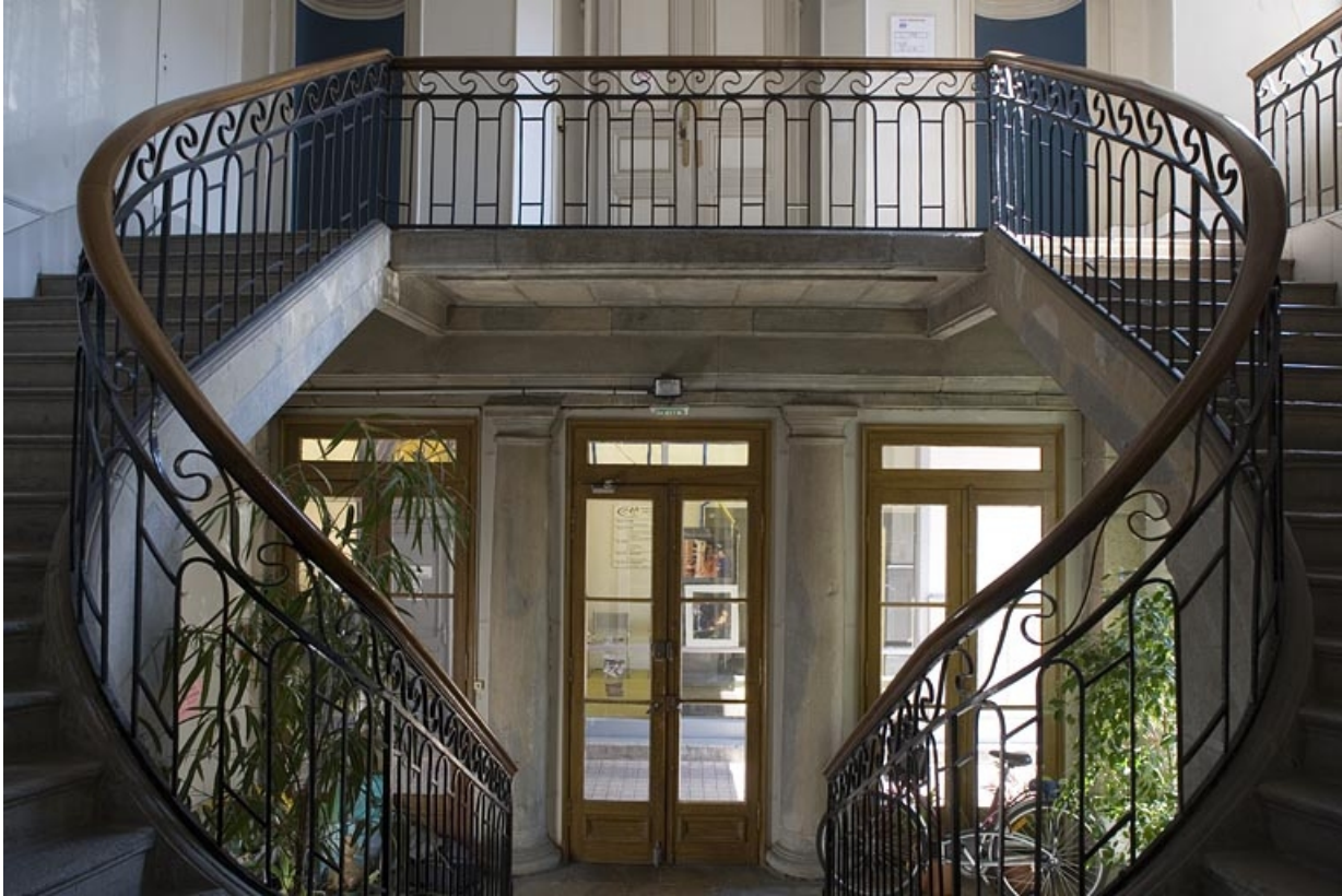
Vue d'ensemble de la rampe de l'escalier d'honneur.

25, Besançon, 21 rue de la Préfecture, lieudit : îlot Banque de France