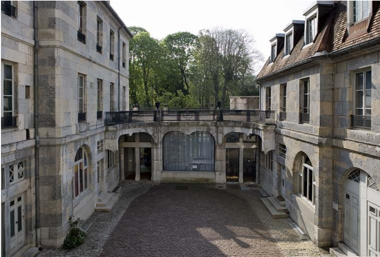
Vue d'ensemble des deux ailes et du jardin d'hiver depuis l'entrée de la cour.

25, Besançon, 21 rue de la Préfecture, lieudit : îlot Banque de France