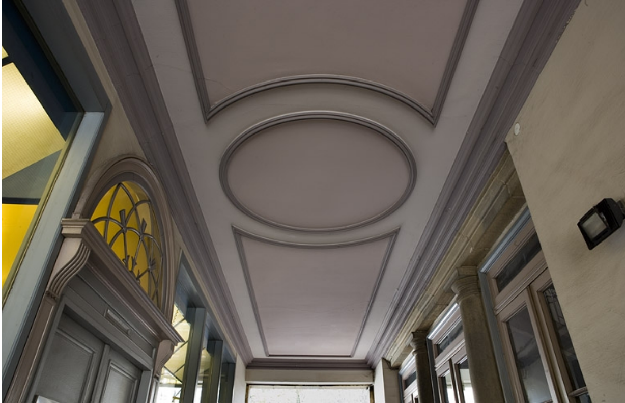
Vue d'ensemble du plafond passage cocher depuis l'entrée.

25, Besançon, 21 rue de la Préfecture, lieudit : îlot Banque de France