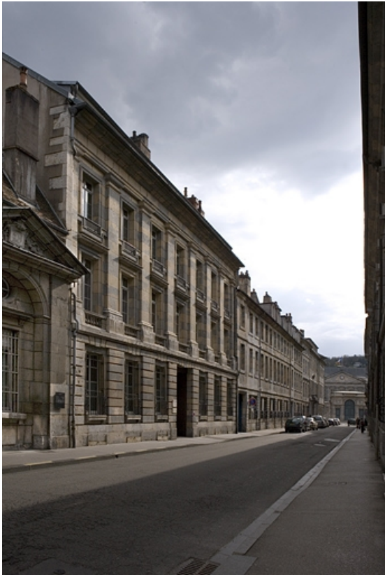
Vue d'ensemble depuis la rue, de trois quarts gauche.

25, Besançon, 21 rue de la Préfecture, lieudit : îlot Banque de France