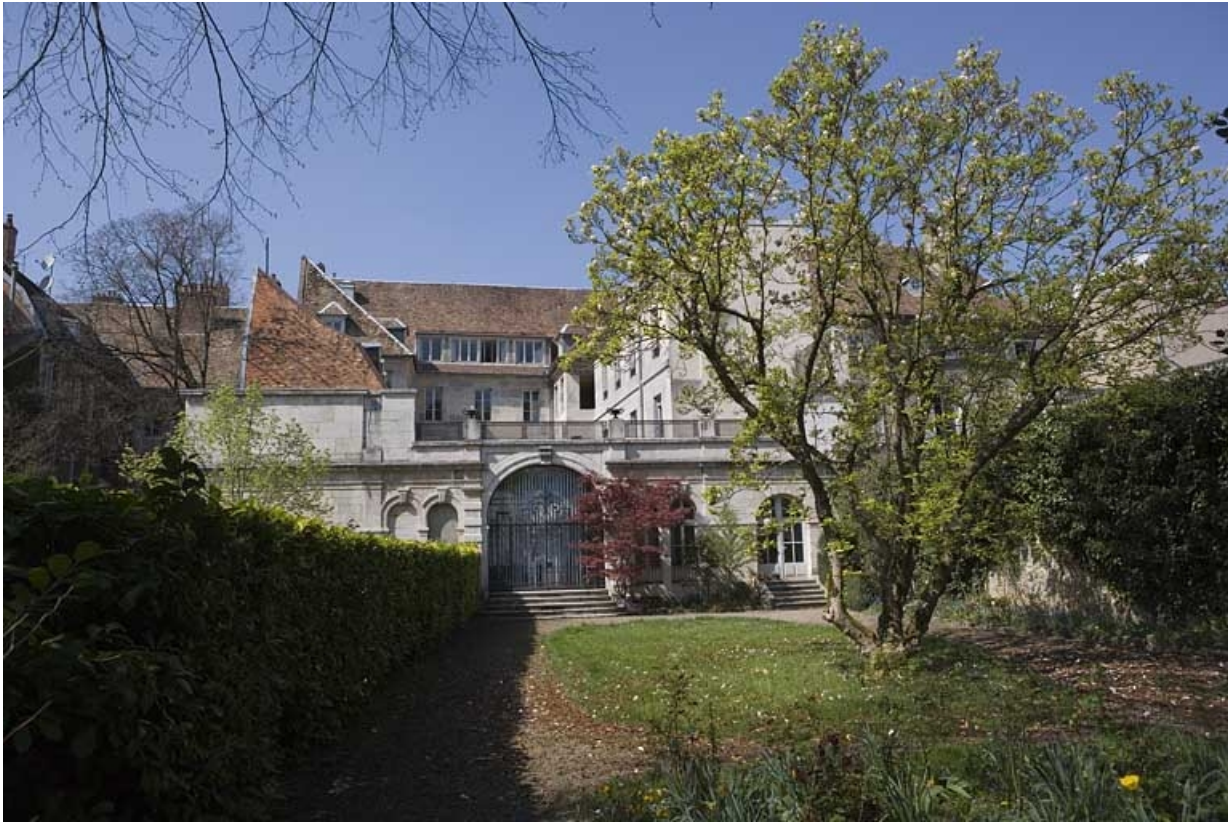
Vue du jardin depuis le fond de la parcelle.

25, Besançon, 21 rue de la Préfecture, lieudit : îlot Banque de France