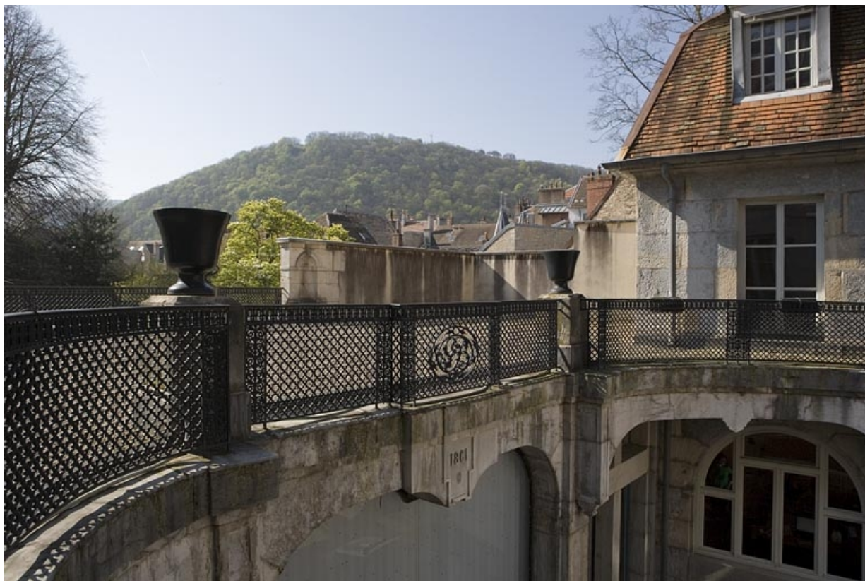
Vue du parapet bordant la terrasse du jardin d'hiver, côté cour.

25, Besançon, 21 rue de la Préfecture, lieudit : îlot Banque de France