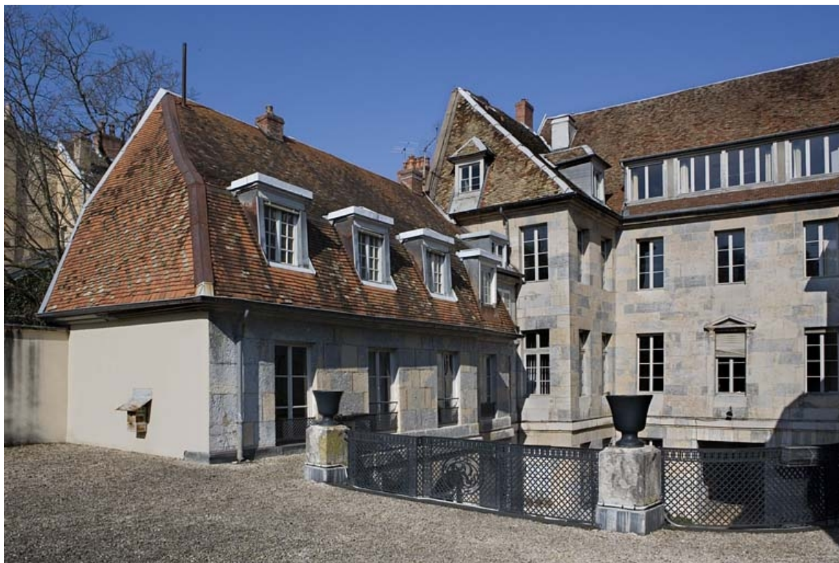
Vue de l'aile droite sur cour depuis la terrasse du jardin d'hiver.

25, Besançon, 21 rue de la Préfecture, lieudit : îlot Banque de France