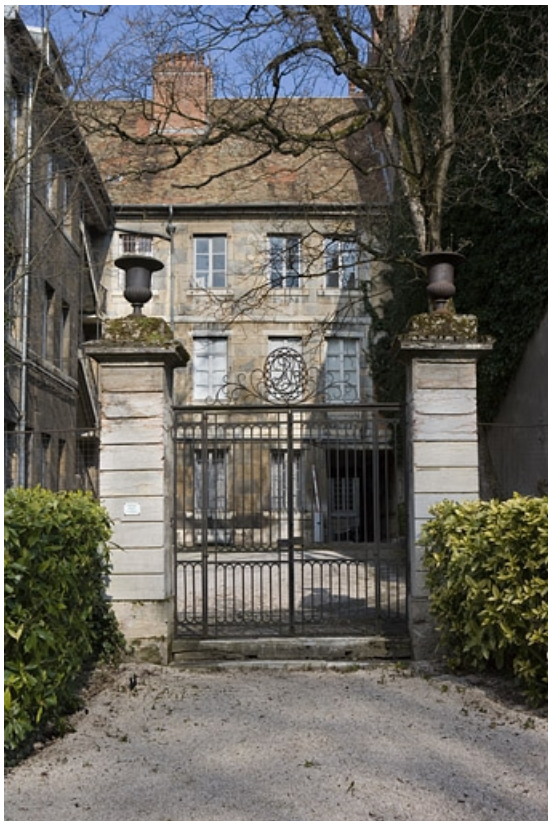
Vue d'ensemble de la grille du jardin depuis l'intérieur du jardin. 25, Besançon, 23 rue de la Préfecture, lieudit : îlot Banque de France