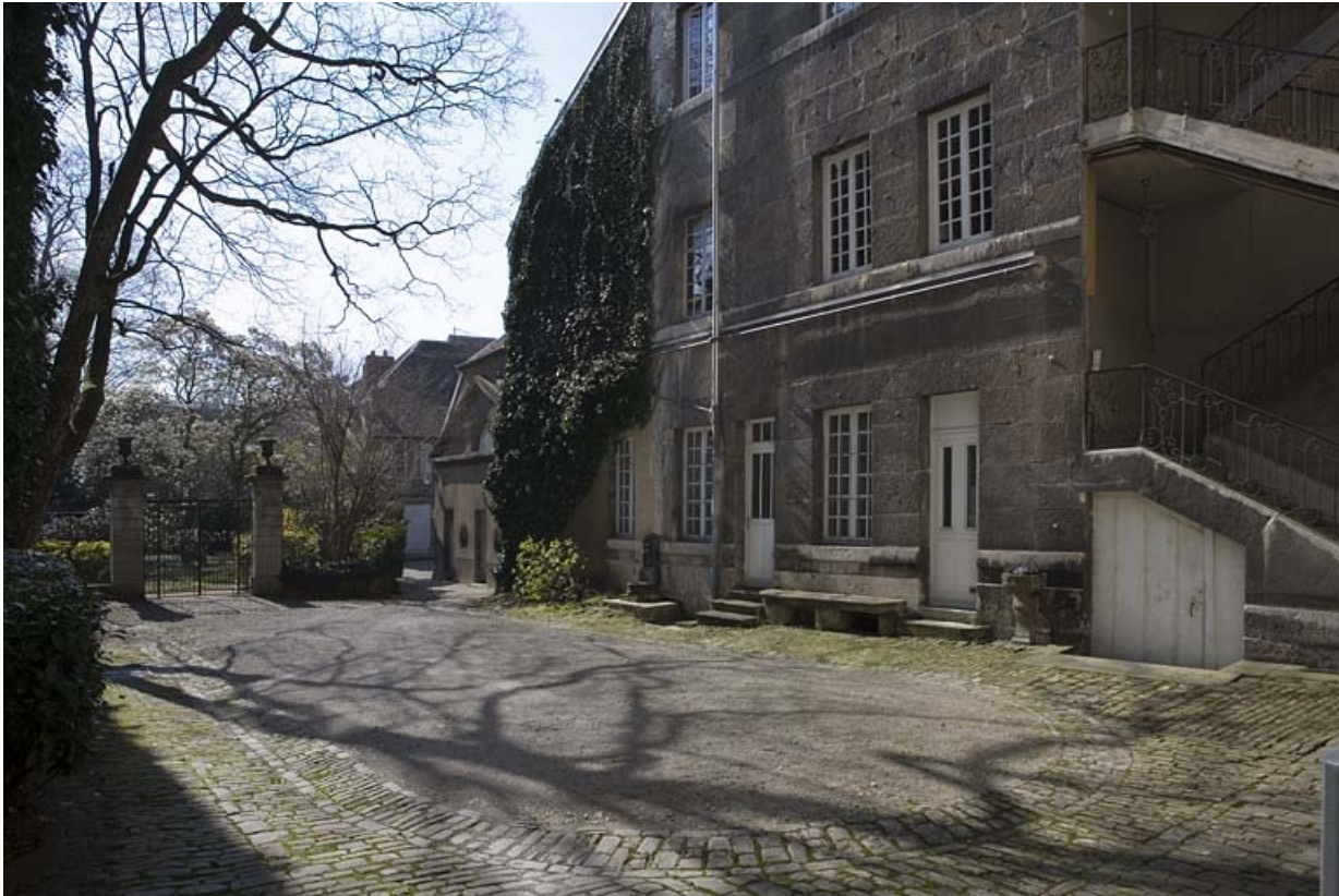
Vue d'ensemble de l'aile sur cour.

25, Besançon, 23 rue de la Préfecture, lieudit : îlot Banque de France