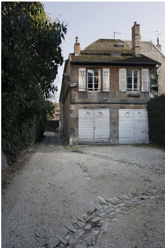
Vue d'ensemble de face du bâtiment des remise et écurie gauche. 25, Besançon, 23 rue de la Préfecture, lieudit : îlot Banque de France