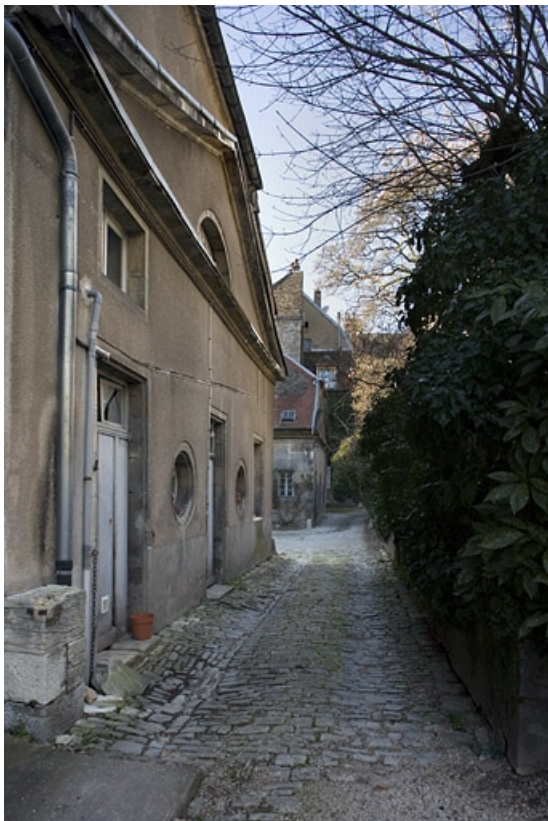
Vue d'ensemble de profil du bâtiment des remise et écurie gauche. 25, Besançon, 23 rue de la Préfecture, lieudit : îlot Banque de France