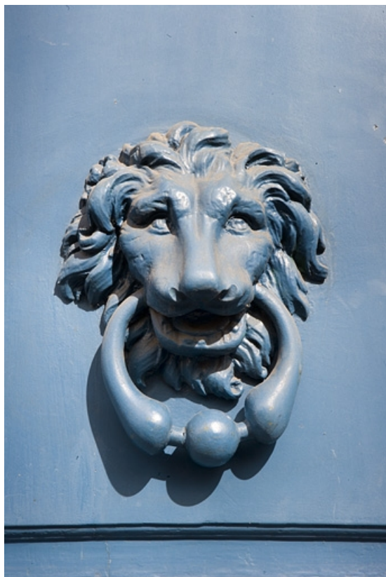
Détail du heurtor du portail d'entrée : vue rapprochée.

25, Besançon, 29 rue de la Préfecture, lieudit : îlot Banque de France