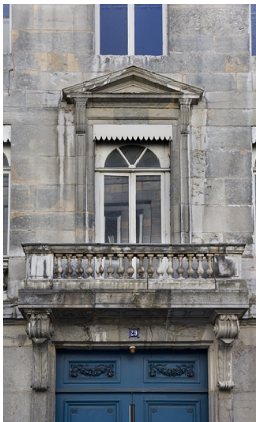
Détail de la baie et du balcon situés au-dessus du portail d'entrée.

25, Besançon, 29 rue de la Préfecture, lieudit : îlot Banque de France