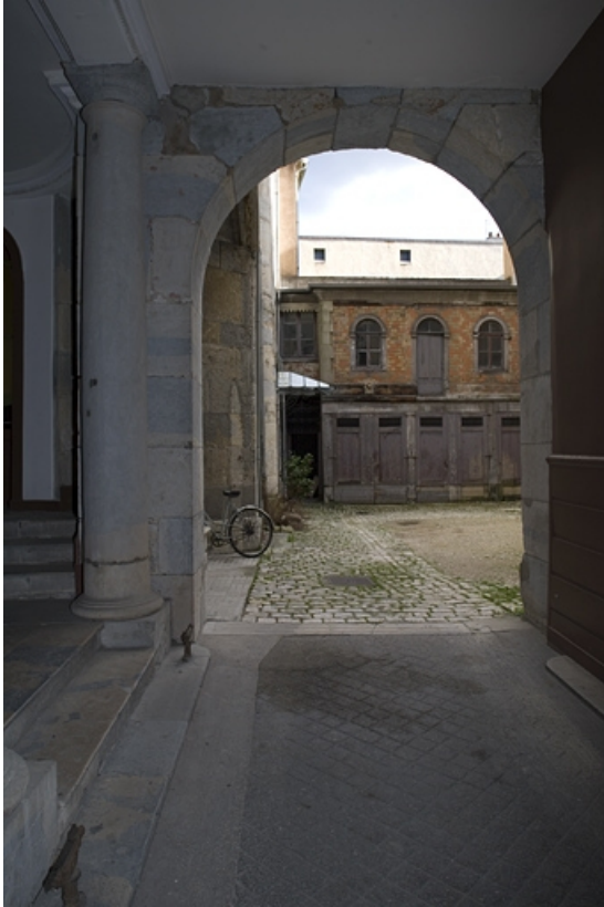
Vue des dépendances en fond de cour depuis le passage cocher. 25, Besançon, 29 rue de la Préfecture, lieudit : îlot Banque de France