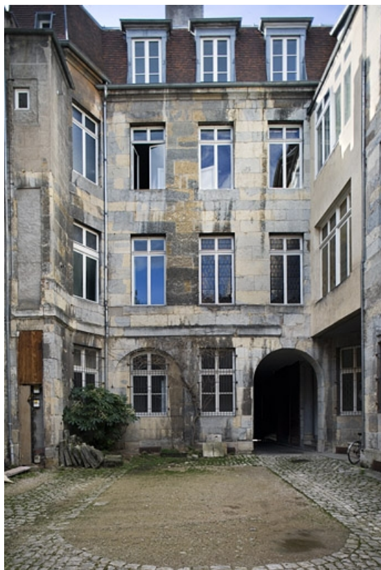
Vue d'ensemble des façades sur cour depuis le fond de la parcelle.

25, Besançon, 29 rue de la Préfecture, lieudit : îlot Banque de France