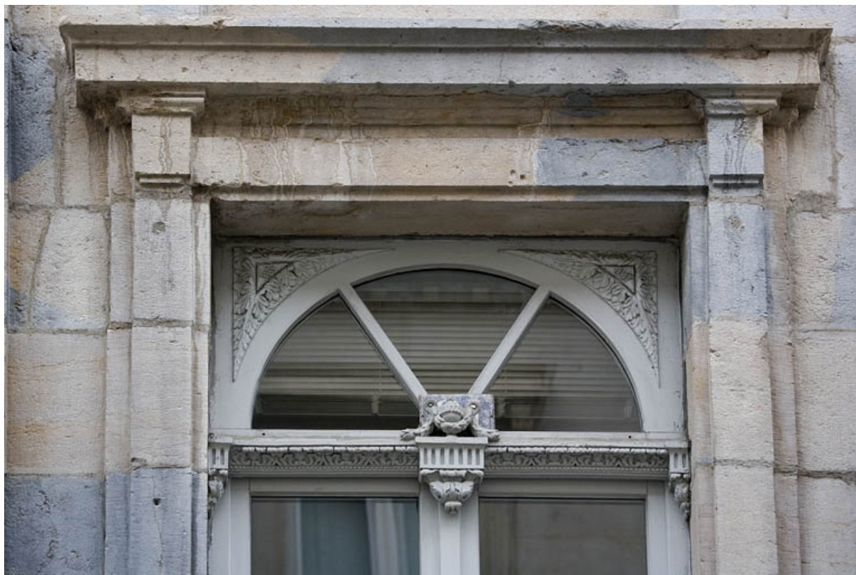
Détail du décor du tympan de la porte-fenêtre donnant sur le balcon.

25, Besançon, 13 rue de la Préfecture, lieudit : îlot Banque de France