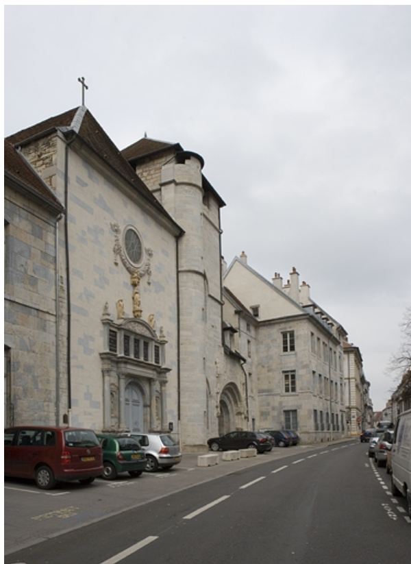
Vue d'ensemble depuis la rue Mégevand avec l'église Notre-Dame.

25, Besançon, 13 rue de la Préfecture, lieudit : îlot Banque de France