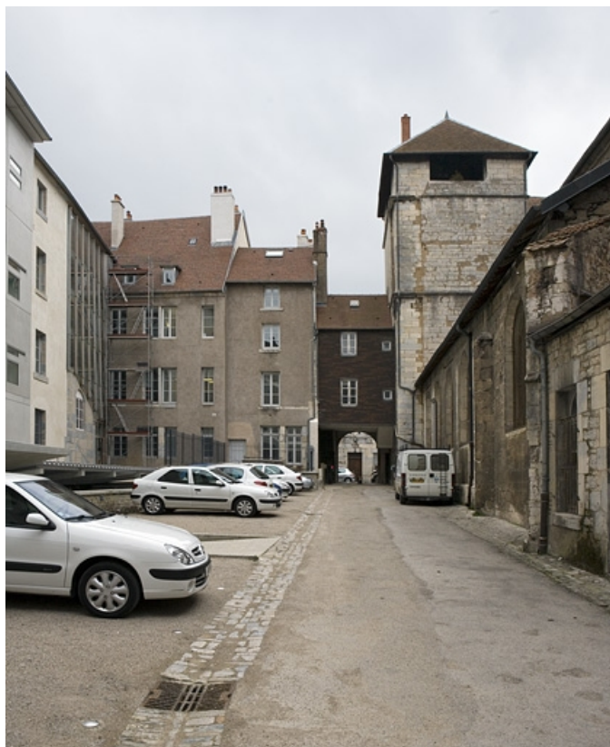
Vue de l'arrière de l'immeuble depuis le fond de l'impasse.

25, Besançon, 13 rue de la Préfecture, lieudit : îlot Banque de France