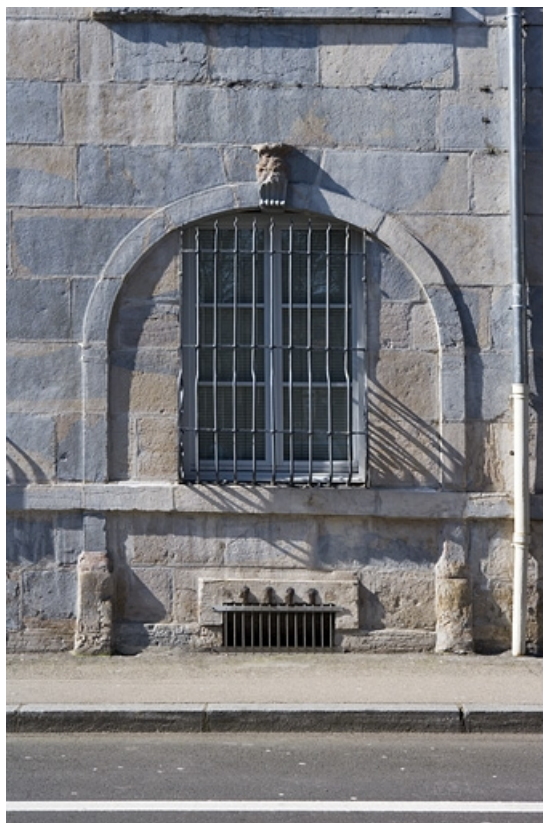
Détail d'une arcade boutiquière murée sur la façade latérale gauche. 25, Besançon, 13 rue de la Préfecture, lieudit : îlot Banque de France