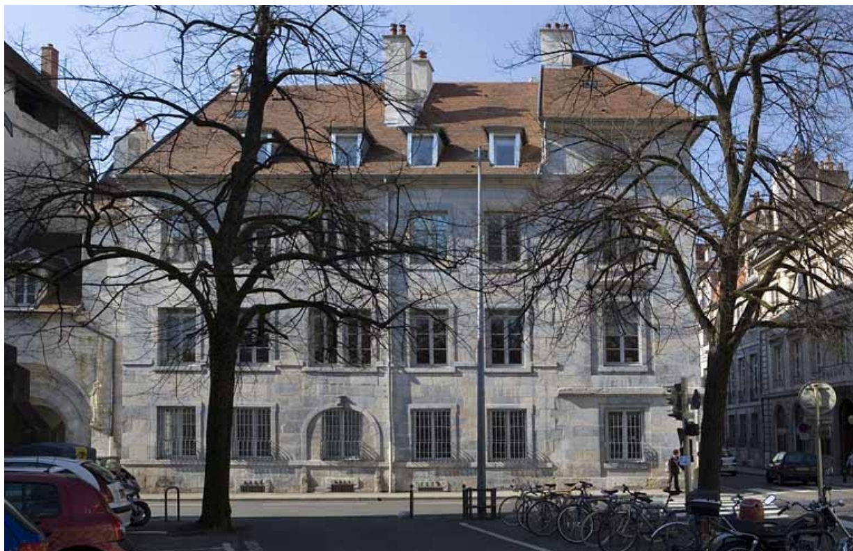
Vue d'ensemble de la façade latérale gauche depuis la promenade Granvelle. 25, Besançon, 13 rue de la Préfecture, lieudit : îlot Banque de France