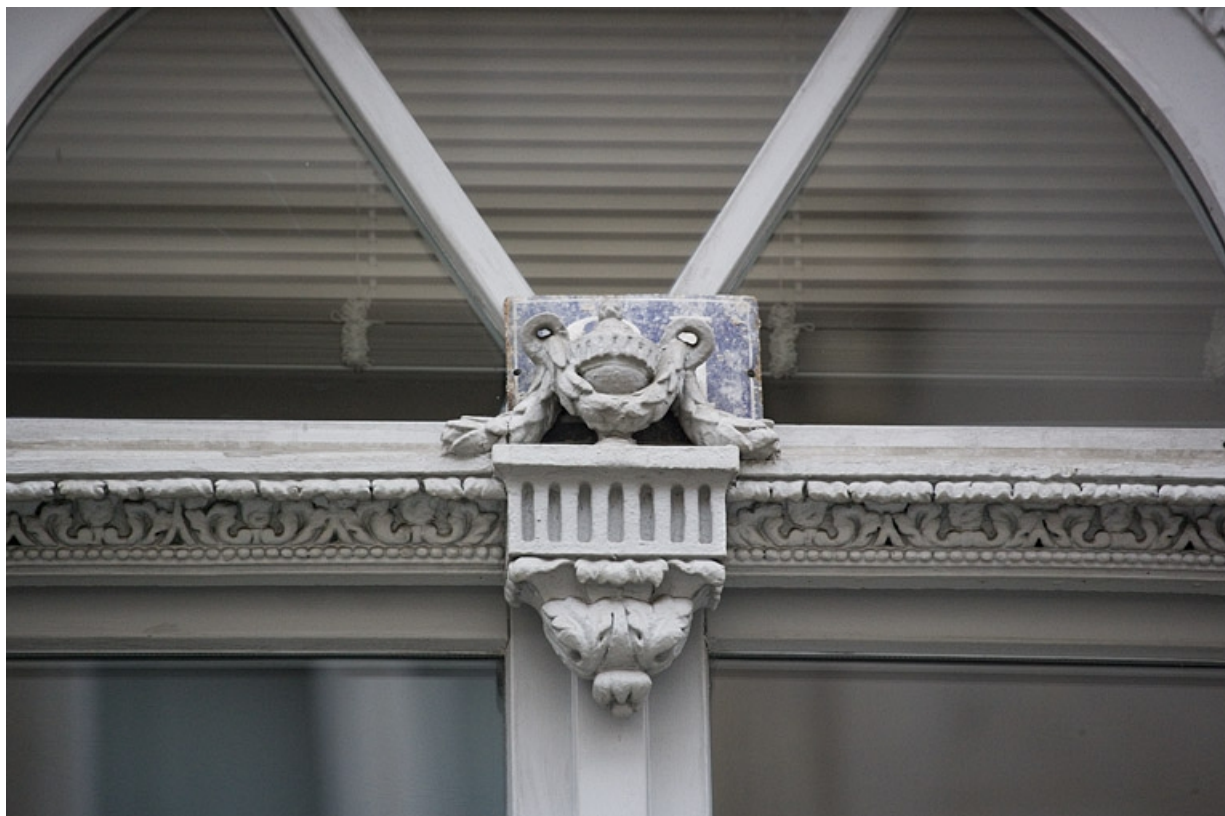
Détail de l'urne décorant la traverse dormante de la porte-fenêtre donnant sur le balcon.

25, Besançon, 13 rue de la Préfecture, lieudit : îlot Banque de France