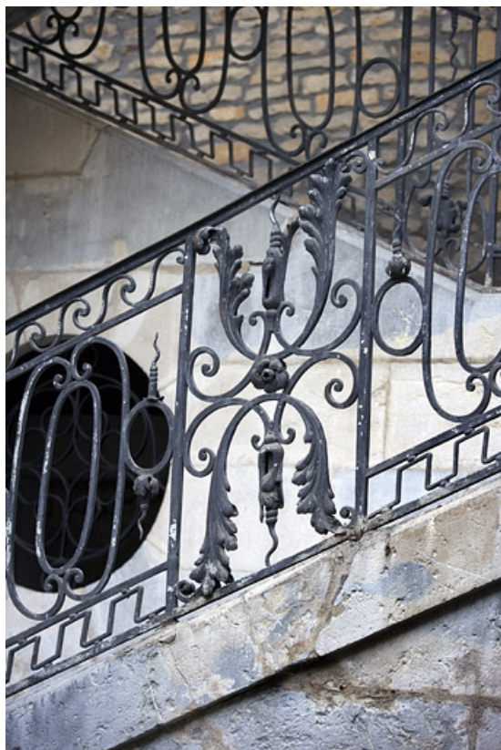
Détail d'une partie du décor de la rampe de l'escalier.

25, Besançon, 12 rue Chifflet, lieudit : îlot Banque de France