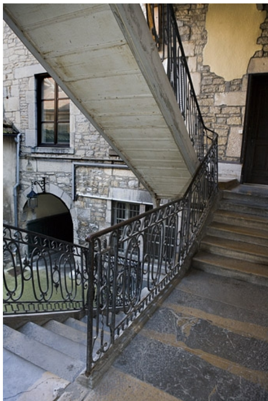
Vue d'ensemble de l'escalier à cage ouverte depuis le premier palier.

25, Besançon, 12 rue Chifflet, lieudit : îlot Banque de France