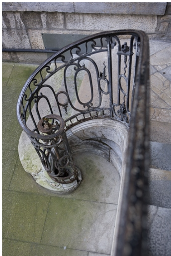
Détail du départ de la rampe en fer forgé de l'escalier à cage ouverte.

25, Besançon, 12 rue Chifflet, lieudit : îlot Banque de France