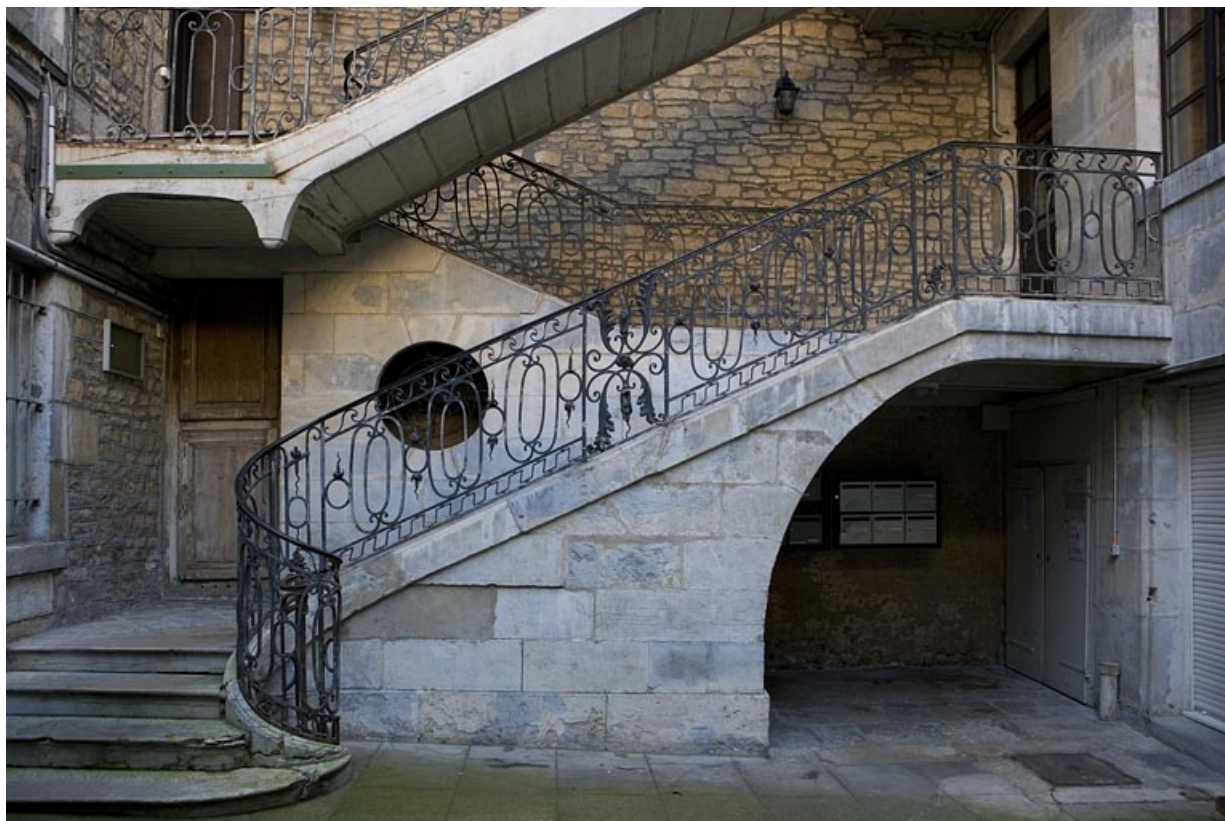
Détail de la première volée de l'escalier à cage ouverte depuis la cour.

25, Besançon, 12 rue Chifflet, lieudit : îlot Banque de France