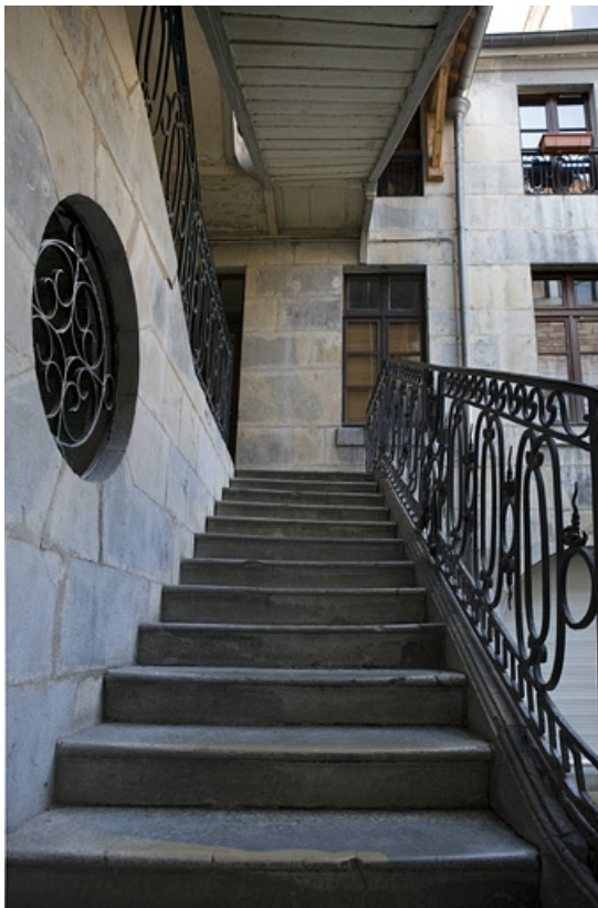
Détail de la première volée de l'escalier à cage ouverte. 25, Besançon, 12 rue Chifflet, lieudit : îlot Banque de France