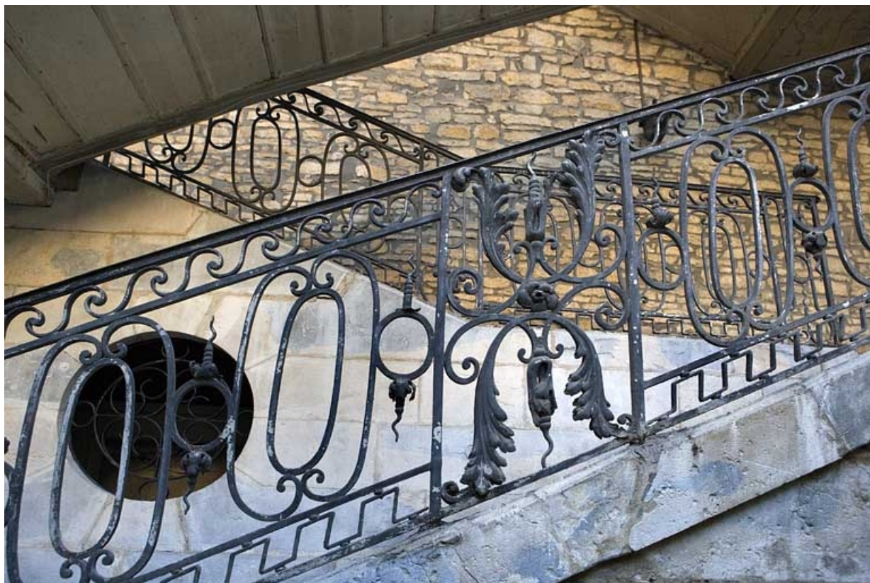
Détail de la rampe en fer forgé de l'escalier à cage ouverte.

25, Besançon, 12 rue Chifflet, lieudit : îlot Banque de France