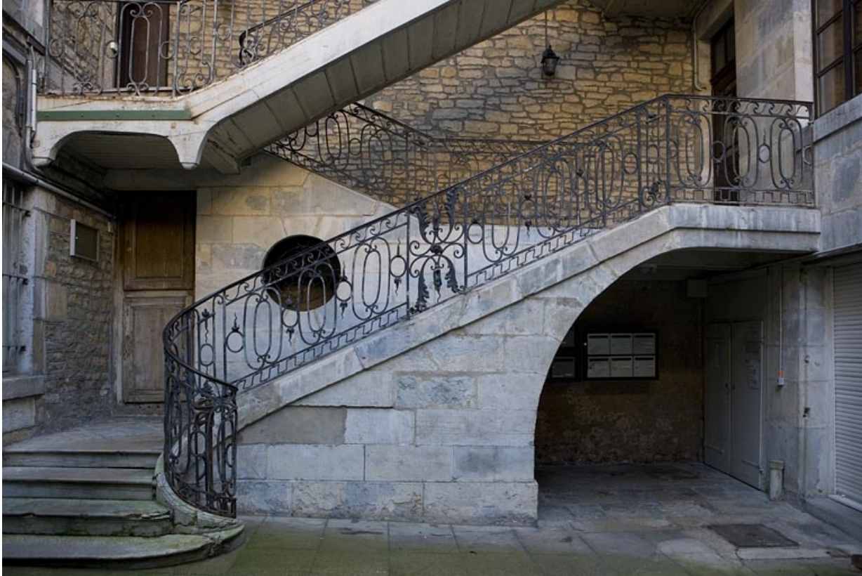
Détail de la première volée de l'escalier à cage ouverte depuis la cour.

25, Besançon, 12 rue Chifflet, lieudit : îlot Banque de France