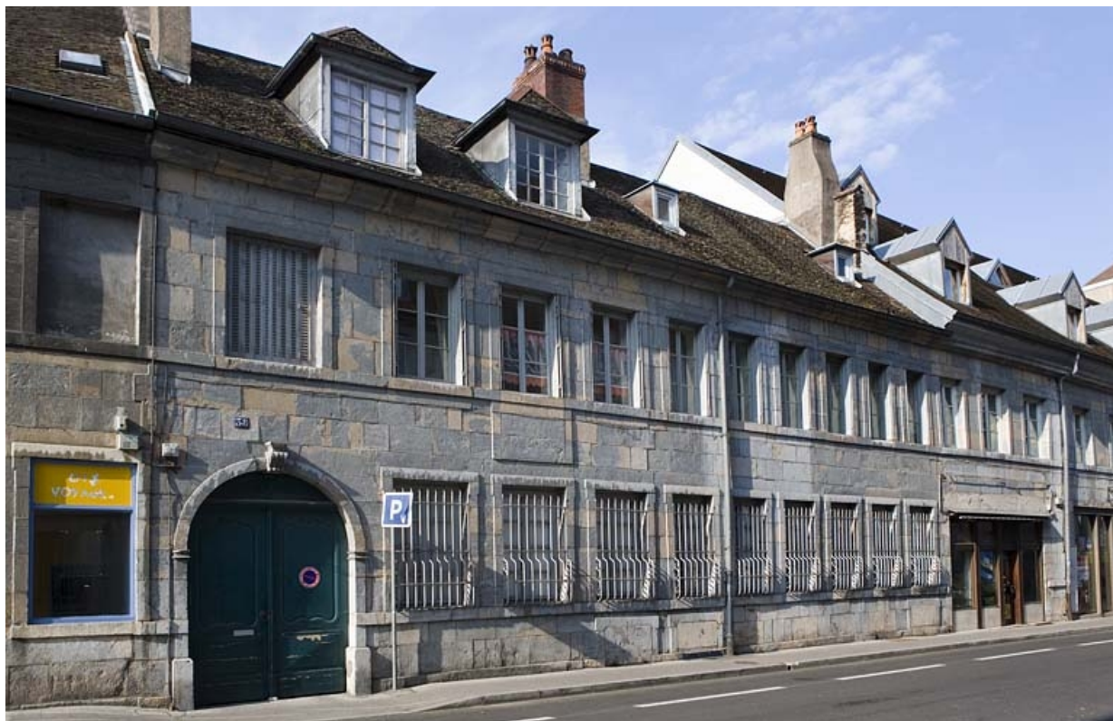
Vue d'ensemble depuis la rue de trois quarts gauche. 25, Besançon, 38 rue Mégevand, lieudit : îlot Banque de France