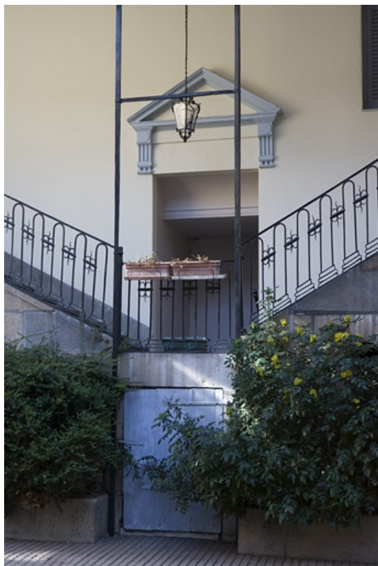
Détail du premier palier de l'escalier à cage ouverte.

25, Besançon, 38 rue Mégevand, lieudit : îlot Banque de France