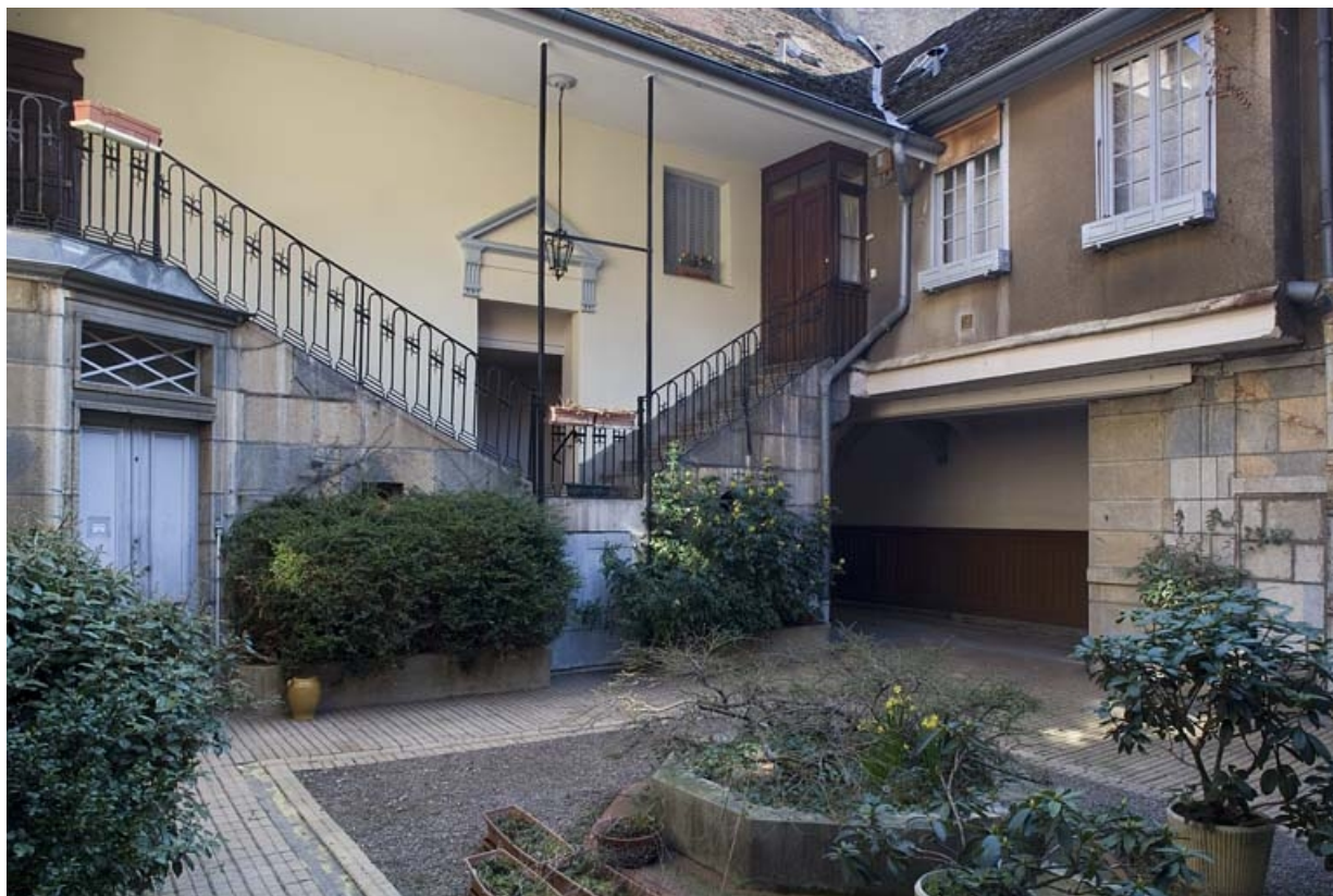
Vue d'ensemble de l'escalier à cage ouverte, de trois quarts gauche.

25, Besançon, 38 rue Mégevand, lieudit : îlot Banque de France