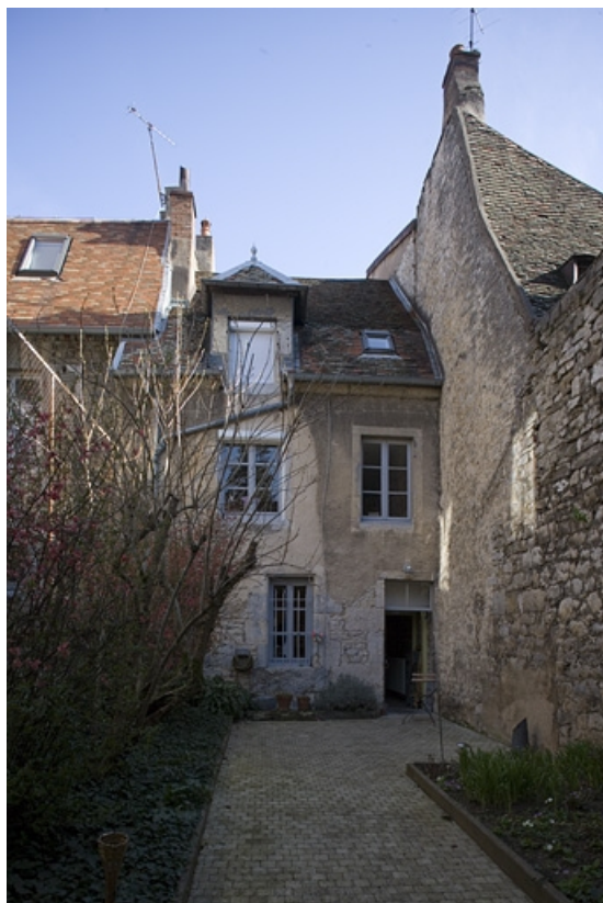
Façade postérieure du logis en fond de première cour depuis la deuxième cour. 25, Besançon, 38 rue Mégevand, lieudit : îlot Banque de France