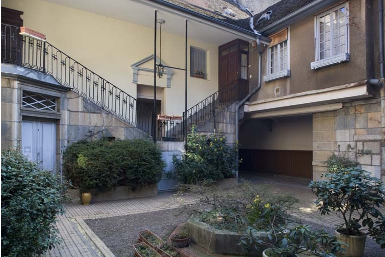
Vue d'ensemble de l'escalier à cage ouverte, de trois quarts gauche.

25, Besançon, 38 rue Mégevand, lieudit : îlot Banque de France