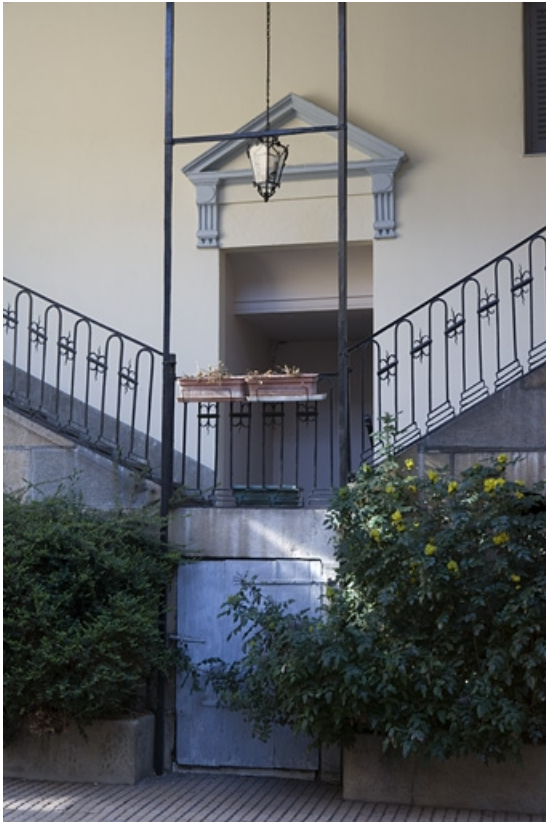
Détail du premier palier de l'escalier à cage ouverte.

25, Besançon, 38 rue Mégevand, lieudit : îlot Banque de France