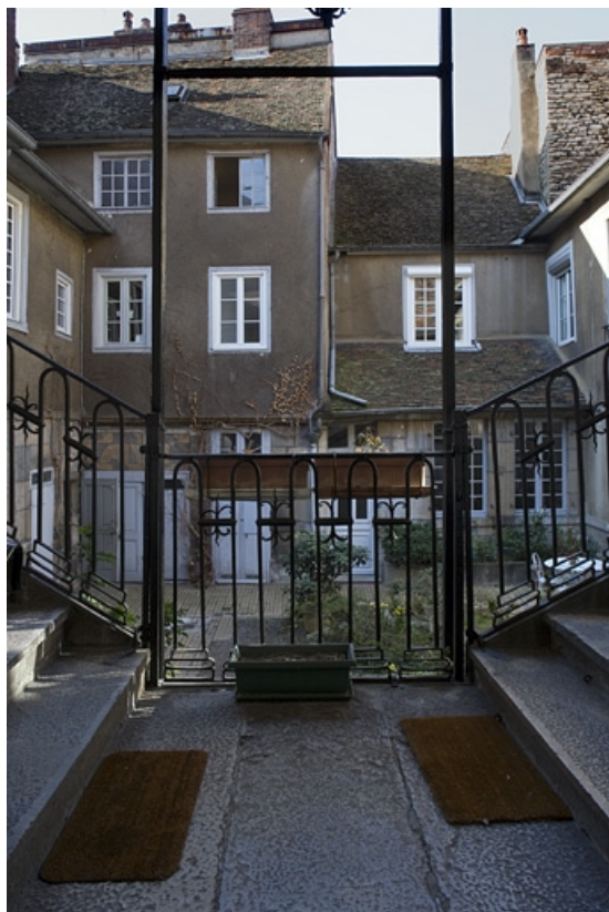
Vue des bâtiments en fond de cour depuis le premier palier de l'escalier.

25, Besançon, 38 rue Mégevand, lieudit : îlot Banque de France