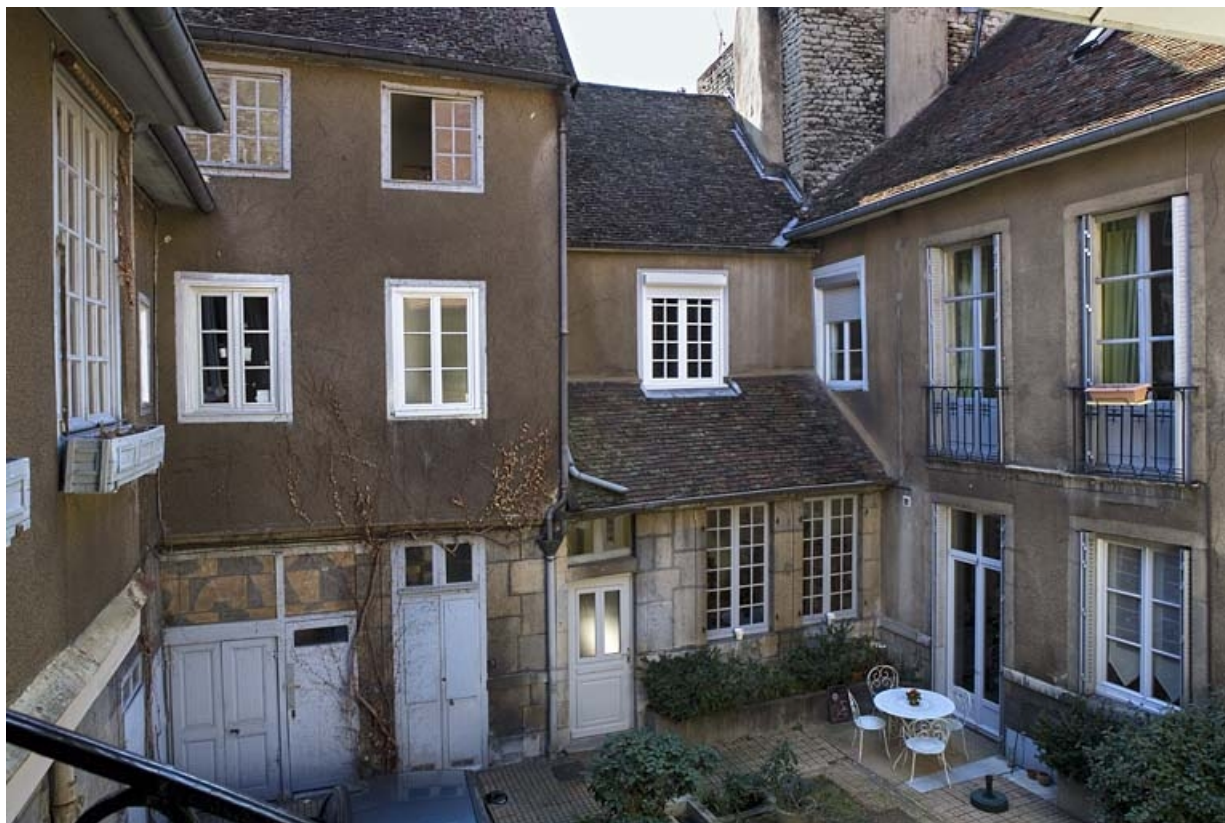
Vue des bâtiments autour de la cour, de trois quarts gauche.

25, Besançon, 38 rue Mégevand, lieudit : îlot Banque de France