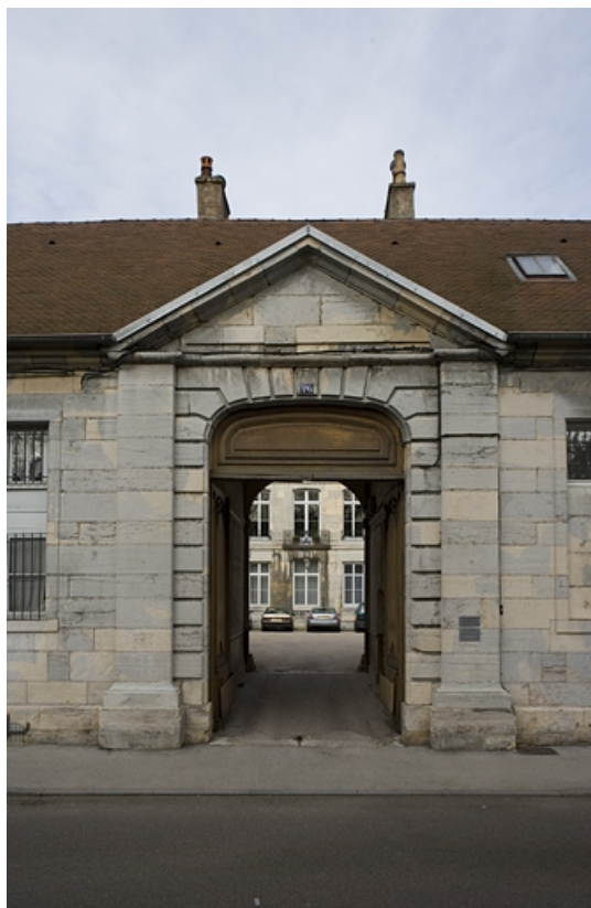
Vue d'ensemble du portail d'entrée dans la cour.

25, Besançon, 26 rue Chifflet, lieudit : îlot Banque de France