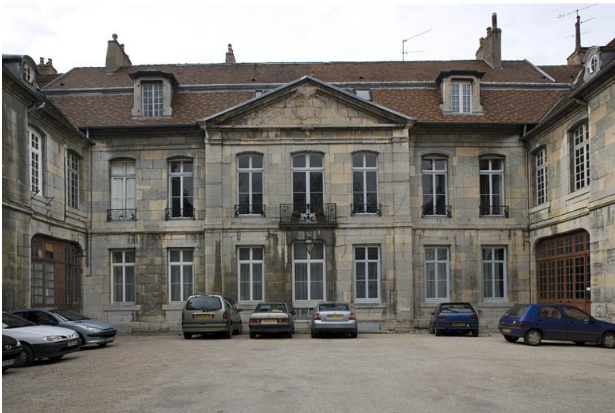
Vue d'ensemble du logis principal depuis l'entrée de la cour.

25, Besançon, 26 rue Chifflet, lieudit : îlot Banque de France