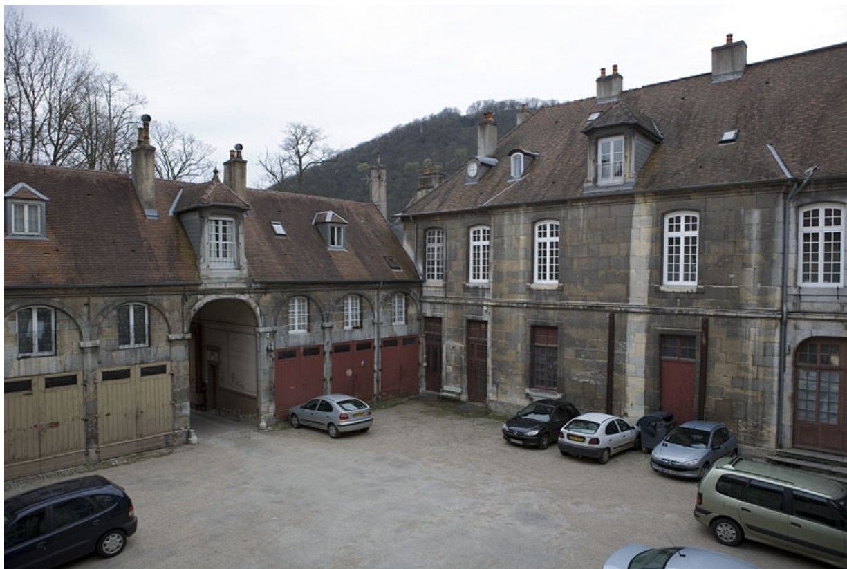
Vue d'ensemble de l'aile gauche sur cour et du bâtiment sur rue, de trois quarts droit.

25, Besançon, 26 rue Chifflet, lieudit : îlot Banque de France