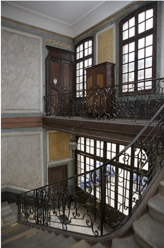
Vue d'ensemble de l'escalier d'honneur.

25, Besançon, 26 rue Chifflet, lieudit : îlot Banque de France