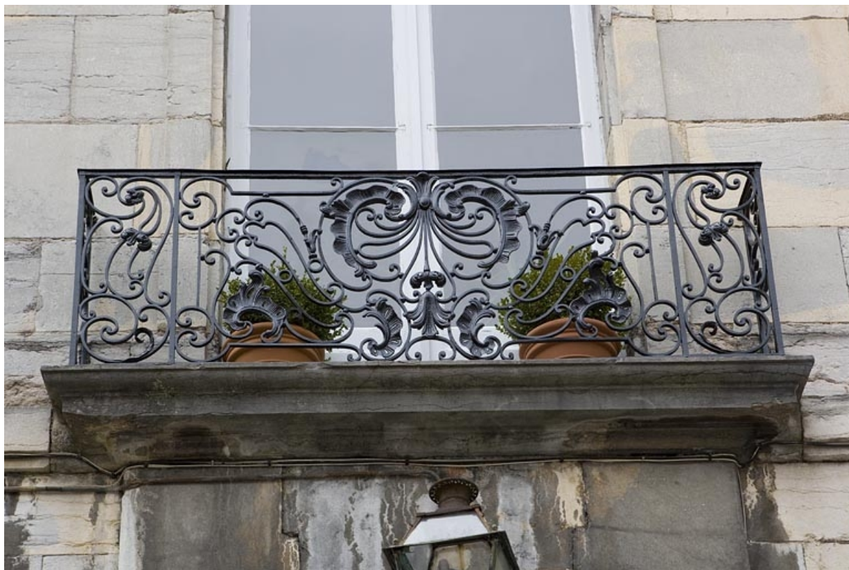
Détail du balcon en ferronnerie sur la façade sur cour du logis principal.

25, Besançon, 26 rue Chifflet, lieudit : îlot Banque de France