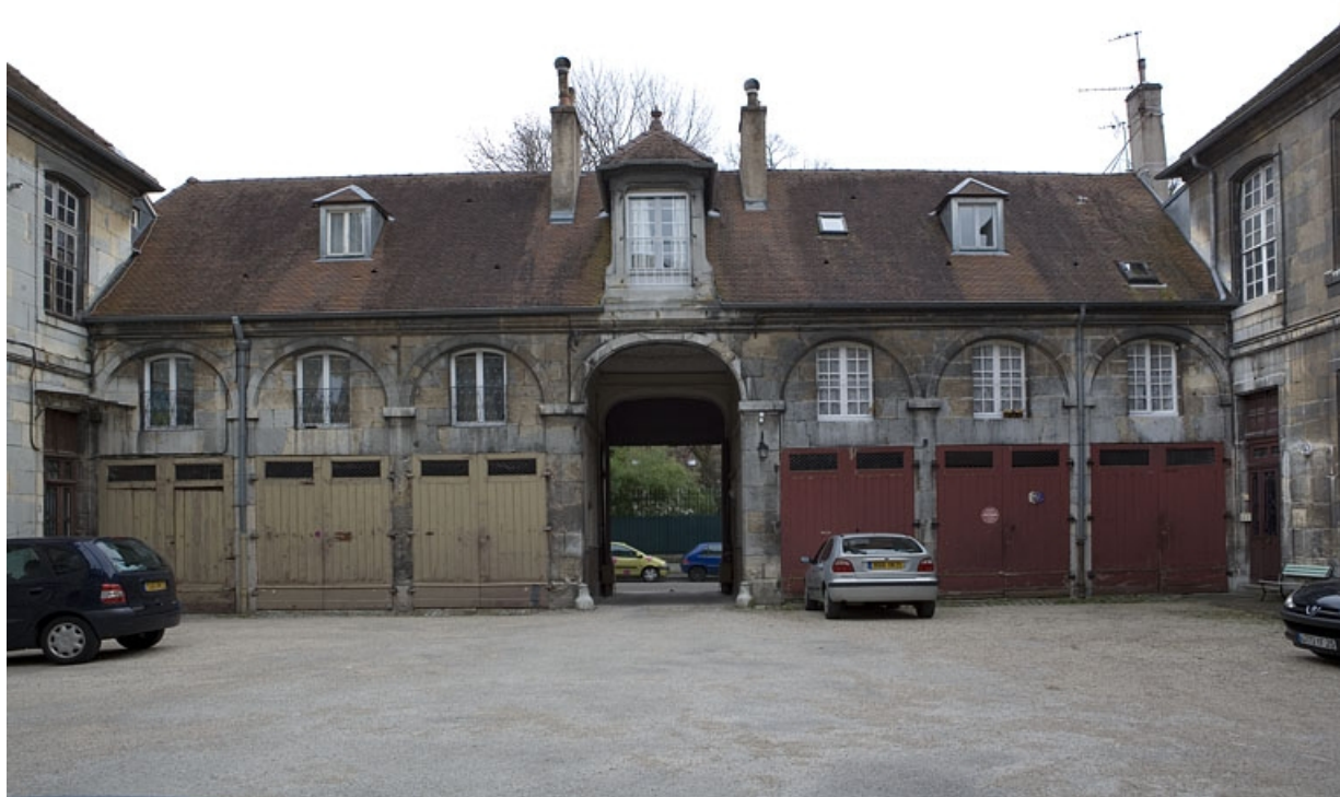
Vue d'ensemble du bâtiment des remises et des écuries bordant la rue depuis le fond de la cour.

25, Besançon, 26 rue Chifflet, lieudit : îlot Banque de France