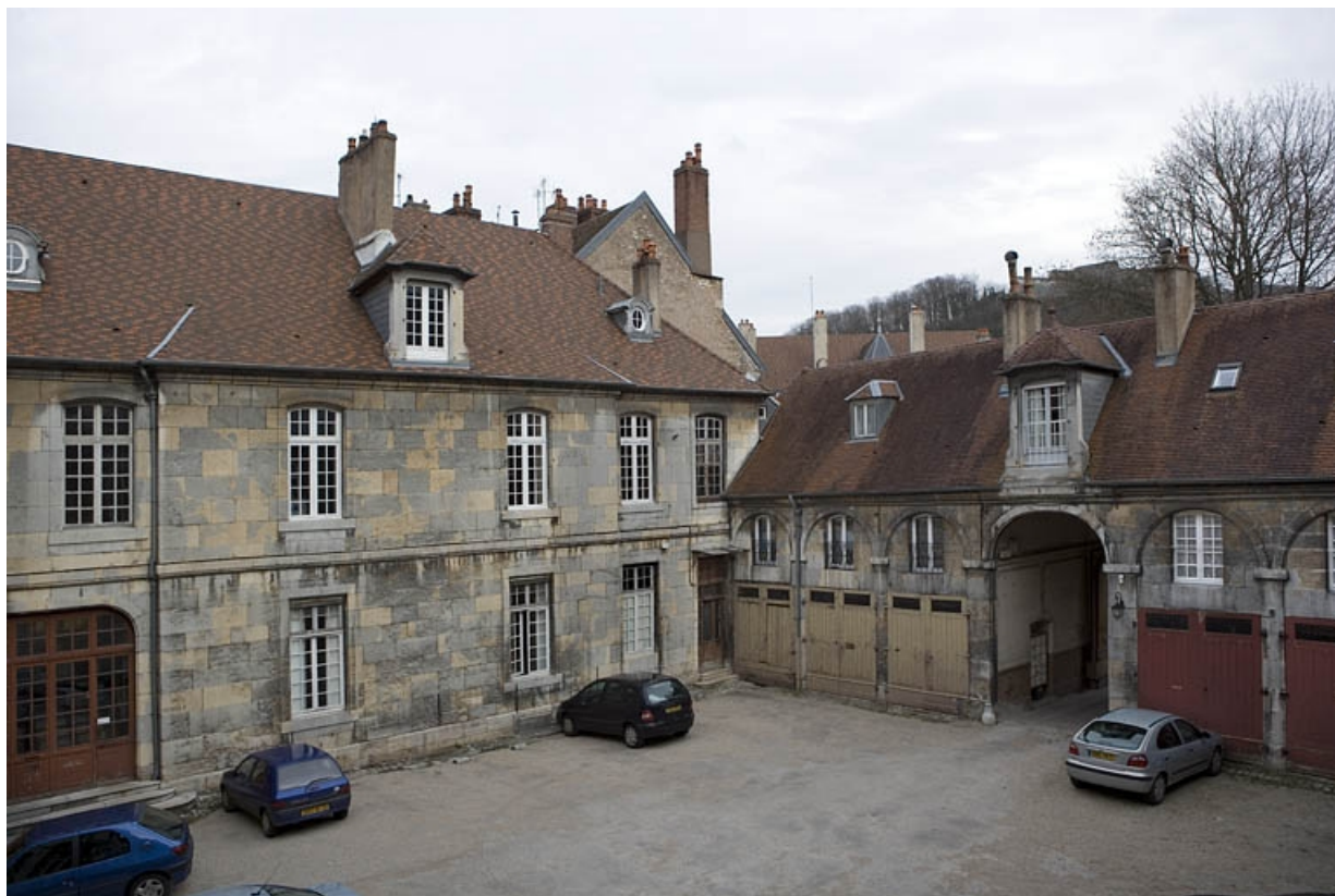
Vue d'ensemble de l'aile droite sur cour et du bâtiment sur rue, de trois quarts gauche.

25, Besançon, 26 rue Chifflet, lieudit : îlot Banque de France