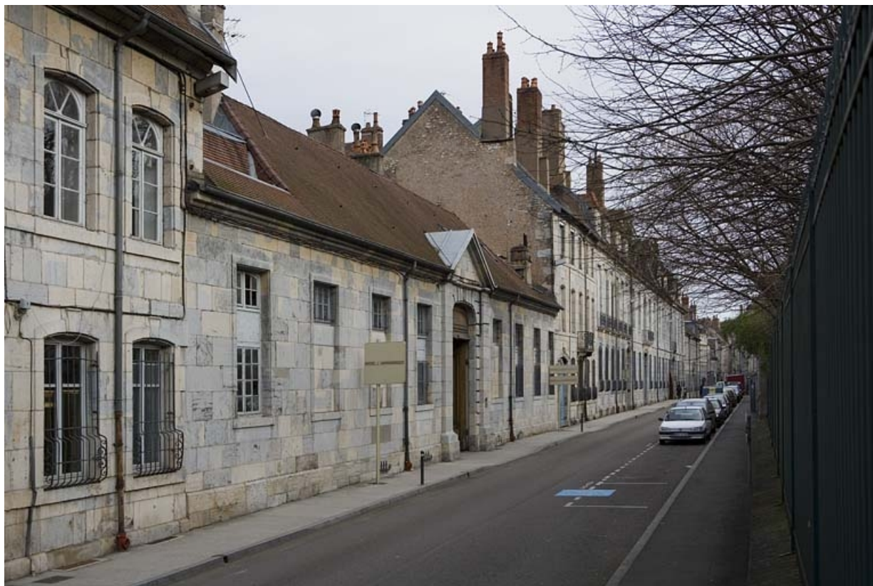
Vue d'ensemble extérieure du bâtiment bordant la rue, de trois quarts gauche.

25, Besançon, 26 rue Chifflet, lieudit : îlot Banque de France