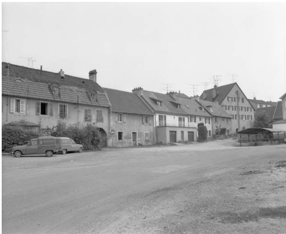
Maison de direction et logements ouvriers au sud de l'usine en 1981.

25, Besançon, 26 rue Chifflet, lieudit : îlot Banque de France