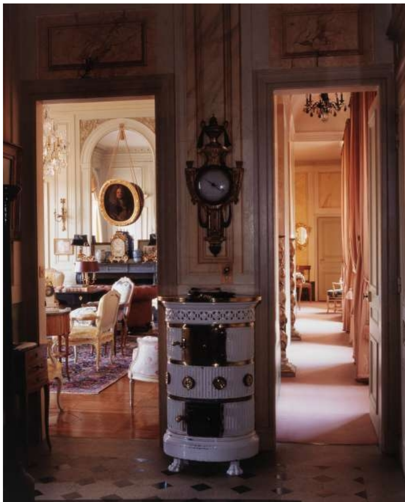
Vue du salon et du couloir depuis le vestibule. 25, Besançon, 3 rue du Lycée, lieudit : îlot Pasteur