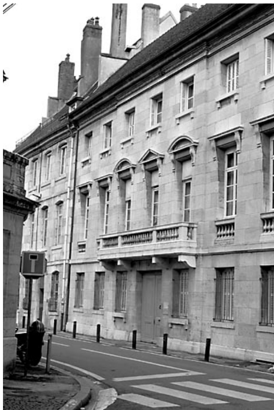
Vue d'ensemble de la façade sur rue, de trois quarts droit : vue rapprochée. 25, Besançon, 3 rue du Lycée, lieudit : îlot Pasteur