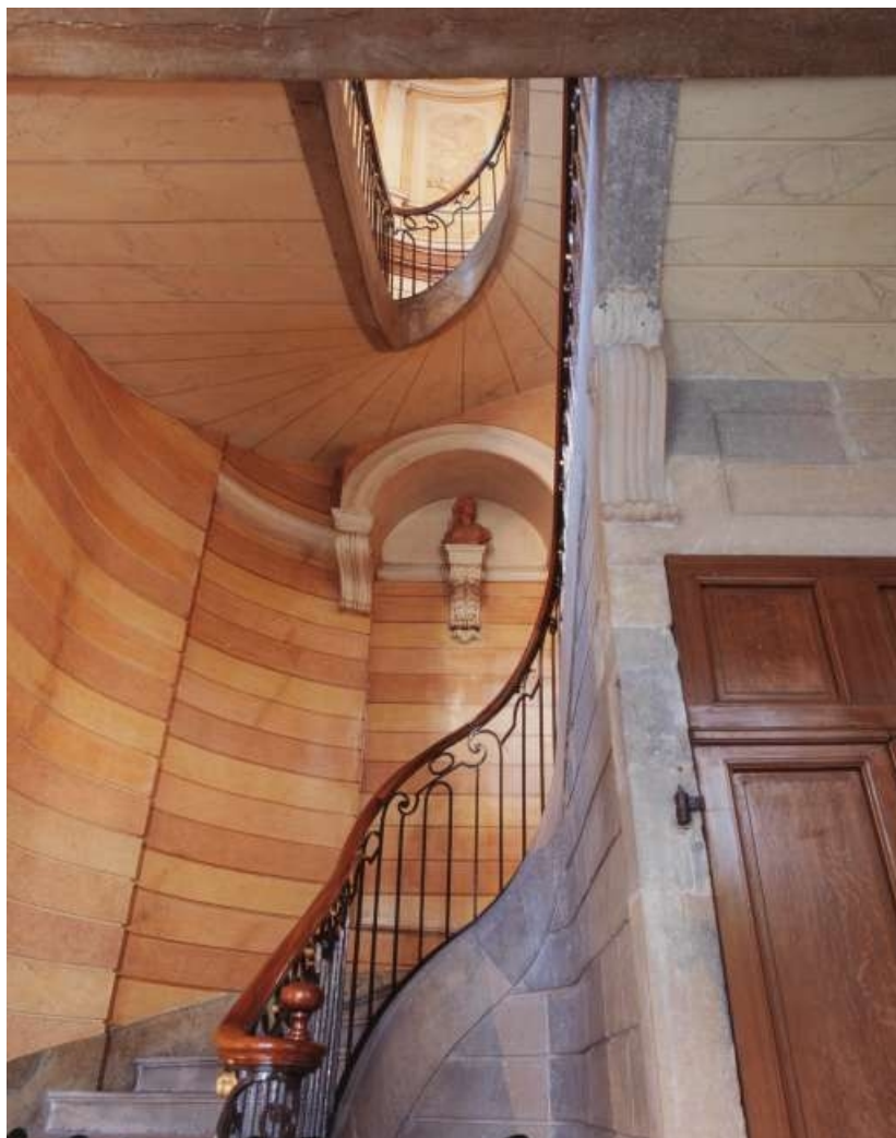
Vue d'ensemble de la cage de l'escalier d'honneur.

25, Besançon, 3 rue du Lycée, lieudit : îlot Pasteur