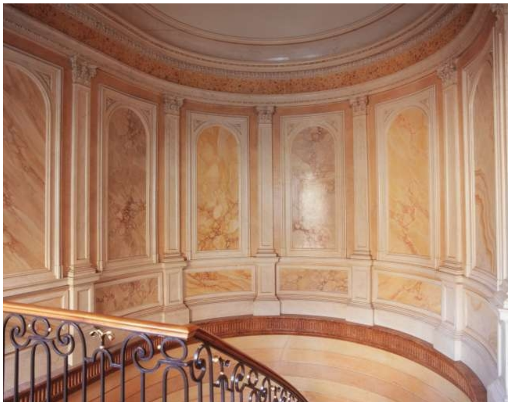
Escalier d'honneur : vue de la cage depuis le deuxième palier.

25, Besançon, 3 rue du Lycée, lieu-dit : îlot Pasteur