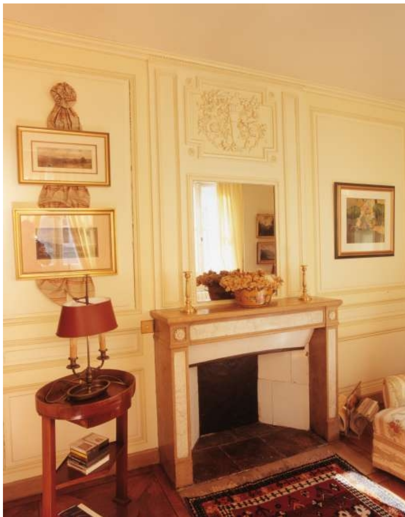
Ancien boudoir de madame : détail de la cheminée.

25, Besançon, 3 rue du Lycée, lieudit : îlot Pasteur