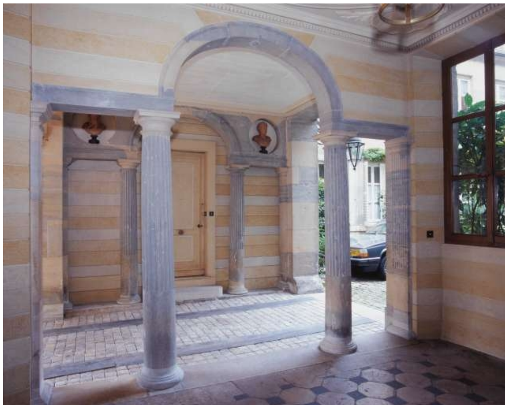
Passage d'entrée : détail de la partie gauche depuis le vestibule droit, de trois quarts droit. 25, Besançon, 3 rue du Lycée, lieudit : îlot Pasteur