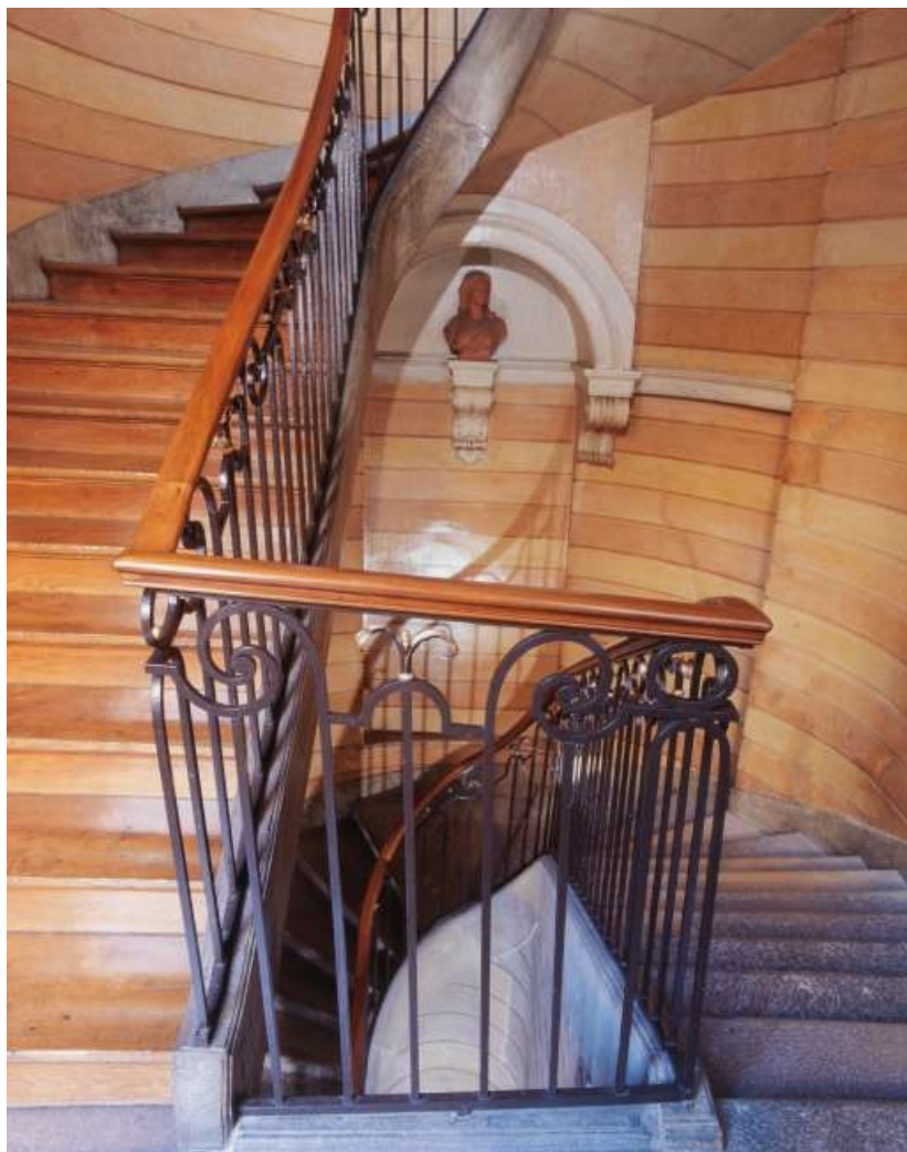
Escalier d'honneur : vue d'ensemble depuis le premier palier.

25, Besançon, 3 rue du Lycée, lieudit : îlot Pasteur