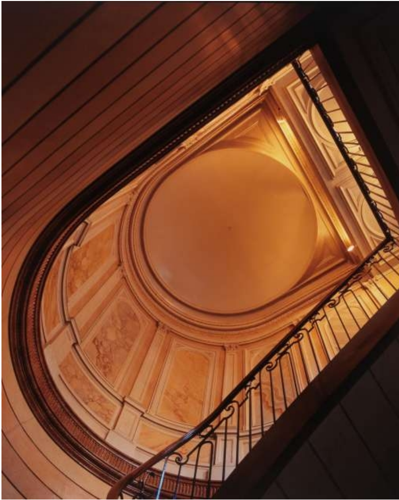
Escalier d'honneur : vue de la cage depuis le premier palier.

25, Besançon, 3 rue du Lycée, lieudit : îlot Pasteur