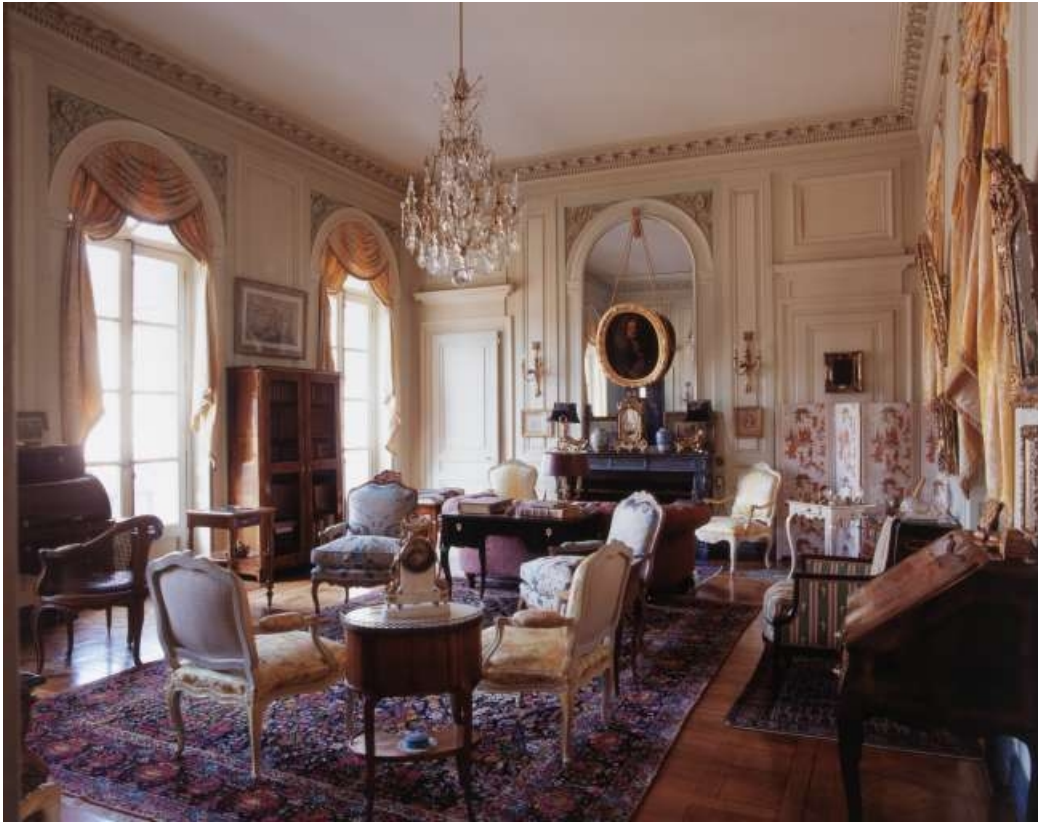
Vue d'ensemble du salon depuis l'entrée.

25, Besançon, 3 rue du Lycée, lieudit : îlot Pasteur