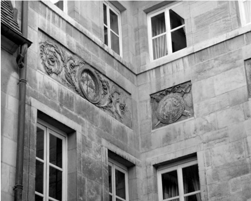
Façade sur cour : détail des décors de la partie gauche.

25, Besançon, 3 rue du Lycée, lieudit : îlot Pasteur