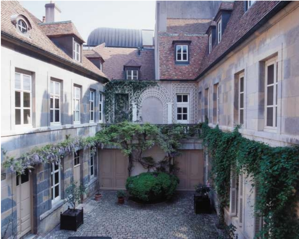
Vue d'ensemble de la cour depuis le logis sur rue.

25, Besançon, 3 rue du Lycée, lieudit : îlot Pasteur