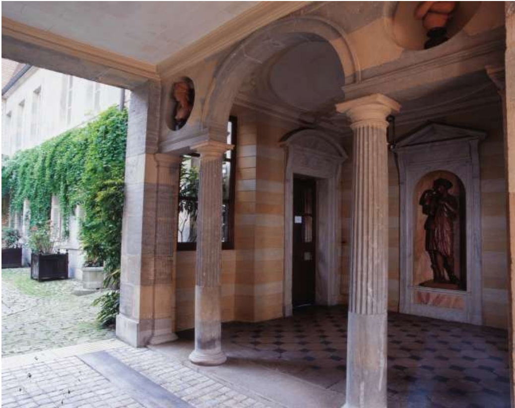
Passage d'entrée : détail de la partie droite.

25, Besançon, 3 rue du Lycée, lieudit : îlot Pasteur