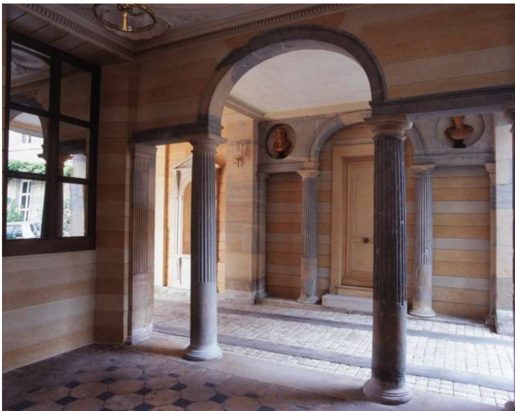
Passage d'entrée : détail de la partie gauche depuis le vestibule droit.

25, Besançon, 3 rue du Lycée, lieudit : îlot Pasteur