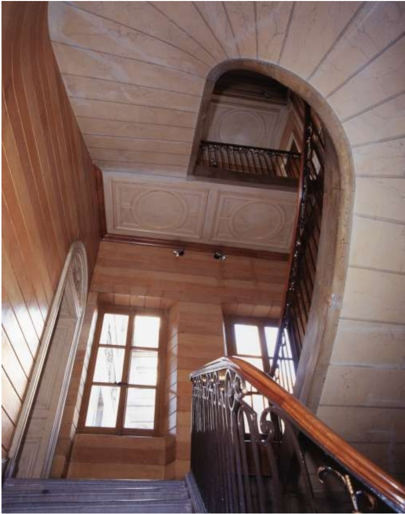
Vue d'ensemble de la cage de l'escalier d'honneur depuis le premier repos. 25, Besançon, 3 rue du Lycée, lieudit : îlot Pasteur