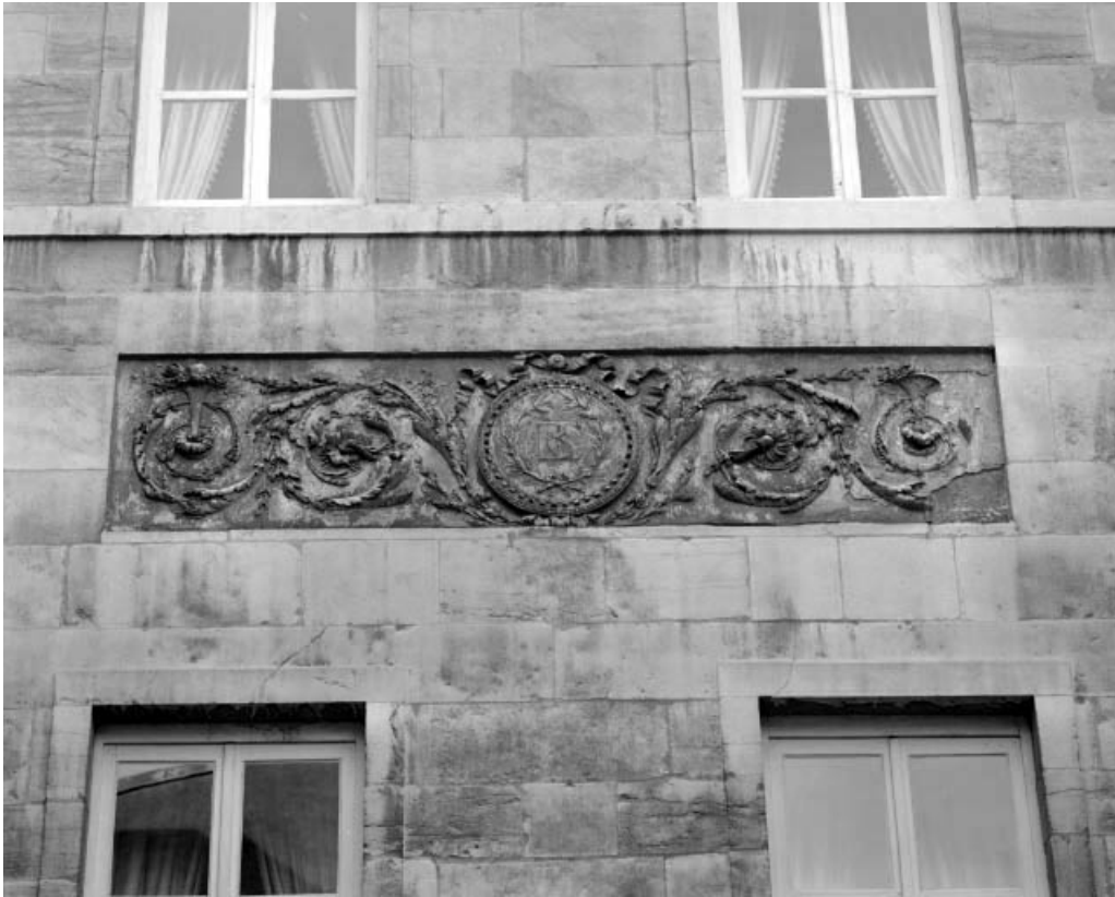
Façade sur cour : détail des décors de la partie centrale.

25, Besançon, 3 rue du Lycée, lieudit : îlot Pasteur