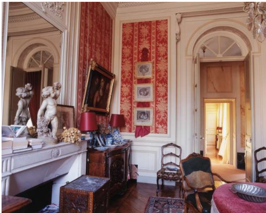
Vue d'ensemble de l'ancienne chambre à coucher de madame, de face.

25, Besançon, 3 rue du Lycée, lieudit : îlot Pasteur