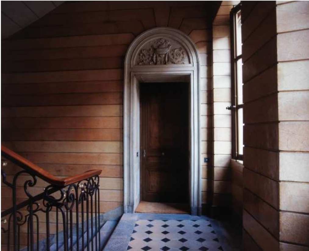
Escalier d'honneur : porte d'entrée gauche sur le premier palier.

25, Besançon, 3 rue du Lycée, lieudit : îlot Pasteur