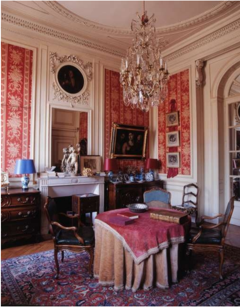
Vue d'ensemble de l'ancienne chambre à coucher de madame, depuis l'entrée. 25, Besançon, 3 rue du Lycée, lieudit : îlot Pasteur