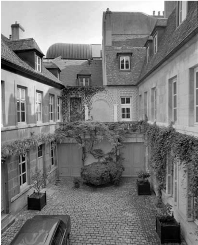
Vue d'ensemble de la cour depuis le logis principal.

25, Besançon, 3 rue du Lycée, lieudit : îlot Pasteur