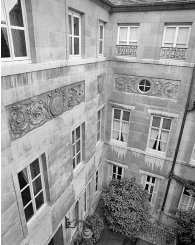
Façade sur cour depuis l'avant-corps gauche. 25, Besançon, 3 rue du Lycée, lieudit : îlot Pasteur