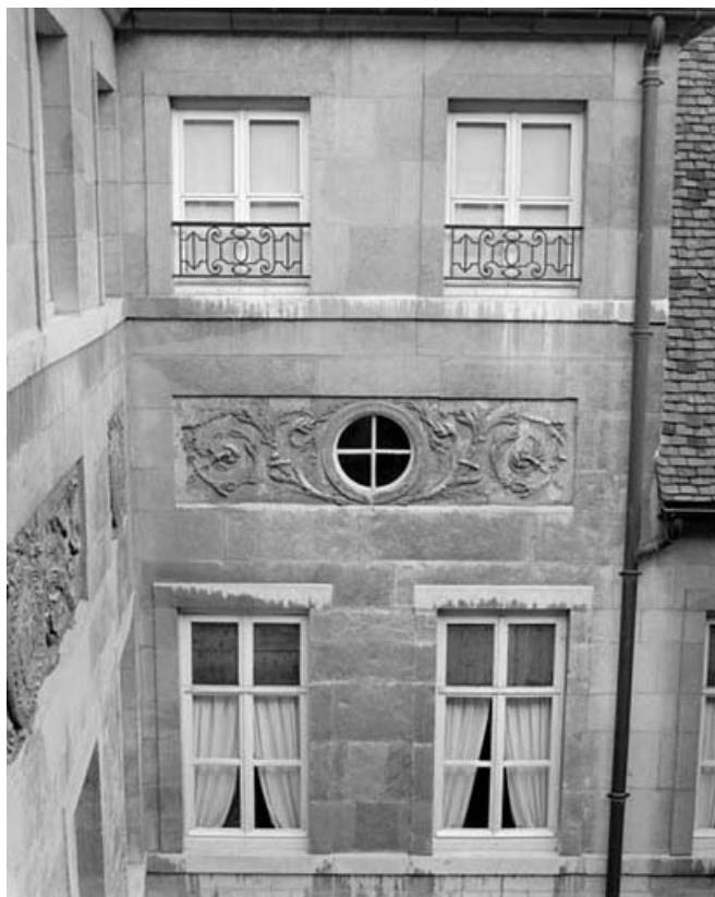
Façade sur cour : détail des décors de l'avant-corps droit.

25, Besançon, 3 rue du Lycée, lieudit : îlot Pasteur