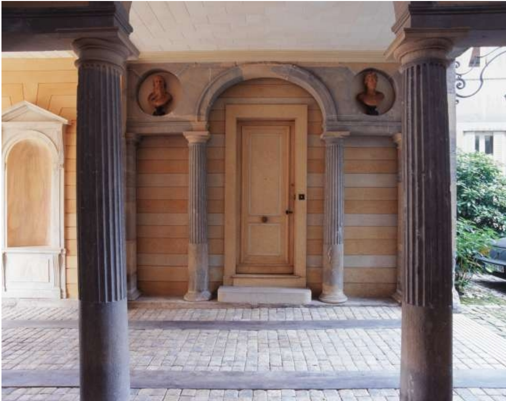
Passage d'entrée : détail de la partie gauche depuis le vestibule droit, de face. 25, Besançon, 3 rue du Lycée, lieudit : îlot Pasteur