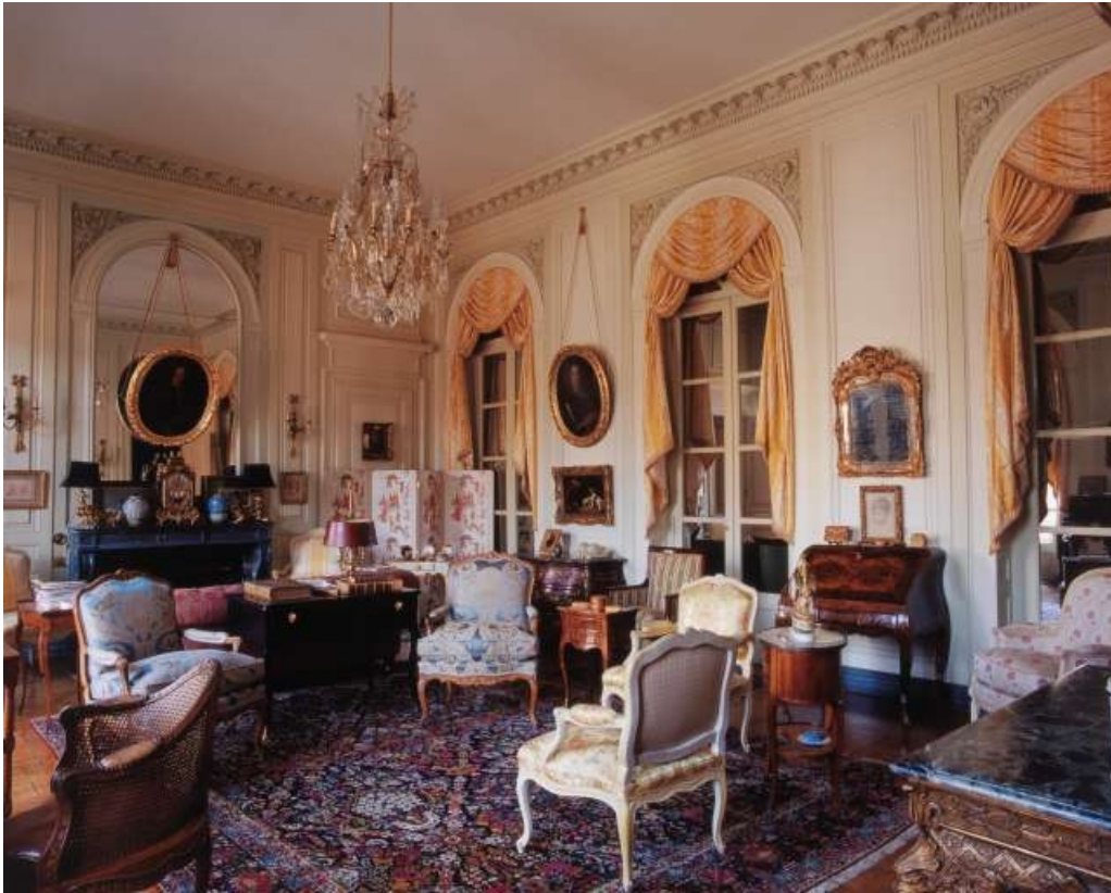
Vue d'ensemble du salon de trois quarts gauche.

25, Besançon, 3 rue du Lycée, lieudit : îlot Pasteur