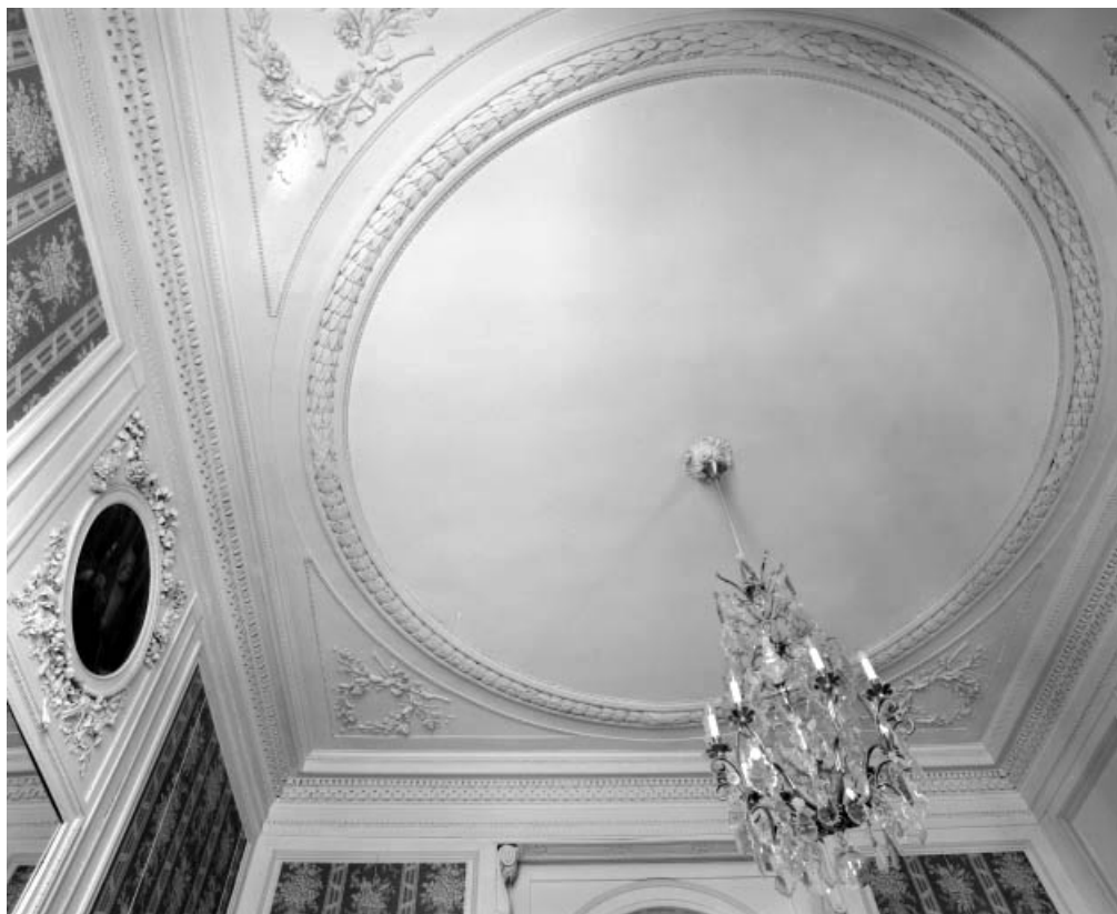
Vue d'ensemble du plafond de l'ancienne chambre à coucher de madame.

25, Besançon, 3 rue du Lycée, lieudit : îlot Pasteur