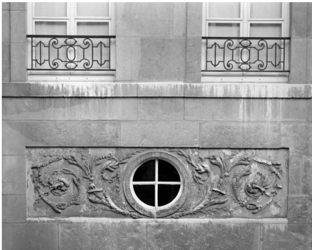
Façade sur cour : détail des décors de l'avant-corps droit.

25, Besançon, 3 rue du Lycée, lieudit : îlot Pasteur