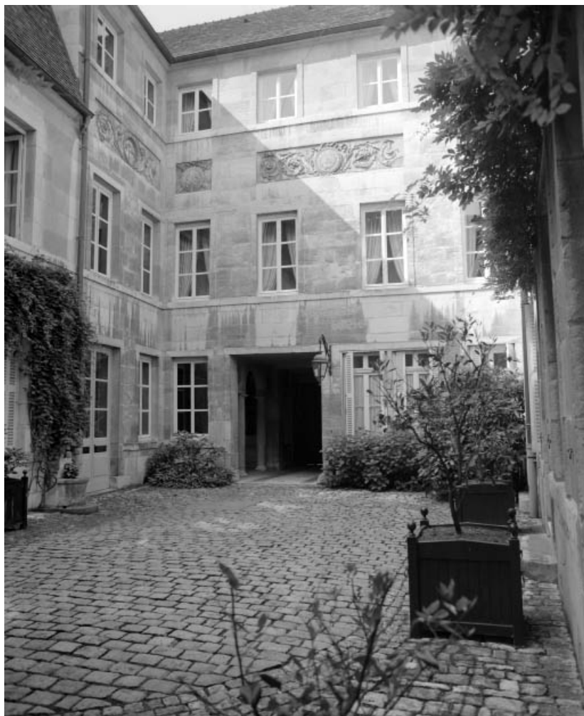
Vue d'ensemble la façade postérieure du logis principal.

25, Besançon, 3 rue du Lycée, lieudit : îlot Pasteur