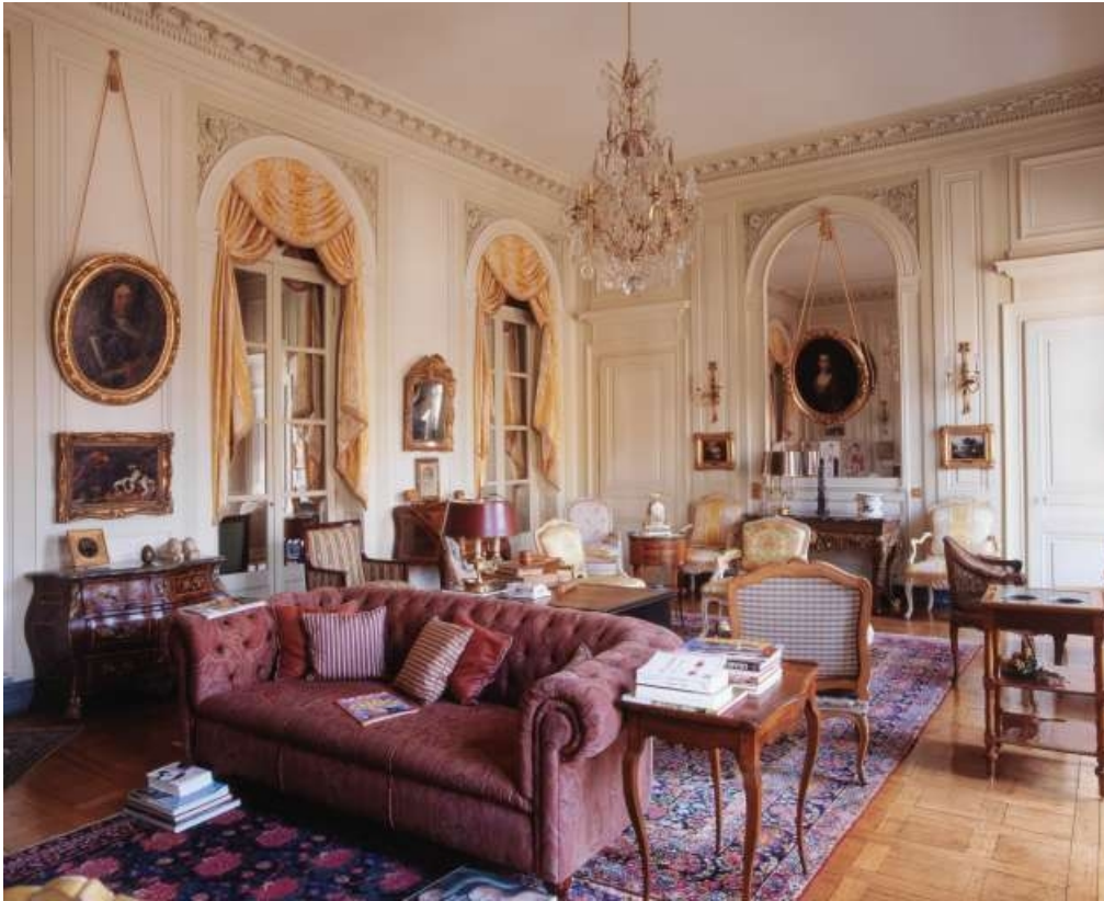
Vue d'ensemble du salon depuis le fond de la pièce.

25, Besançon, 3 rue du Lycée, lieudit : îlot Pasteur