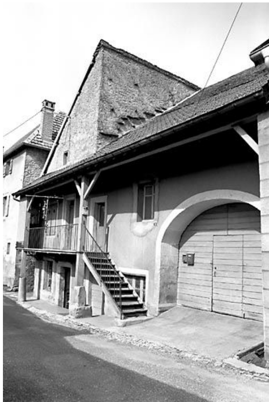
Façade antérieure de trois quarts droit.