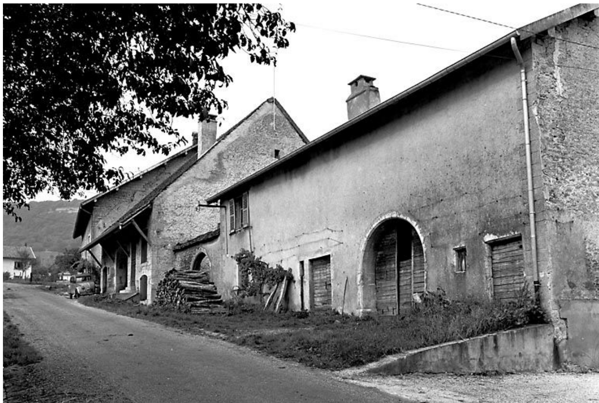
Façade antérieure vue de trois quarts droit. 25, Scey-Maisières